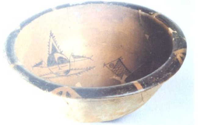
新石器时代人面鱼纹彩陶盆（西安半坡博物馆）