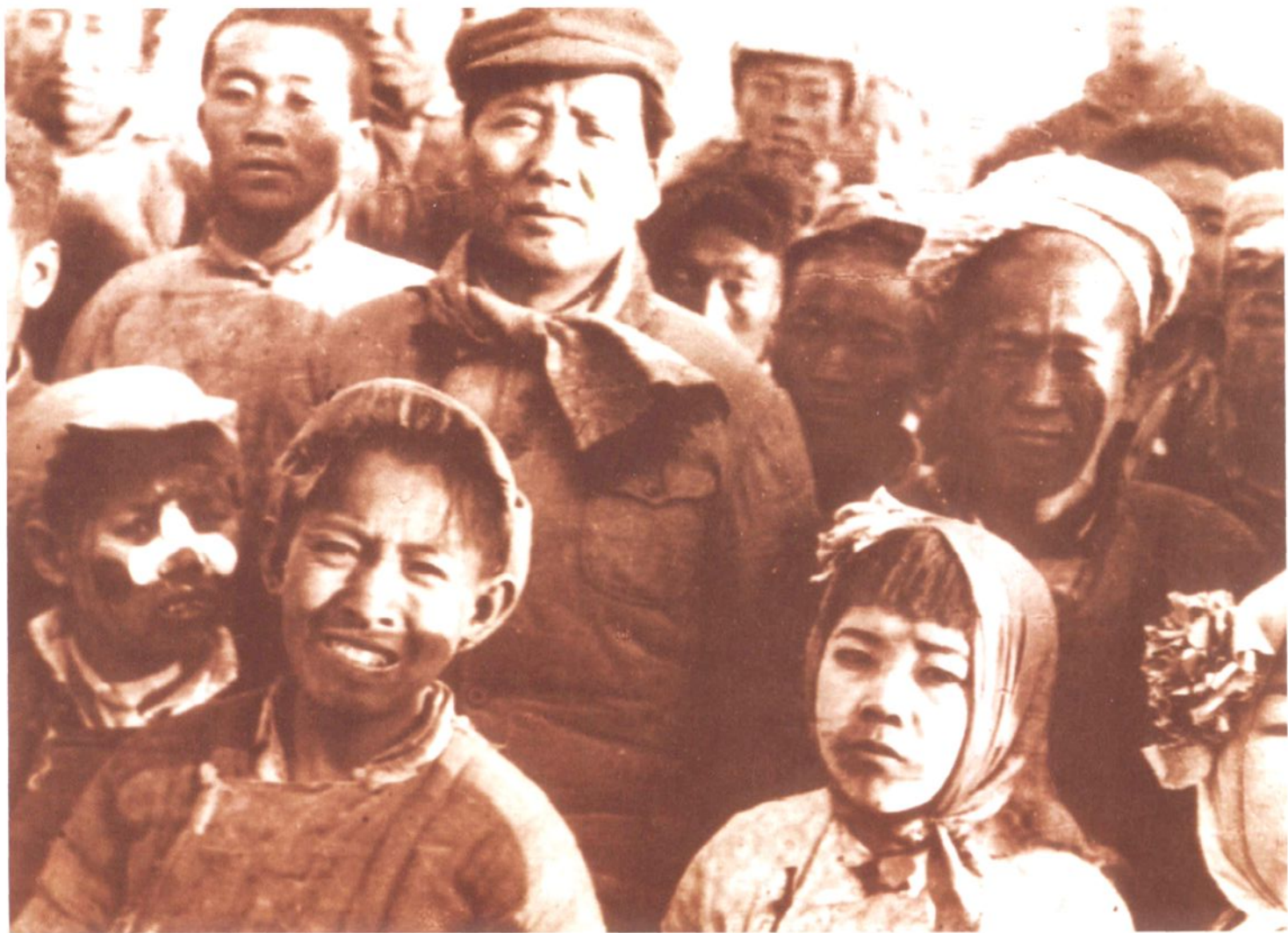
1945年春节陕甘宁边区劳动模范杨步浩率延安六乡秧歌队给毛泽东主席拜年合影