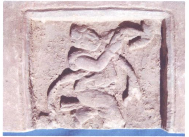
陕北秧歌舞砖雕（延安地区文物管理委员会） 1983年甘泉县雨岔乡宋金墓出土