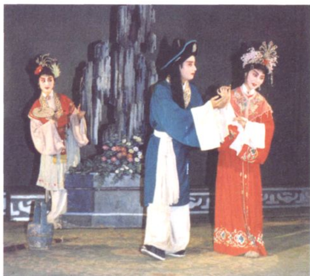
秦腔《火焰驹·花园》剧照