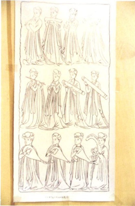
三原唐李寿石椁线刻石乐舞图（三原县博物馆） 1973年出土