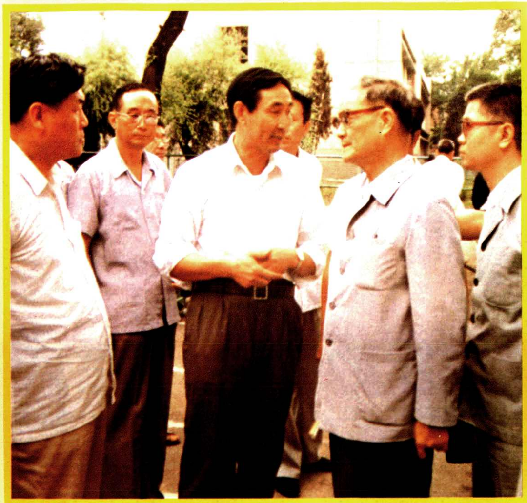
1986年，国务委员兼国家计委主任（现中共中央政治局常委、中组部部长）宋平在佳联厂视察