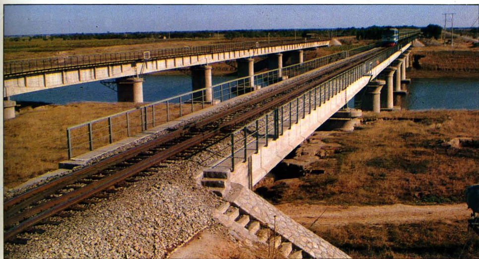
1966年建成的津 浦线子牙河桥。