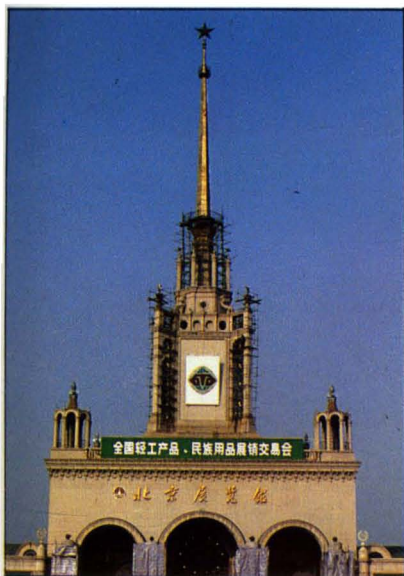
1954年，工厂承担制造并安装北京展览馆镏金铁塔和顶端红五星。