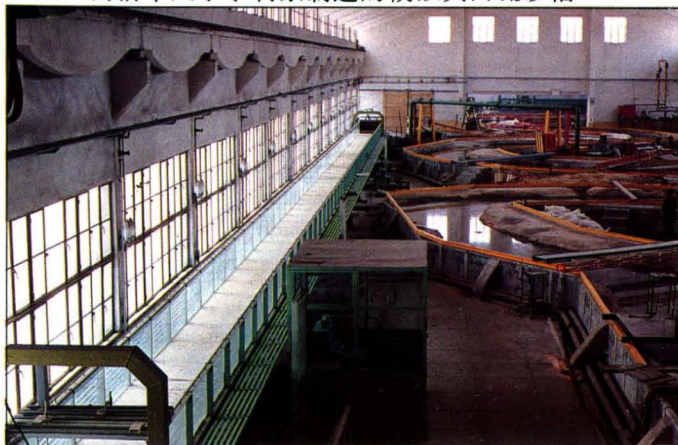
工厂为清华大学水利系制造的模拟黄河疏砂槽。