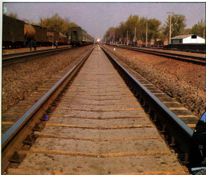
铺设在京山线上的预应力混凝土宽轨枕。