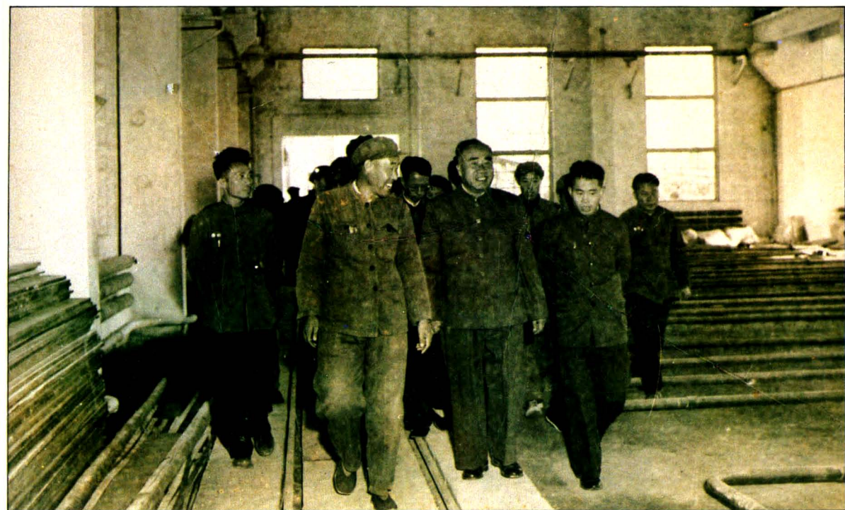
1958年，朱德委员长视察我厂。