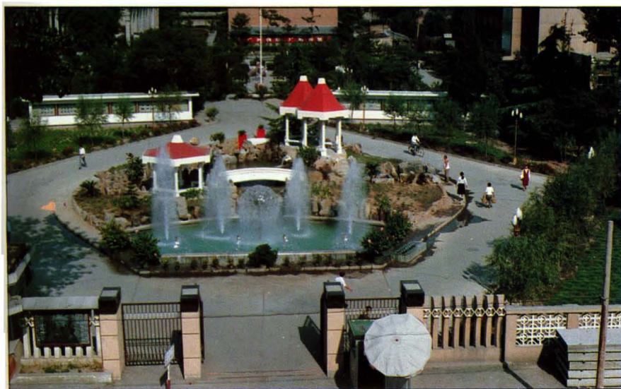
1989年建成的厂前园林小区。