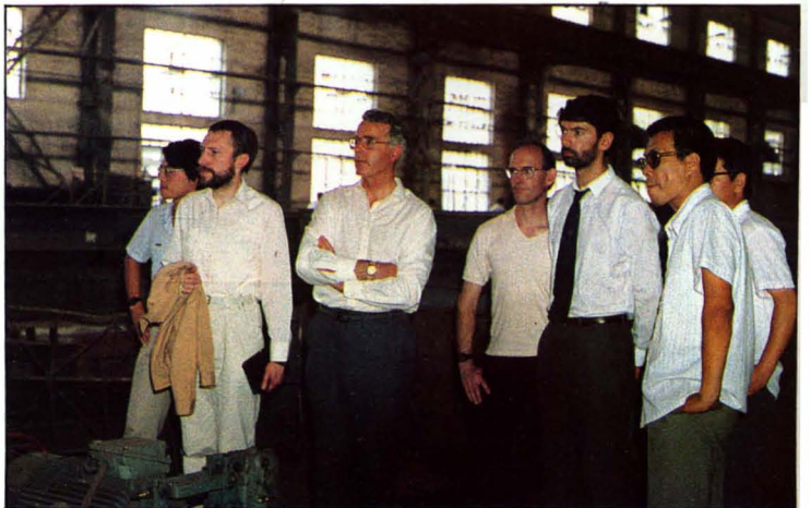
英国洛德技 术中心专家来厂 参观。