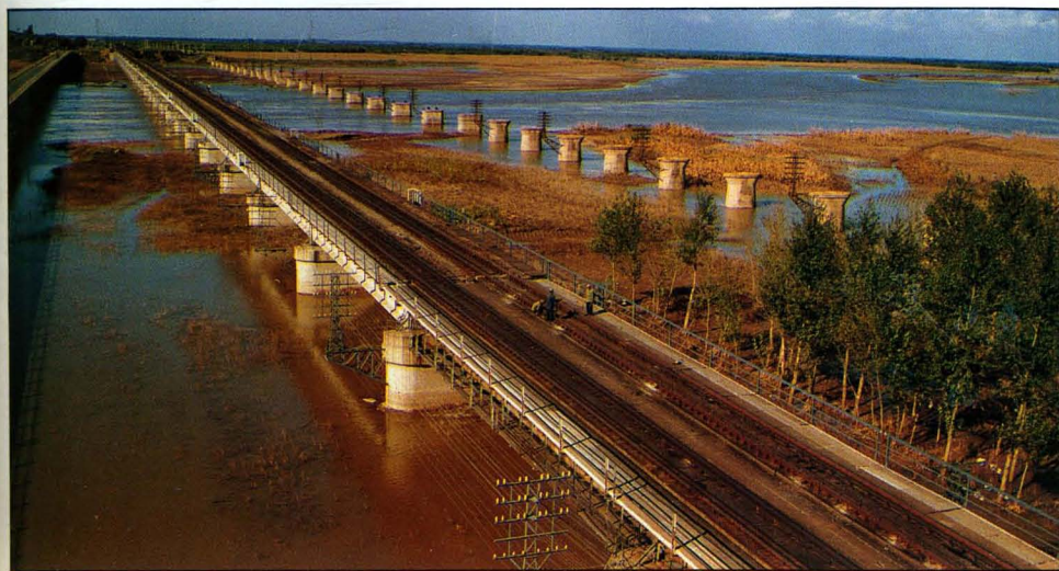
1972年通车的沈 山线巨流河桥，采用 无碴无枕预应力混凝 土箱形梁。