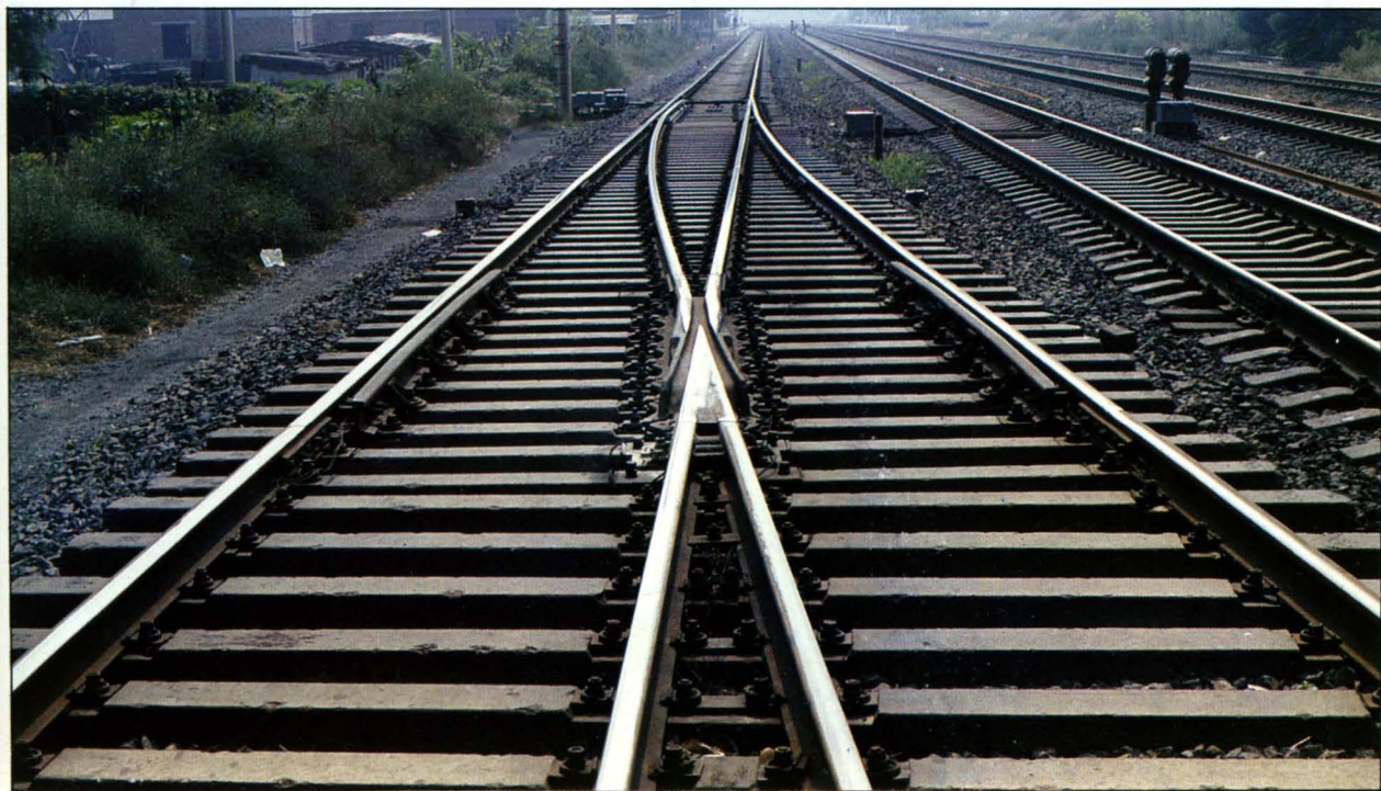
预应力混凝土岔枕。