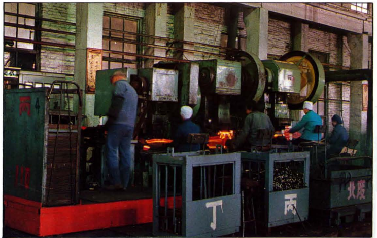
我厂首创的 弹条三次成型工 艺。