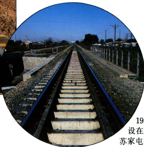
新产品 预应力混 凝土桥枕。 1986年首次铺 设在沈阳工务段 苏家屯桥上。