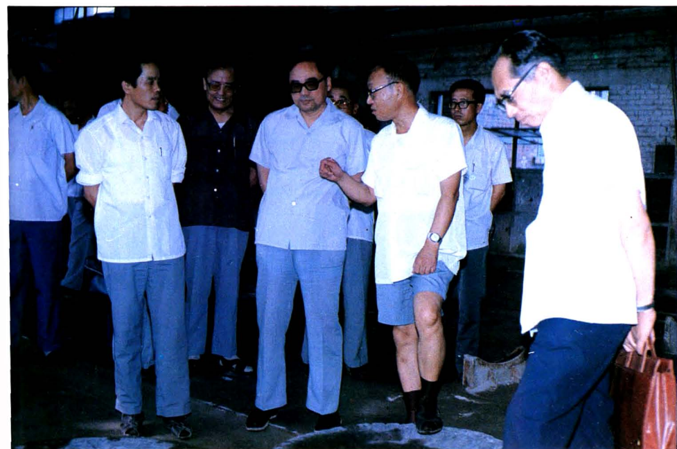
1986年，铁道部部长丁关根来厂视察。