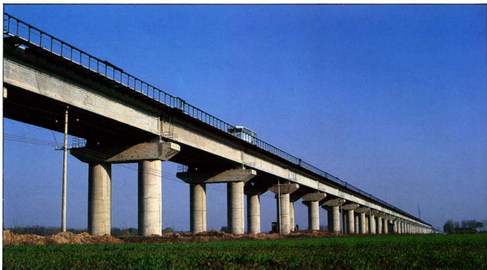
1985年10月通车的新菏线长东黄河桥。