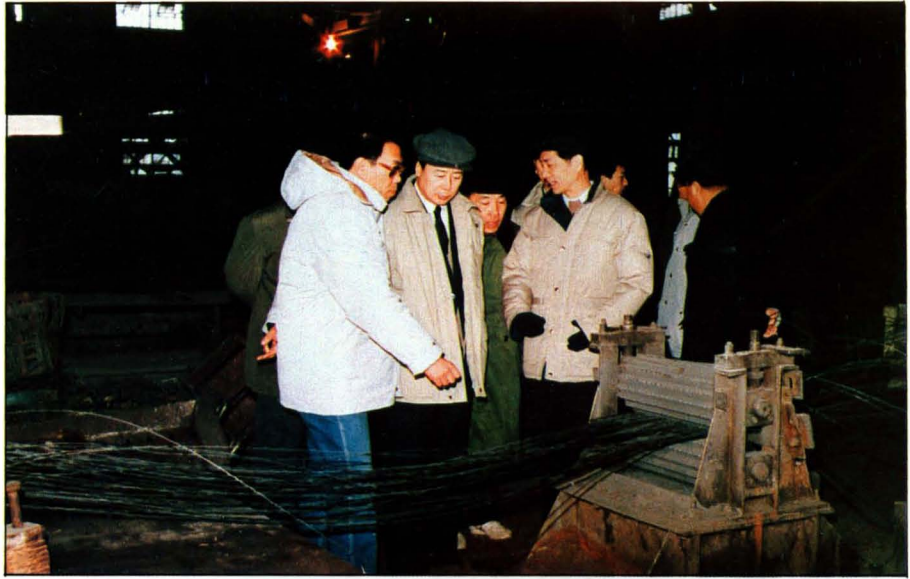
1989年，铁道部副部长孙永福来厂视察。