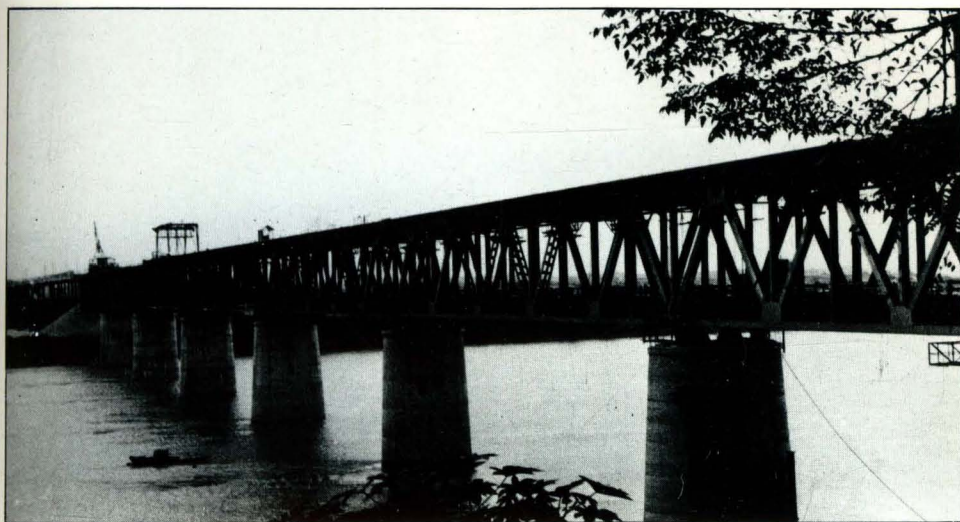
1957年12月29日 通车的湖南衡阳湘江 大桥。