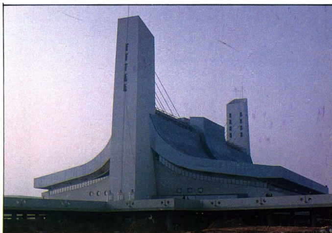
1990年建成的亚运会游泳馆，使用了丰桥厂生产的基础桩。