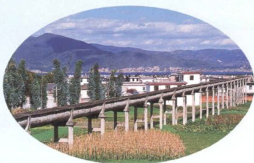
取水站输水主干渠