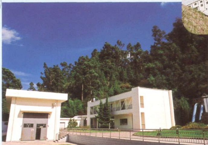
改建后的厂部中控楼（右）和泵房（左）