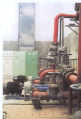
扬程为 250 米的泵房