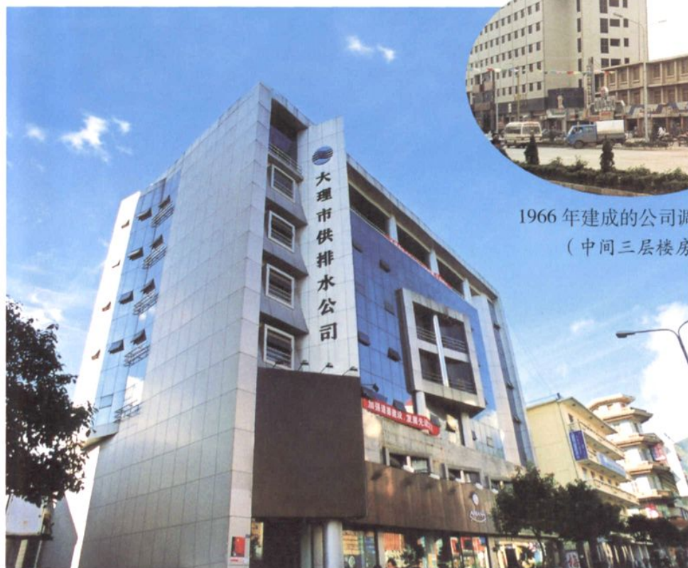
1999 年改建后的公司七层调度大楼