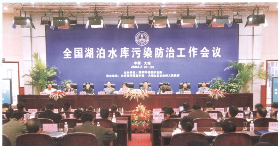
2004年2月18—20日，国家环境保护总局主办的全国湖泊水库污染防治工作会议在下关龙山国际会议中心召开。