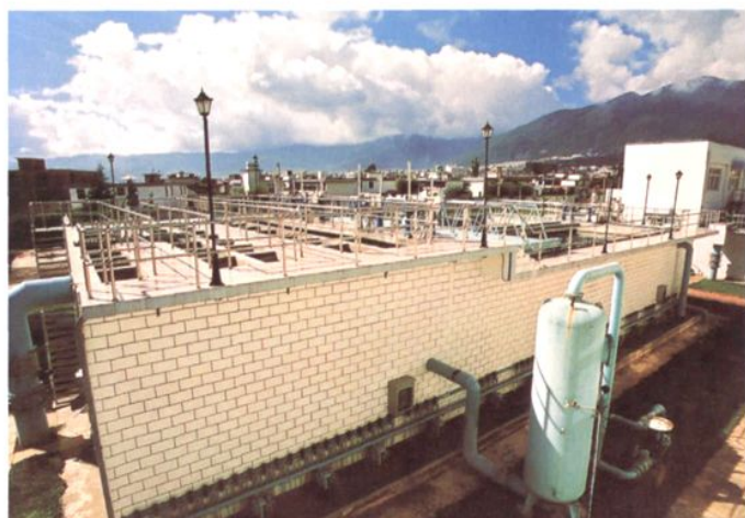
絮凝气浮斜管沉淀池 (底部系德国进口的自动化排泥阀)