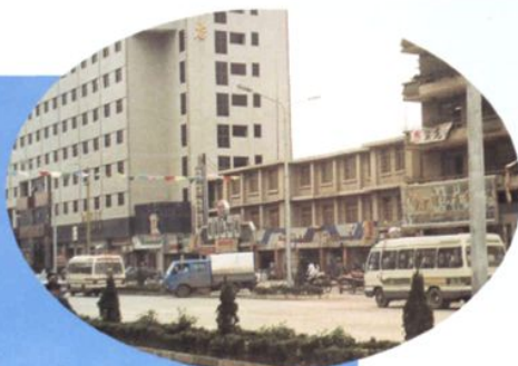
1966 年建成的公司调度大楼 (中间三层楼房)