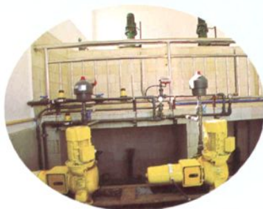
以色列进口的加药计量泵