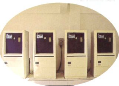
美国进口的加氯设施