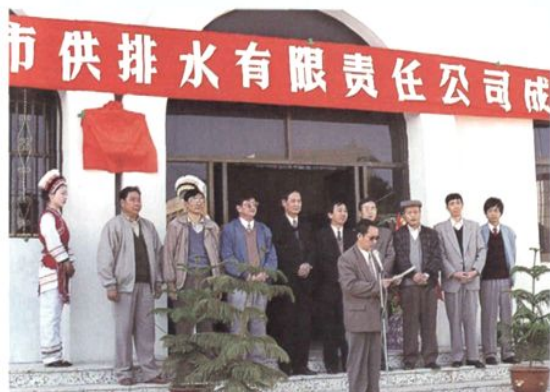
1997 年 3 月大理市供排水有限责任公司成立