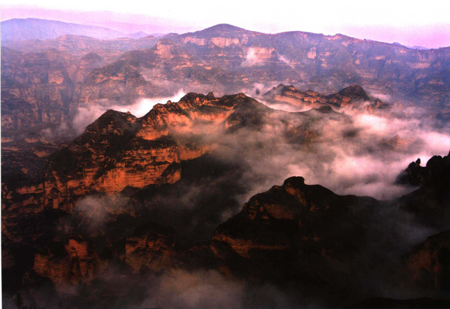
炳灵烟云