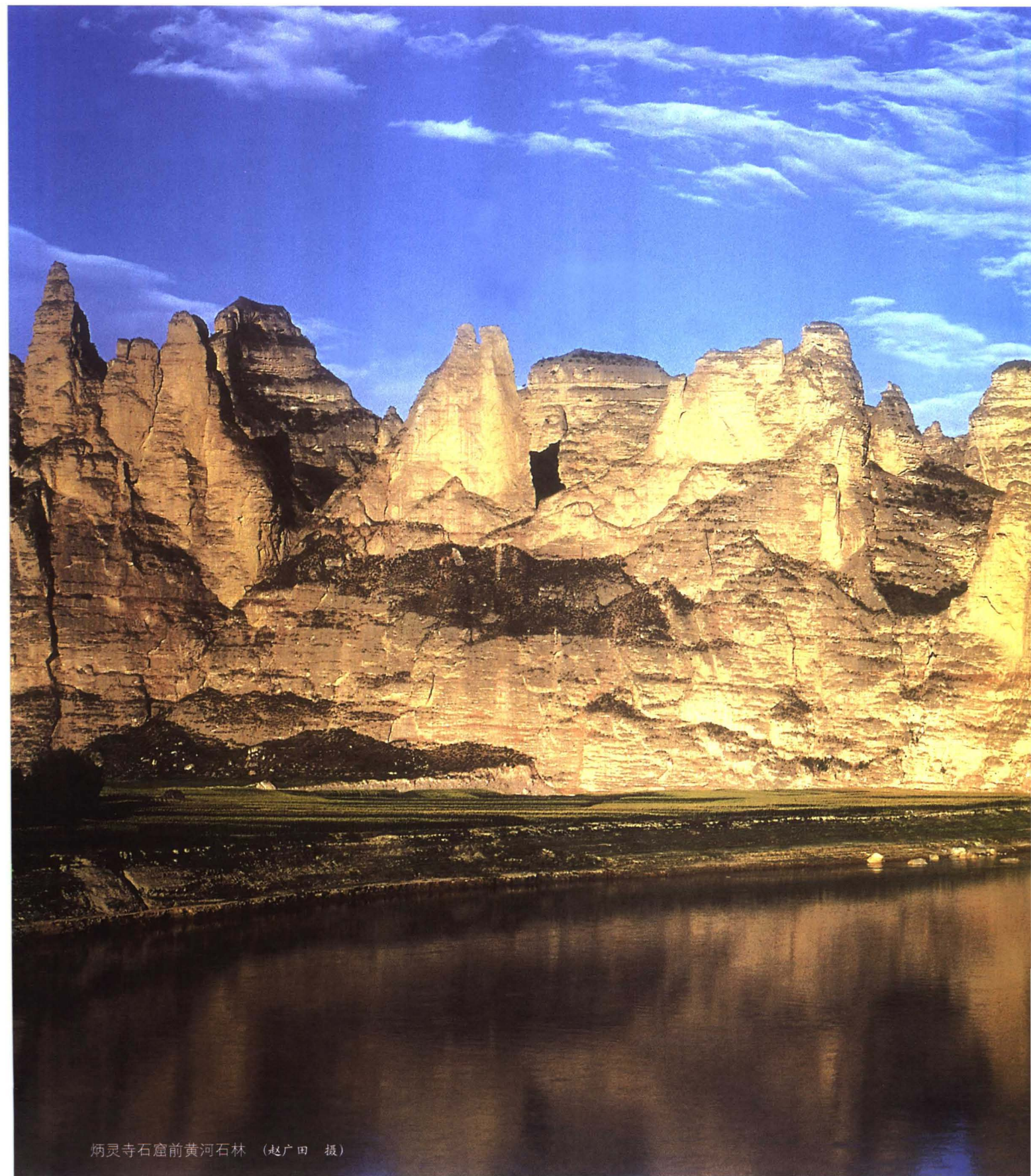
炳灵寺石窟前黄河石林