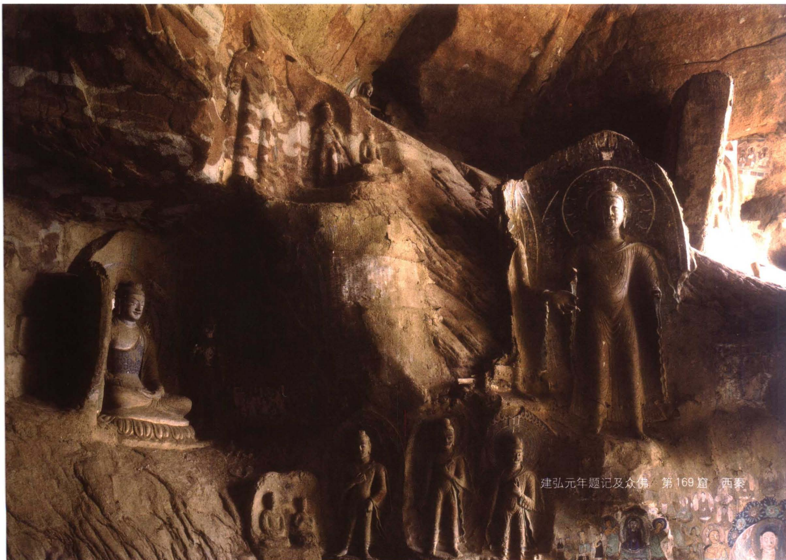
建弘元年题记及众佛 第169窟 西秦

第169窟是一种兼收并蓄、中西荟萃具有独特艺术感染力的佛教艺术，其崭新的创作方式和丰富的艺术内涵，在我国佛教石窟中占有举足轻重的地位。