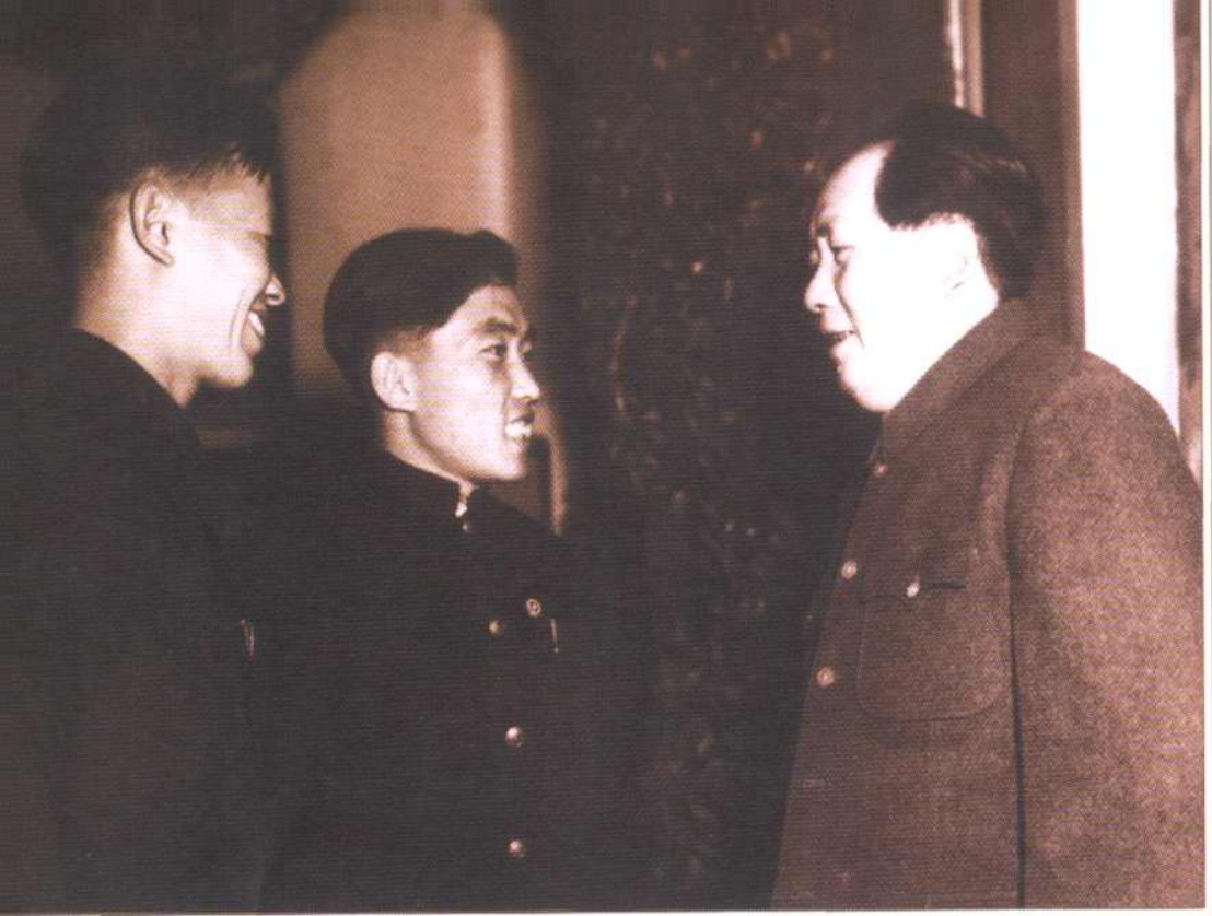
1951年10月，在全国政协一届三次会议上，毛泽东主席亲切接见“毛泽东号”机车组司机长郭树德。毛主席说：“你回去向工人同志们问好！”