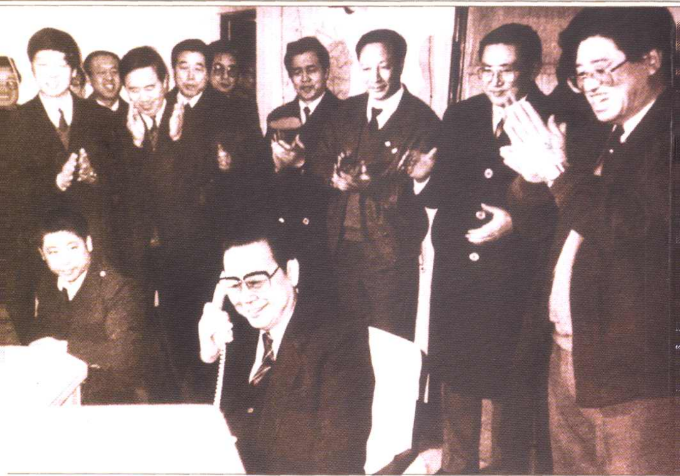
1993年1月22日，（农历壬申年除夕），李鹏总理在铁道部调度指挥台，用无线列车调度电话与正在值乘中的“毛泽东号”第九任司机长王志祥通话，向机车组全体乘务员致节日问候。