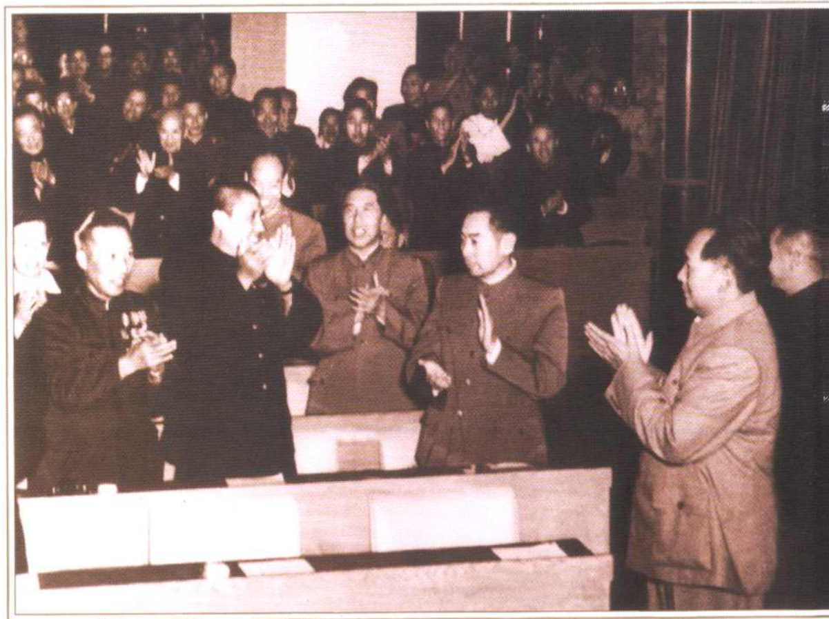
1954年9月25日，毛泽东、周恩来在全国人大一届一次会议上亲切接见包括全国铁路系统第一位全国劳模——原“毛泽东号”机车组第二任司机长李永（左二）在内的会议代表。