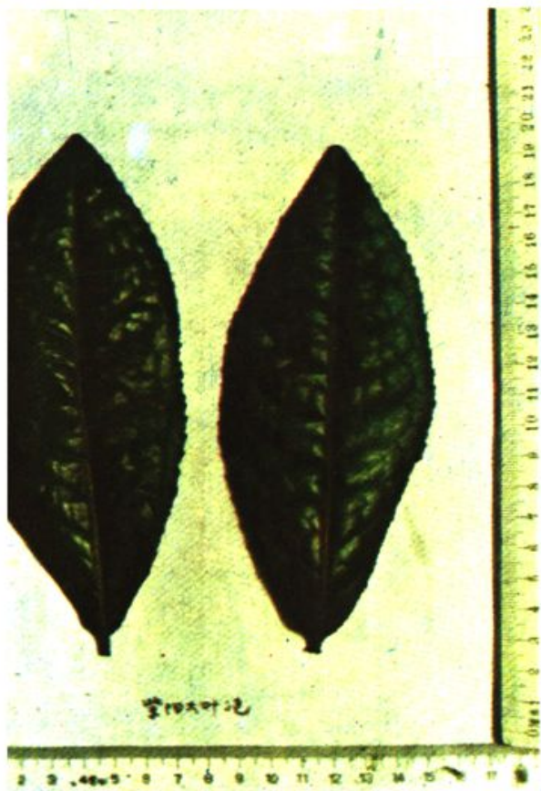
优良品种大叶泡叶片