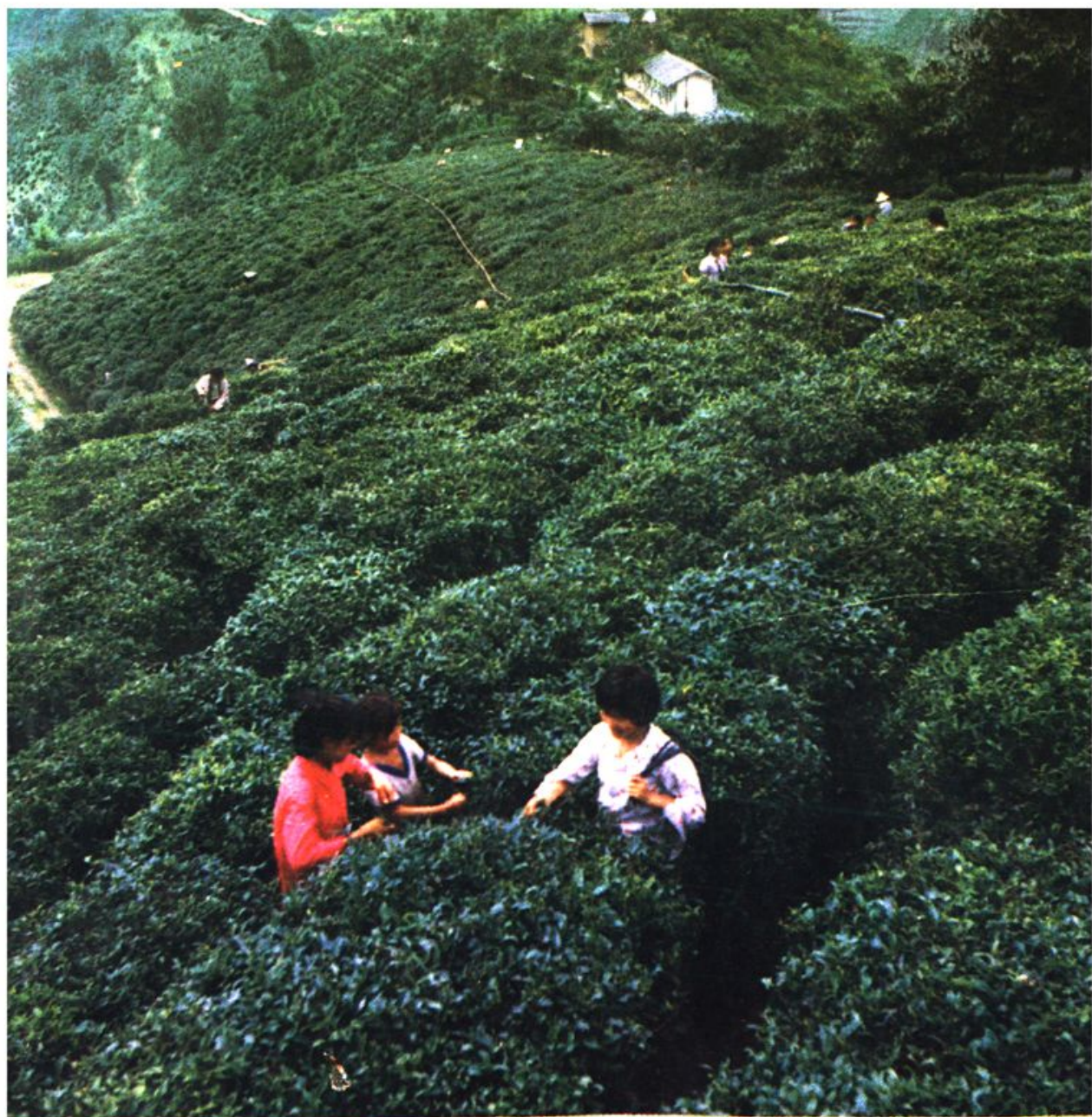
图一 紫阳县茶叶试验站丰产茶园