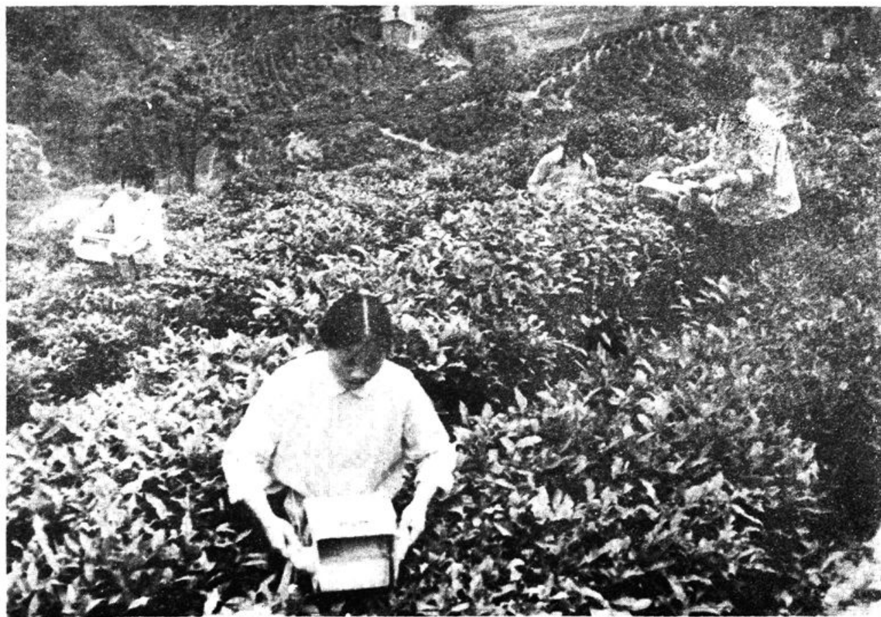
图四 手动式采茶机采茶（紫阳县茶叶试验站）