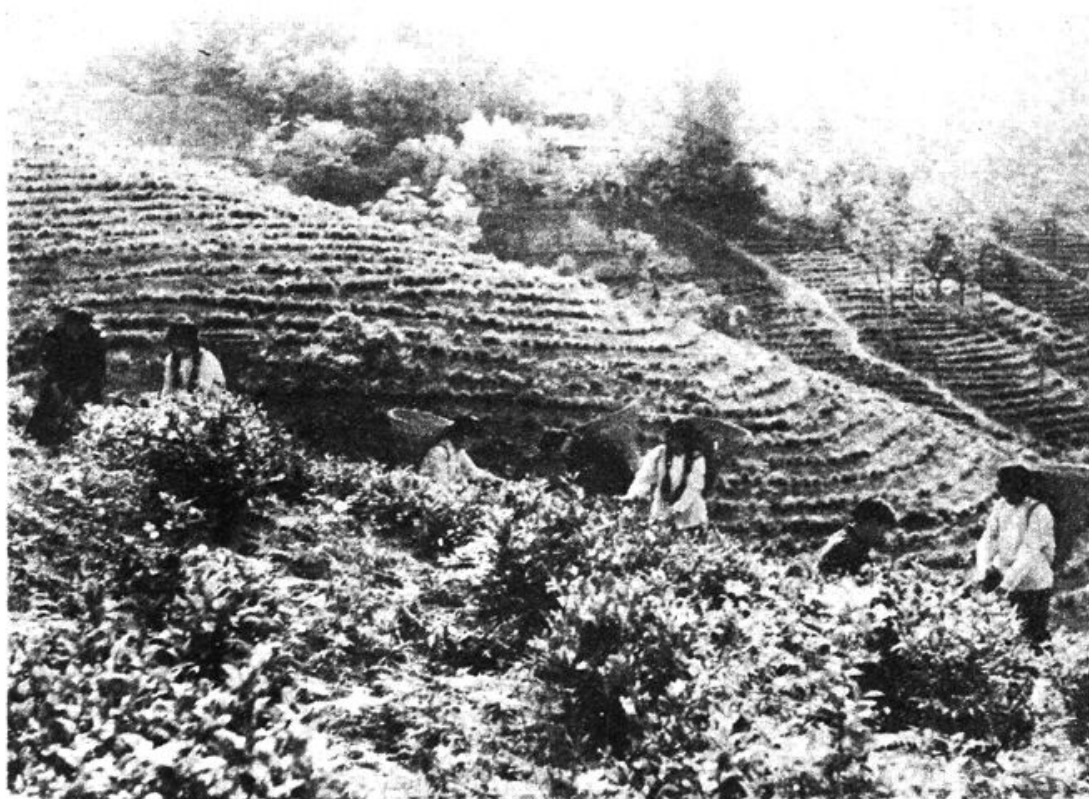
图三 传统采茶方法（高滩望夫寨茶场）