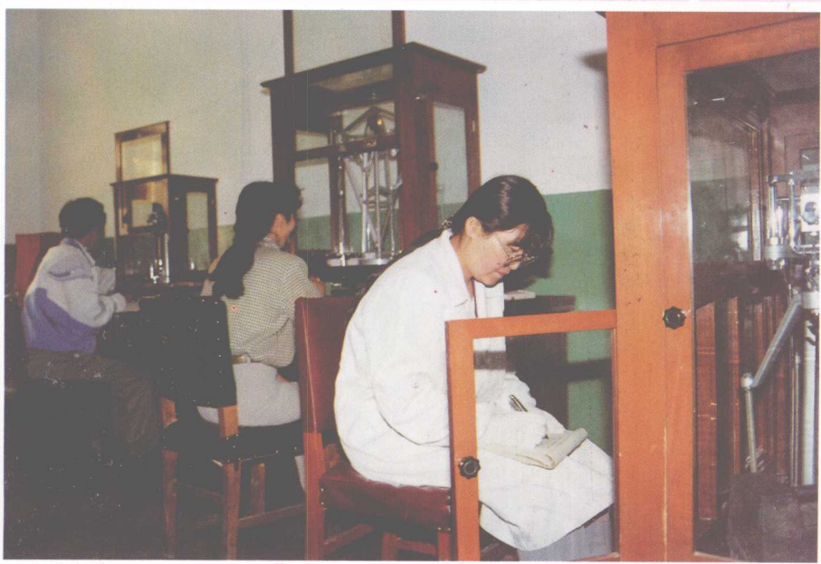
计量人员正在检定衡器