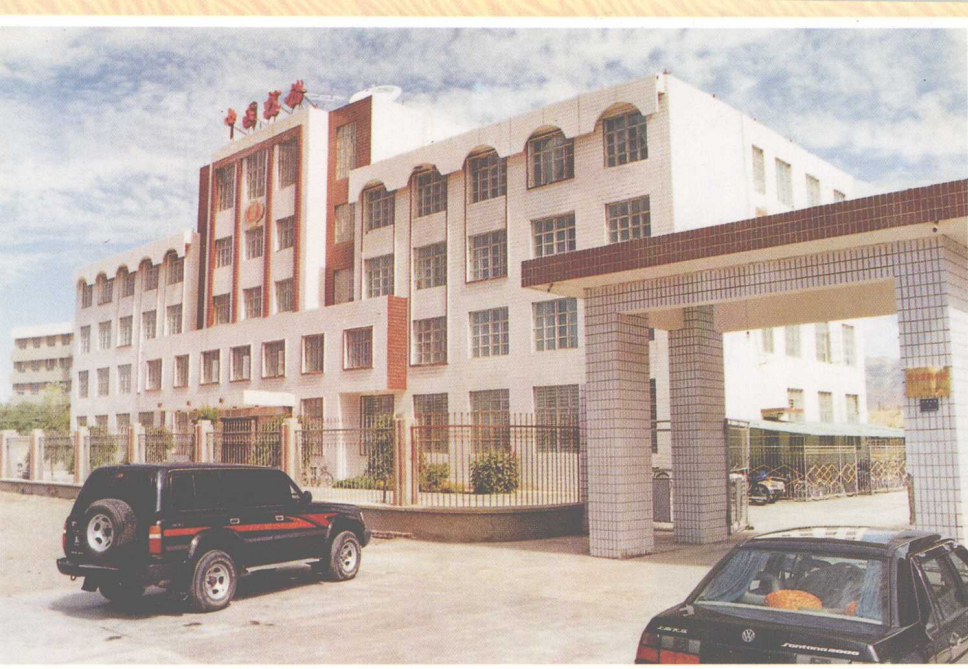
海西州税务局办公楼