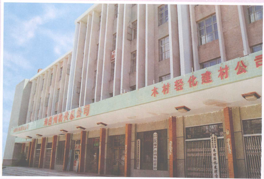
海西州物资总公司办公楼