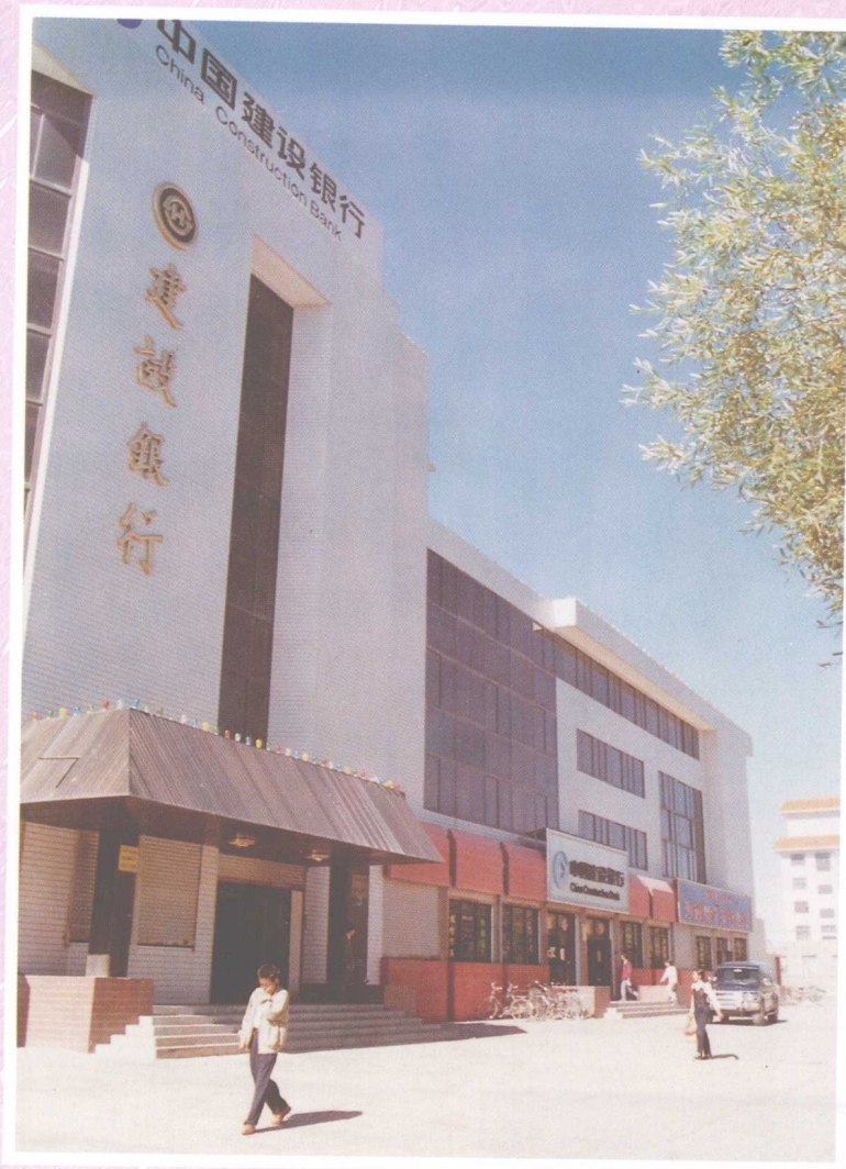
中国建设银行海西州中心支行