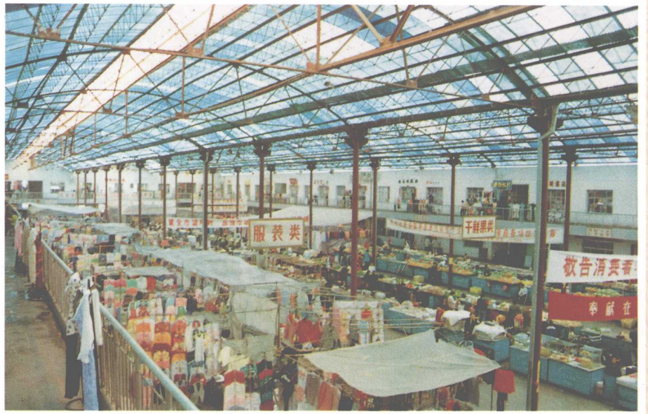
德令哈市金原商城内景