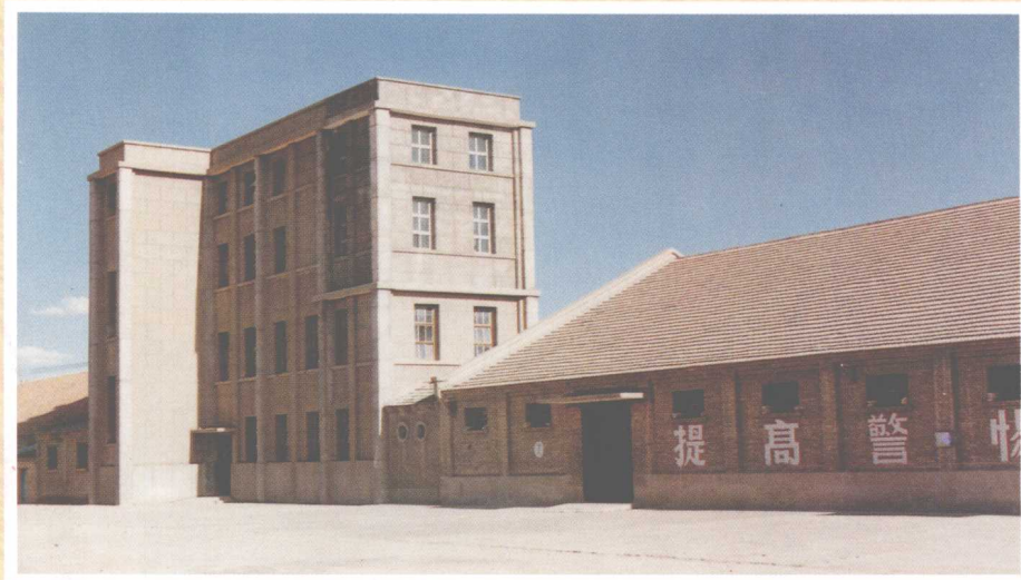
海西州德令哈面粉厂