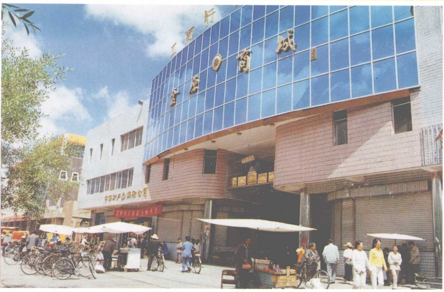
德令哈市金原商城外景