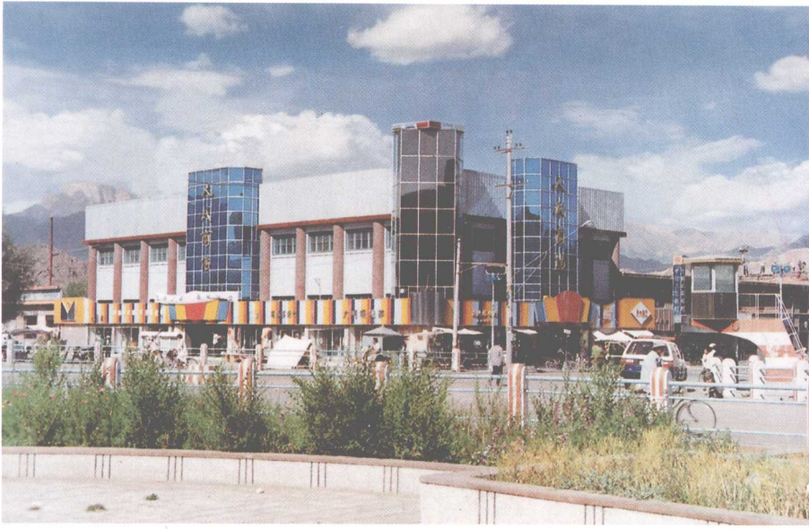
德令哈市人民商场