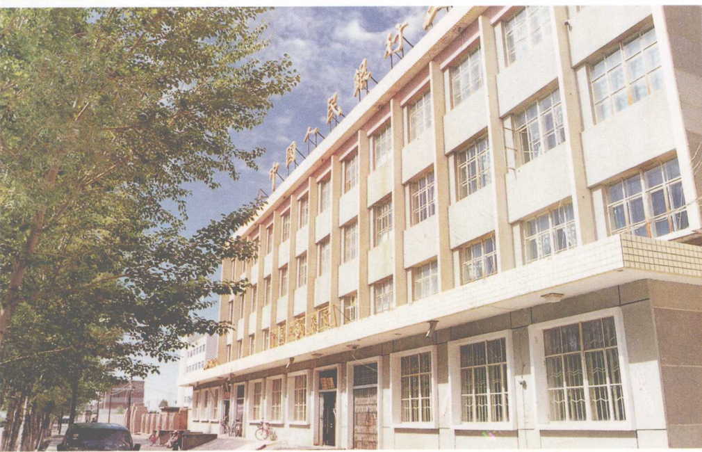
中国人民银行海西州中心支行