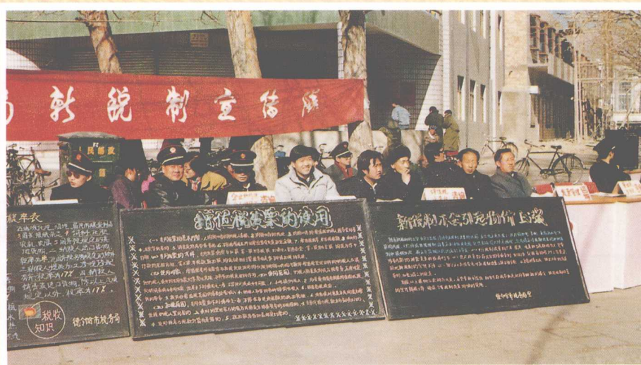
税务干部在街头宣传税法