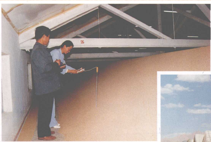
德令哈面粉厂粮库