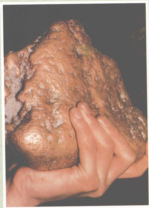
重达7709.55克 含金量为80%以上的特大天然金块 于1986年在海西境内发现