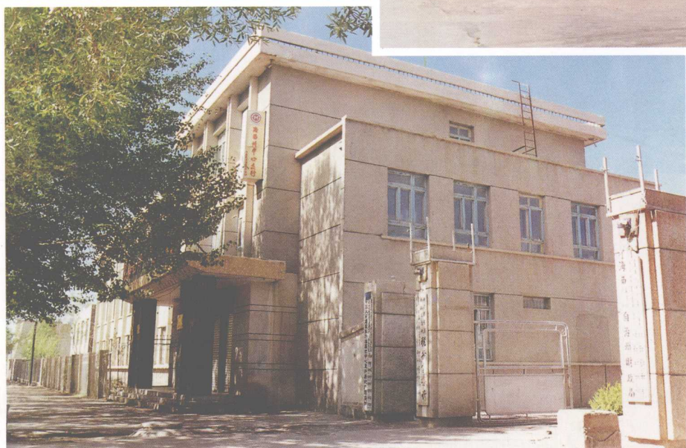
海西州财政局办公楼