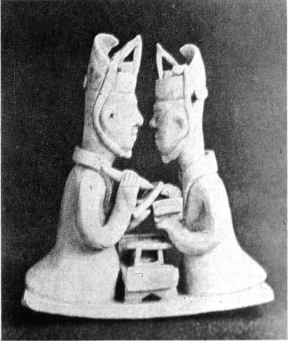
校 雛 俑