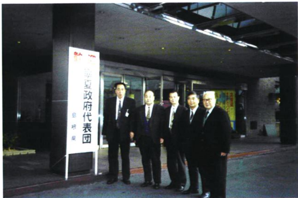
原自治区政协主席刘国范(左一)为团长、本会现任会长刘德元(右一)等七人为团员,于1996年11月14日至20日赴日本岛根县进行友好访问。