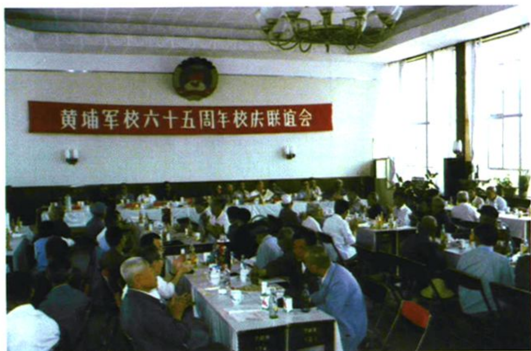
原自治区政协副主席吴尚贤、区党委统战部副部长肖文荫以及各民主党派、工商联领导 1989 年 6 月参加本会召开校庆六十五周年联谊会。图为会场场面。