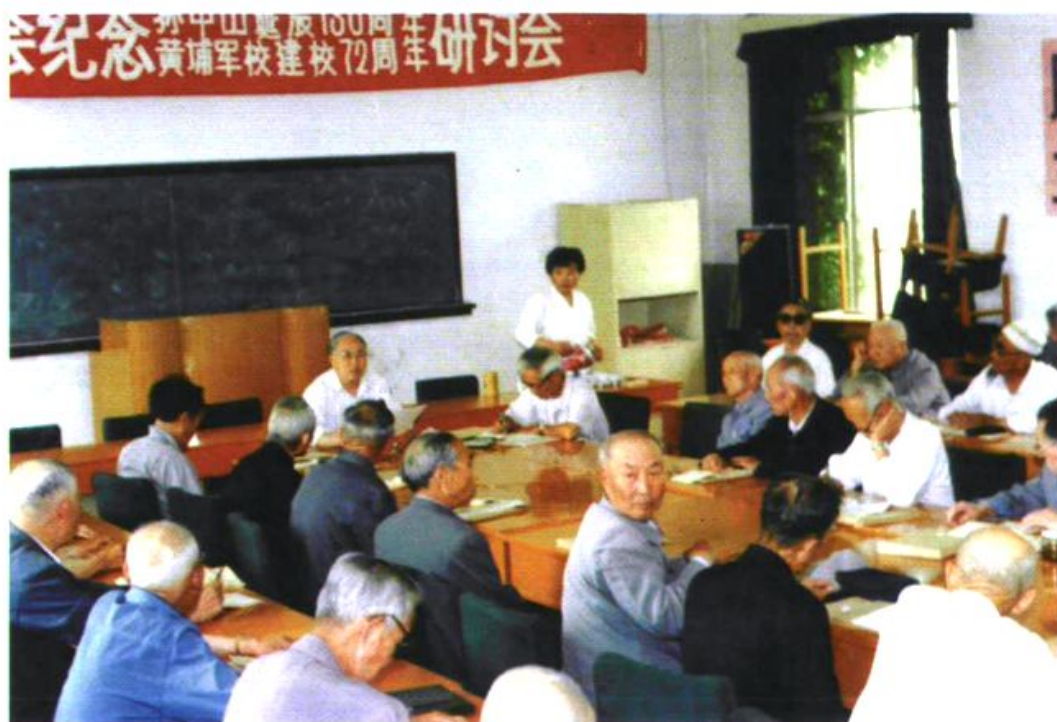
图为本会纪念孙中山诞辰 130 周年、黄埔军校建校 72 周年研讨会场面