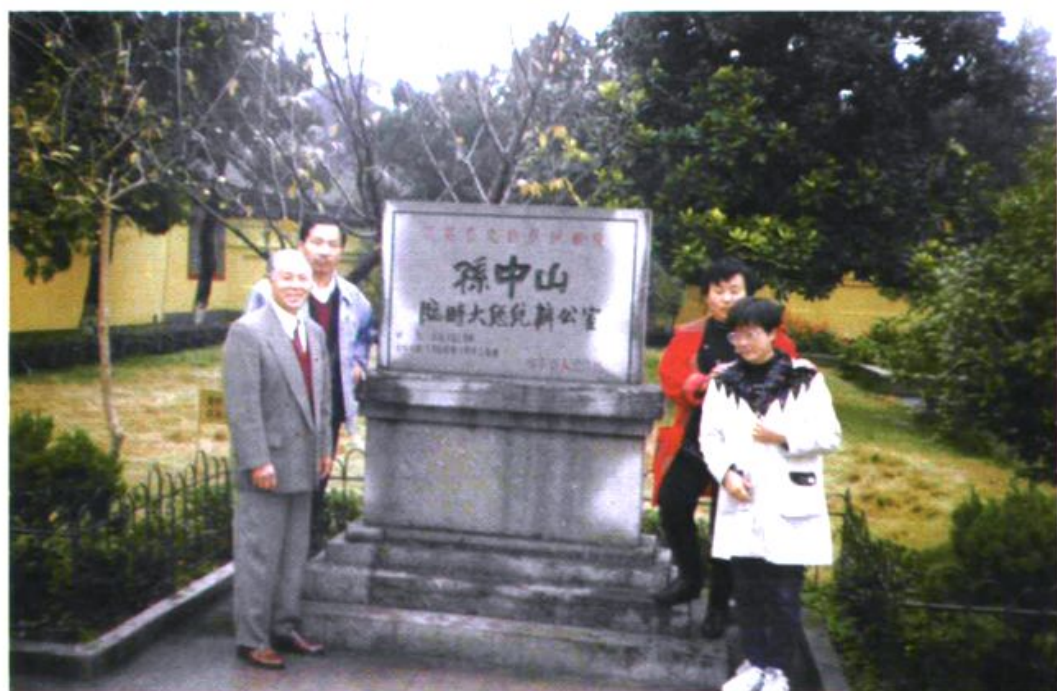
1996 年 11 月，本会机关全体人员赴江苏南京参观总统府