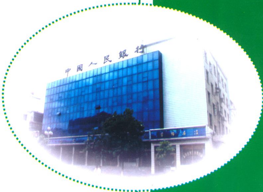
中国人民銀行房縣支行 辦公樓