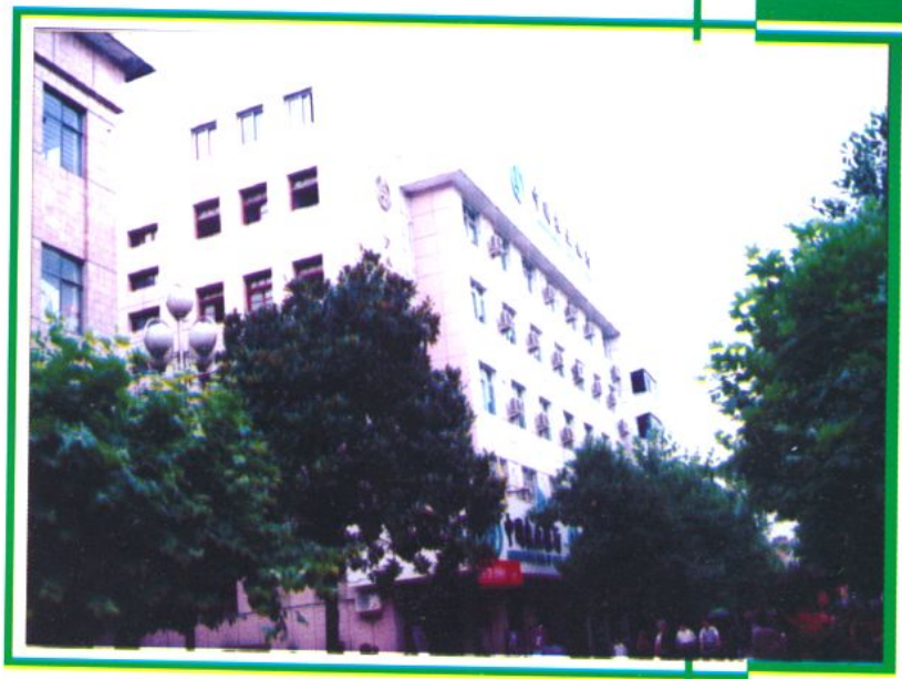
中國農業銀行房縣支行 辦公樓