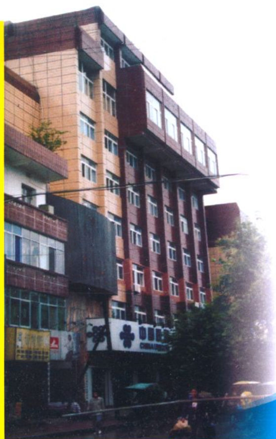
● 房县农村信用联社联合社 办公楼 (原中国工商银行房县支行)