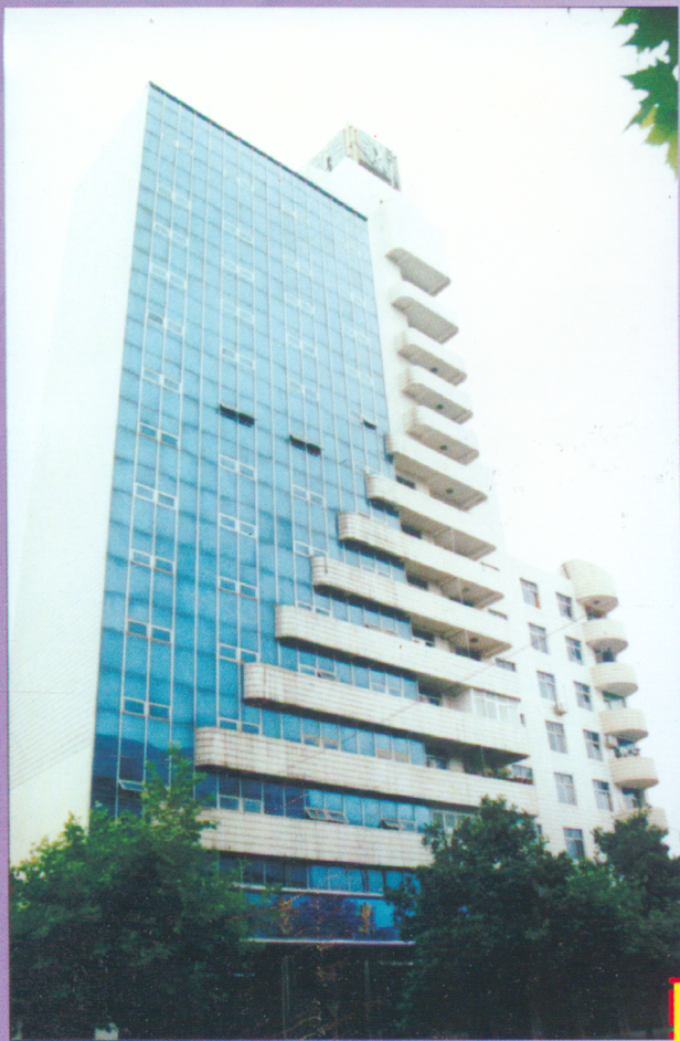
房县邮政局 办公楼