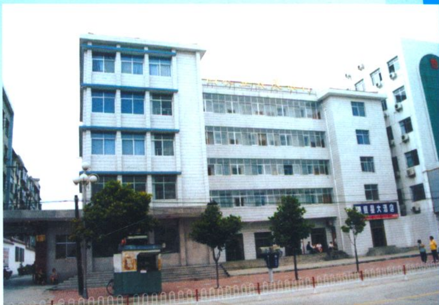
● 中国农业发展银行房县支行 办公楼