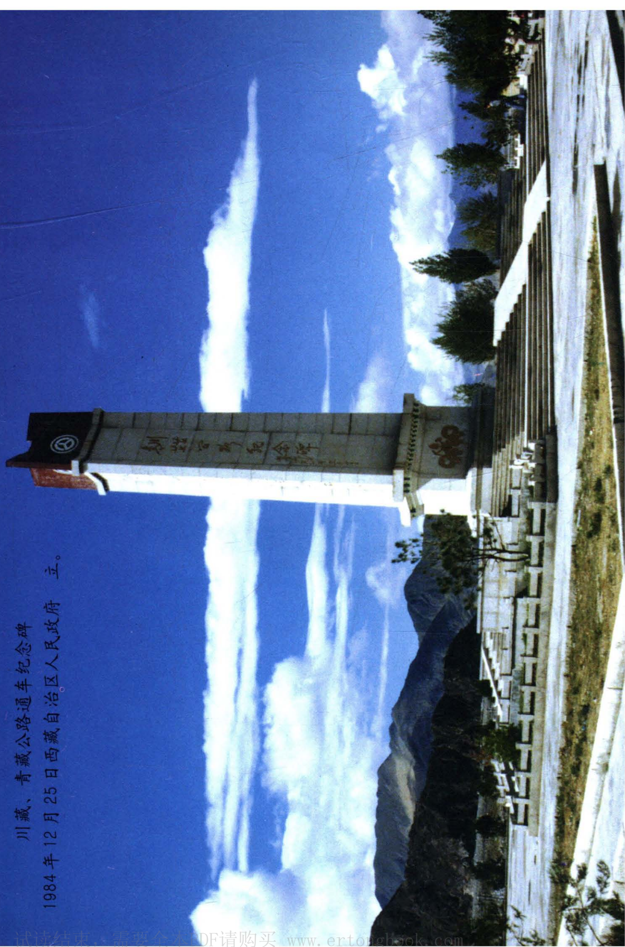
川藏、青藏公路通车纪念碑 1984年12月25日西藏自治区人民政府立。