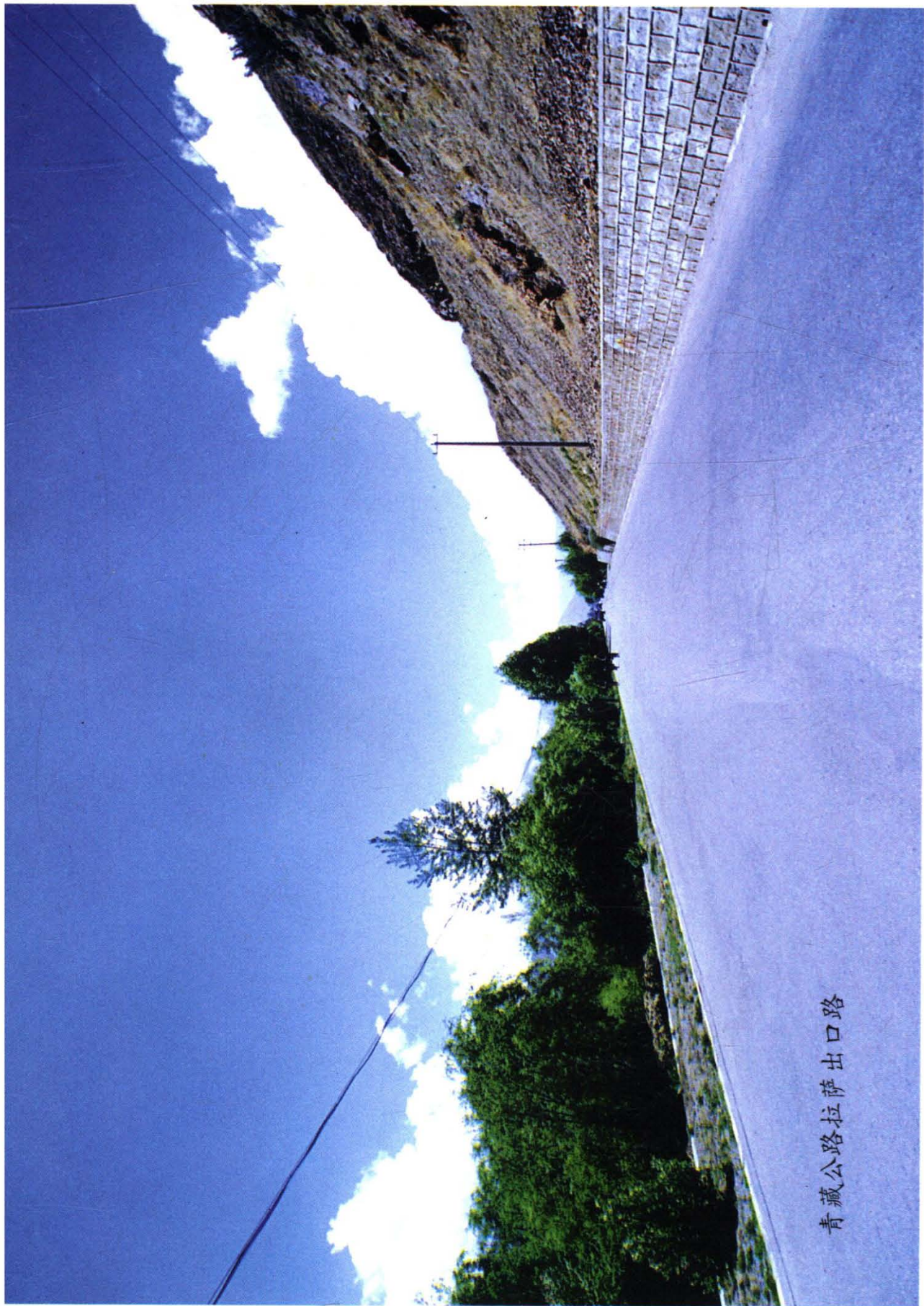
青藏公路拉萨出口路