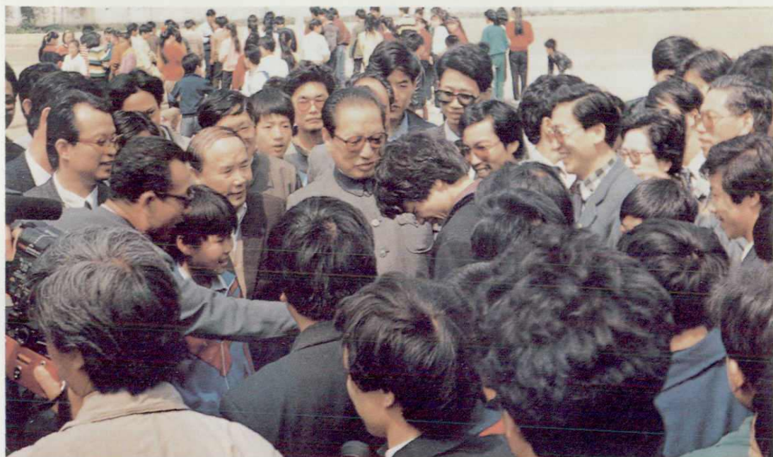
1991年4月中共中央政治局常委乔石视察鳌江口