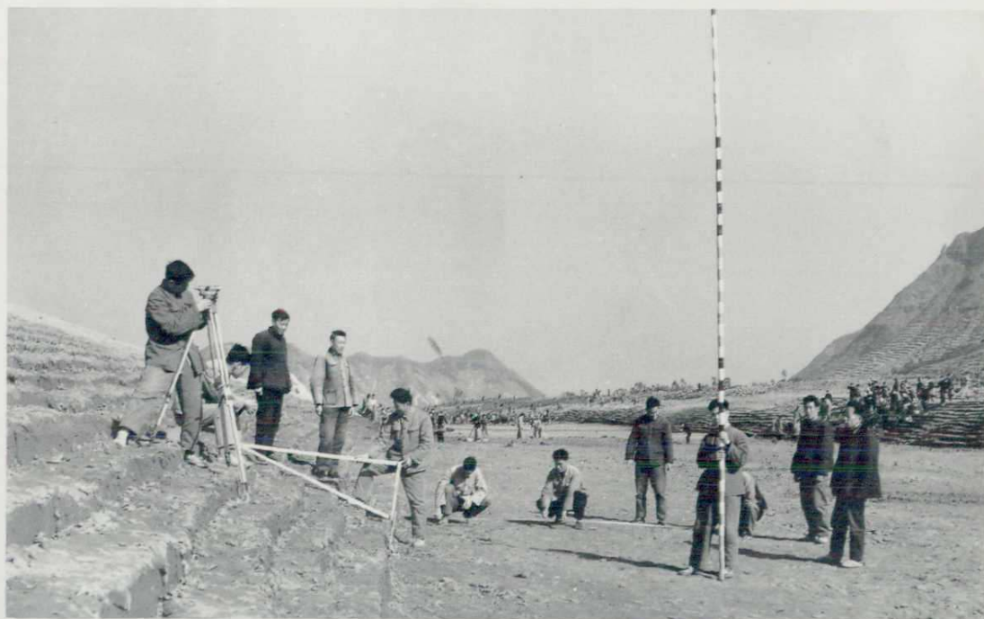
横阳支江疏浚工程验收