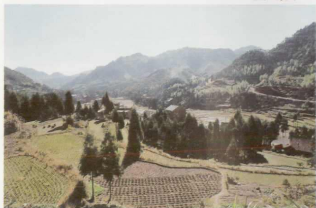
源头所在地——文成县桂山乡桂库村