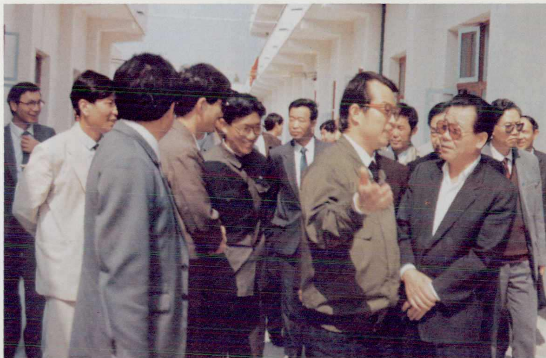
1991年5月中共中央政治局常委李瑞环视察鳌江口