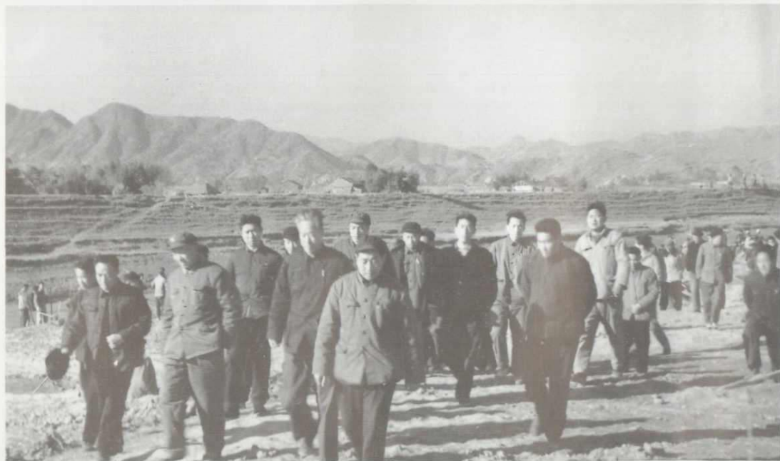
地、县委领导视察横阳支江疏浚工程。