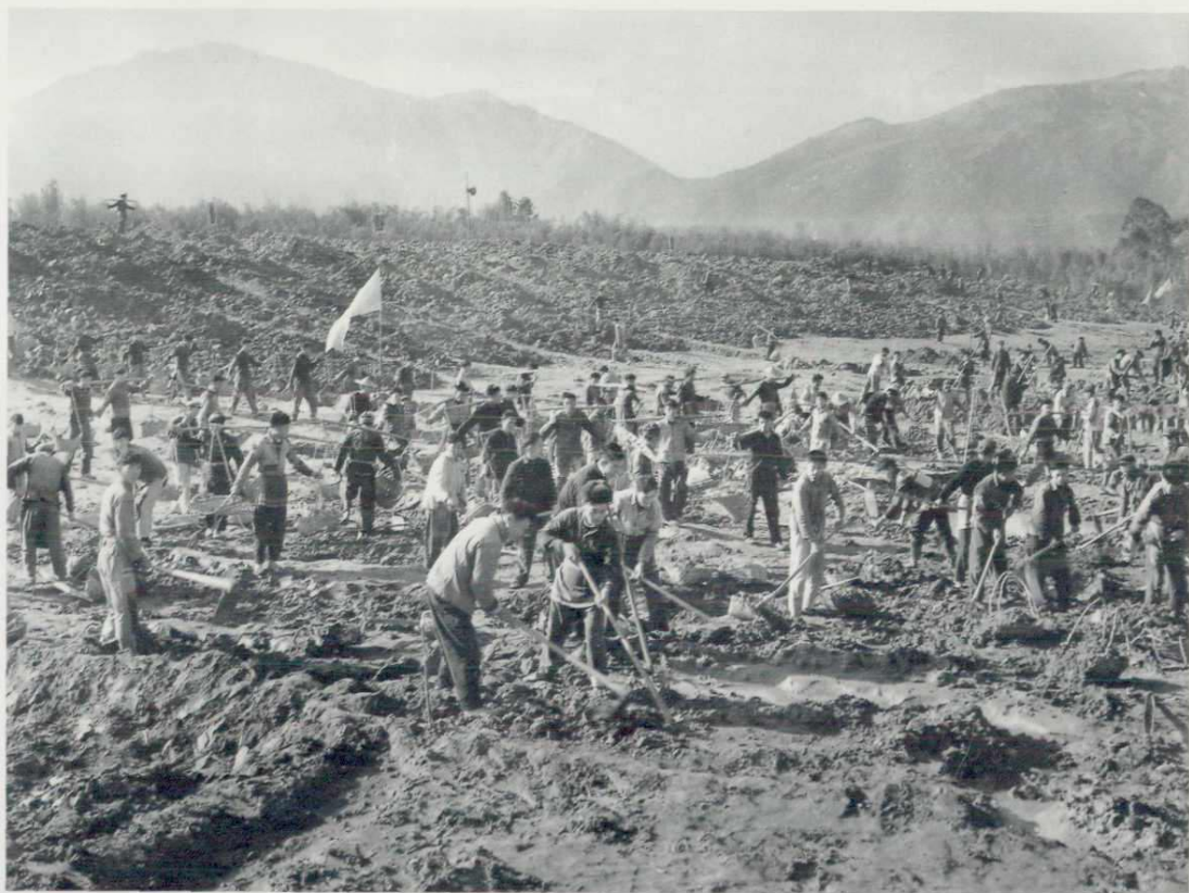
六万群众疏浚横阳支江