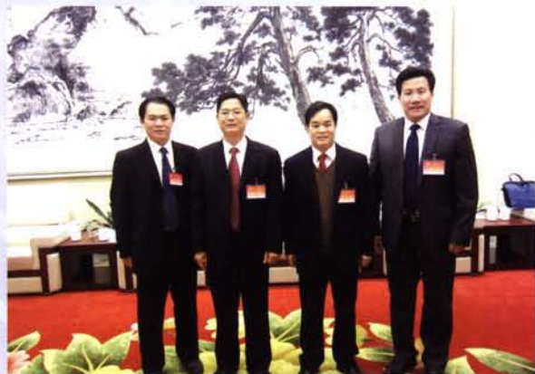
2015年4月，县四家班子主要领导参加县政协九届五次全会时合影。县委书记黄国健（左二）、县长宋日正（右二）、人大常委会主任潘祖乐（左一）、县政协主席黄隆鸣（右一）