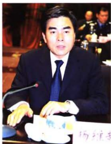
2011年2月，县委书记杨维超在县政协八届七次全会上做重要讲话