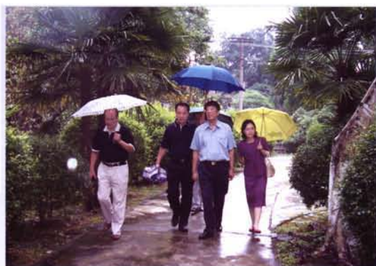
1999年7月,第六届政协主席李宁(左二)陪同自治区政协副主席袁正中(右二)视察明秀园