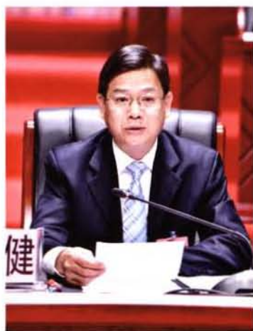
2015年4月，县委书记黄国健在县政协九届五次全会上做重要讲话