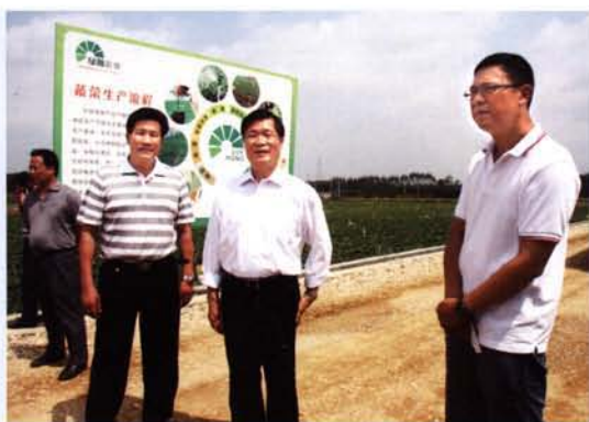
2013年4月,第九届政协主席黄隆鸣(右三)陪同自治区政协副主席彭钊(右二)视察绿瀚蔬菜基地