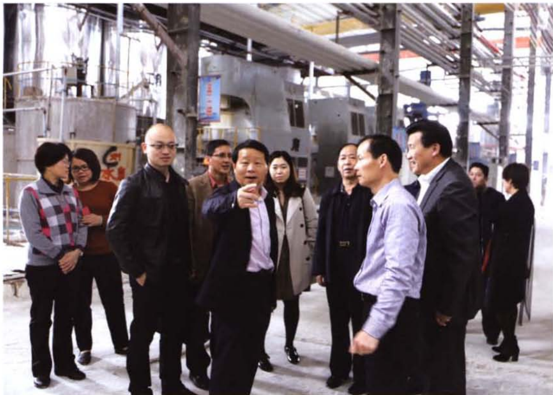
2015年3月，南宁市政协副主席肖志钢（左五）到武鸣金锋化工科技有限公司调研