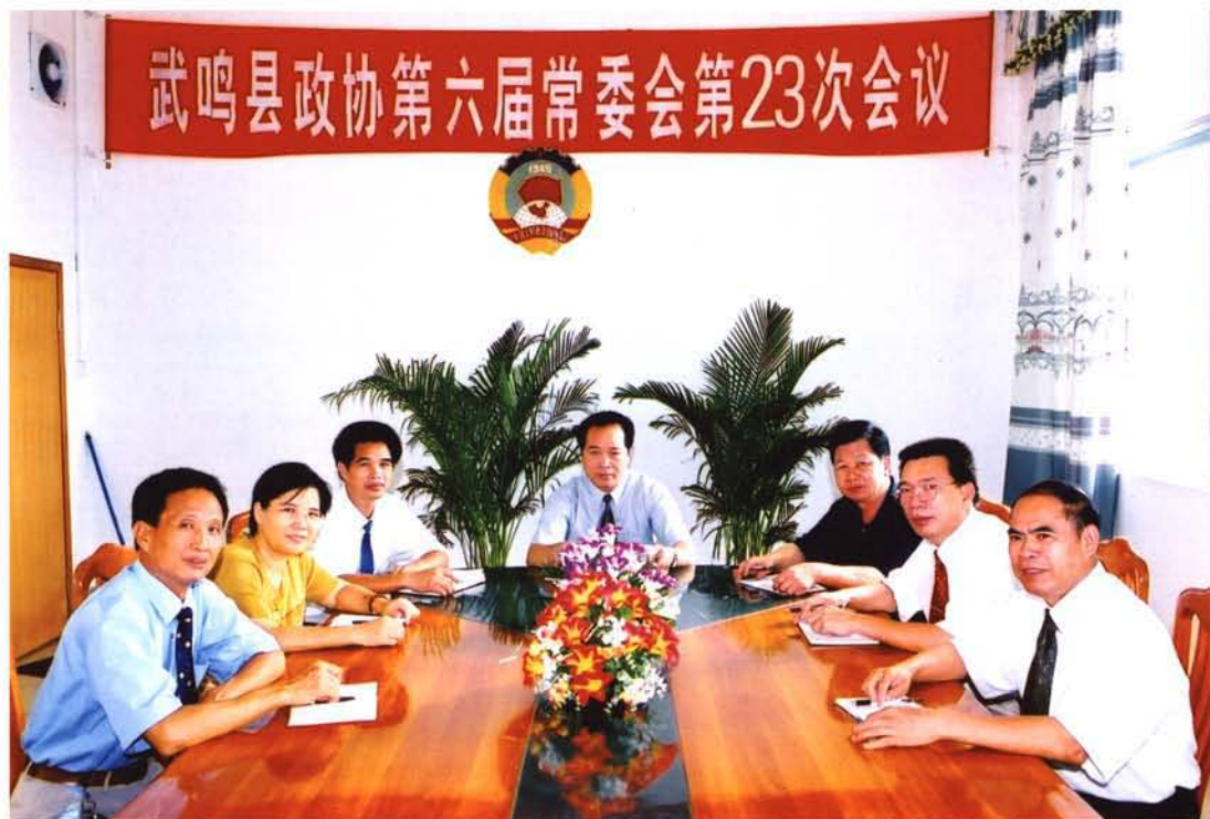
第六届政协领导班子（1999—2002年）。主席李宁（中），副主席周天仕（右三）、李邦强（左一）、蒙力力（左二）、梁冠武（左三）、苏成权（右二）、黎斌基（右一）