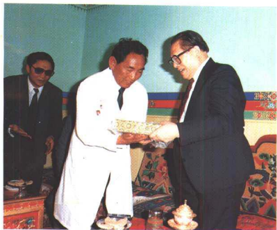
西藏自治区藏医院院长、国家级 专家强巴赤烈向江泽民主席敬献 《四部医典系列挂图全集》