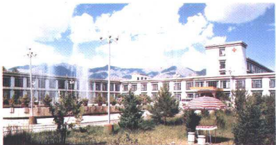
西藏自治区藏医院住院部