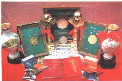
珍贵藏药获国家级金奖