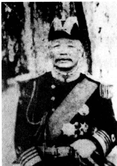
民国北京政府首任海军总长刘冠雄，任内有重振海军的壮志，对中国海军的制度建设成就颇著。

专门设立海军部，负责总揽全国的海军建设事务，以及相关政策的制定和舰船调度、人员擢升等方面的管理。在海军部直辖之下设立海军总司令部，担负舰队的管理、训练、作战等技术性事务。原清末海军巡洋舰队“海筹”舰舰长黄钟瑛因在辛亥反清战事中表现突出，在孙中山的全力推荐下出任海军部总长，并兼任海军总司令。