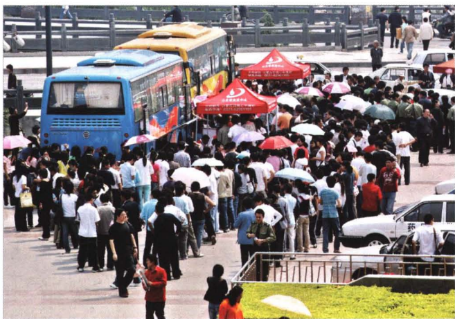
2008年5月14日，泉城义工在泉城广场排队献血。