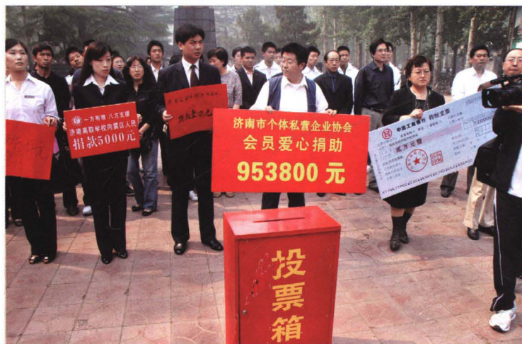
2008年5月17日，济南市 社会各界捐款现场。