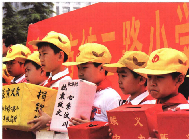
2008年5月24日，济南市纬二路 小学组织赈灾义卖募捐活动。