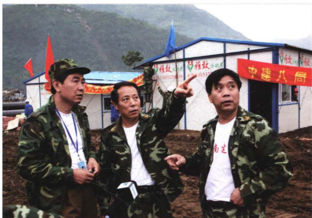
2008年5月29日，济南市副市长、市抗震救灾前线指挥部指挥邹世平（中）在擂鼓镇指挥抗震救灾工作。