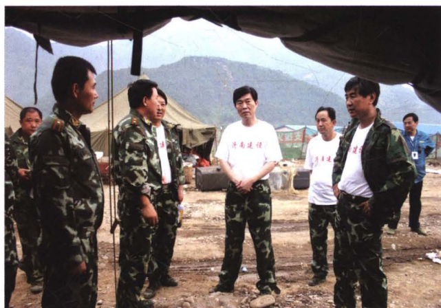
2008年6月，济南市副市长、市抗震救灾前线指挥部指挥齐建中（中）在擂鼓镇板房建设工地检查工作。