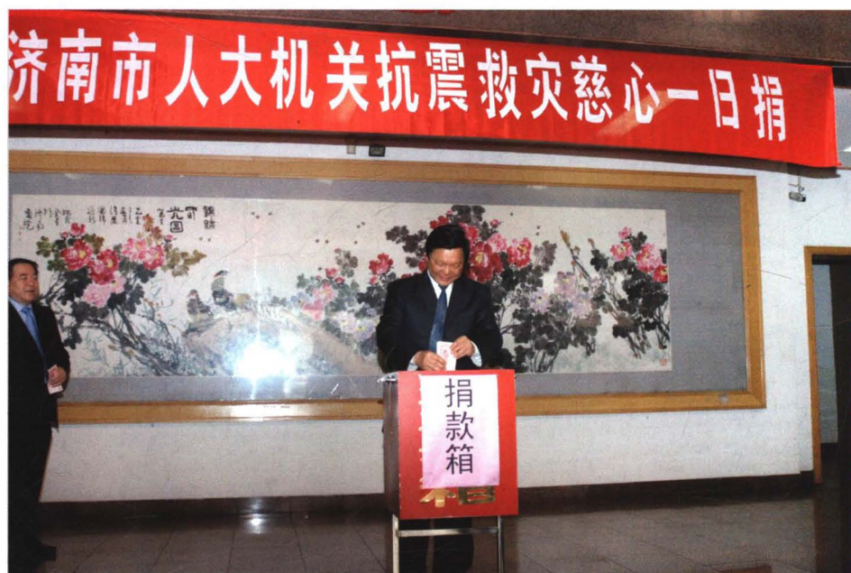
2008年5月14日，济南市人大常委会主任徐华东向地震灾区捐款。