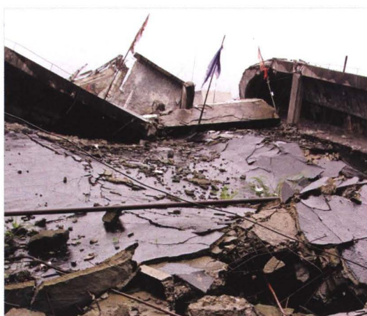
特大地震瞬间将北川县农村合作信用社大楼摧毁。