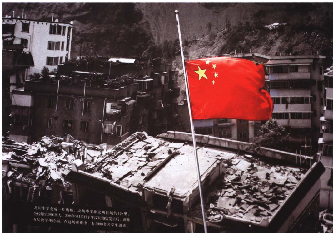
特大地震瞬间将北川中学变为一片废墟，1000多名学生遇难。