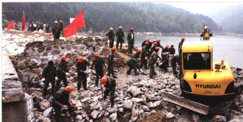
2008年5月24日， 济南黄河专业机动抢 险队在四川省广元市 抢修震损的鱼儿沟水 库。