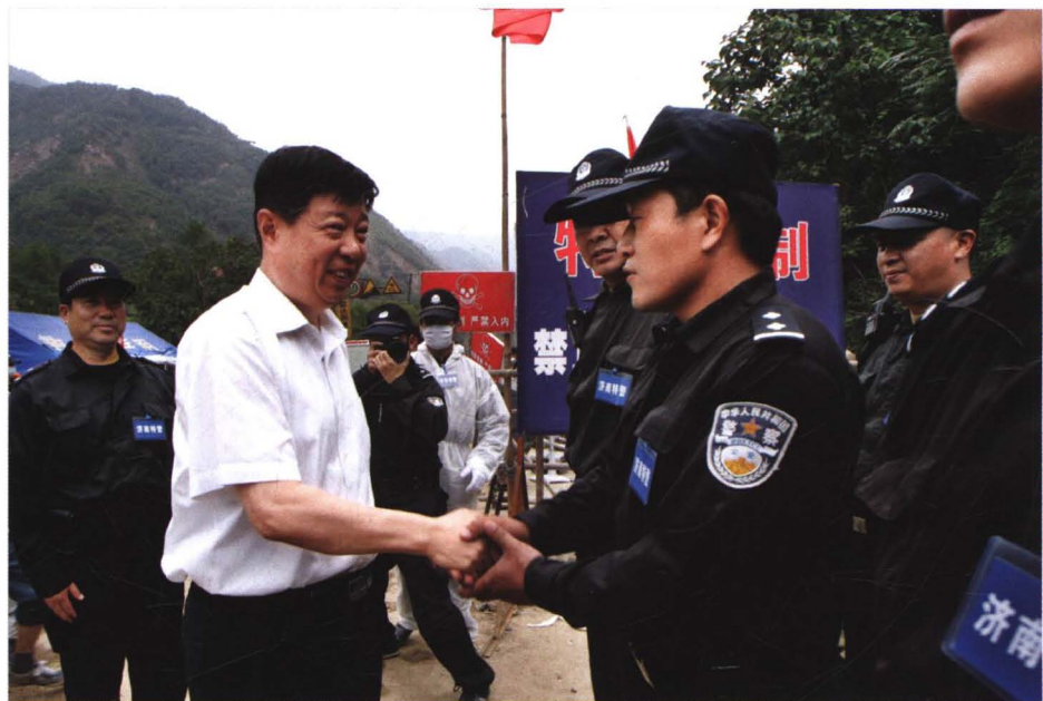
2008年6月20日，中共山东省委书记、省人大常委会主任姜异康（前左一）到地震灾区看望济南援川特警。