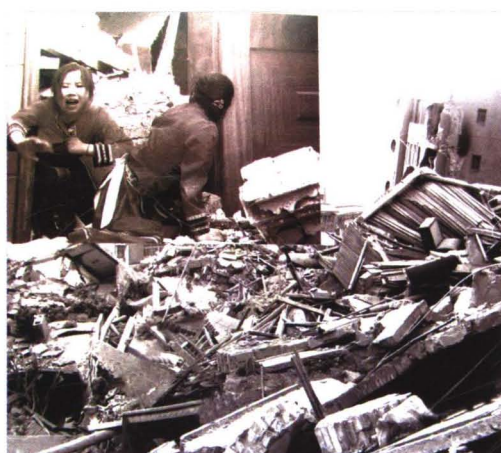
房屋坍塌瞬间逃生的惊恐。