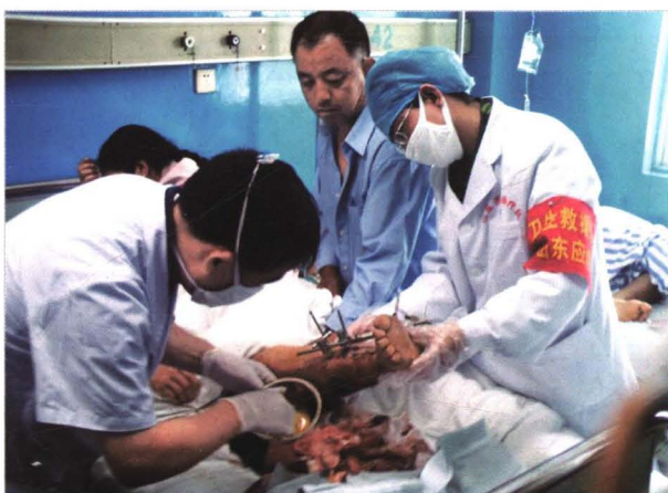
2008年5月17日，济南市赴川医疗卫生 队员正在为伤员医治。