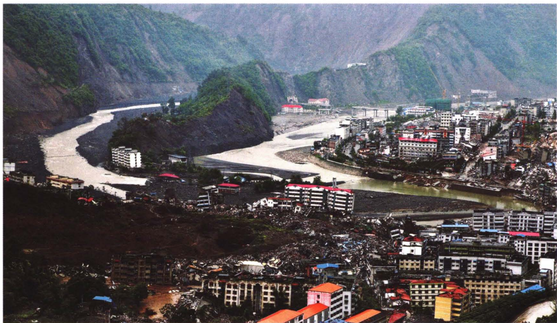
地震把北川县城夷为平地。