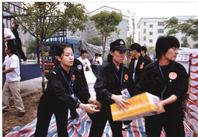
2008年5月23日，泉城义工在四川省安县搬卸救灾物资。