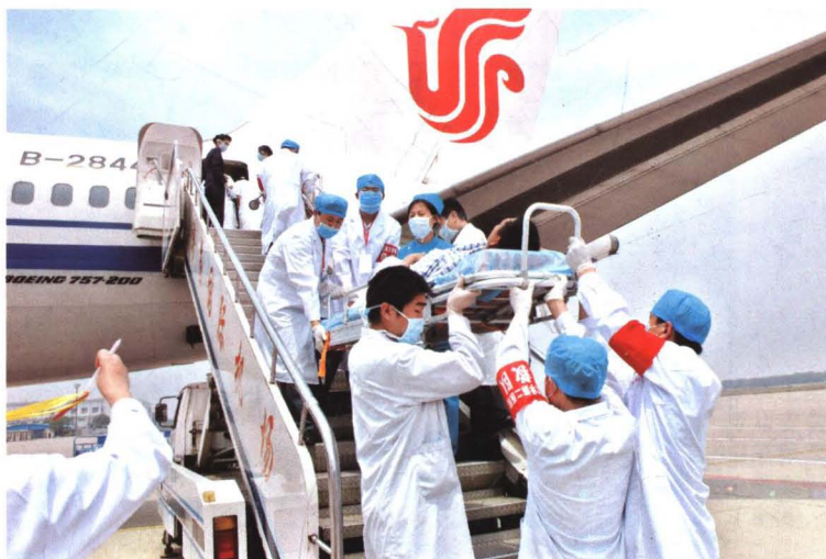
2008年5月22日，济南市 医务人员在遥墙机场紧张转运 来济救治的四川灾区伤员。