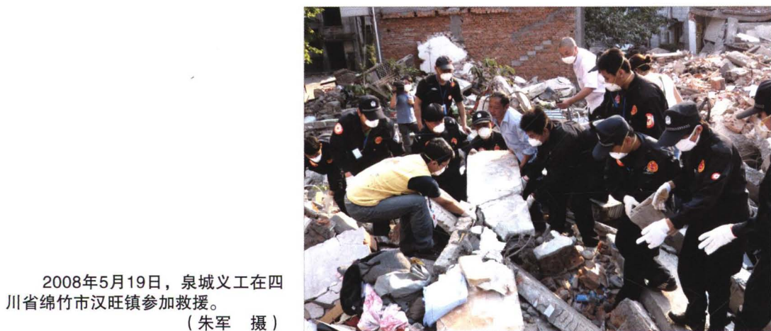
2008年5月19日，泉城义工在四川省绵竹市汉旺镇参加救援。