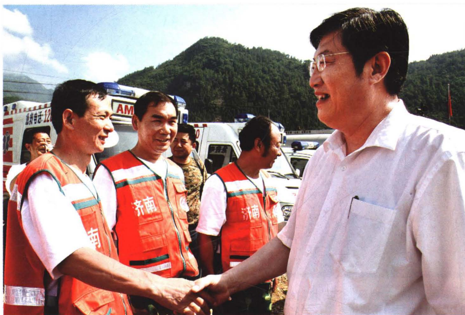
2008年7月2日，中共济南市委副书记、市长张建国（右一）在擂鼓镇慰问济南市抢险救援队员。