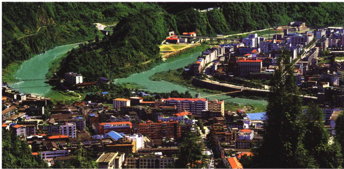
震前美丽的北川县城。