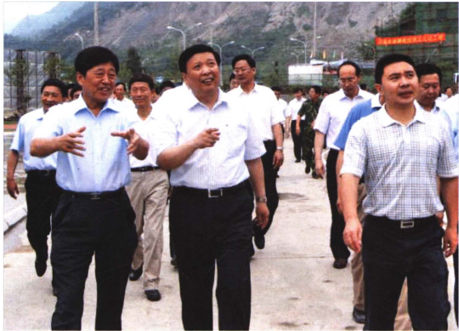
2009年6月8日，中共山东省委副书记、省长姜大明（前中）视察济南市援建灾区擂鼓镇工程。