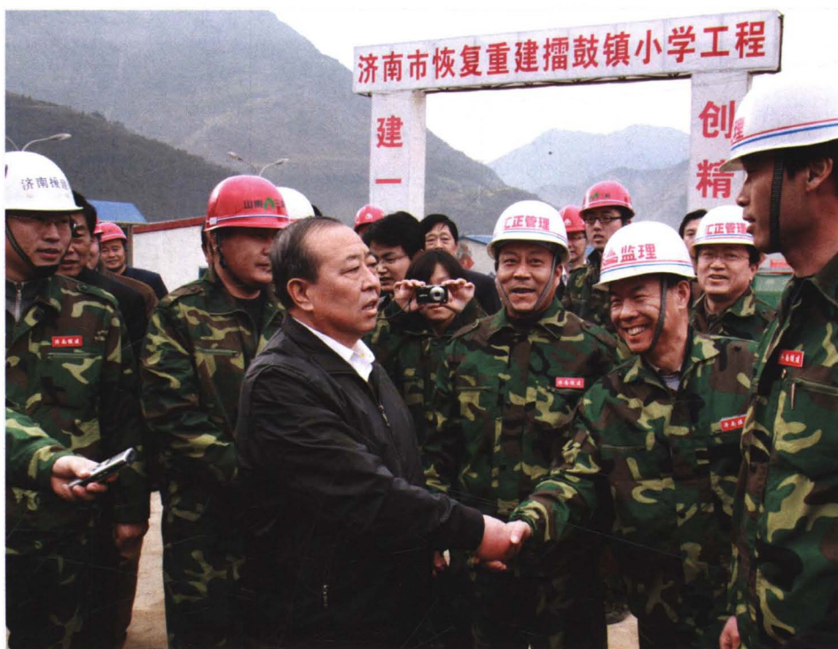
2009年3月6日，中共山东省委常委、济南市委书记焉荣竹（前左）到北川县擂鼓镇视察援建工作。