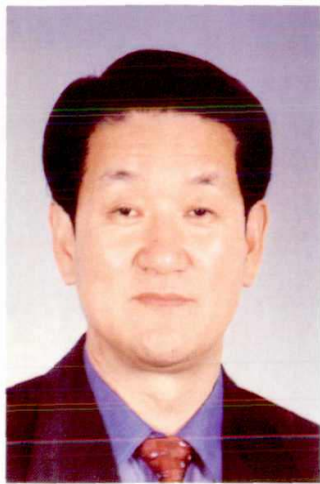
中共山东省委常委 青岛市委书记 杜世成