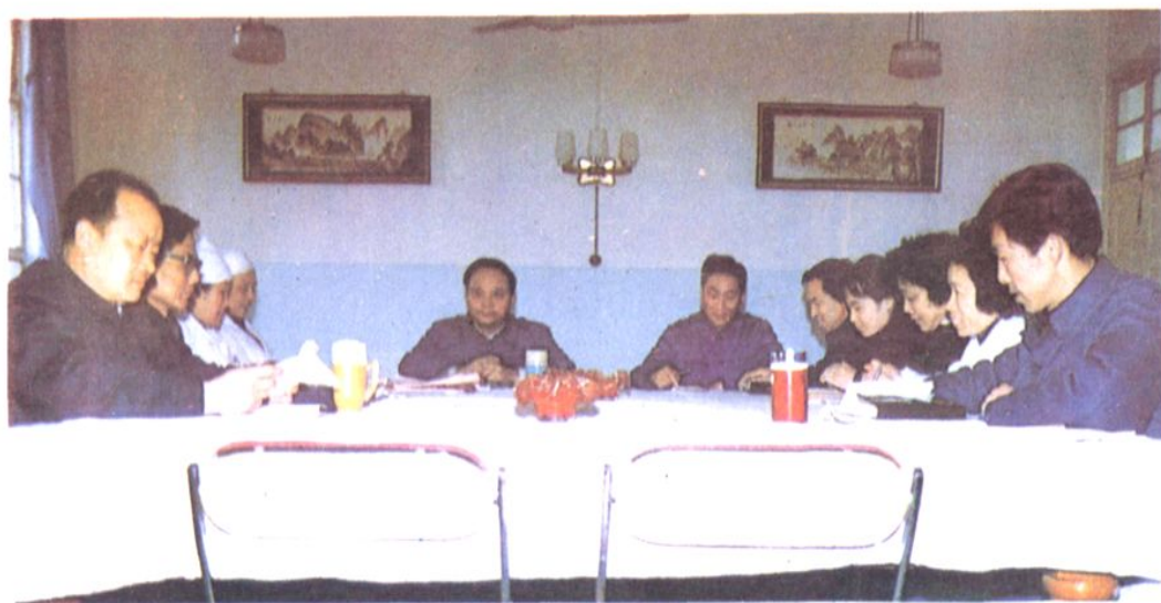
院办公会在讨论提案