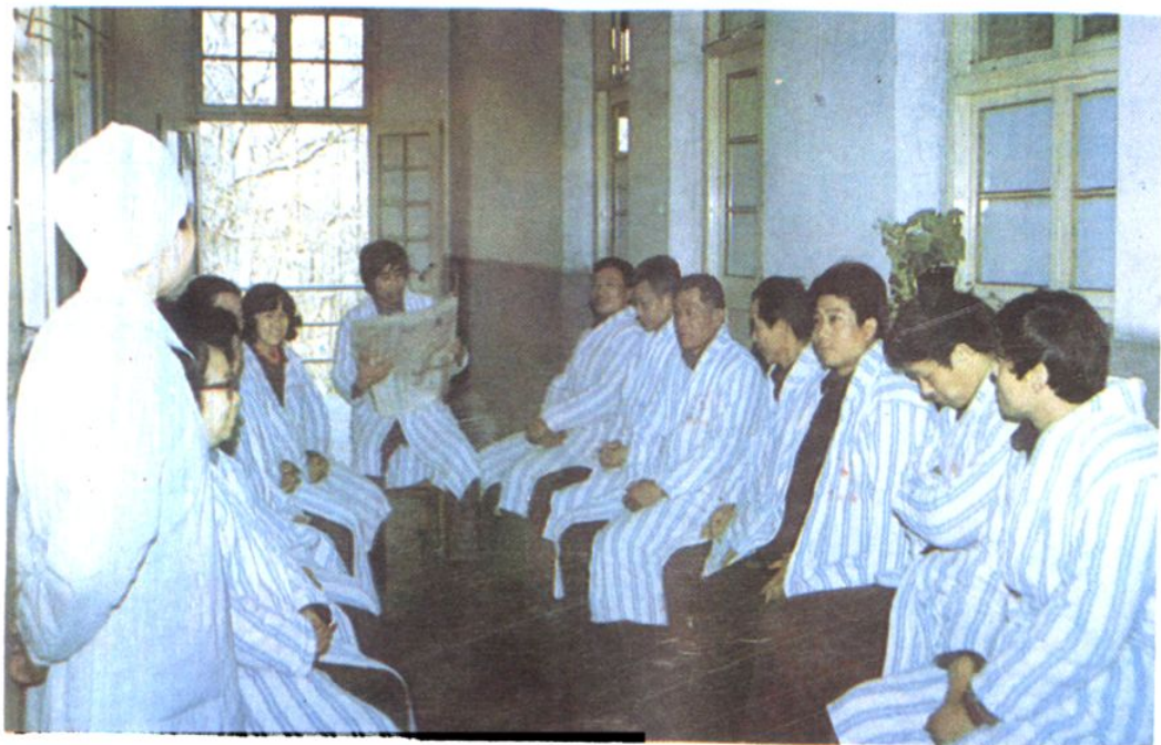
休养员在学习全国党代会文件