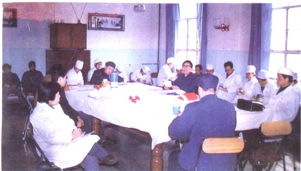
院周会在布置工作