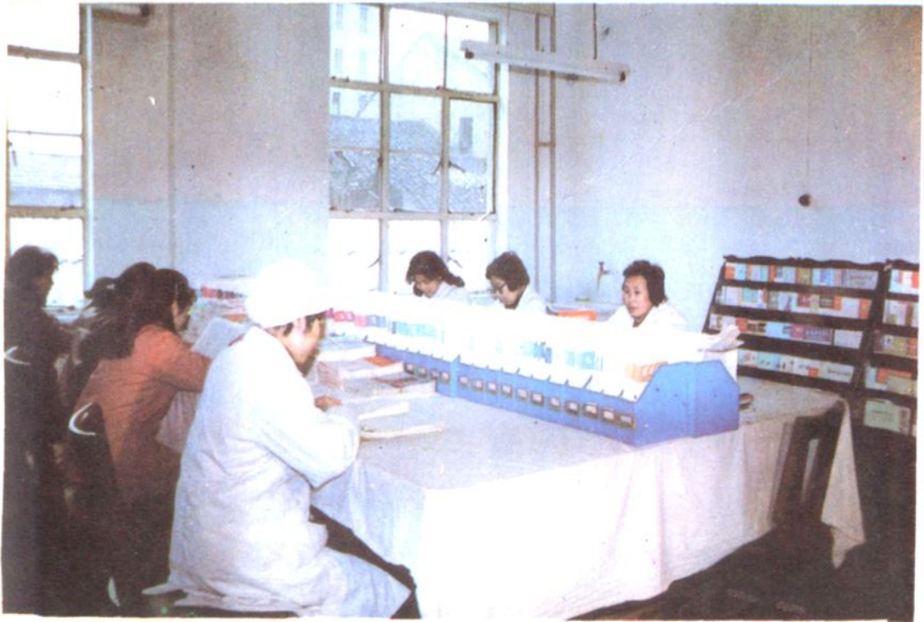
医疗图书阅览室一角