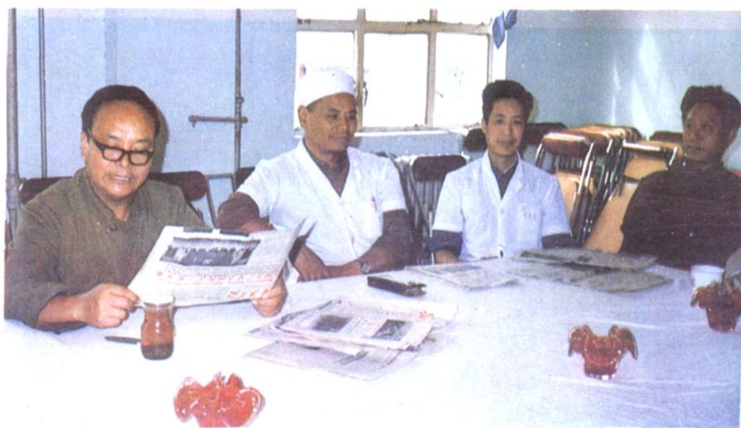
书记在宣讲党代会文件