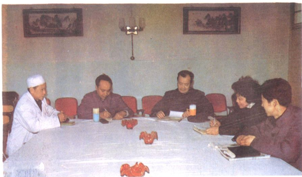
党委会在研究工作