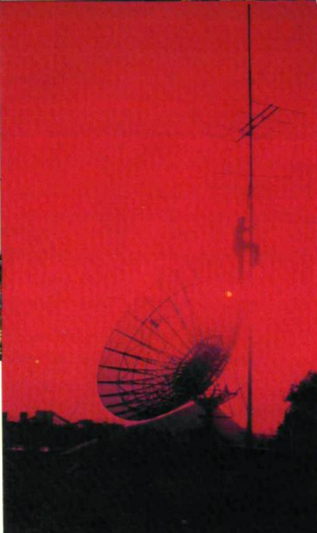
地面卫星接收天线▷