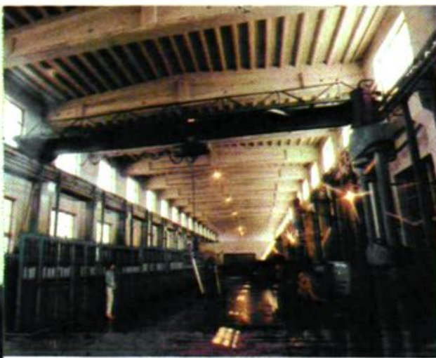
单体支柱维修车间