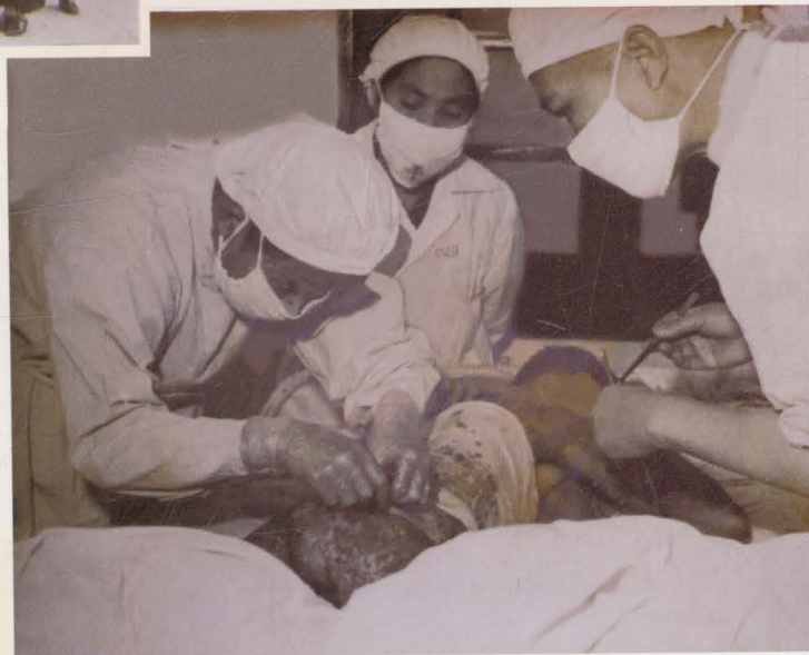
1958年为烧伤工人实施植皮手术