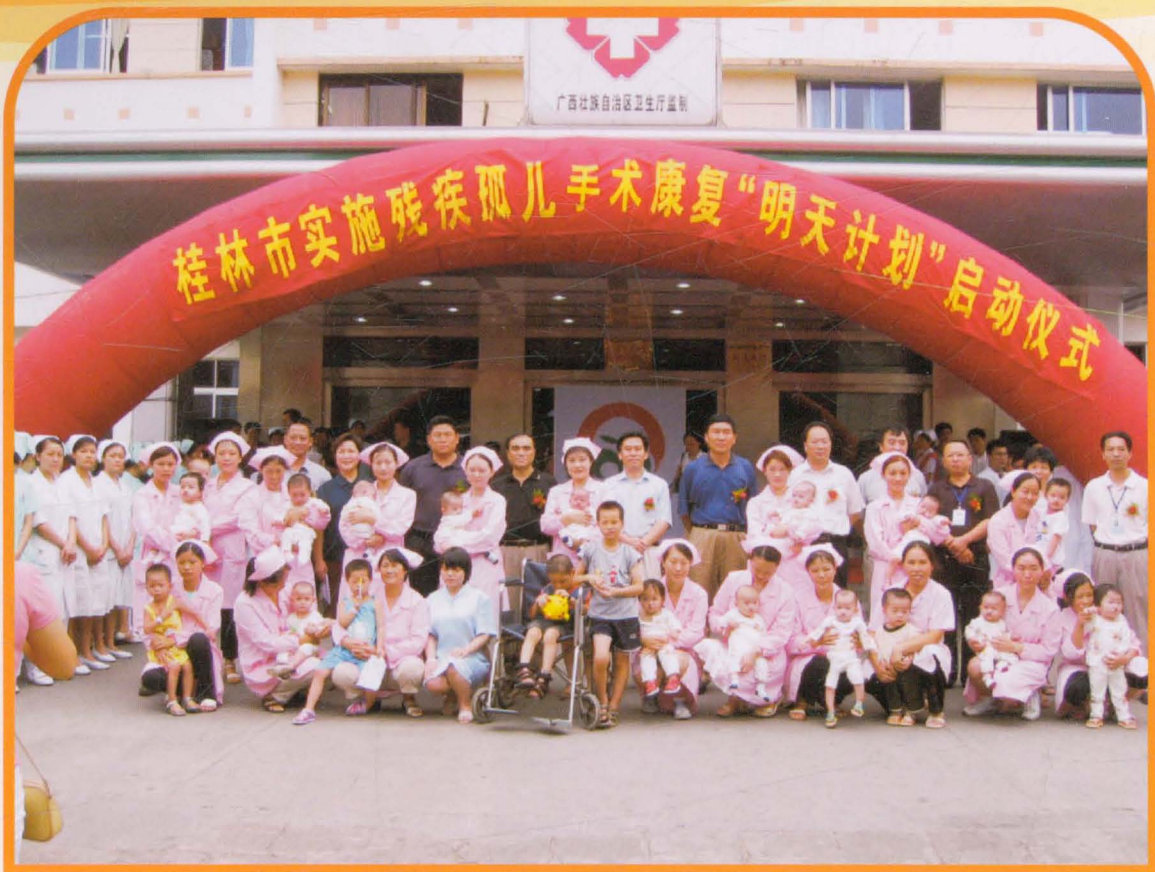
市领导参加桂林市明天计划残疾儿童康复启动仪式