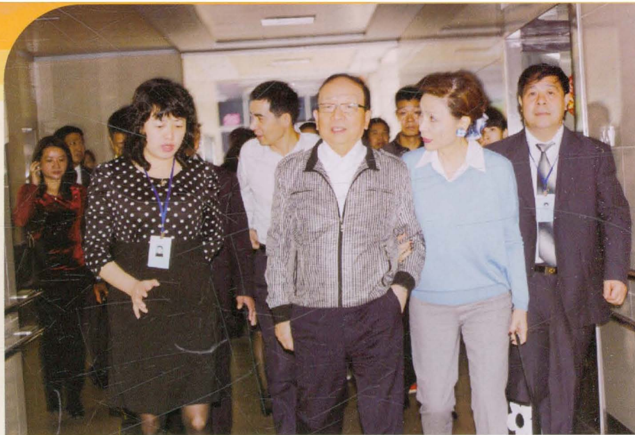
2013年国民党荣誉副 主席蒋孝严参观医院