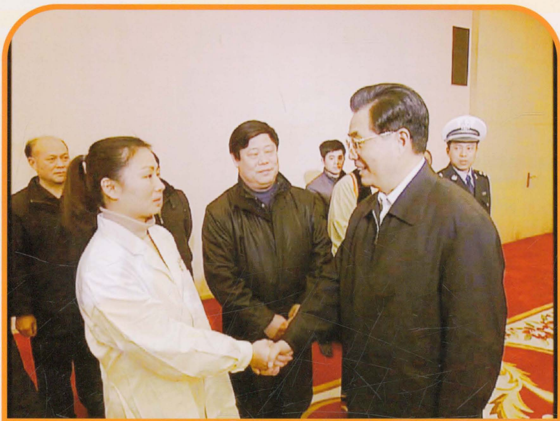
2008年时任中共中央总书记胡锦涛同志接见我院抗冰救灾医务工作者