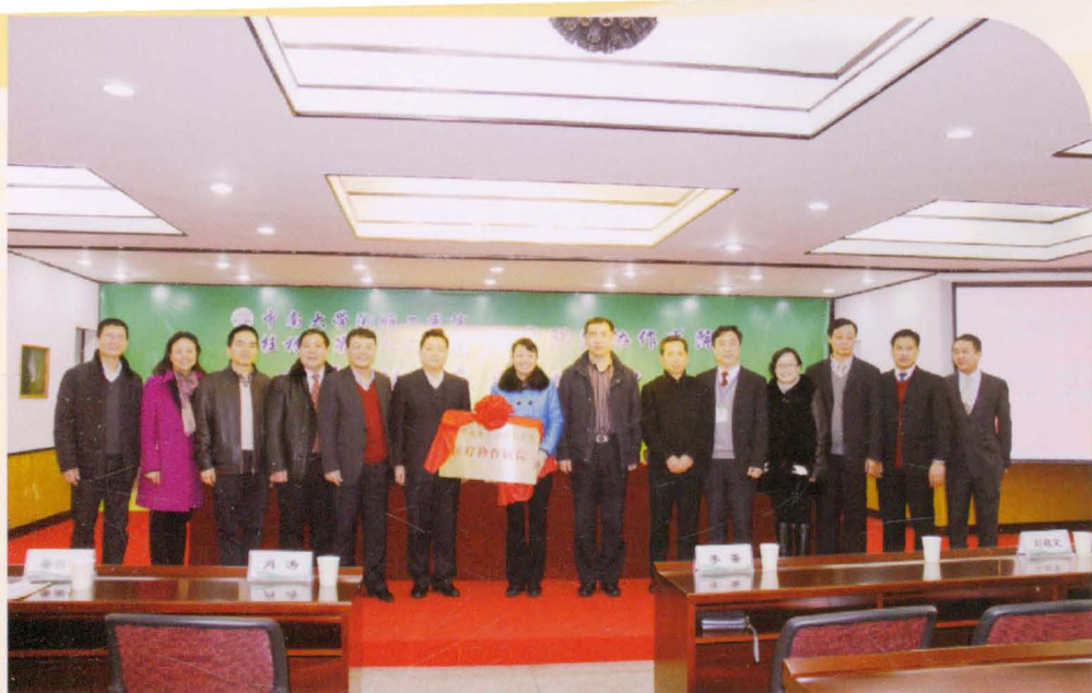
2014年与中南大学湘雅二院结为医疗协作医院