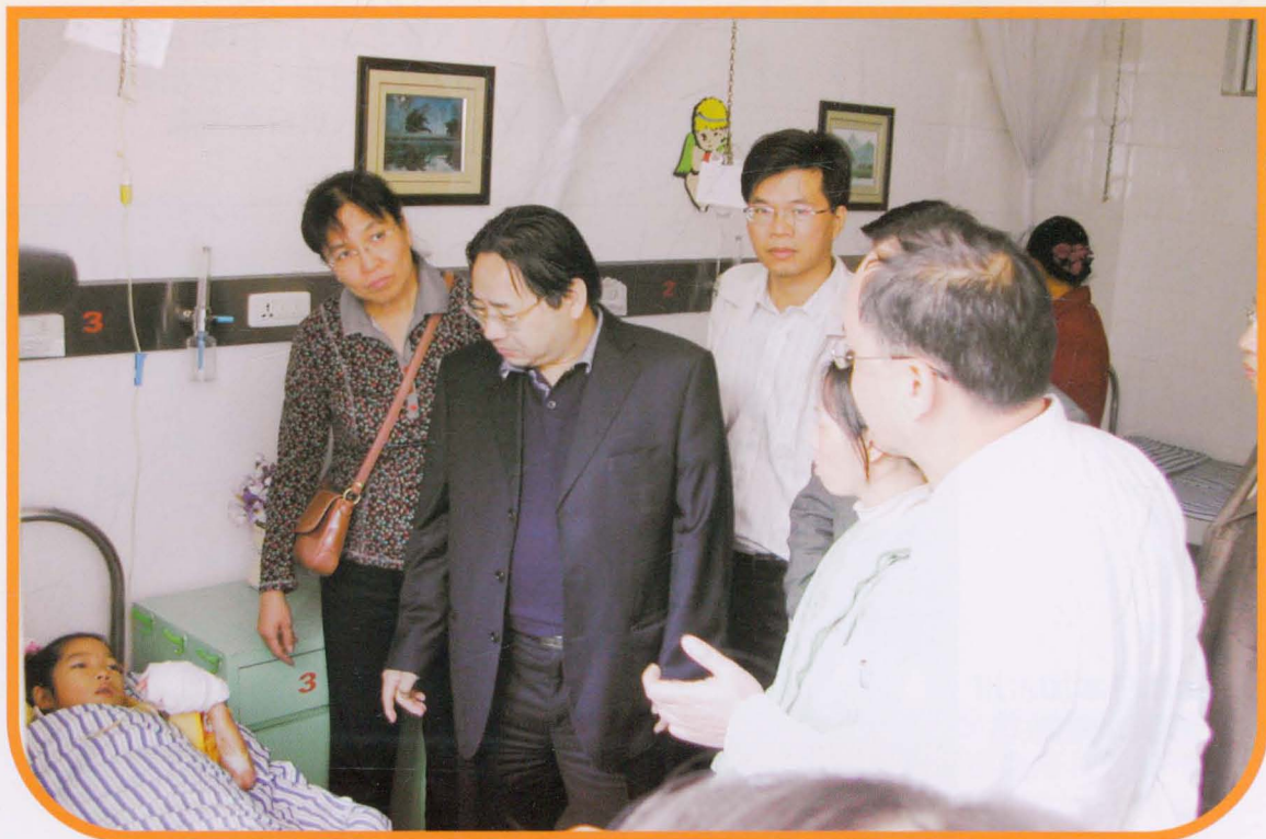
2005年时任民政部部长李学举探访“明天计划”手术残疾儿童