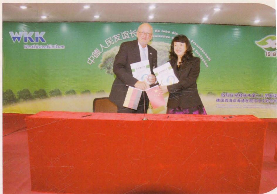
2014年与德国西海岸海德医院签署友好合作医院协议