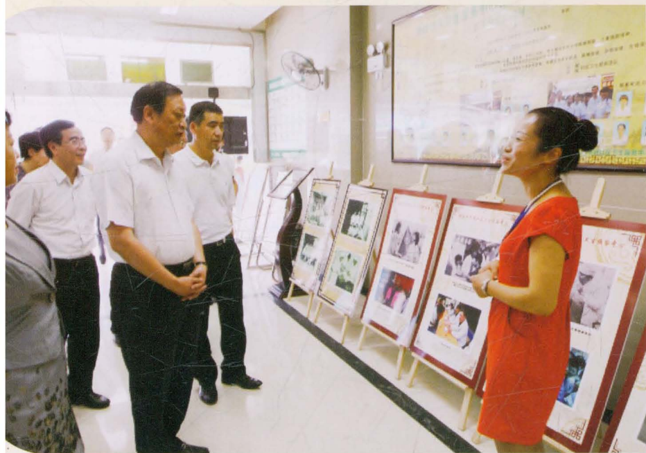
2014年时任国家卫生和 计生委副主任、国家中 医药管理局局长王国强 率调研组到桂林市第二 人民医院秀峰社区卫生 服务中心进行调研