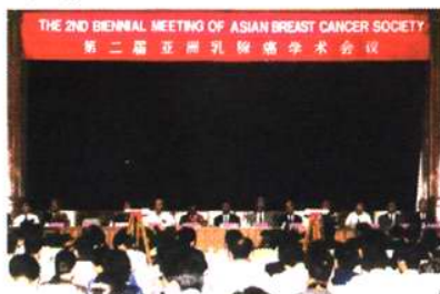
第二届亚洲乳腺癌会议