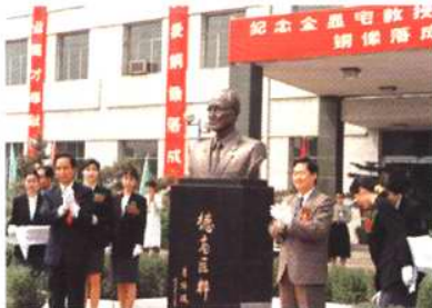
金显宅教授铜像落成仪式