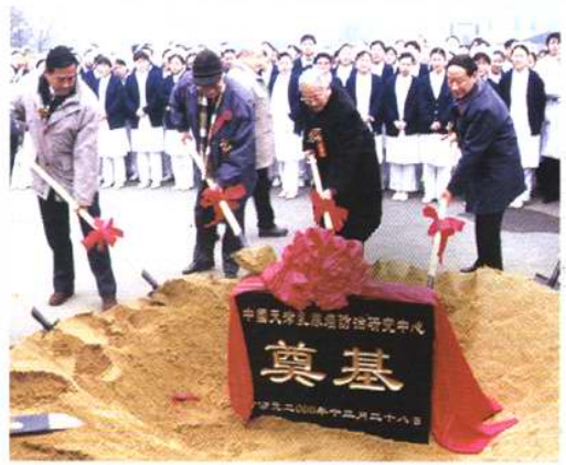
中国天津乳腺癌防治研究中心奠基仪式