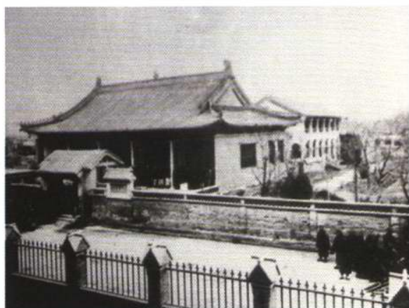
1916年英国伦敦教会医院门诊外景