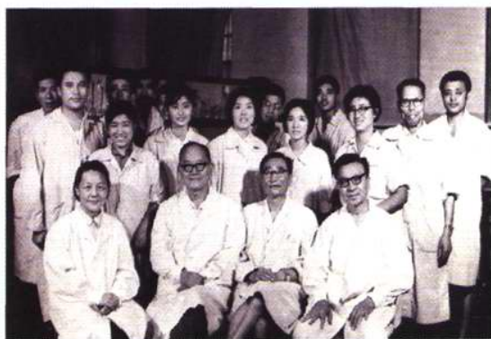
研究所早期科研人员