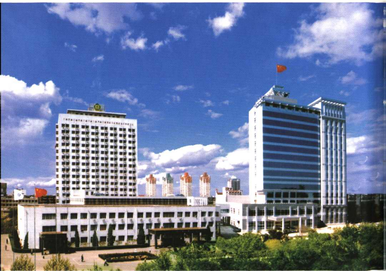
天津市肿瘤医院 天津医科大学附属肿瘤医院全景(2003)