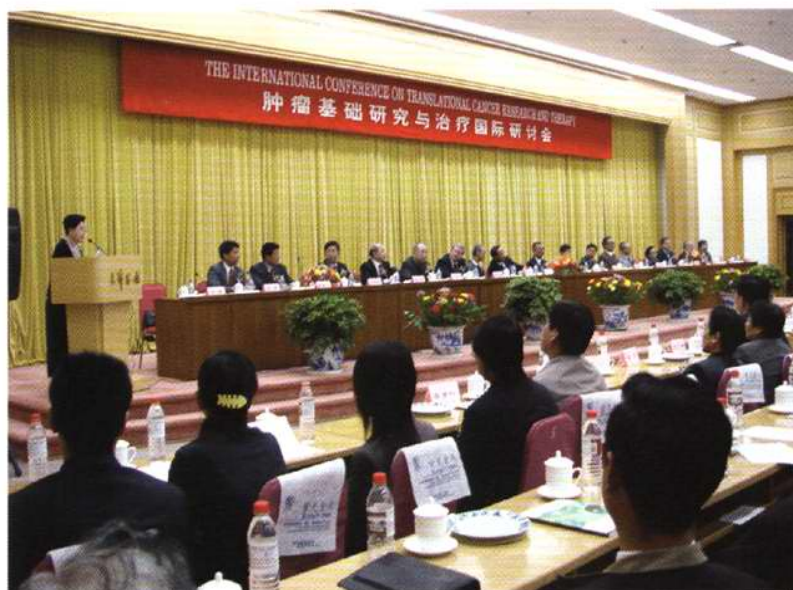
肿瘤基础研究与治疗国际研讨会