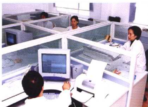
流行病学室科研人员在统计资料