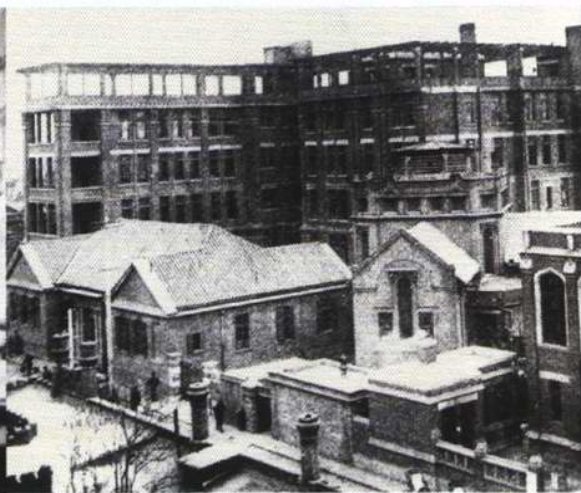
1924年马根济纪念医院住院部外景