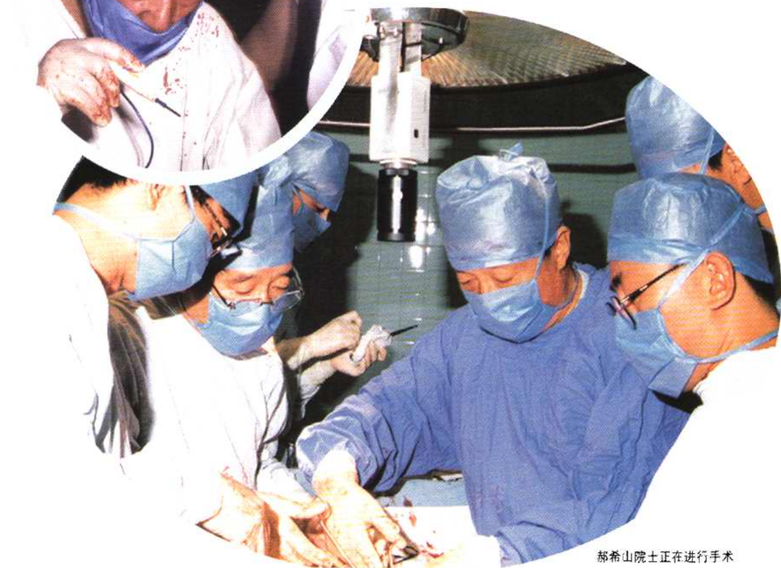
郝希山院士正在进行手术