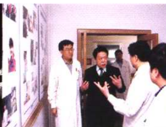
原卫生部副部长殷大奎视察我院