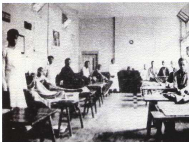
马根济纪念医院住院部病房