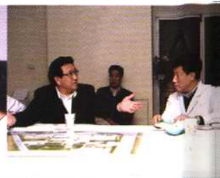
原天津市市长李盛霖视察我院