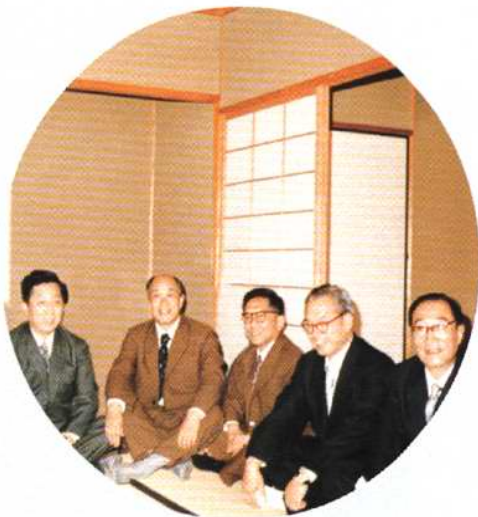
我院70年代中青年技术骨干在日本学习交流