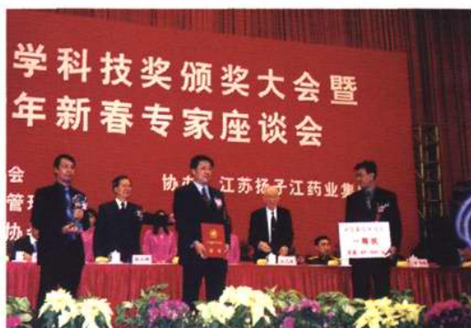
郝希山院士等科研人员参加医学科技奖颁奖大会暨 2002 年新春专家座谈会