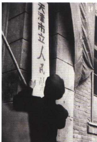
1951年人民政府接管馬根濟紀念醫院挂牌