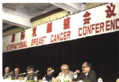
第一届国际乳腺癌会议