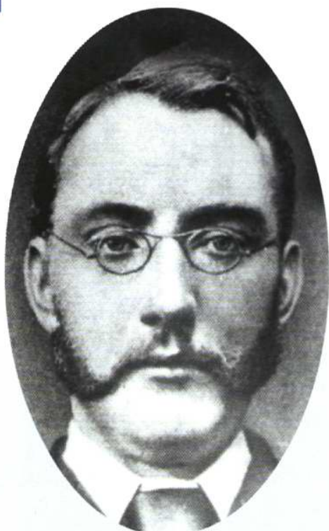
马根济 (Mackenzie) 像