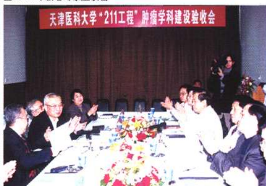
天津医科大学“211工程”肿瘤学科建设验收会