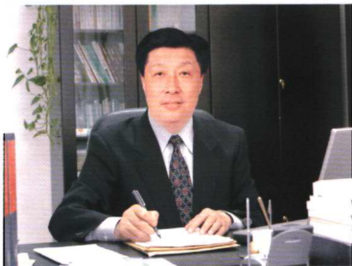
天津市肿瘤医院 天津医科大学附属肿瘤医院院长 郝希山