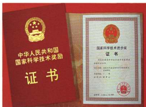
郝希山院士承担的“功能性间置空肠代胃术的临床与基础研究”获国家科学技术进步二等奖