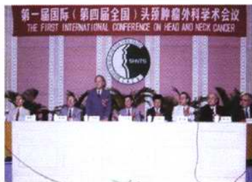
第一届国际头颈肿瘤会议