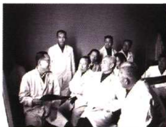
原卫生部部长钱信忠来我院视察