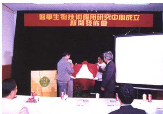
生物技术应用研究中心揭牌