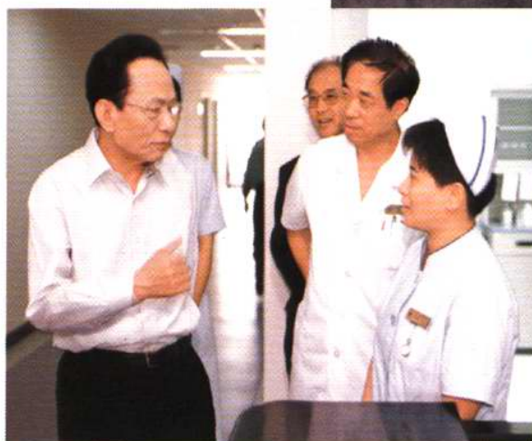
中共中央政治局委员、天津市委书记张立昌同志视察我院