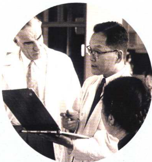
1957年金显宅教授与外国专家在讨论病例