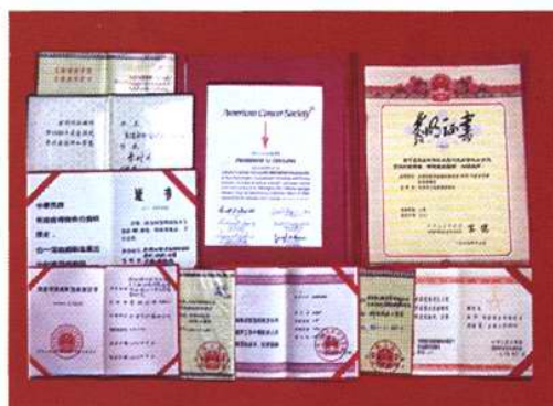
获得各级科技奖励证书