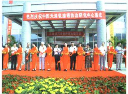
中国天津乳腺癌防治研究中心落成剪彩仪式