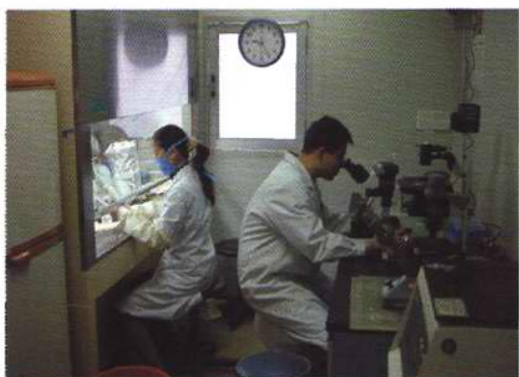
研究人员在细胞培养室中进行研究