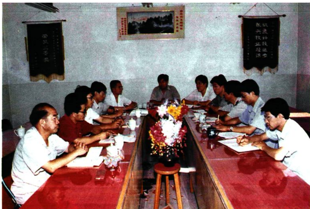
县畜牧食品局召开局站(场、司)负责人会议,专门研究出版《畜牧志》有关事宜。