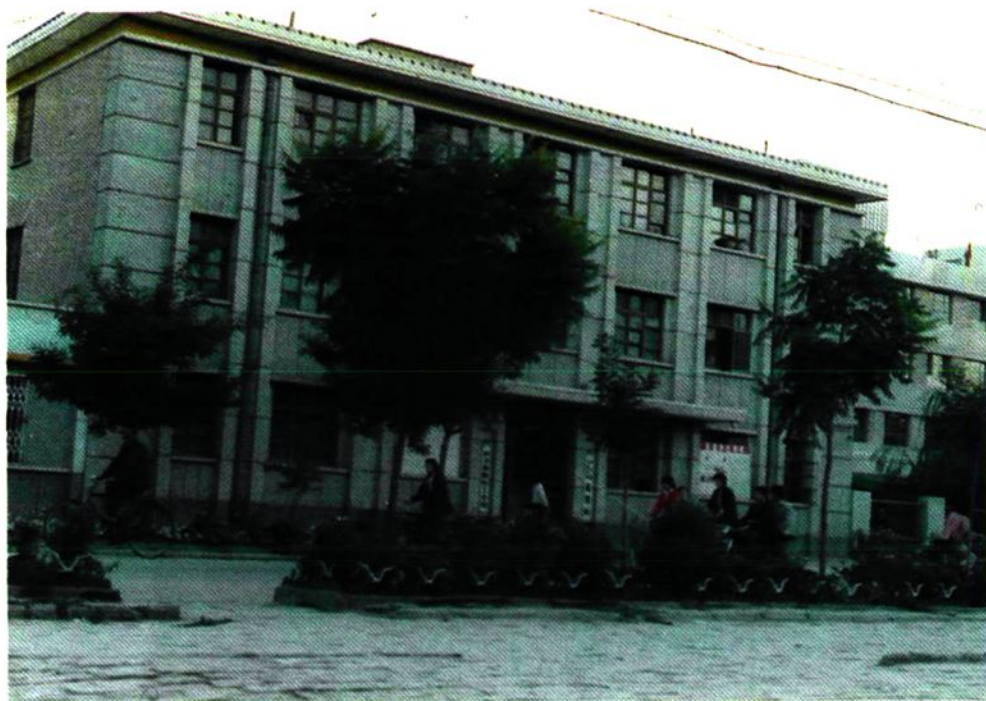
县畜牧食品局办公楼