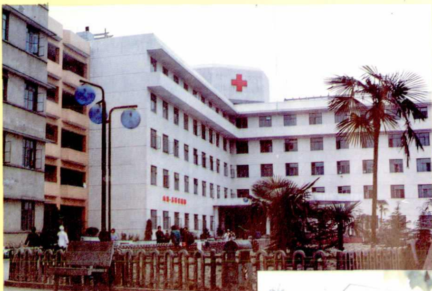
＜ 简阳县人民医院内儿科大楼