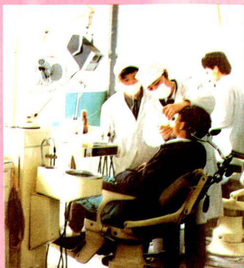
△ □ 牙科