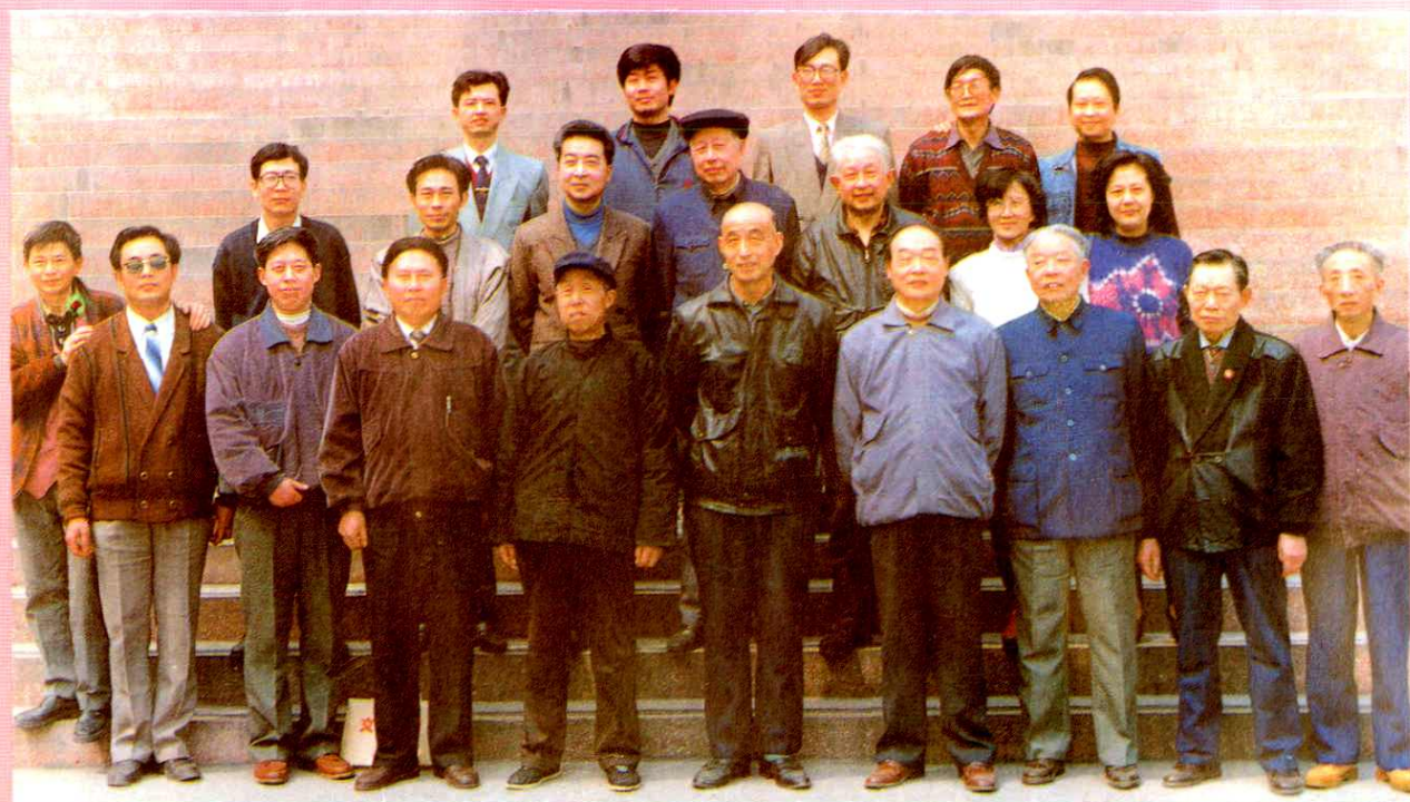
《内江地区卫生志》编纂领导小组及部分编辑人员合影