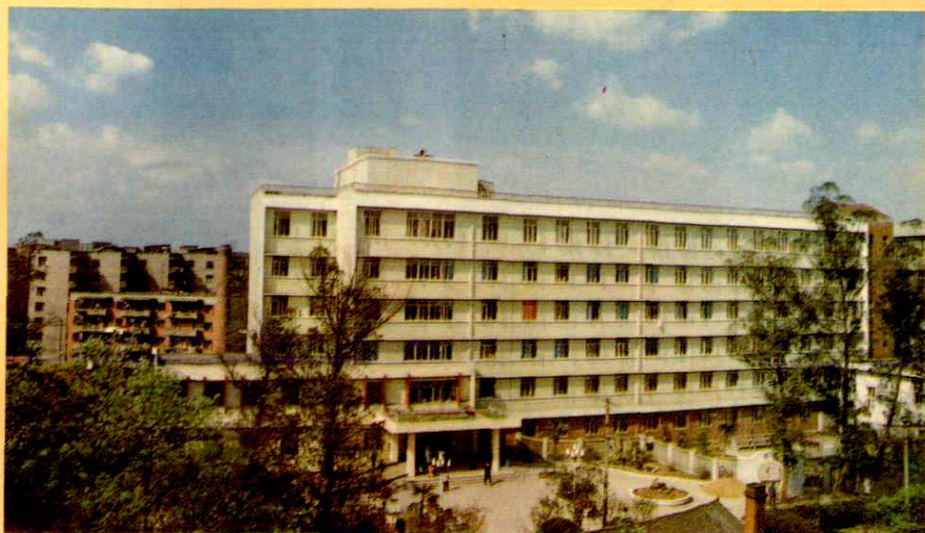
△地区第一人民医院手术科室大楼