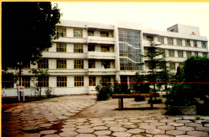
▽地区第二人民医院传染科大楼