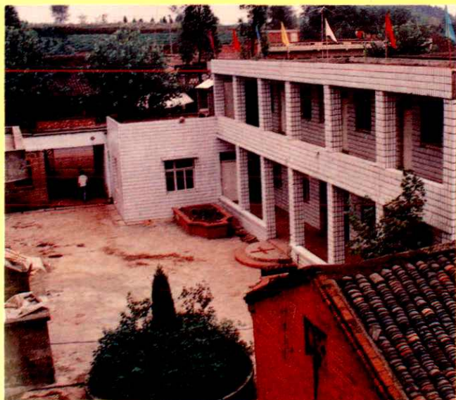
▽ 资阳县迎接乡卫生院