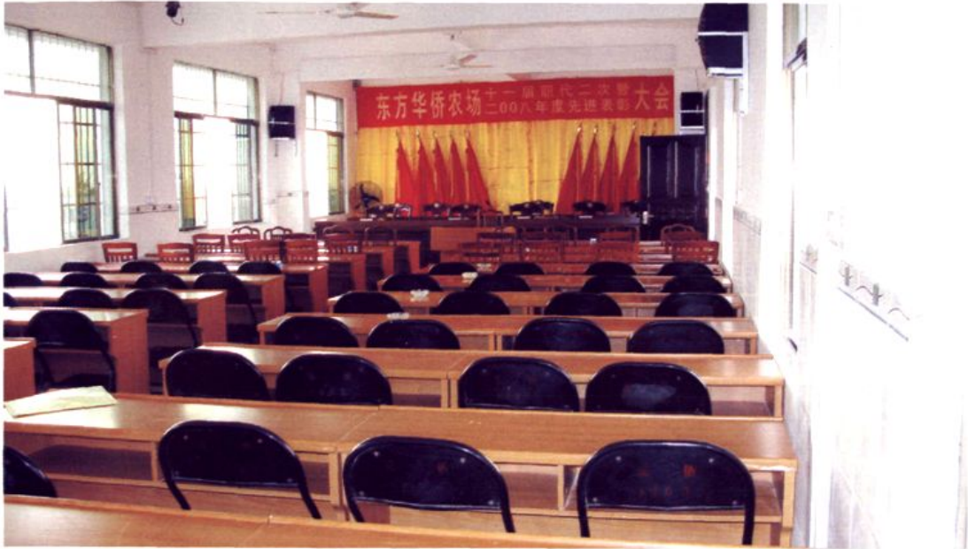
装饰一新的会议室