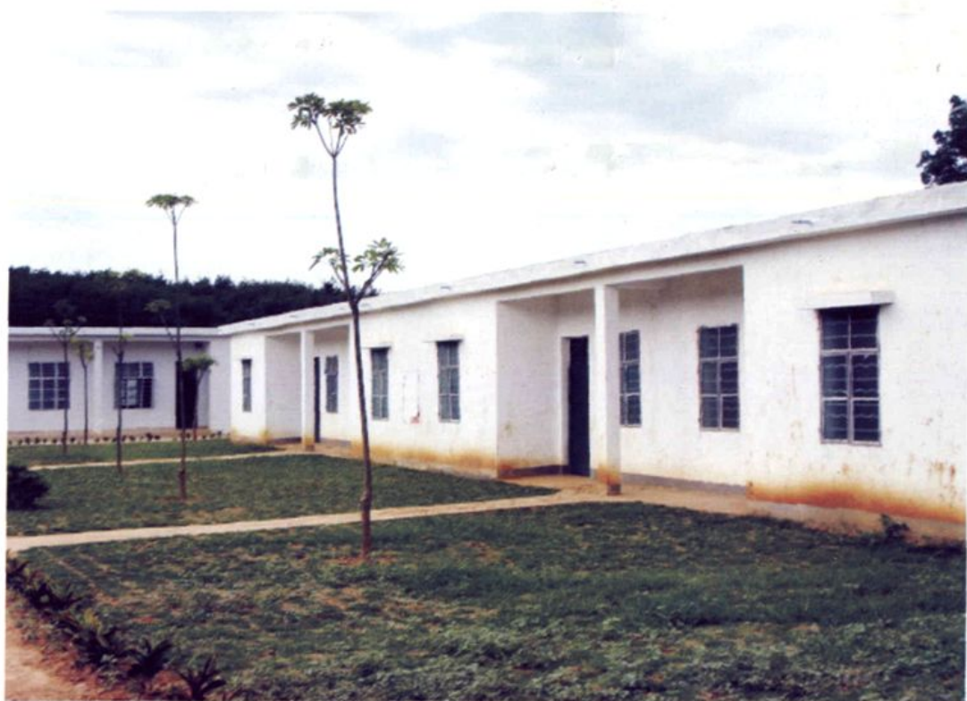
修葺一新的生产队职工住房