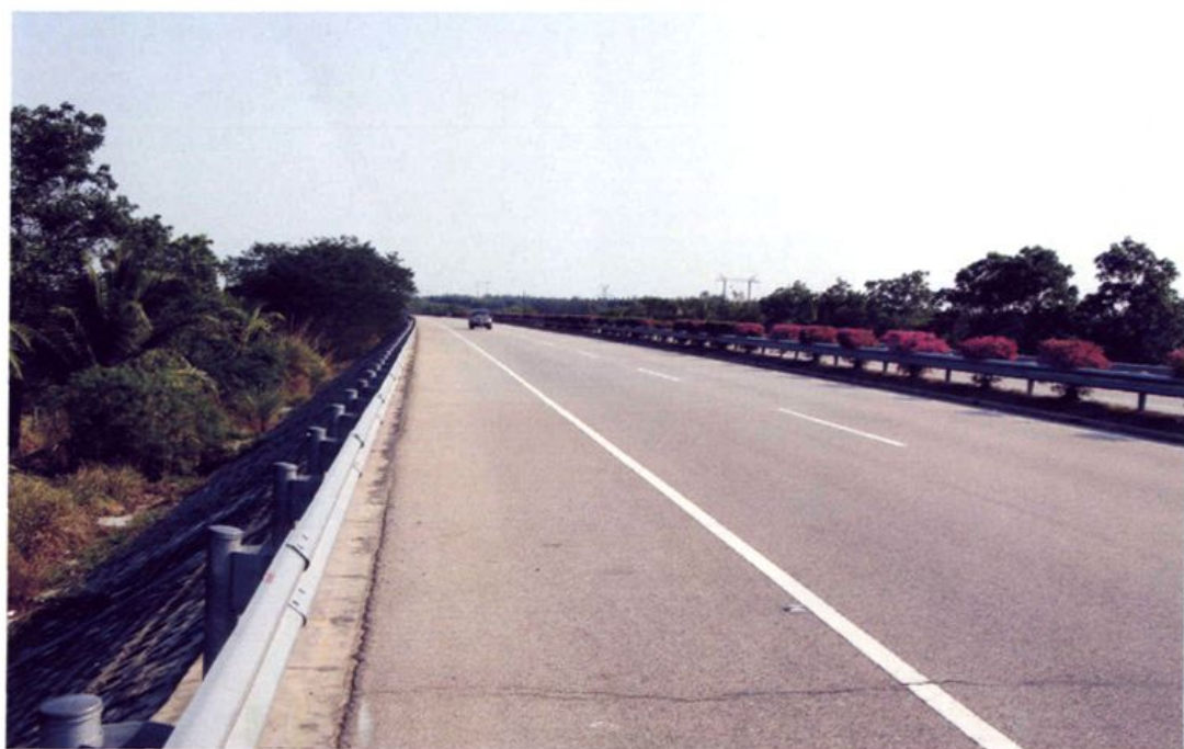
贯场而过的高速公路