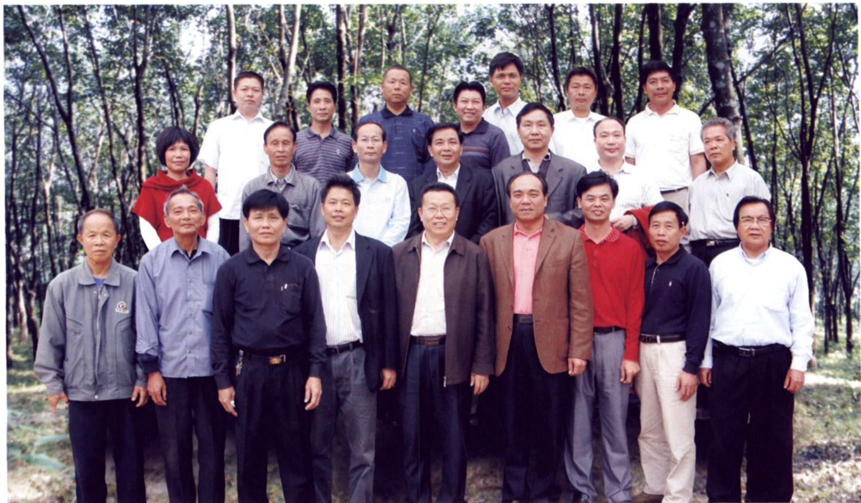
重聚家园——部分离场人员与农场领导留影胶园