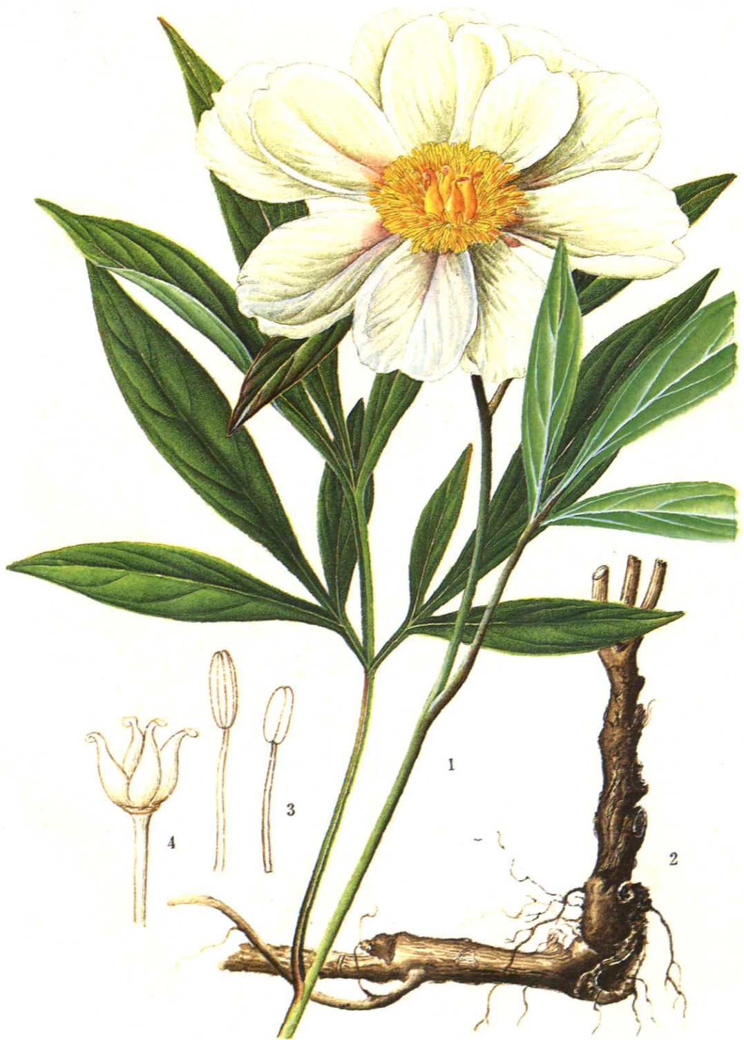
彩图 3 芍药 Paeonia lactiflora Pall. (王利生绘) 1. 花枝 2. 根 3. 雄蕊 4. 雌蕊