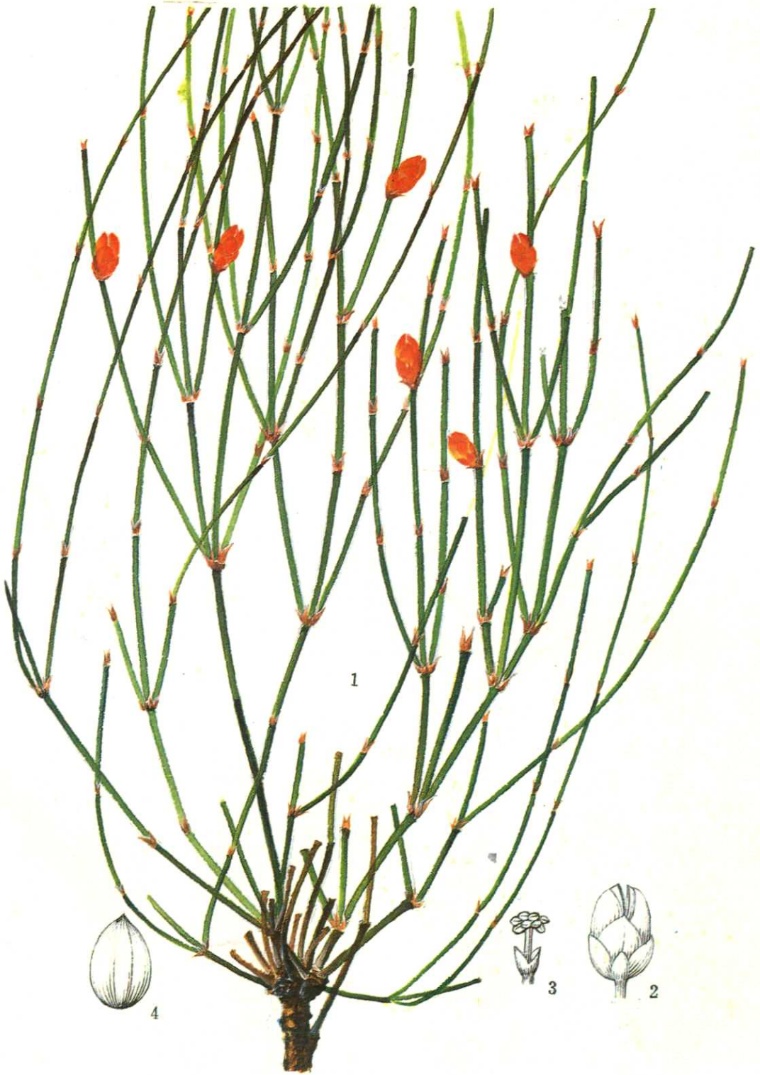
彩图 | 草麻黄 Ephedra sinica Stapf (王利生绘)