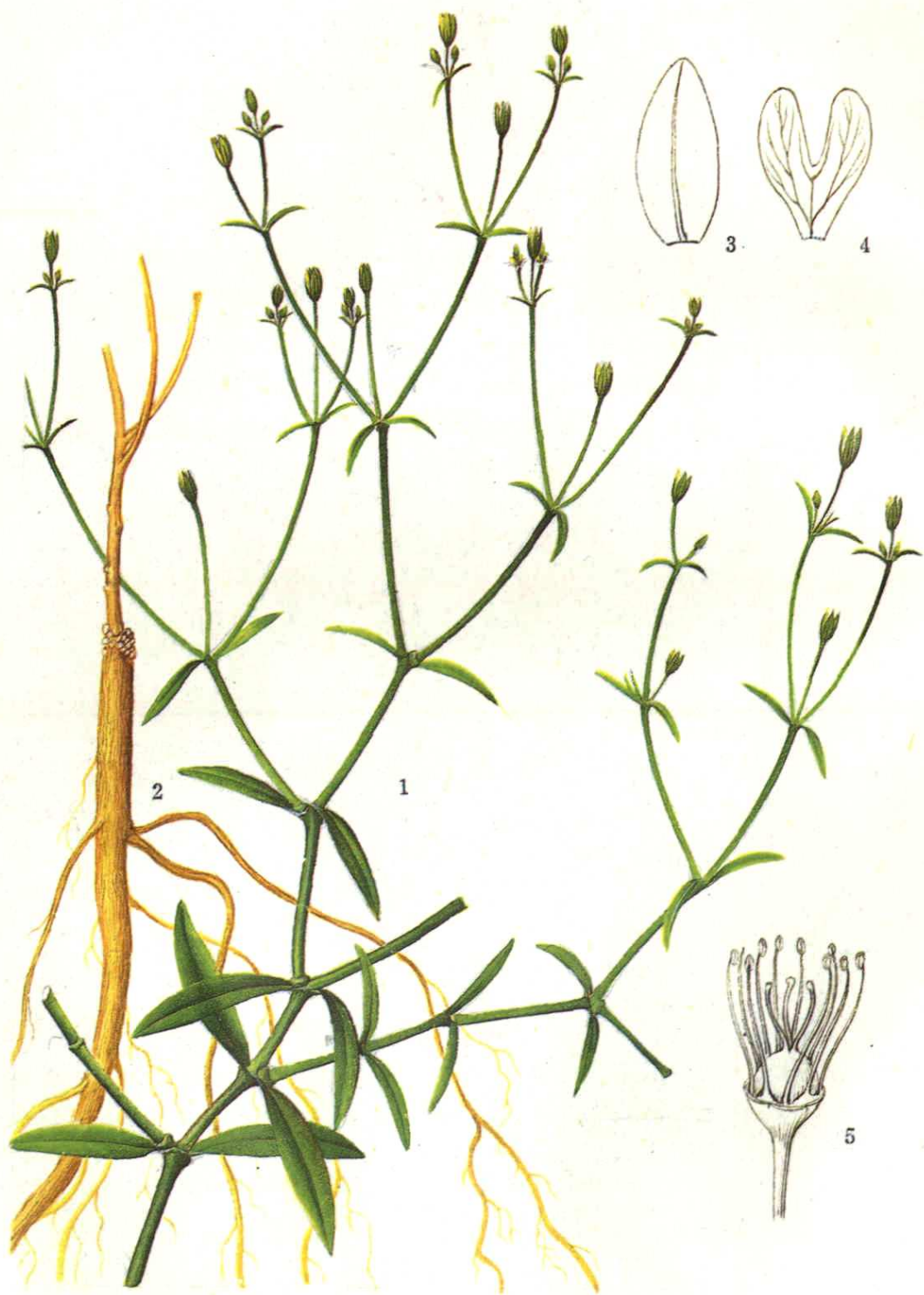
彩图 2 银柴胡 Stellaria dichotoma L. var. lanceolata Bge. (王利生绘)