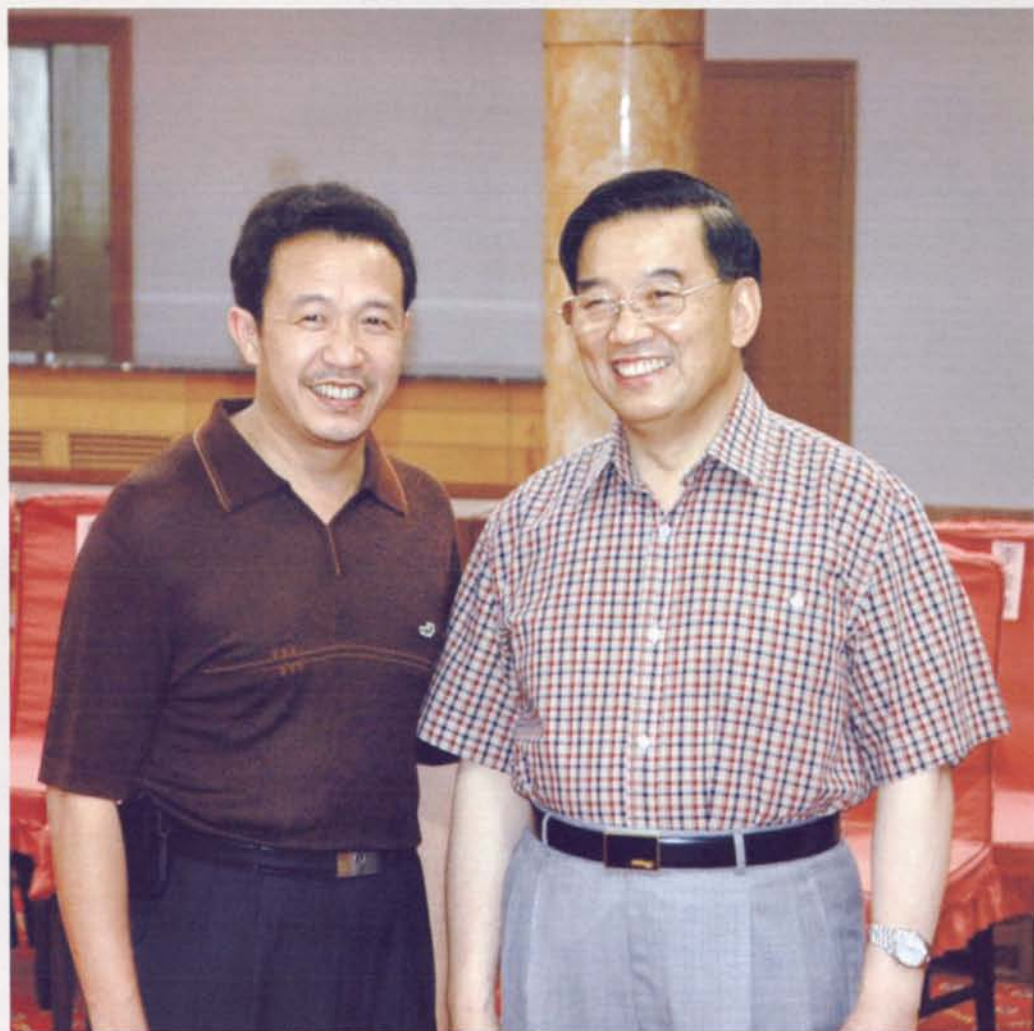
▲2004年6月，国家审计署审计长李金华在北京亲切接见局长许启志