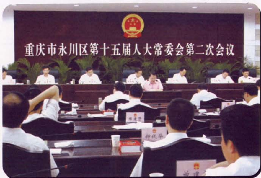
▲2007年5月30日，区人大常委会审议并全票通过 2006年度财政预算执行审计工作报告。