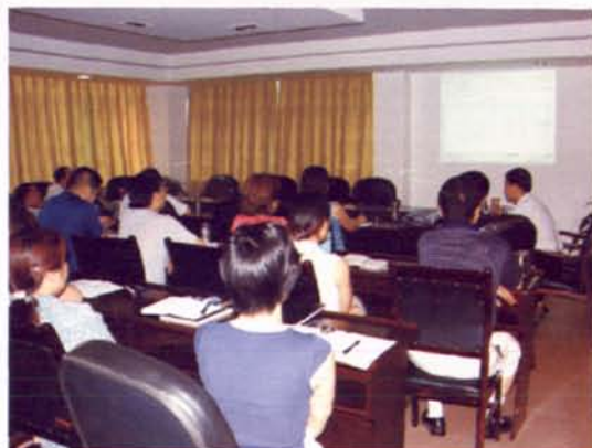
▲机关干部集中学习