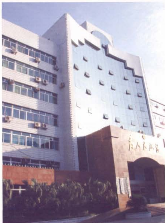
▲办公地点东一路19号