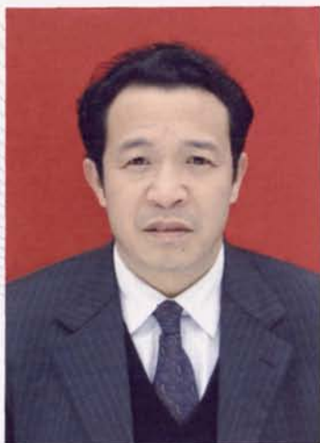
▲第四任党组书记、局长许启志