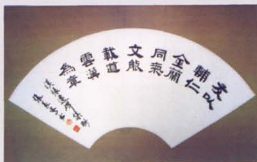
▲审计署庆祝审计机关成立二十周年书画摄影展优秀奖作品