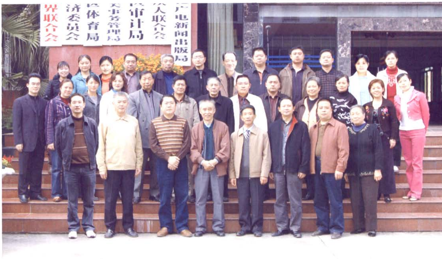
▲ 审计局部分在职职工及退休干部合影