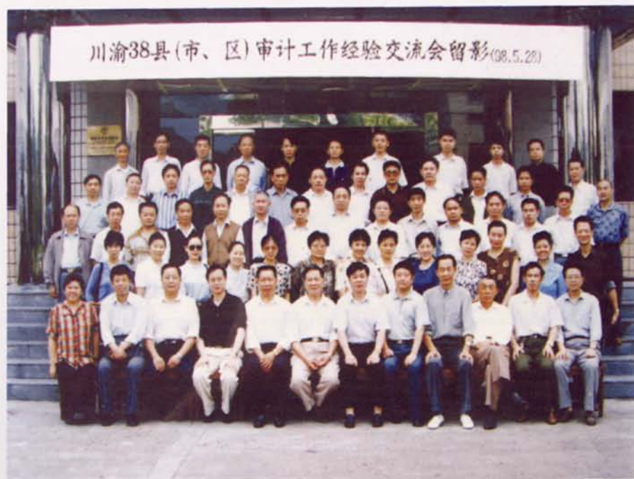
▲川渝38縣(市、區)審計工作經驗交流會在永舉行