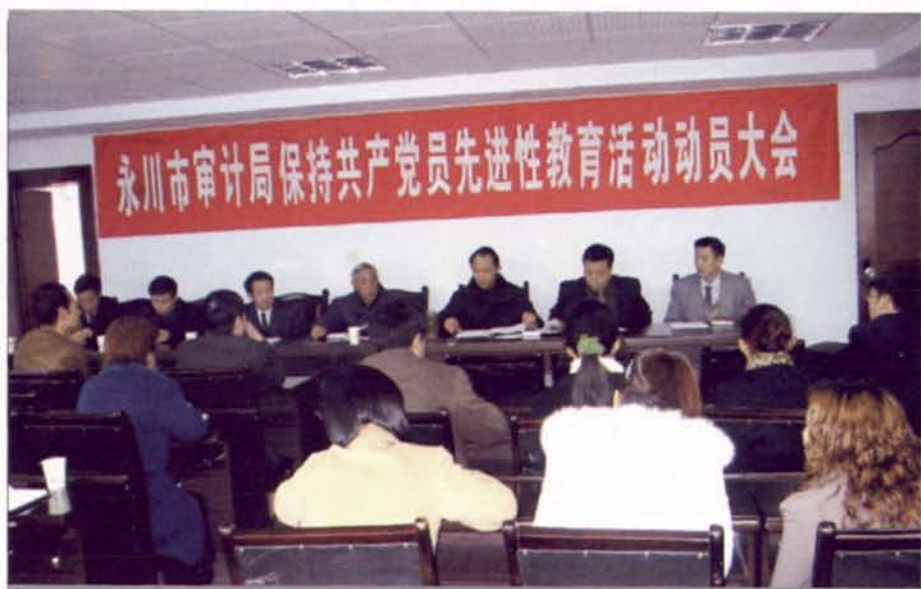
▲开展先进性教育活动