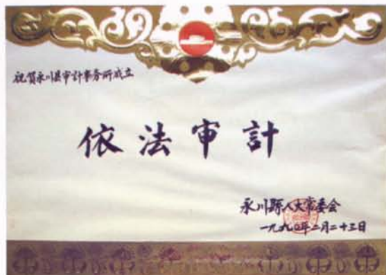
▲1990年审计事务所成立