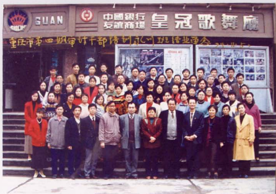
▲重慶市第四期審計幹部培訓永川班結業