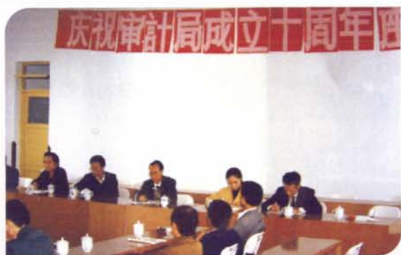
▲召开审计局成立十周年座谈会