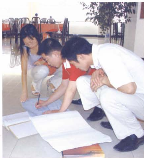
▲审计人员现场核对工程量