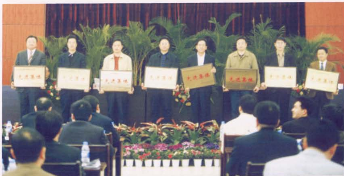
▲市政府表彰内审工作先进单位