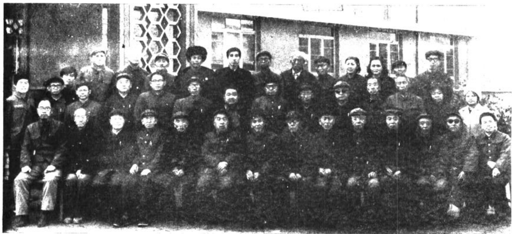
一九八一年六月政协霍县第四届委员会委员