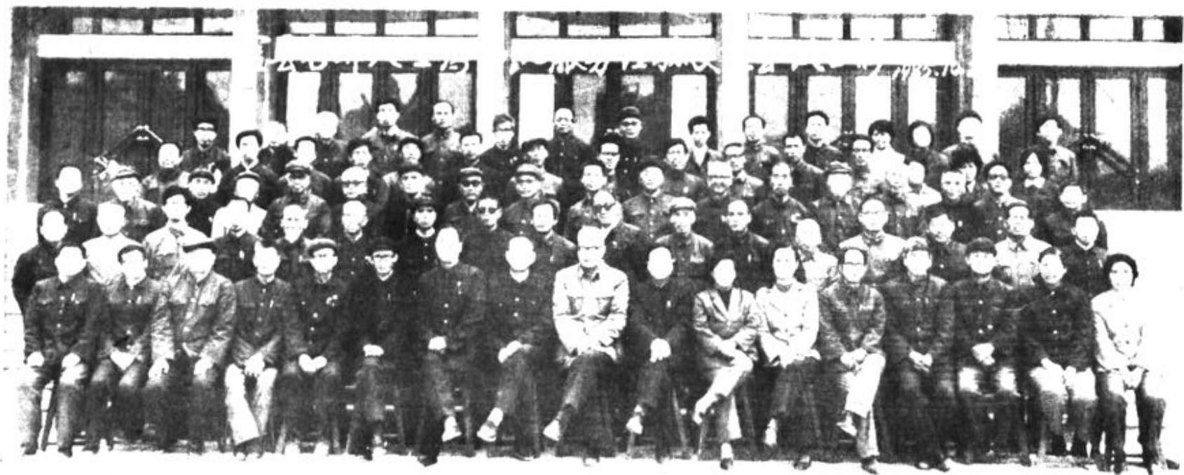
一九八五年十月各界人士为四化服务经验交流会代表