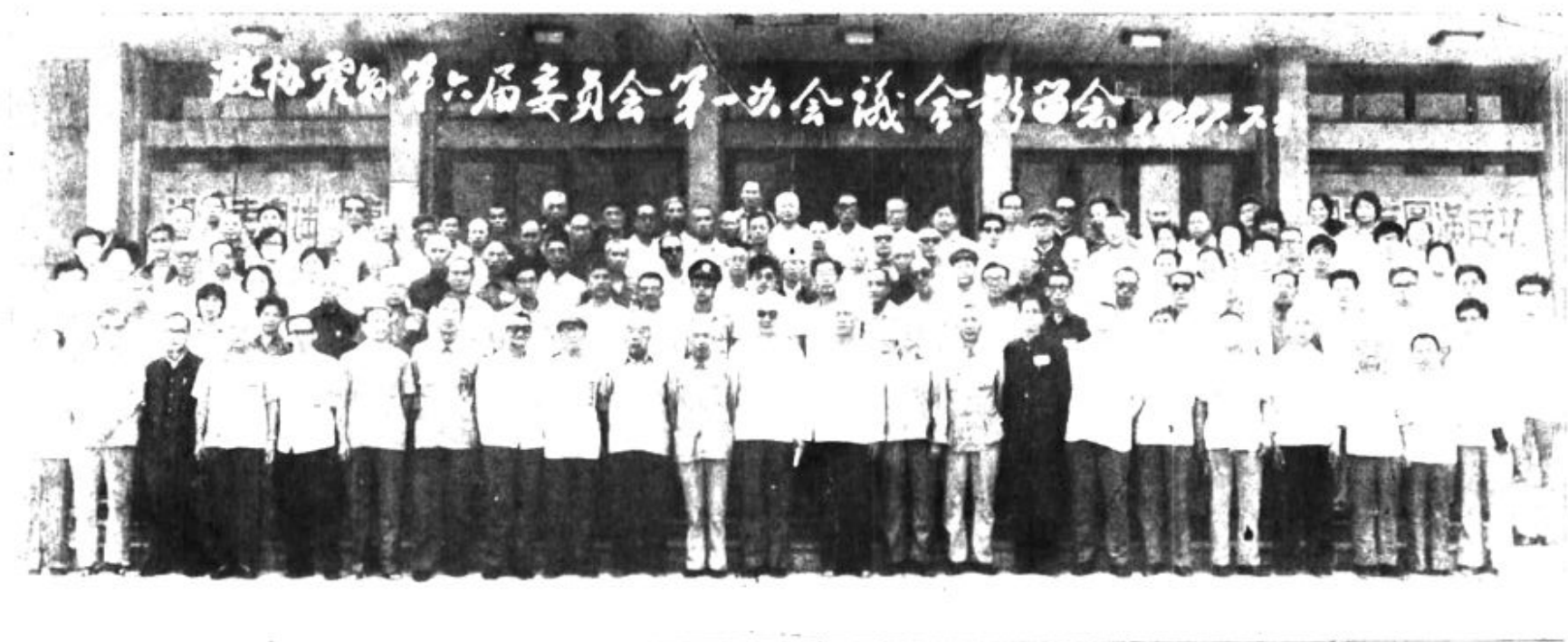
一九八七年七月政协霍县第六届委员会委员