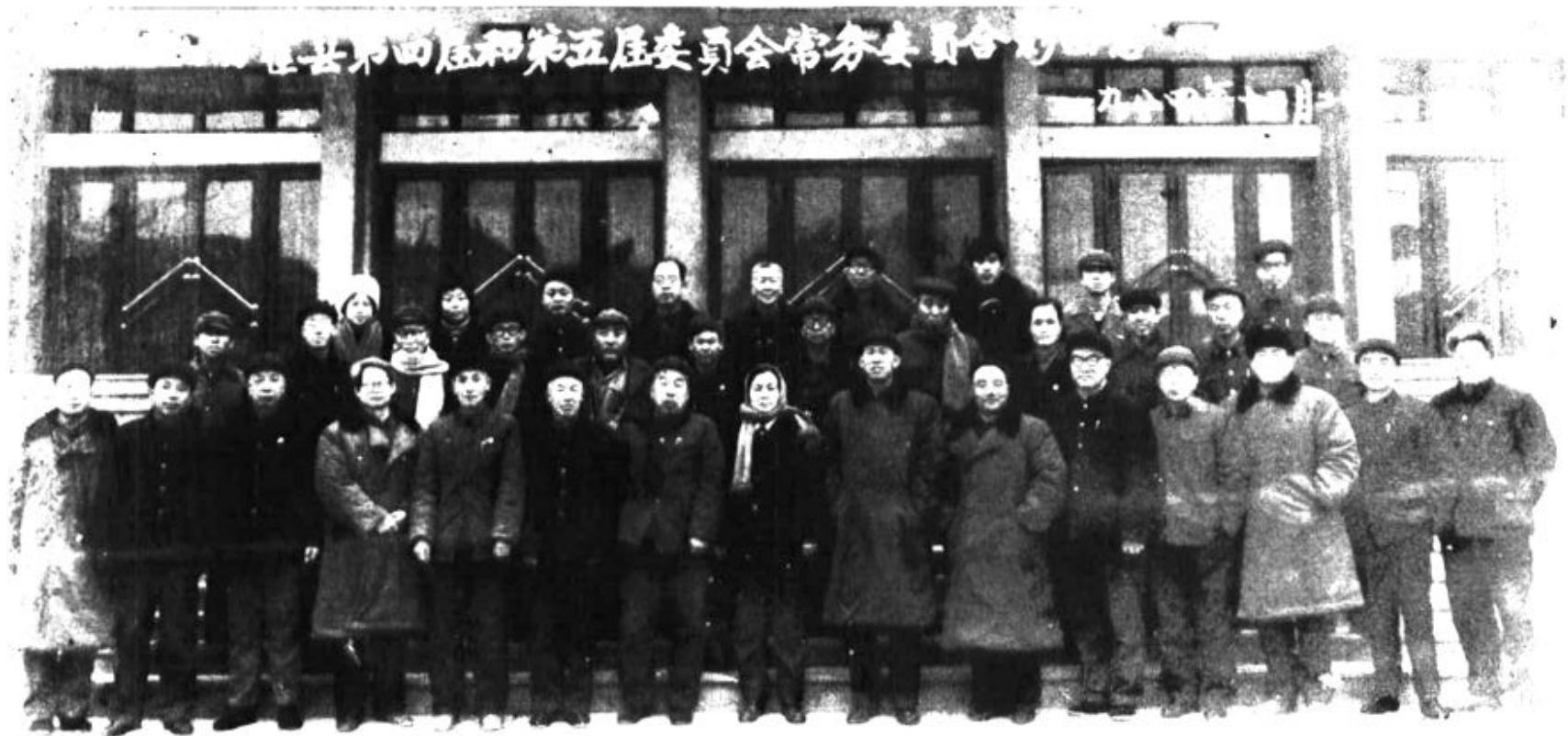
一九八四年十二月政协霍县第四、第五届委员会常务委员