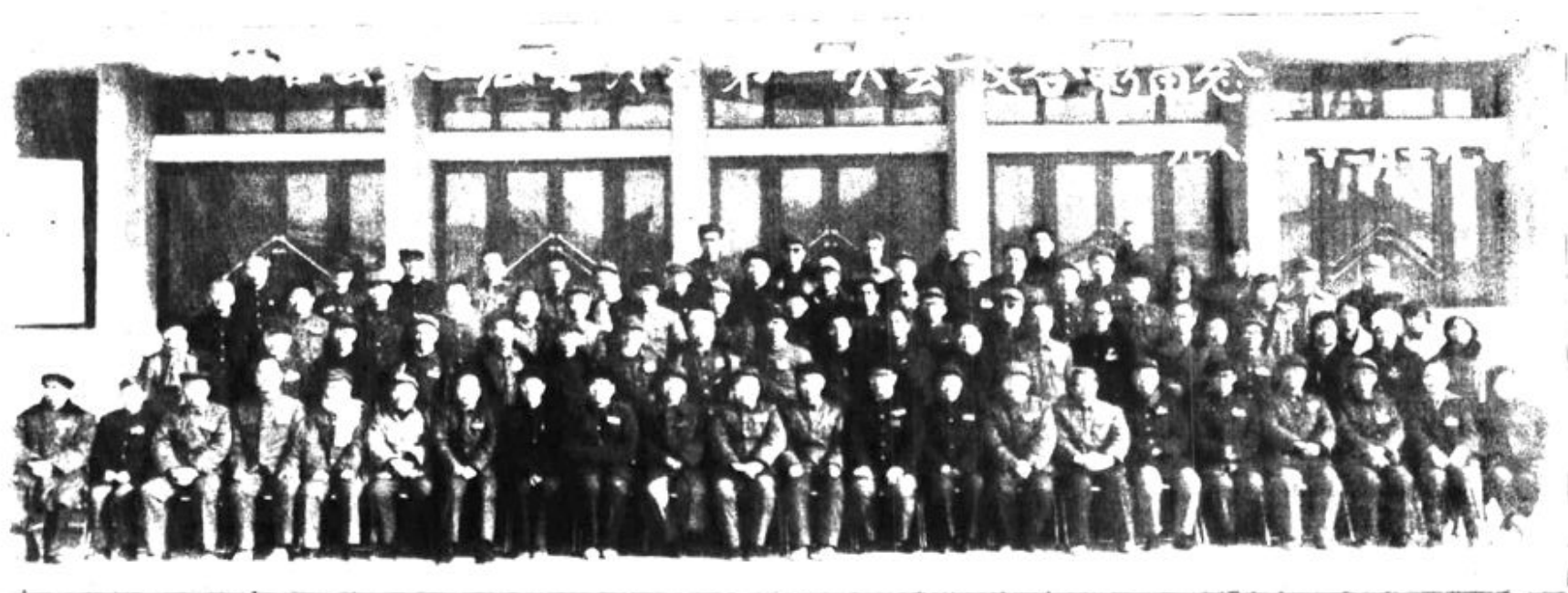
一九八四年十二月政协霍县第五届委员会委员