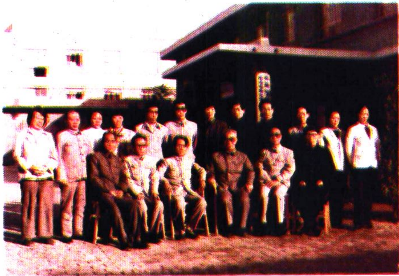
政协机关工作人员