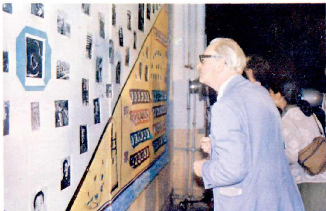
外宾参观我省监狱