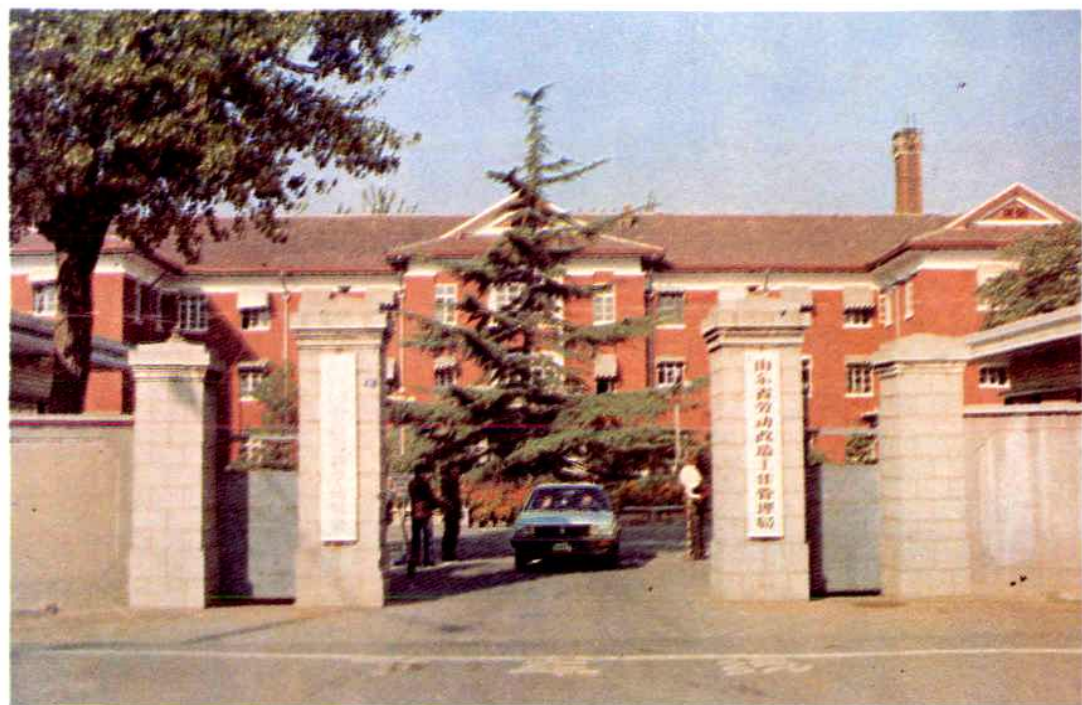
山东省劳改局机关