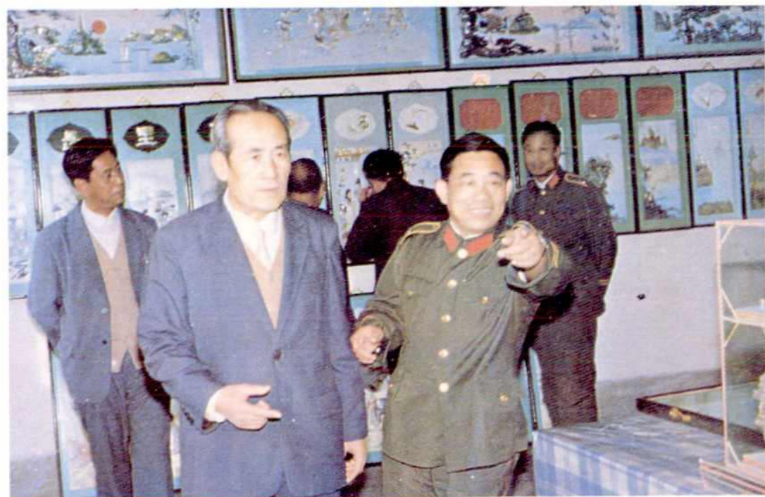
省政协副主席金宝珍视察北墅劳改支队