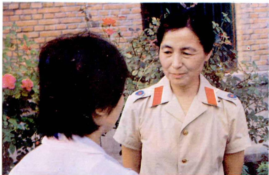
干警对服刑人员进行个别谈话教育