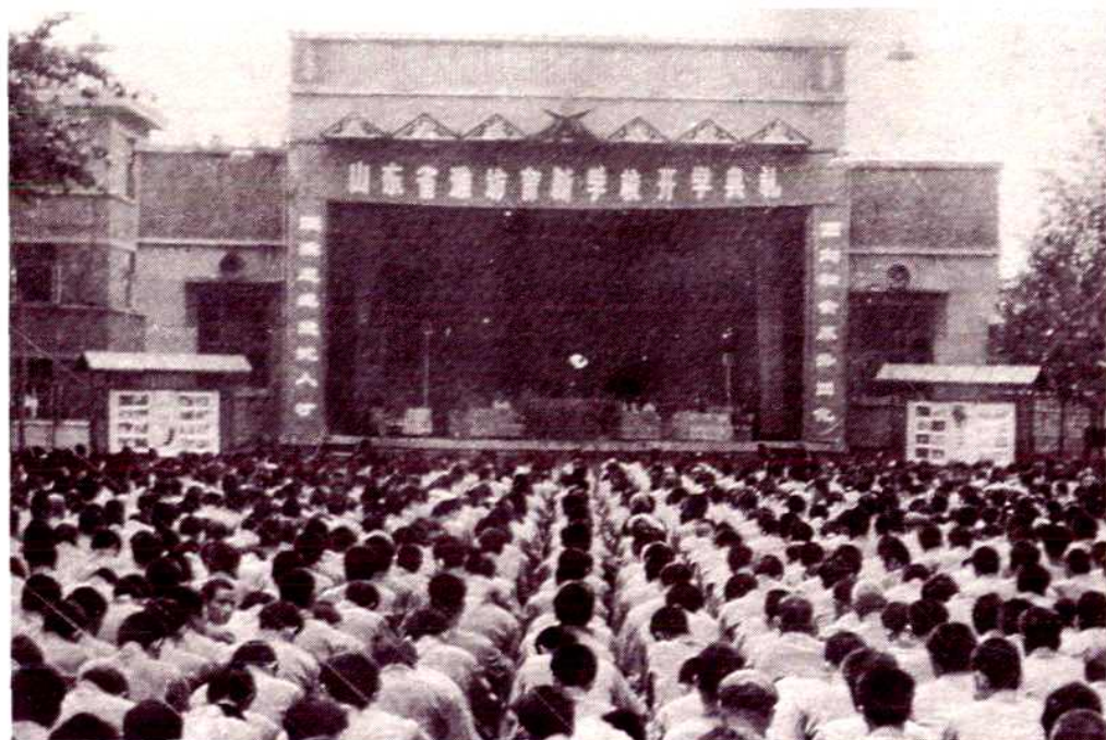
1982年全国第一个把劳改场所办成特殊学校的潍坊劳改支队