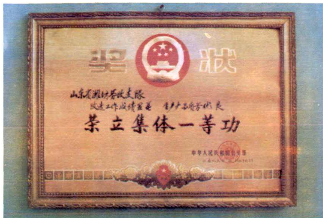
1983年全国第一个被公安部荣记集体一等功的潍坊劳改支队