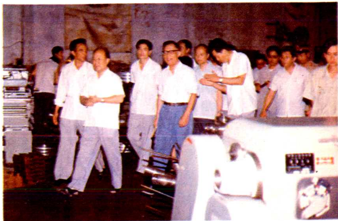
国务委员张劲夫、司法部部长邹瑜视察青岛劳改支队