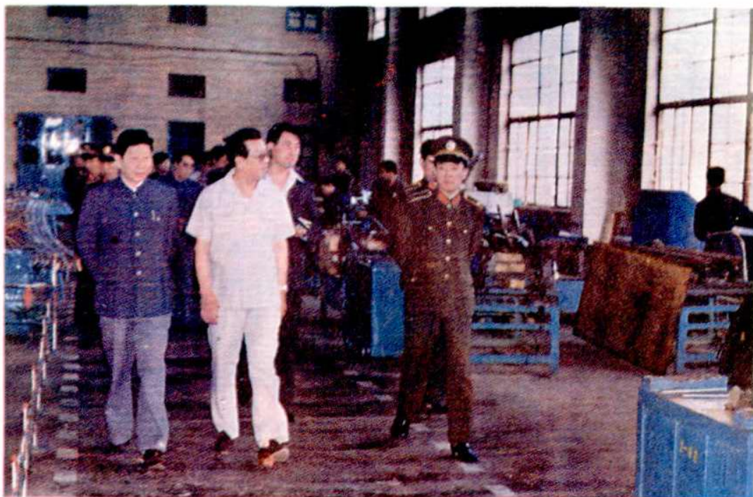
著名思想家、中宣部局级研究员曲啸同志参观省第一监狱