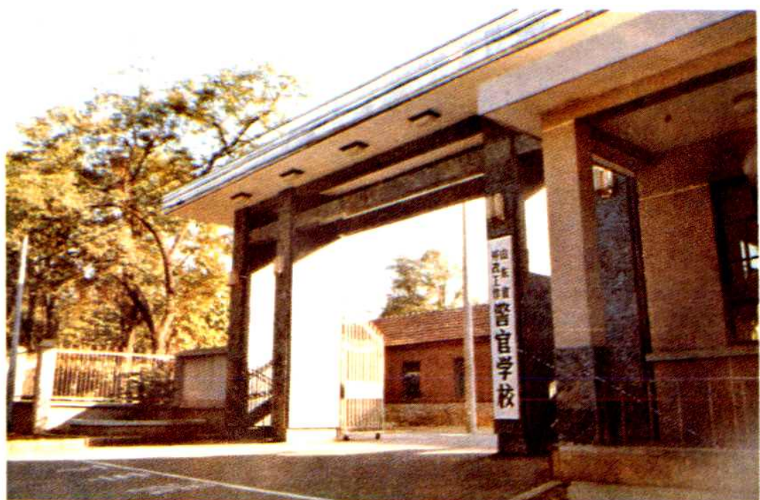
山东省劳改工作警官学校