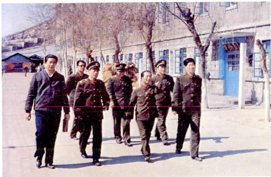
司法部副司长王明迪视察济南劳改支队