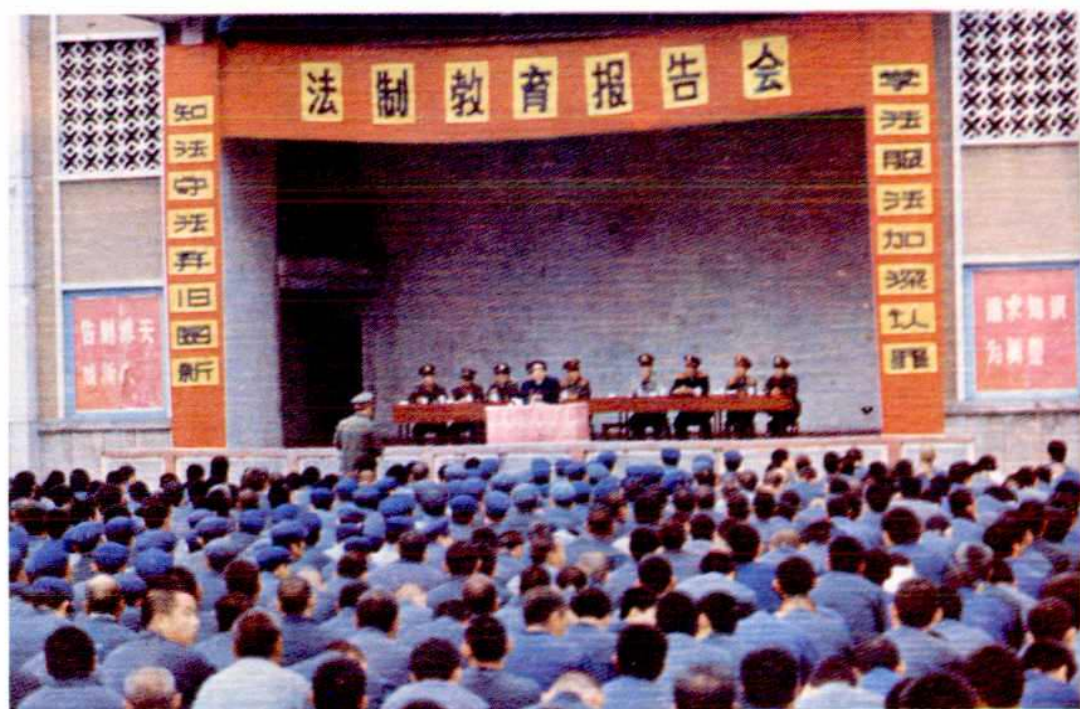
对服刑人员进行法制教育