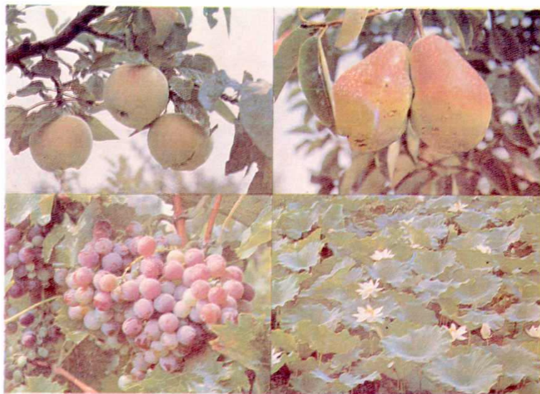
劳改农场的丰硕成果