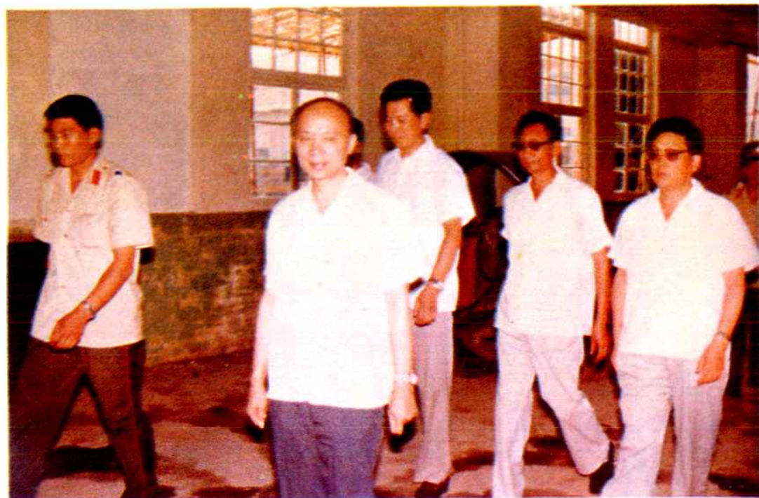
司法部部长邹瑜、副部长顾启良、山东省副省长马连礼视察潍坊劳改支队