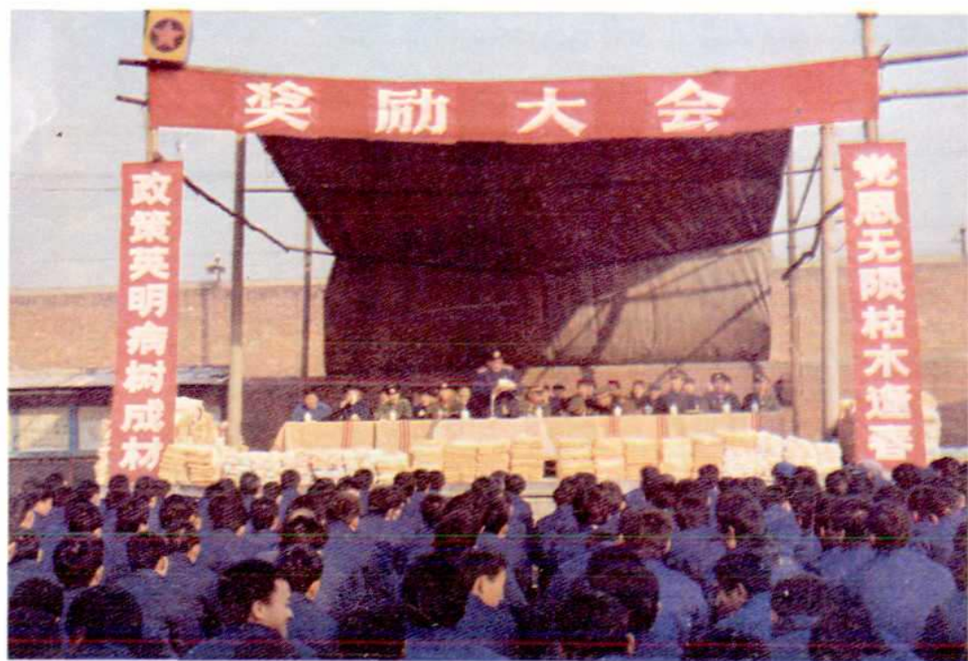
对服刑人进行奖惩