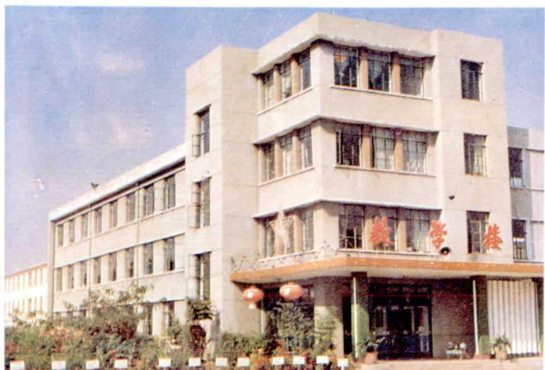
特殊学校的教学楼