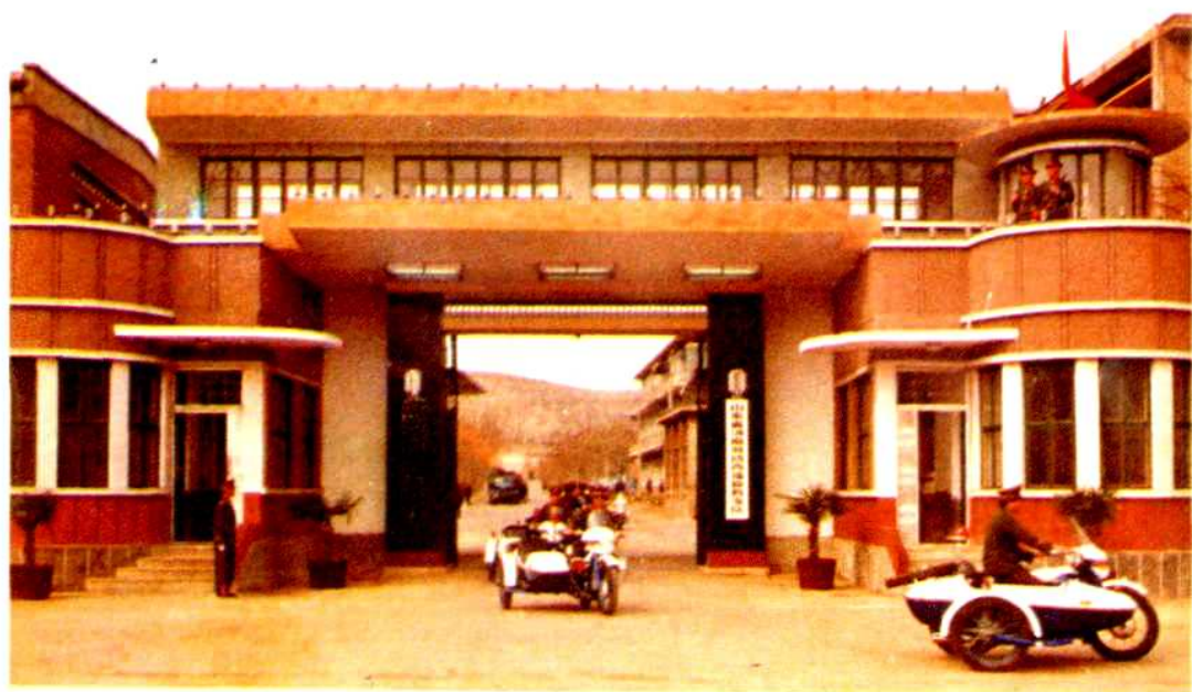
山东省济南劳改支队