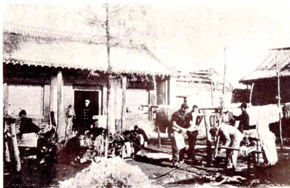
1950年昌潍专区劳动改造队犯人工手生产情形