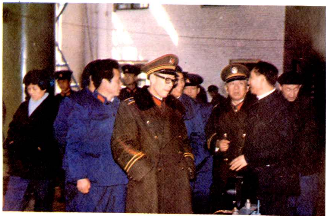
司法部副部长李石生、司法部劳教局副局长葛光荣视察潍坊劳改支队