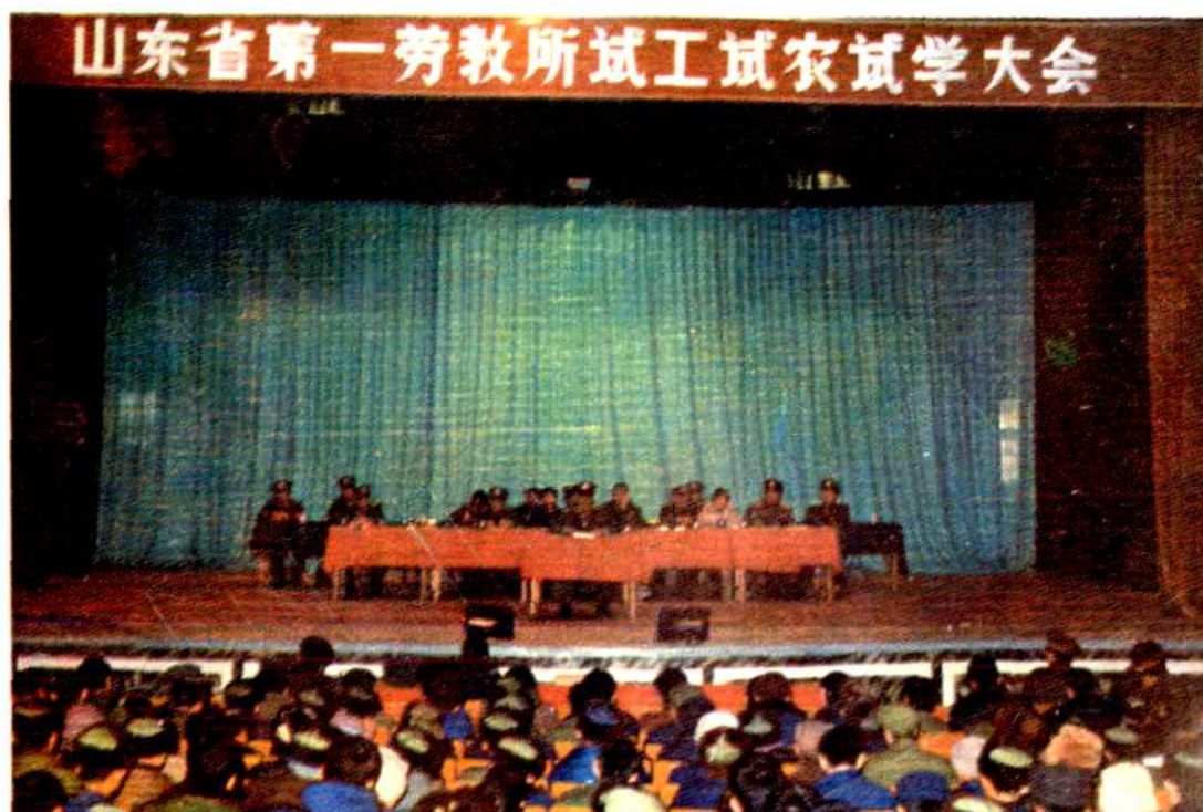
1983年省第一劳教所在全国最早采用“试工、试农、试学”(简称三试)的方法对劳教人员进行改造