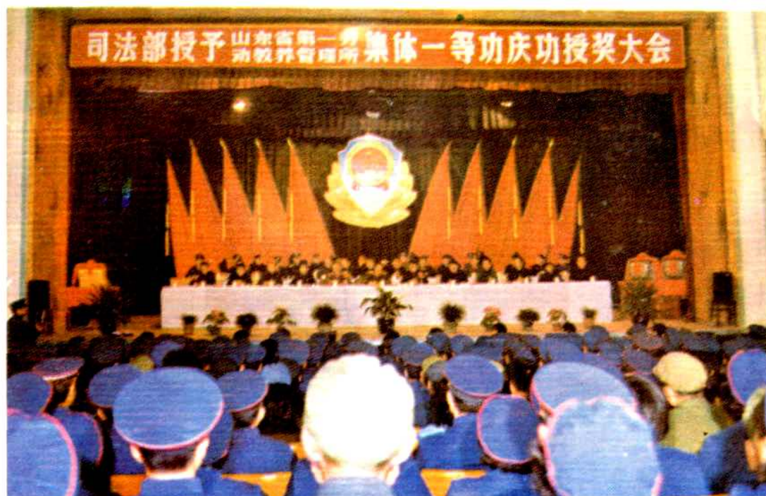
1985年全国第一个被司法部荣记集体一等功的省第一劳教所