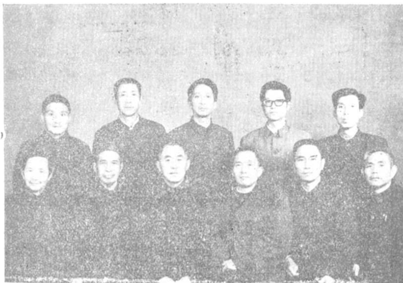
《交通志》编辑领导小组及编辑人员