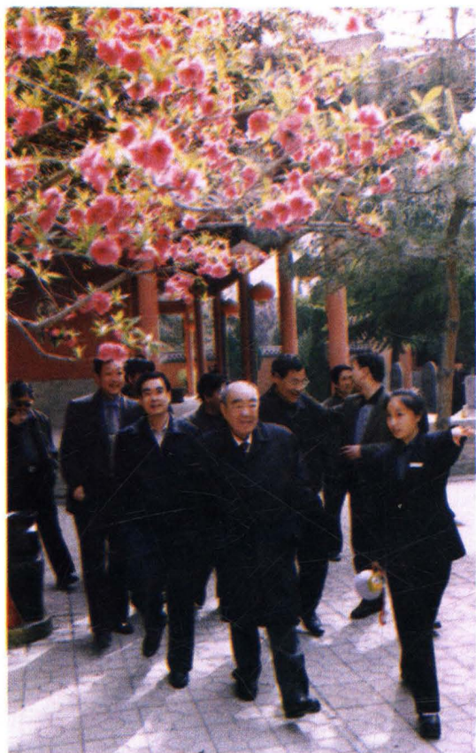
2002年3月，全国人大副委员长布赫（前中）在永济视察