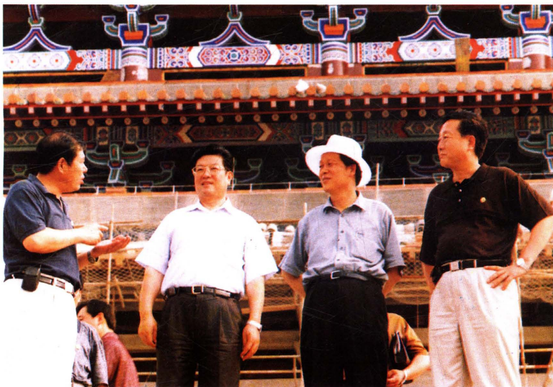
2002年，中共中央政治局委员王兆国（左二）视察永济旅游事业