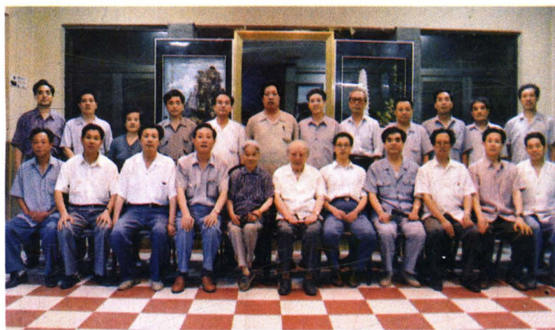
1995年6月，全国政 协副主席钱伟长（前排 右六）视察永济时与市 四大班子合影