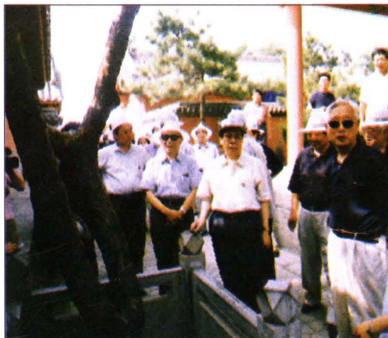
2002年，全国政协副主席 张思卿（前排右一）在永济视察