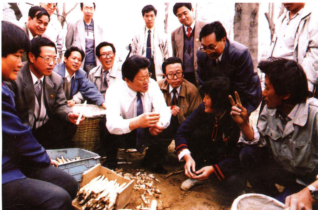
1996年4月，中共中央政治局委员、国务委员 李铁映（中）在永济视察时和笋农亲切交谈