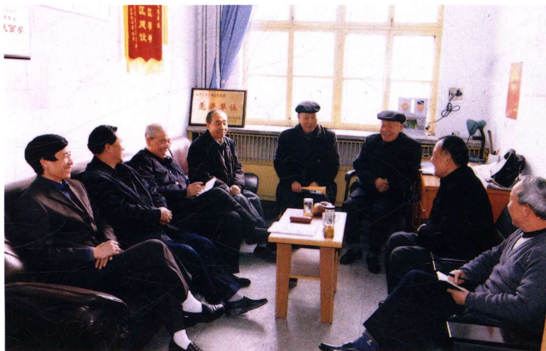
永济市老促会领导班子在研究工作