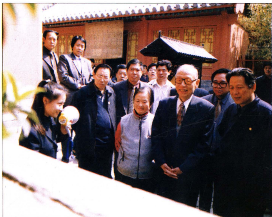
2002年5月，全国政协副主席任建新（前排右二）在永济视察