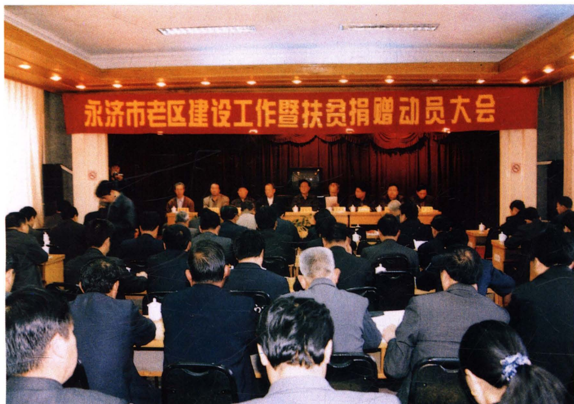
2002年4月，永济市召开老区建设工作暨扶贫捐赠动员大会