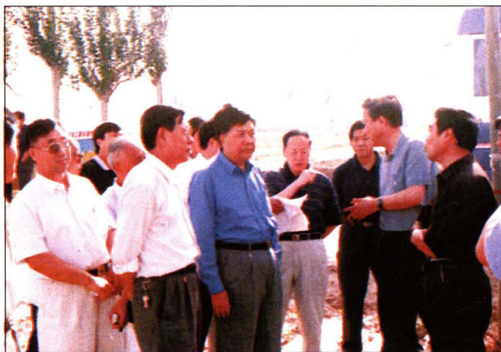
山西省副省长范堆相 (前排左三)在运城市市 长王守楨(前排左四)、 副市长安德天(前排左二) 陪同下在永济调研