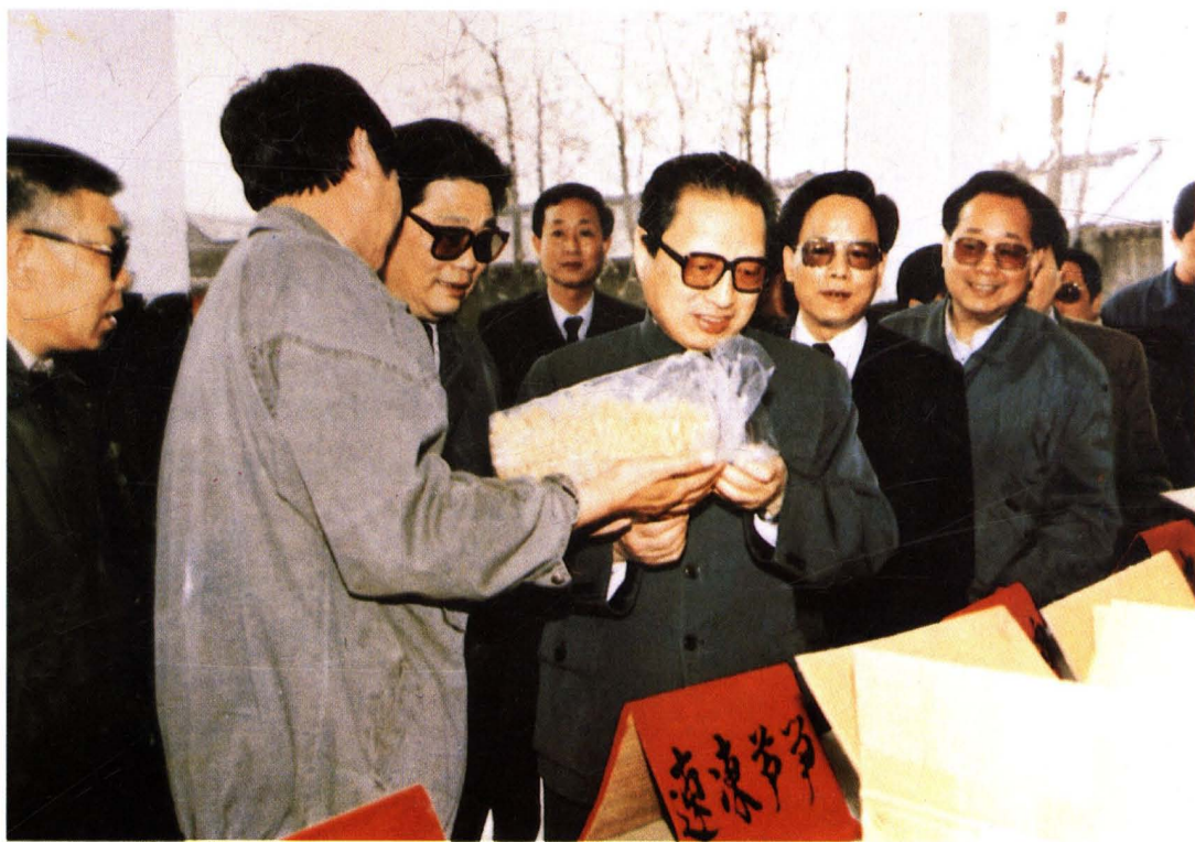
1992年，全国人大常委会委员长乔石（左五）在永济视察