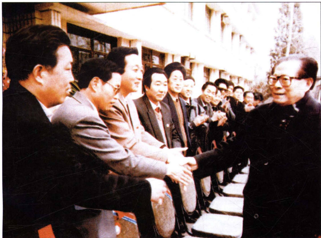
1994年1月，中共中央总书记江泽民在永济视察时接见永济市四大班子部分领导成员