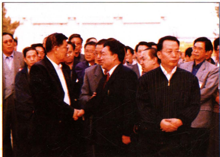
中共山西省委书记田成平 (前右)、省长刘振华(前左) 在永济调研