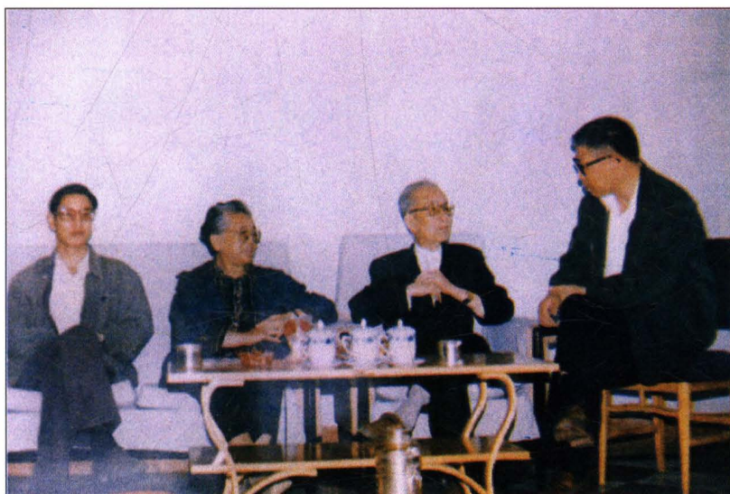
原中共中央政治 局候补委员、书记处 书记李雪峰（右二） 在永济