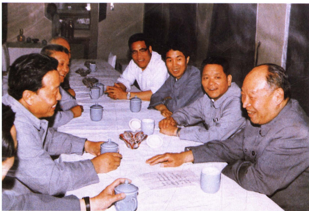
1986年5月，全国人大常委会委员长彭真（右一）在永济视察时听取地、县领导汇报工作