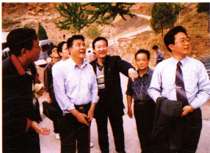
原山西省政协主席郑社 奎(前排左二)在永济调研