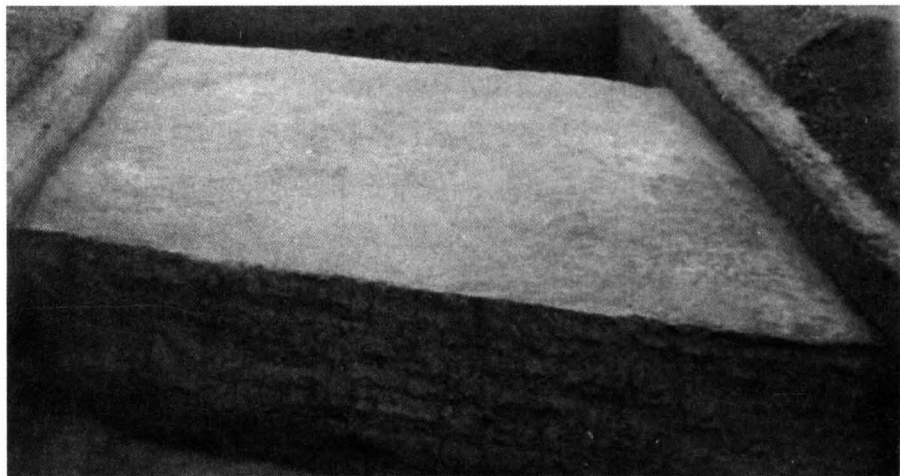
常兴镇柳巷遗址内的夯土墙

唐宋以来，眉县经济快速发展，文化更加繁荣。唐玄宗携杨贵妃多次巡游汤峪，沐浴凤泉神水；众人熟知的八仙，汇聚钟吕坪，留下了不少神奇的传说；“诗仙”李白，迷恋太白山的秀丽风光，写下了许多吟唱太白山的千古绝句；文豪苏轼，在凤翔府任职期间，心系百姓疾苦，数次赴太白山祈雨；关学宗师张载，胸怀四方，忧国忧民，实验井田，创办书院，著就了名垂千古的哲学巨著《正蒙》，创立了博大精深、气势恢