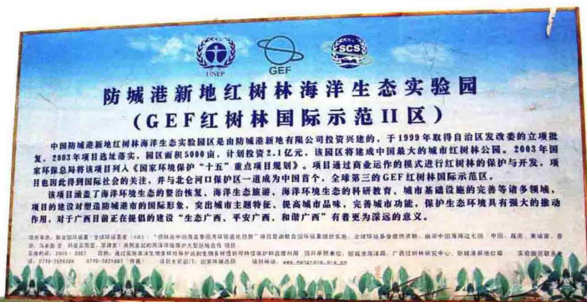
渔沥岛东部红树林 海洋生态实验园