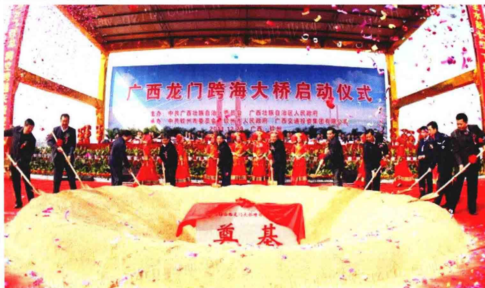
北部湾标志性建筑 龙门跨海大桥盛大开工