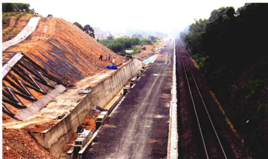
港口区高铁路基施工现场