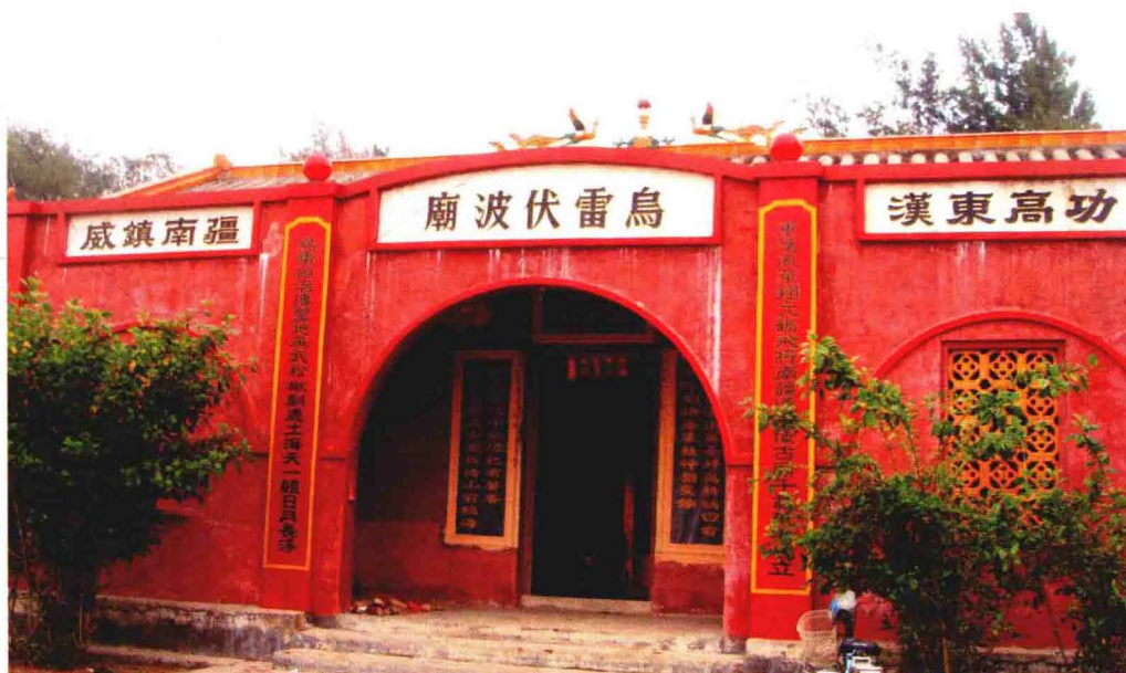
钦州湾东岸的 乌雷伏波庙