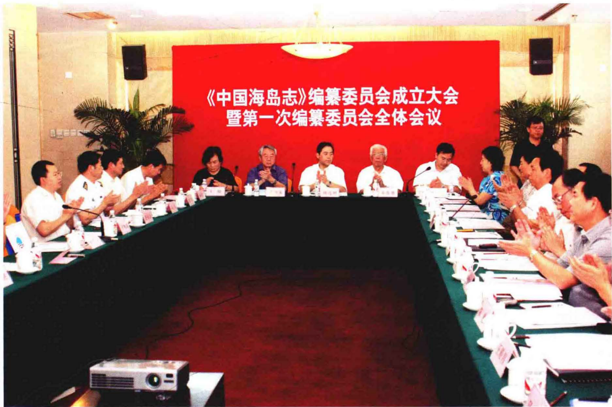
《中国海岛志》编纂委员会成立大会暨第一次编纂委员会全体会议