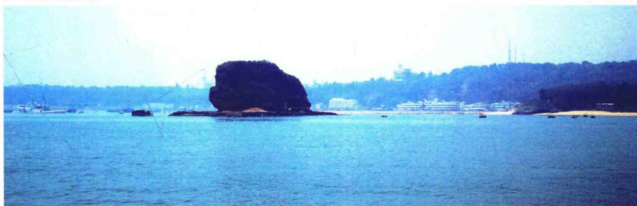
涠洲岛南湾龟豚拱碧胜景