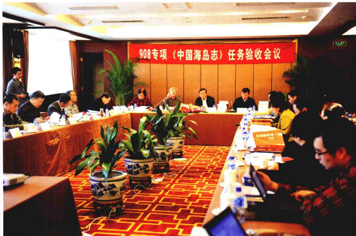
908专项《中国海岛志》任务验收会议