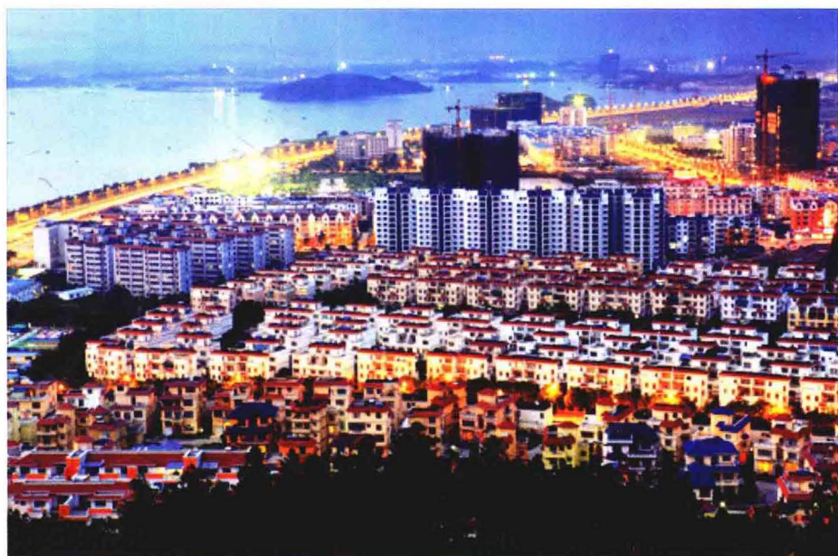
华灯初上的 防城港居民新区