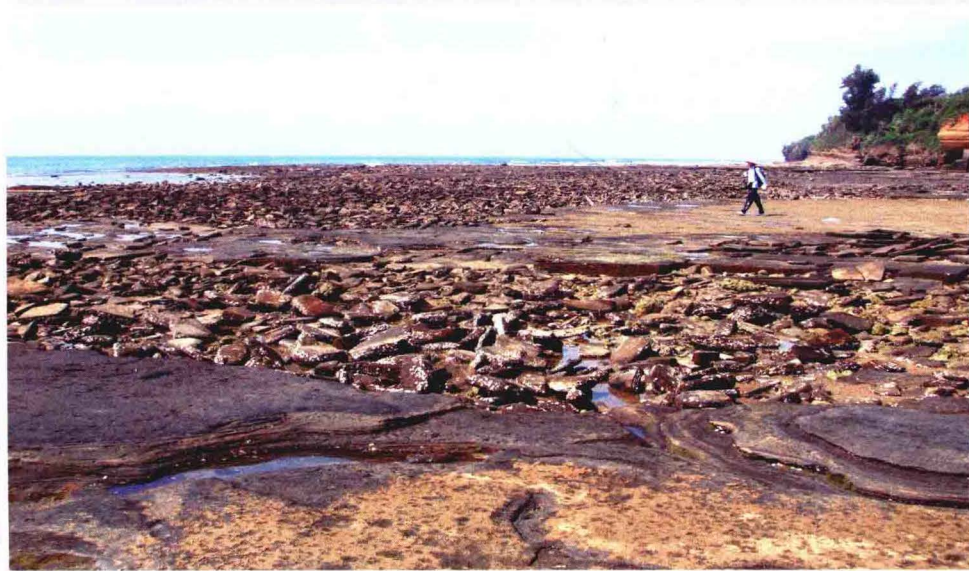
涠洲岛南湾东口的芝麻滩