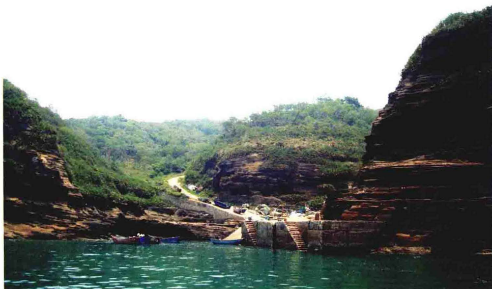
斜阳岛西北部灶门湾码头