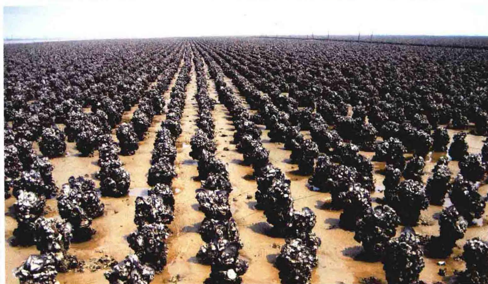
茅尾海东北部 大蚝养殖区