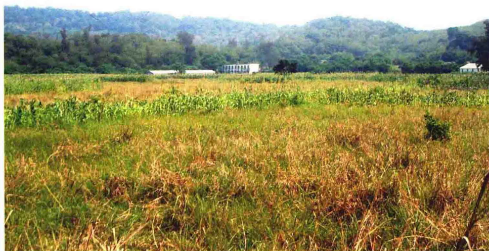
葱翠环抱的斜阳岛村落