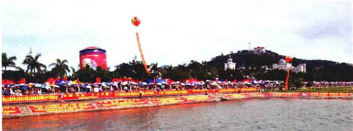
扮靓的防城港西湾喜迎国际龙舟节