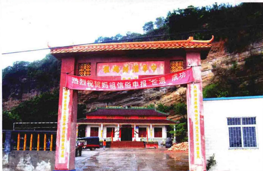
涠洲岛南湾码头附近的妈祖庙