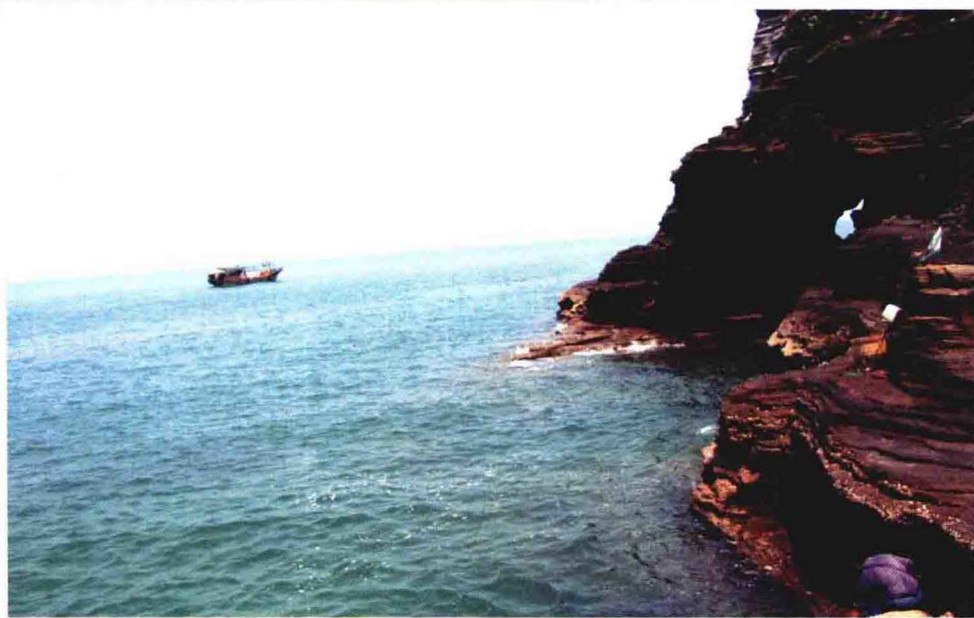
斜阳岛东北部海岸 石象饮水图