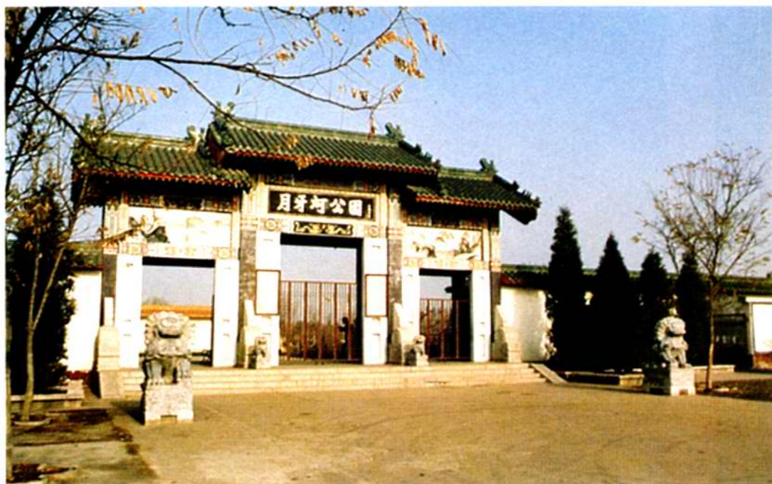
咸水沽月牙河公园