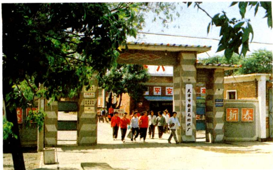
天津市新亚毛纺织厂