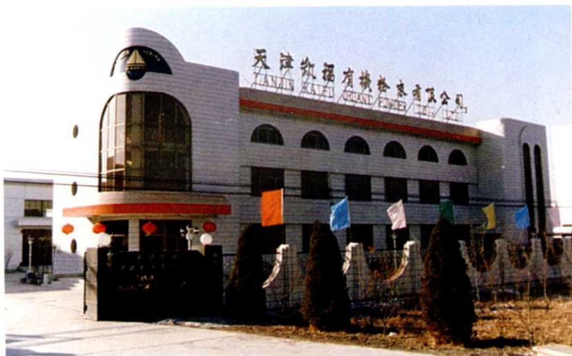
天津凯福有机粉末有限公司