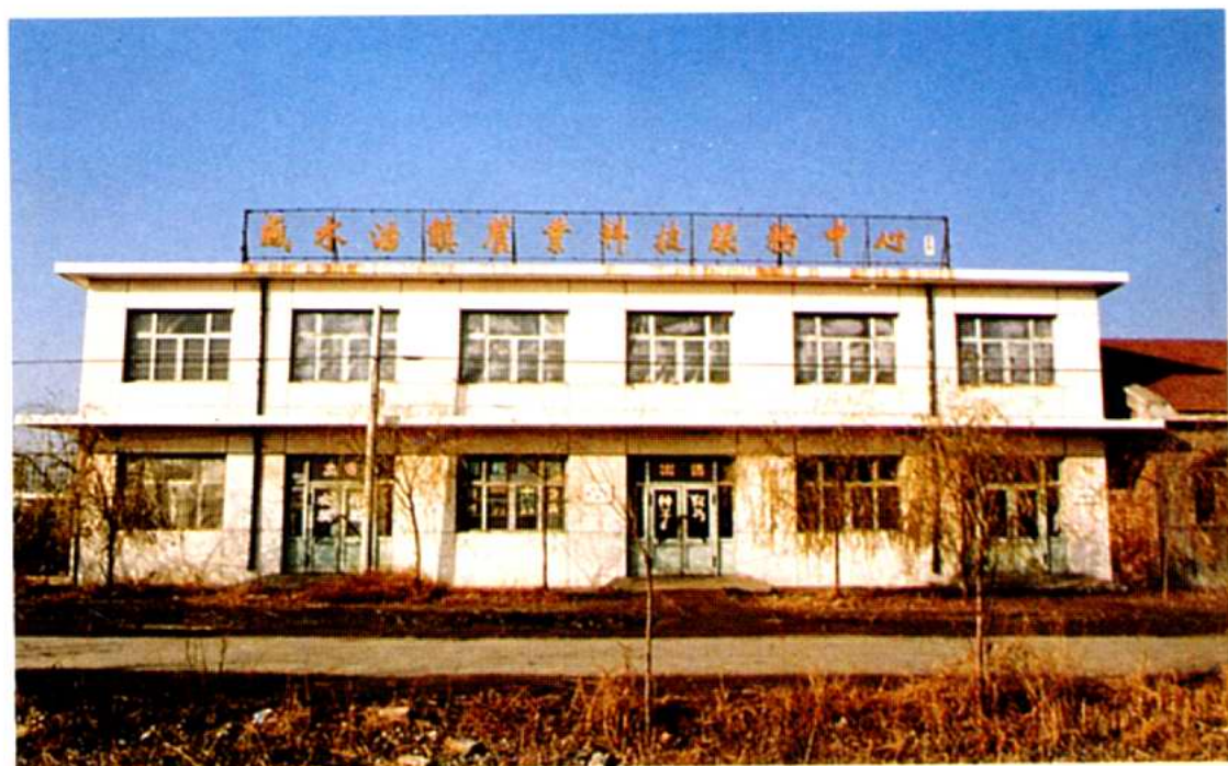
咸水沽镇农业科技服务中心