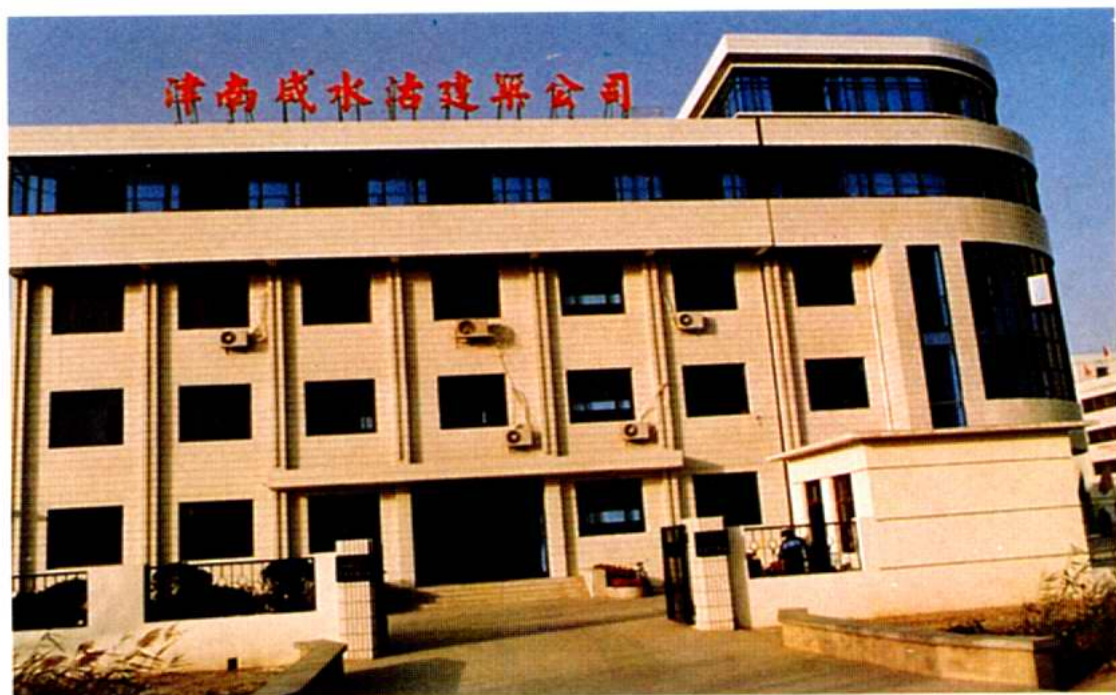
津南咸水沽建筑公司