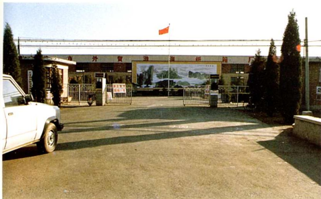
天津市外贸渤海纸箱厂