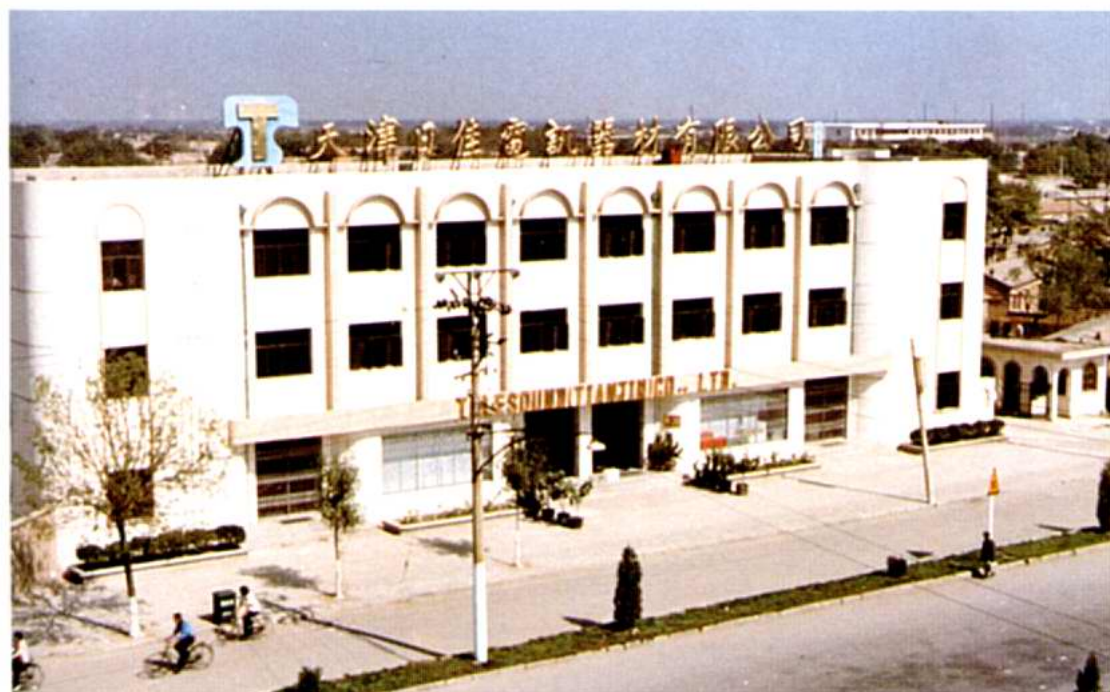
天津日佳电讯器材有限公司