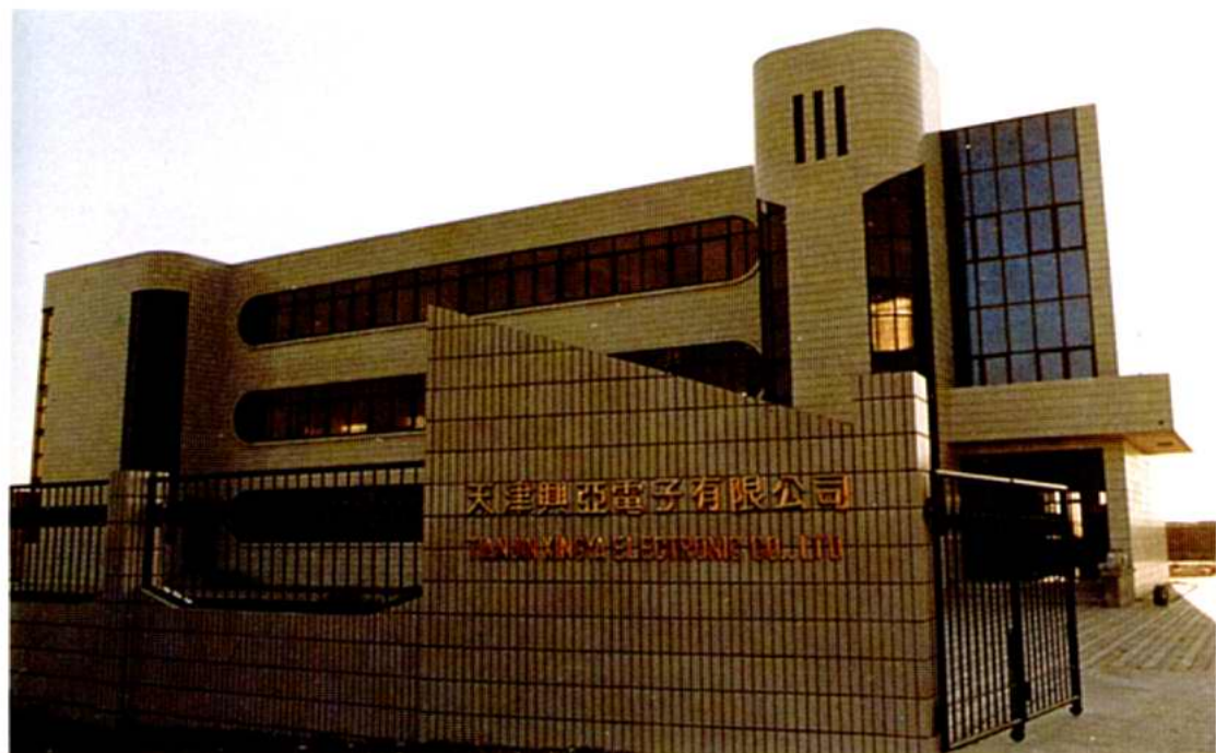
天津兴亚电子有限公司