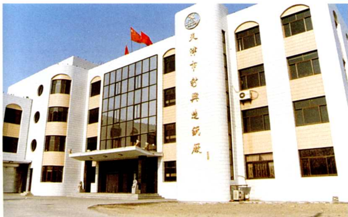
天津市新兴造纸厂