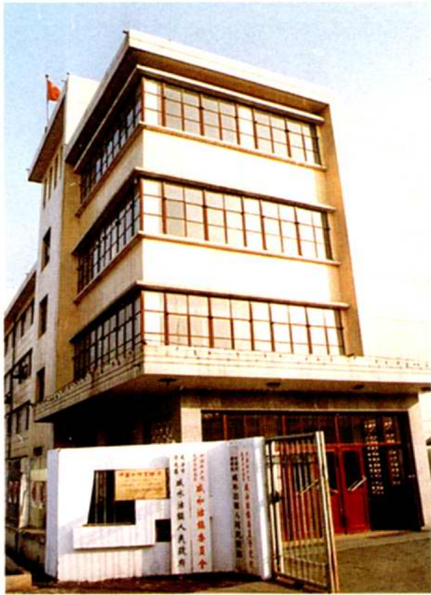
咸水沽镇人民政府