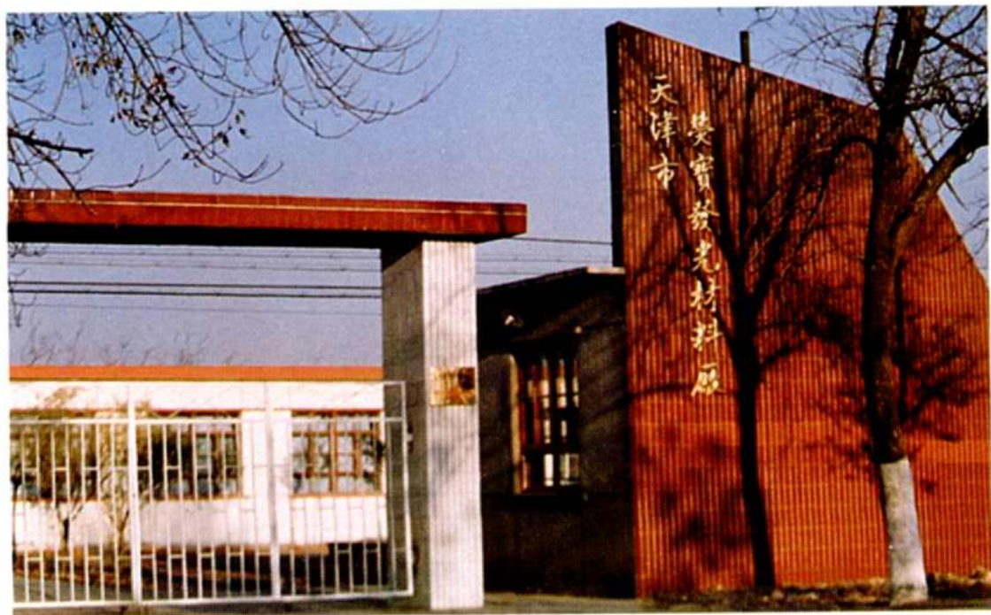
天津市莹宝发光材料厂