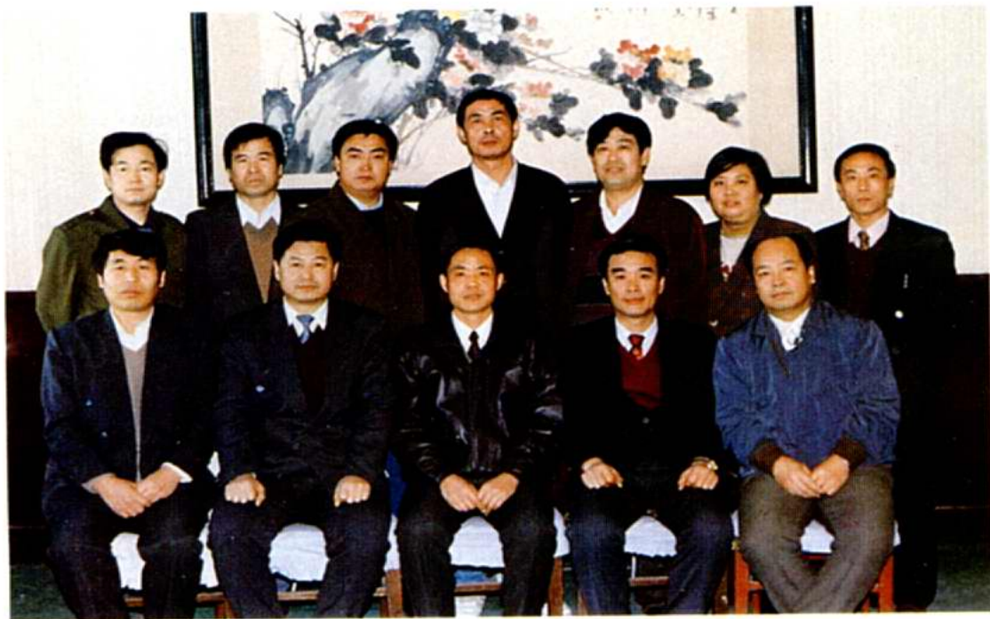
咸水沽镇党委、政府领导班子成员