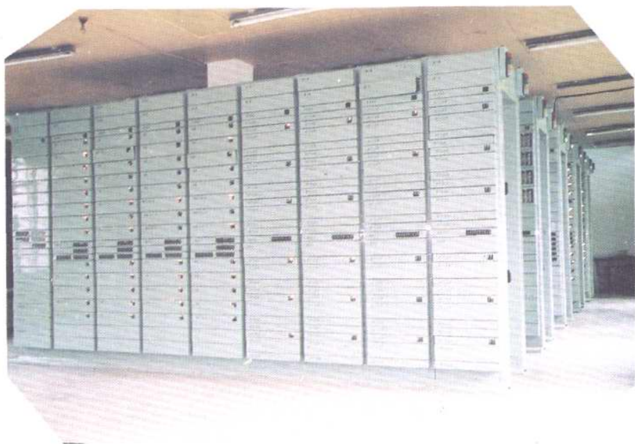
永川县市内电话交换机房(该设备系市电信局电信一厂产)