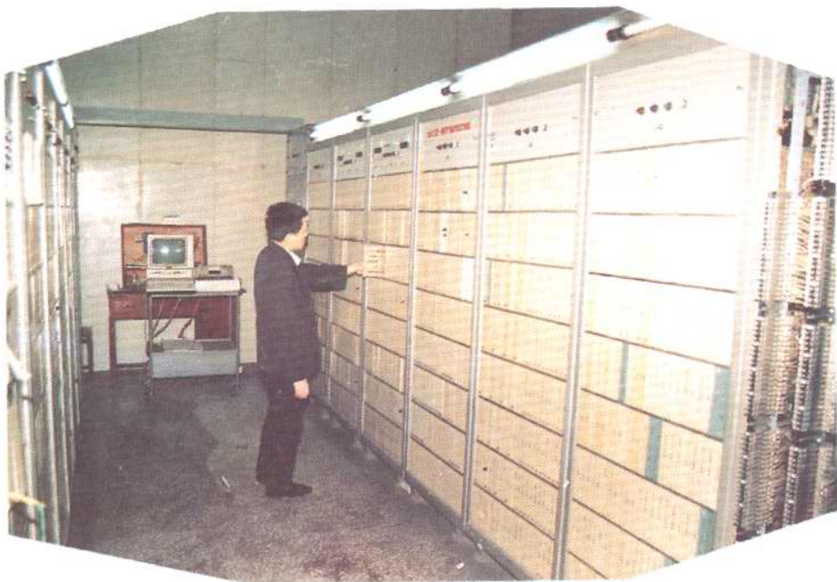
1981年巴县邮电局试制600门准电子自动电话交换机投入运行