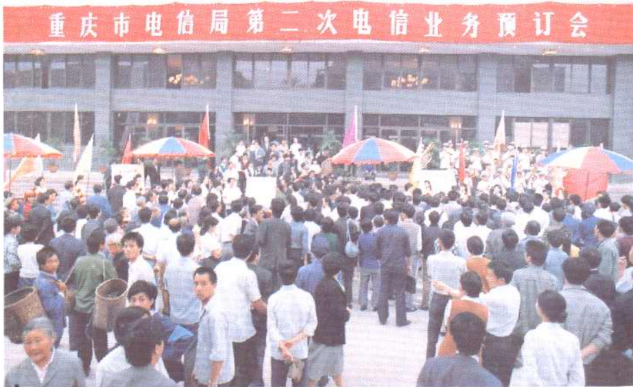
1990 年度电信业务予订会