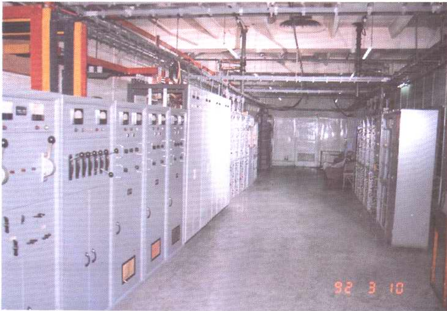
缙云山微波通讯设备