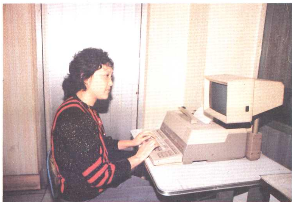
1987年开通的300波特低速数字通信设备