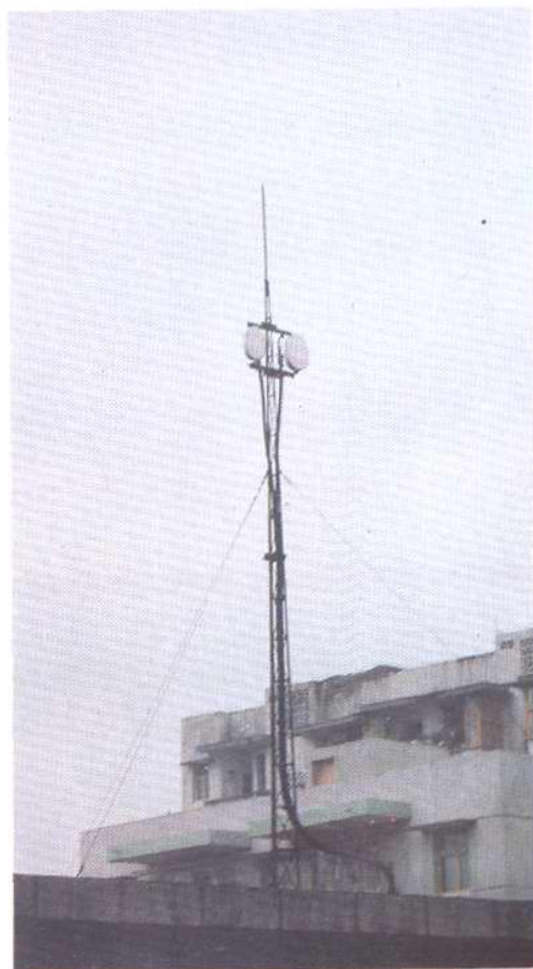
巴县至白市驿微波通讯天线