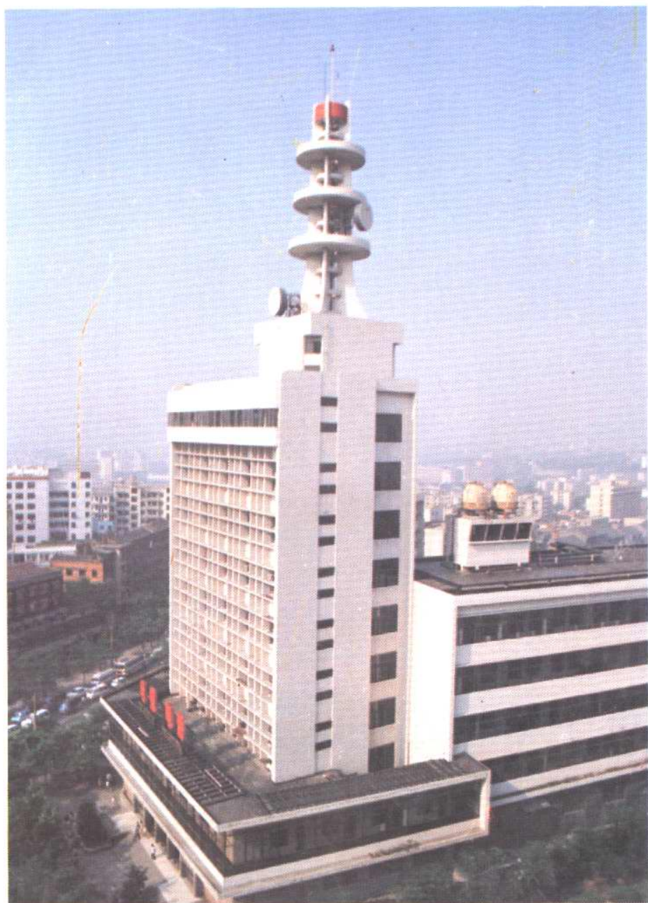
重庆长途通信枢纽大楼