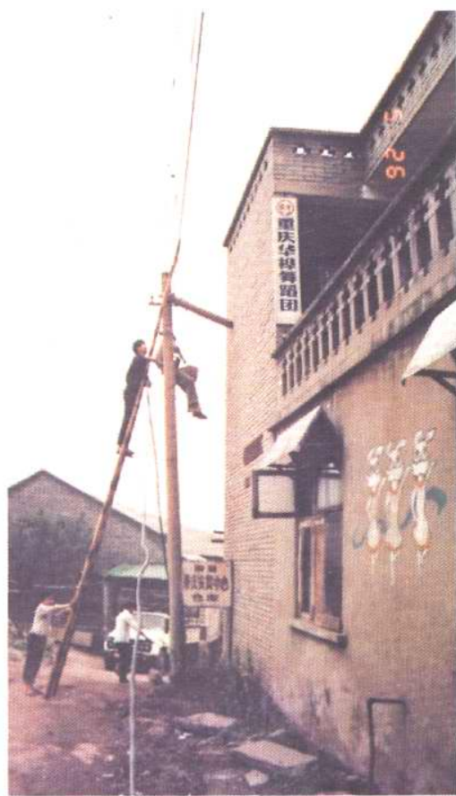
线务员高空架线作业