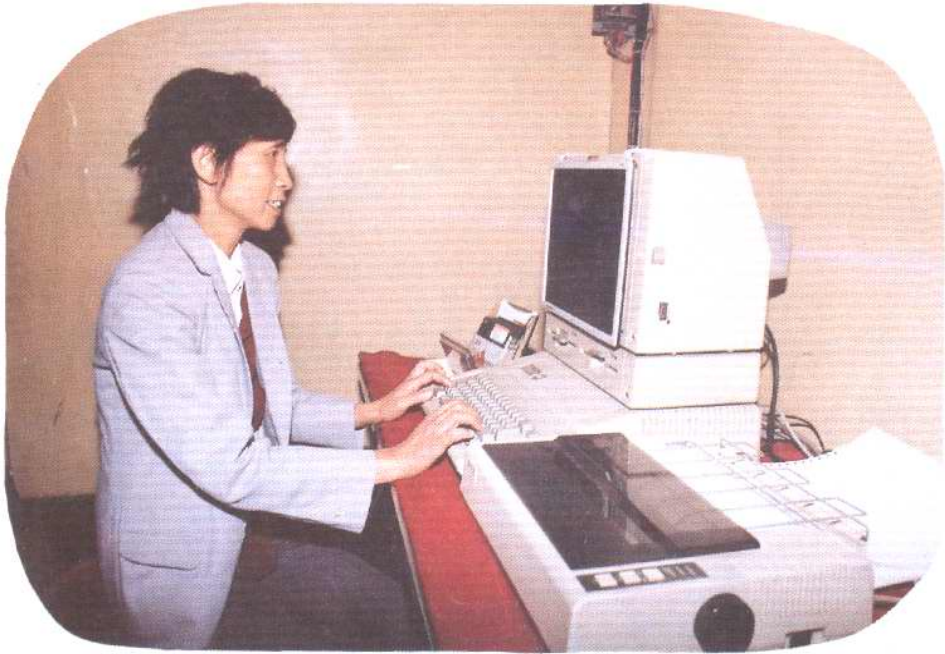
重庆市电信局电信一厂产微机复式计费设备。该机曾获重庆市科技计算机开发应用优秀成果二等奖