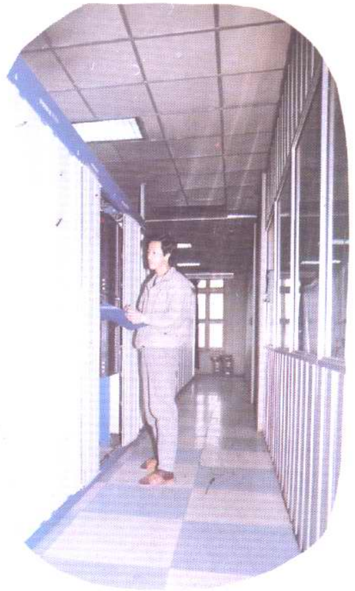
1987年6月开通的八一分局程控机房