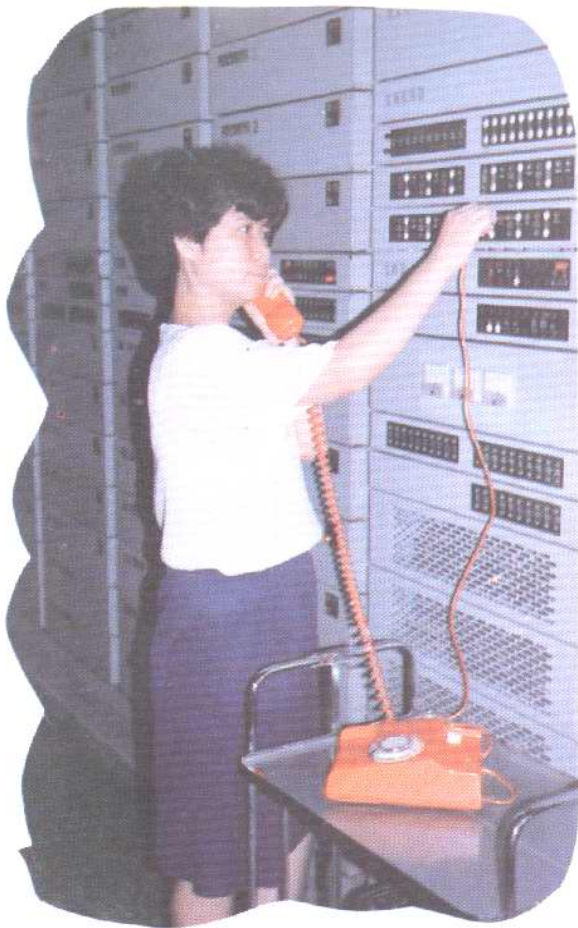
由市电信局自制设备、自建机房及自己安装的南岸二七电话分局