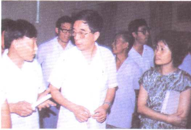
邮电部副部长朱高峰莅临市电信局视察工作