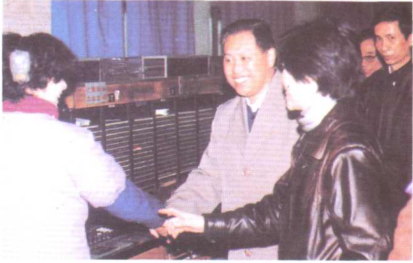
市长孙同川到长途台慰问春节期间坚守岗位的话务员