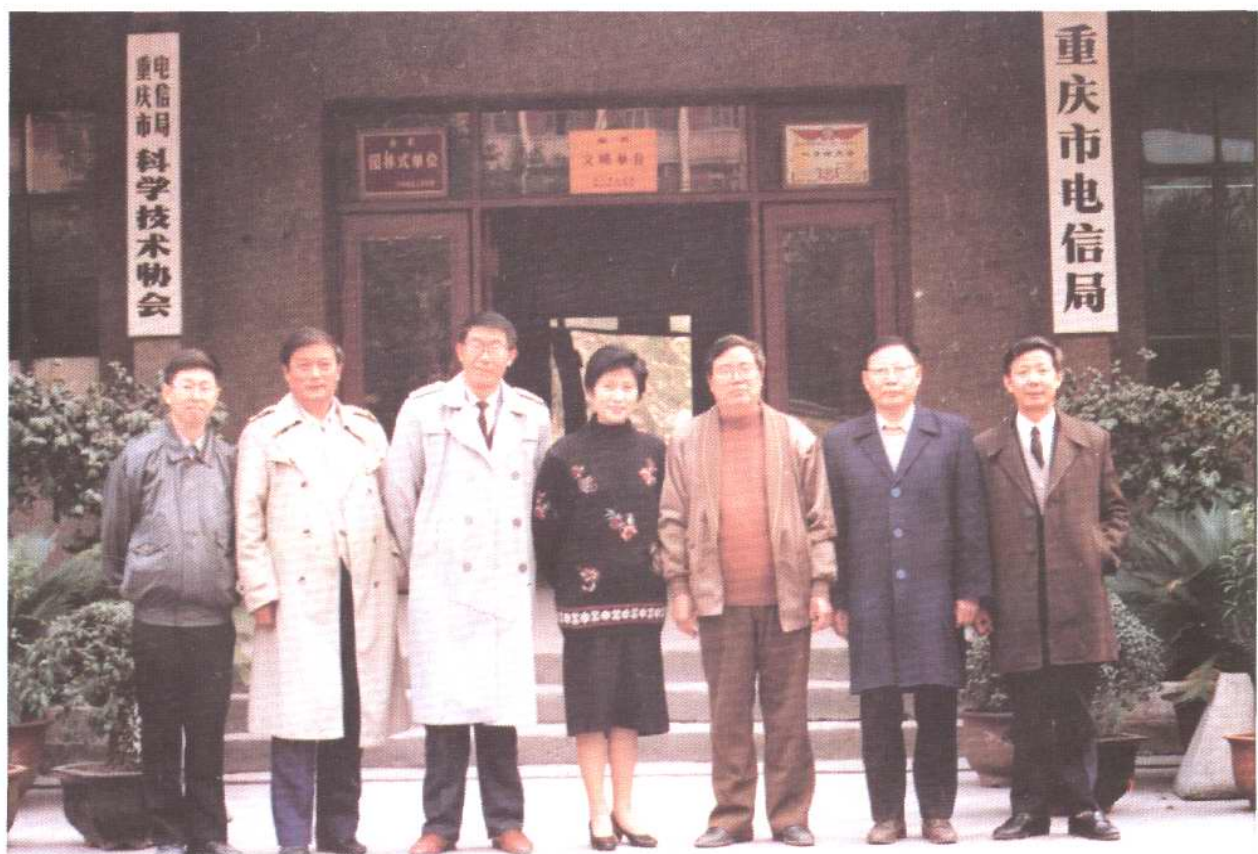
第四届局党委委员合影(1988年10月)