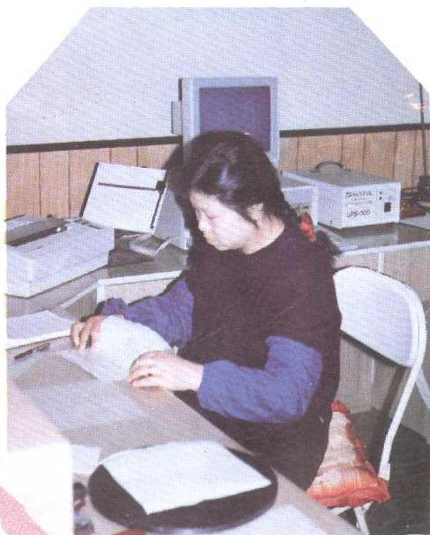
汉字终端机(译码机)