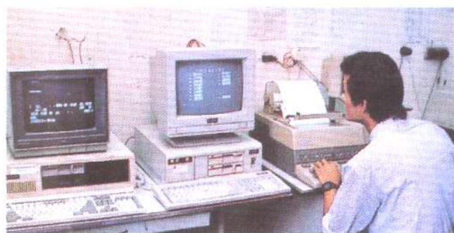
1985年开通的用户电报