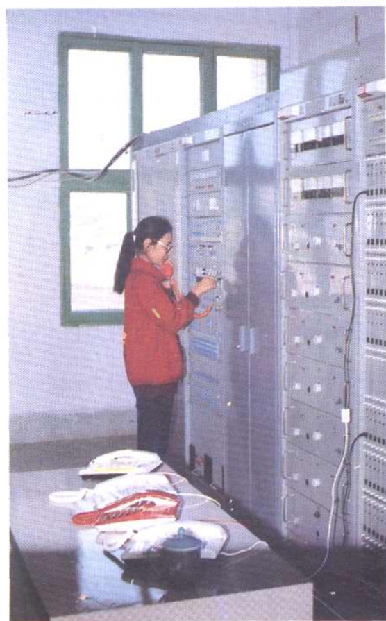
铜梁县旧县镇首次开通的自动电话设备