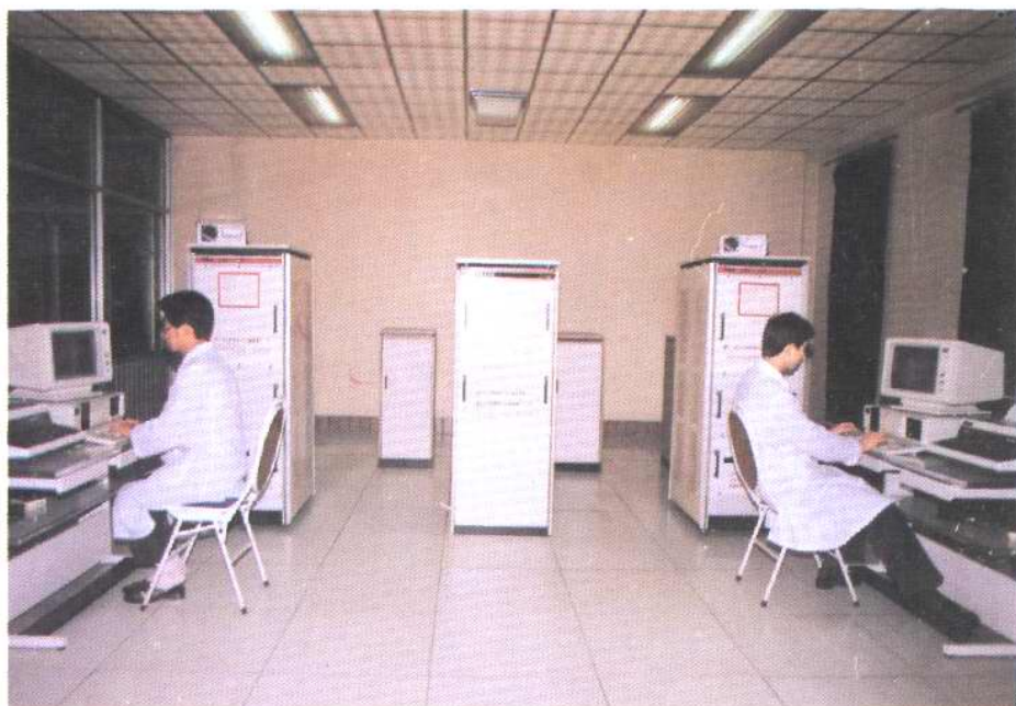
1988年4月开通的256路自动转报系统