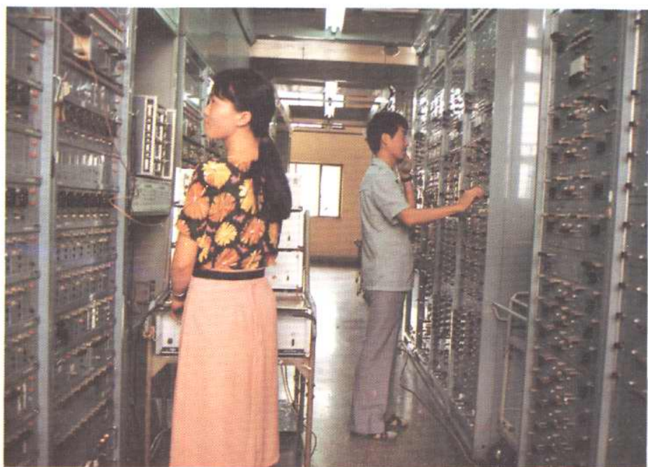
1985年9月开通的1800路中同轴载波群路设备