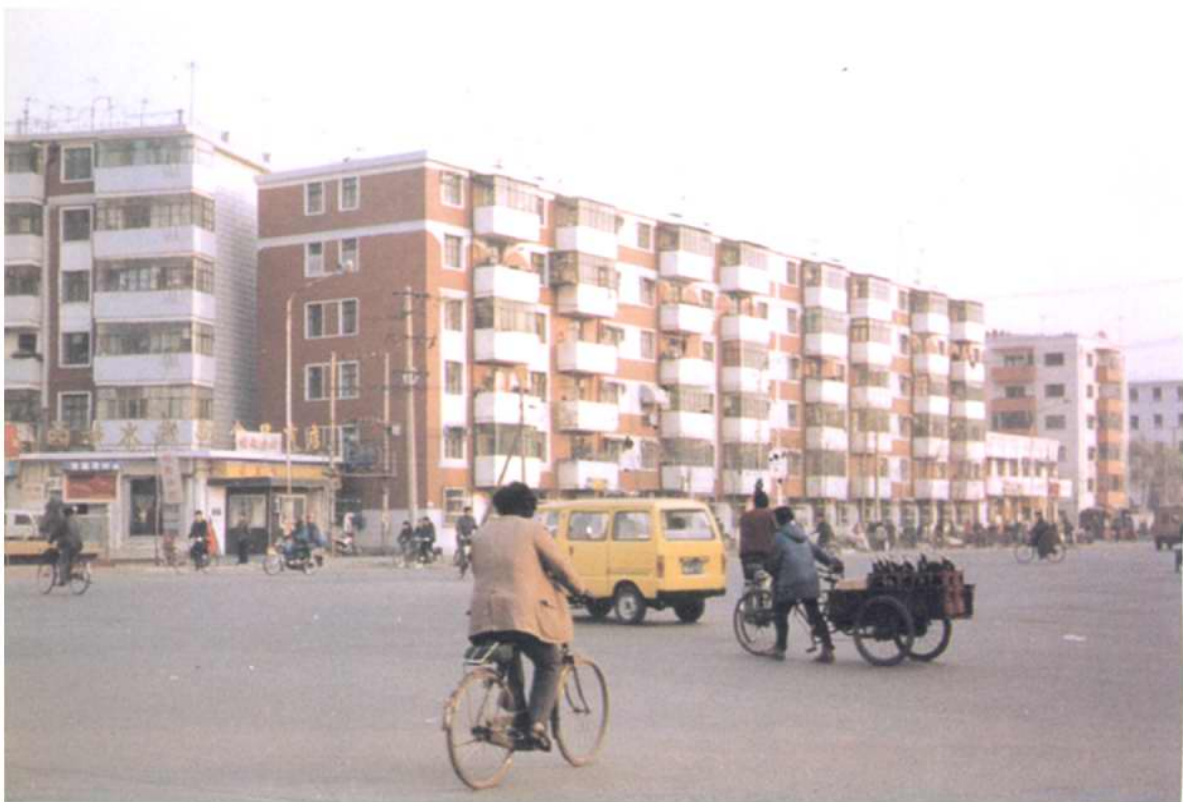
拓宽后的河北大街及房屋建筑