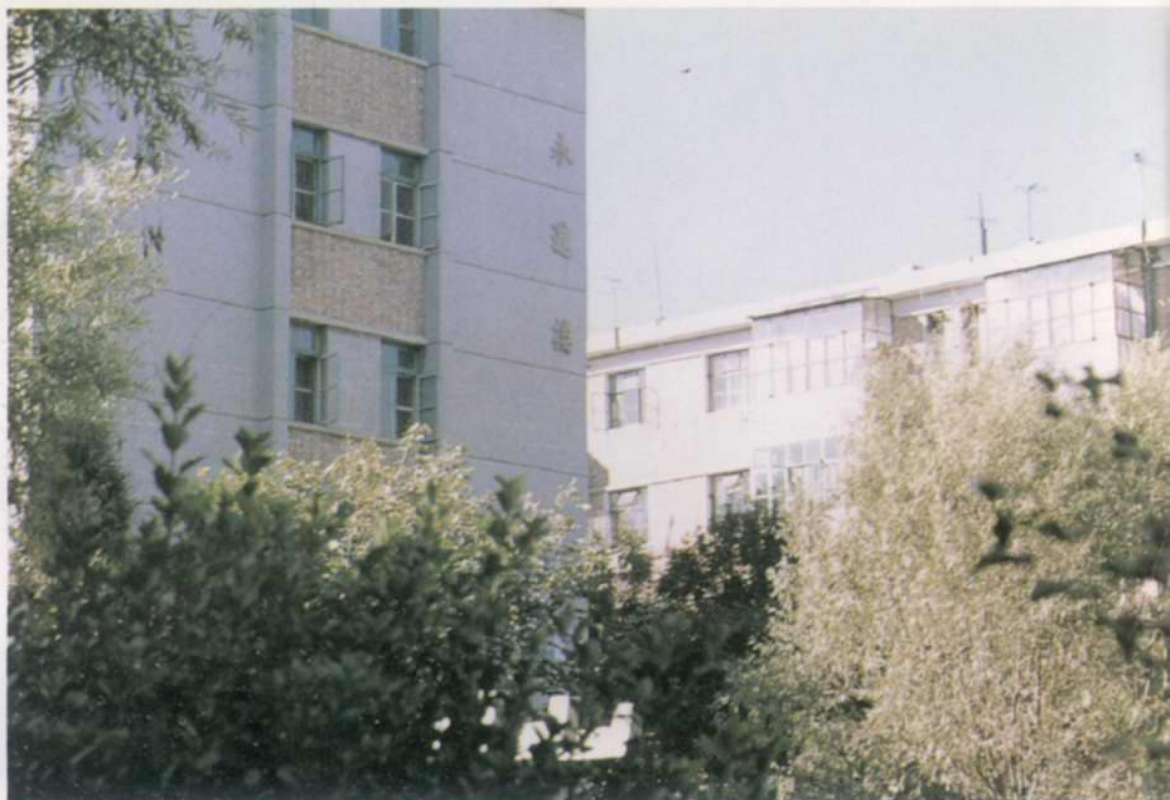
咸阳北路住宅小区