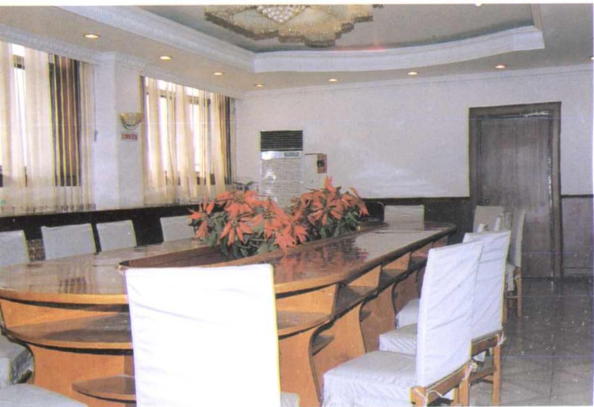
区房产总公司五楼会议室