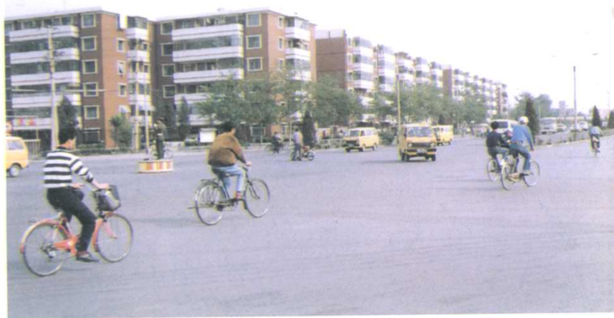
西沽湘潭里居民区