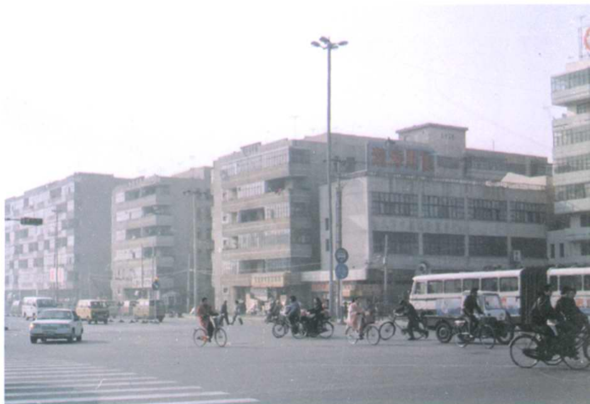
拓宽后的西马路及房屋建筑