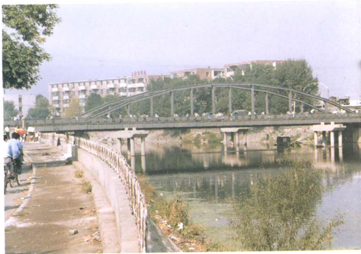
大红桥——红桥区以此得名