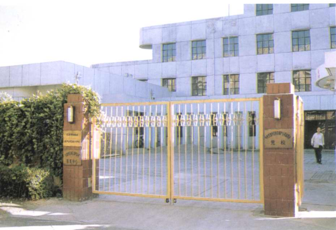
区房产总公司技工学校