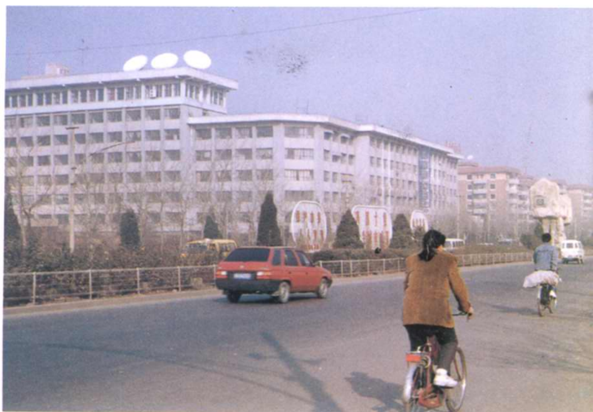
红桥区人民政府大楼