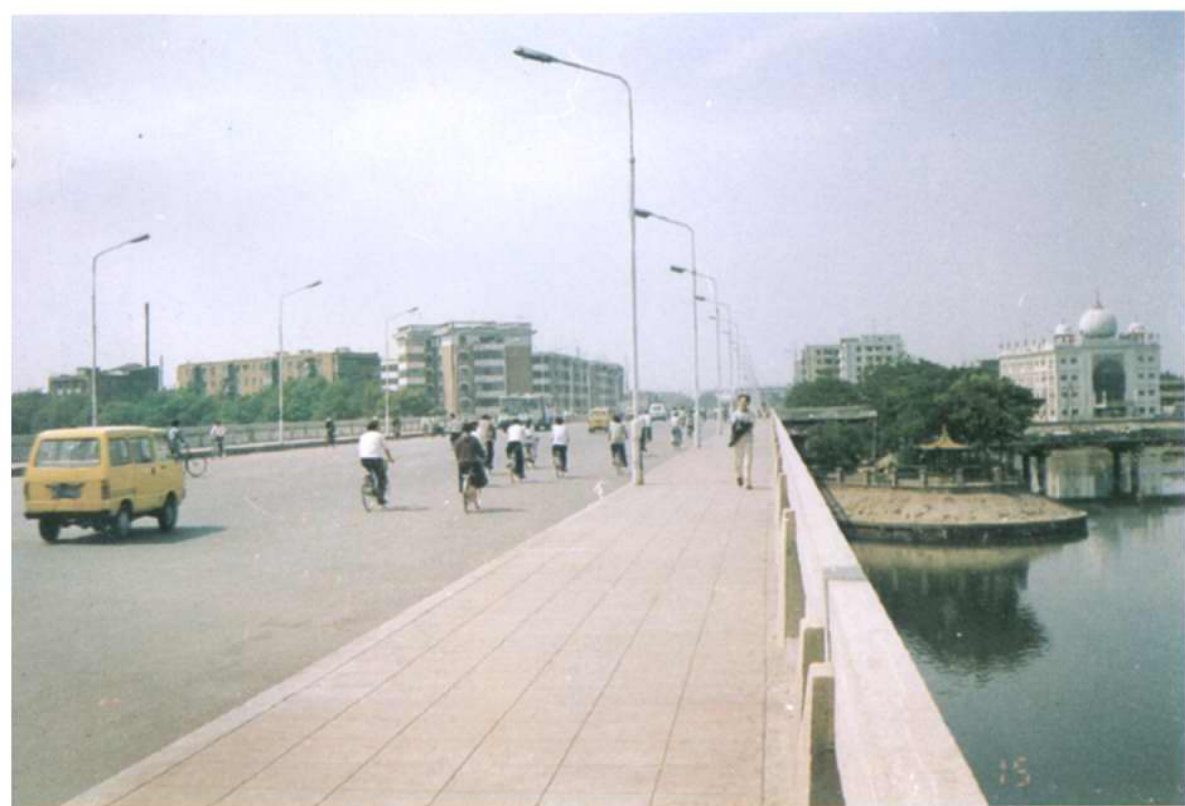
新红桥及房屋建筑