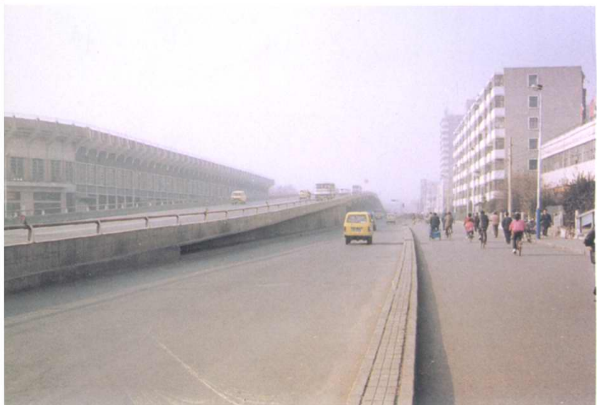
拓宽后的西青道及房屋建筑