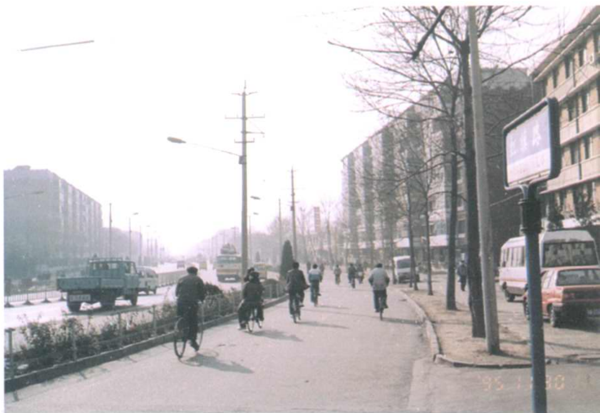
拓宽后的红旗路及房屋建筑