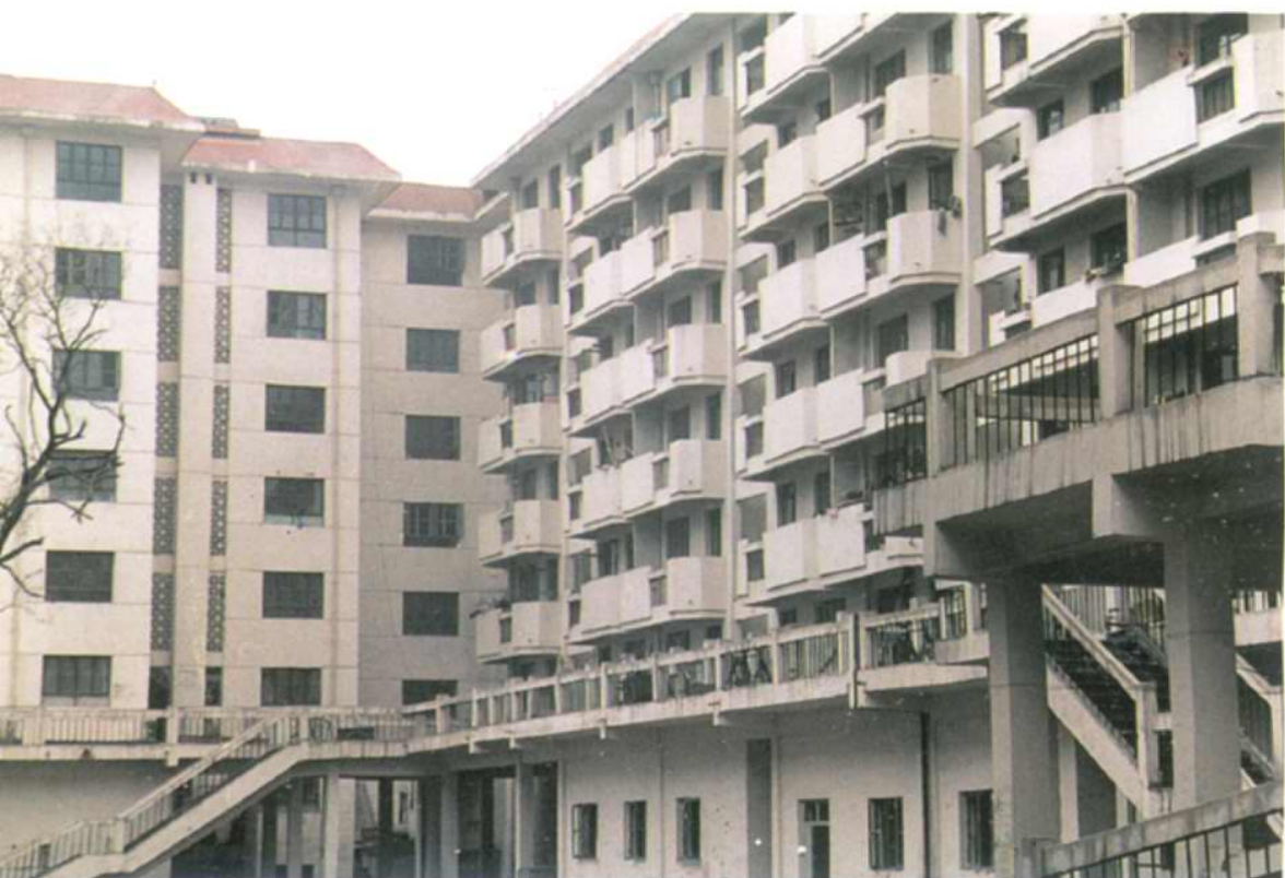
改造后的西关北里居民区