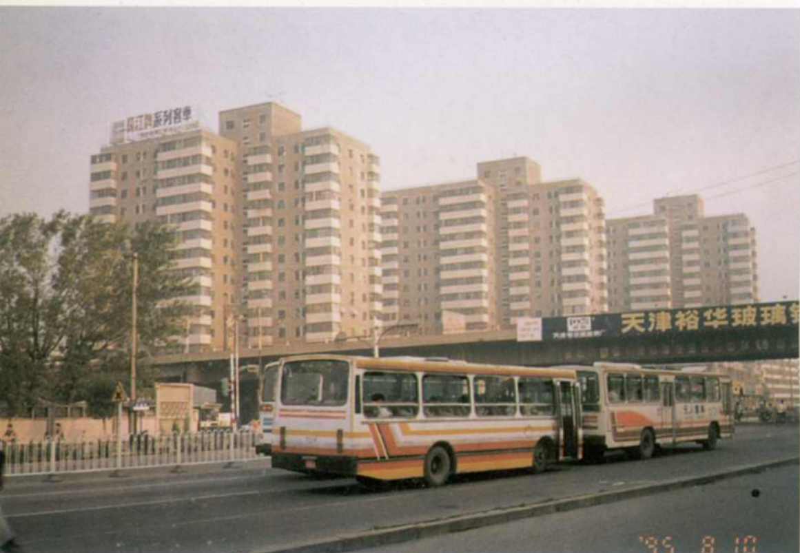
西青道高层住宅楼