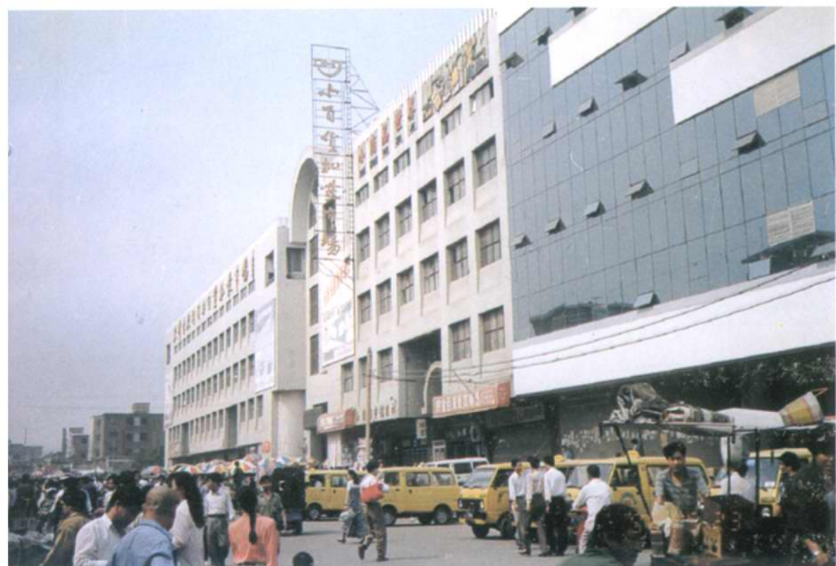
辐射三北地区的小百货批发市场