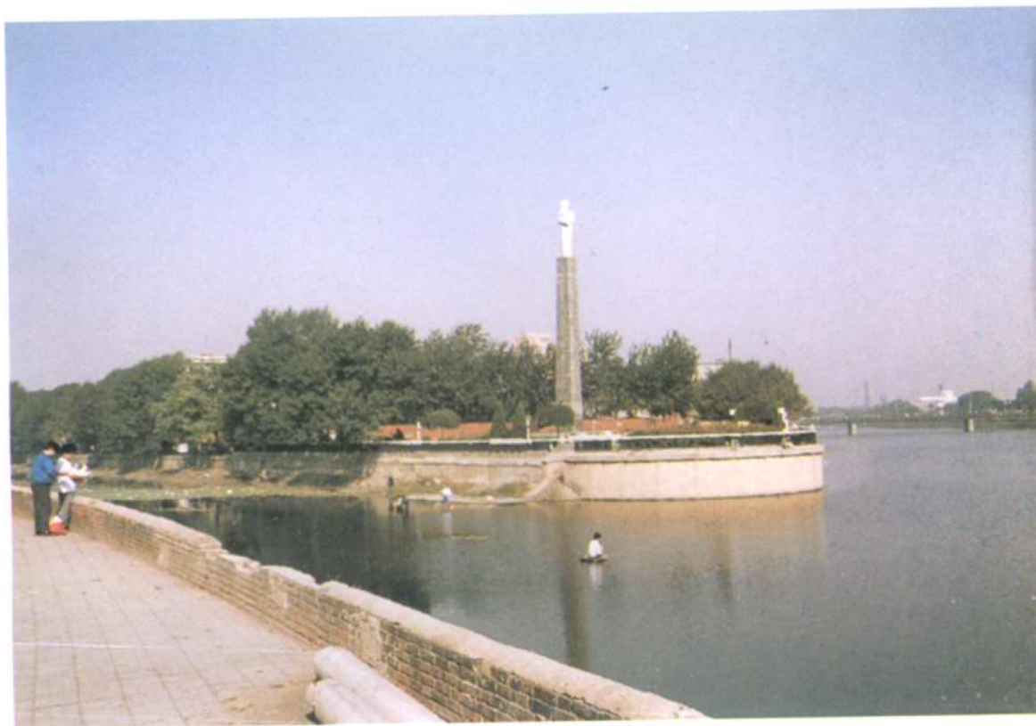
三岔河口——天津市发祥地