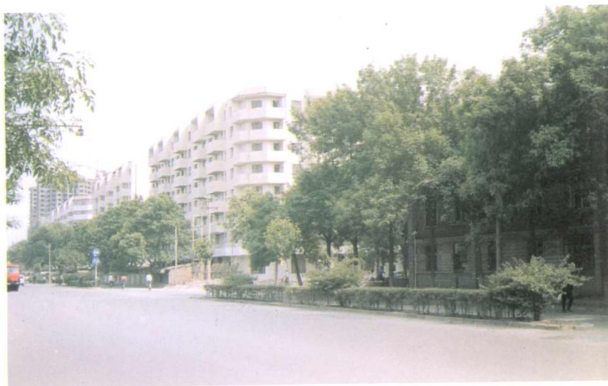
改造后的丁字沽一、二、五段居民区