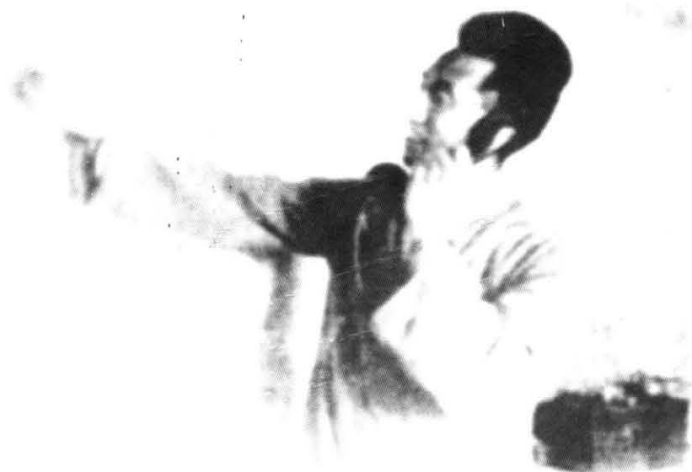
1948年徐向前在指挥冀中战役。