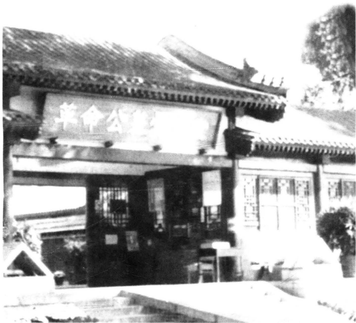
位于北京西郊的八宝山革命公墓骨灰堂