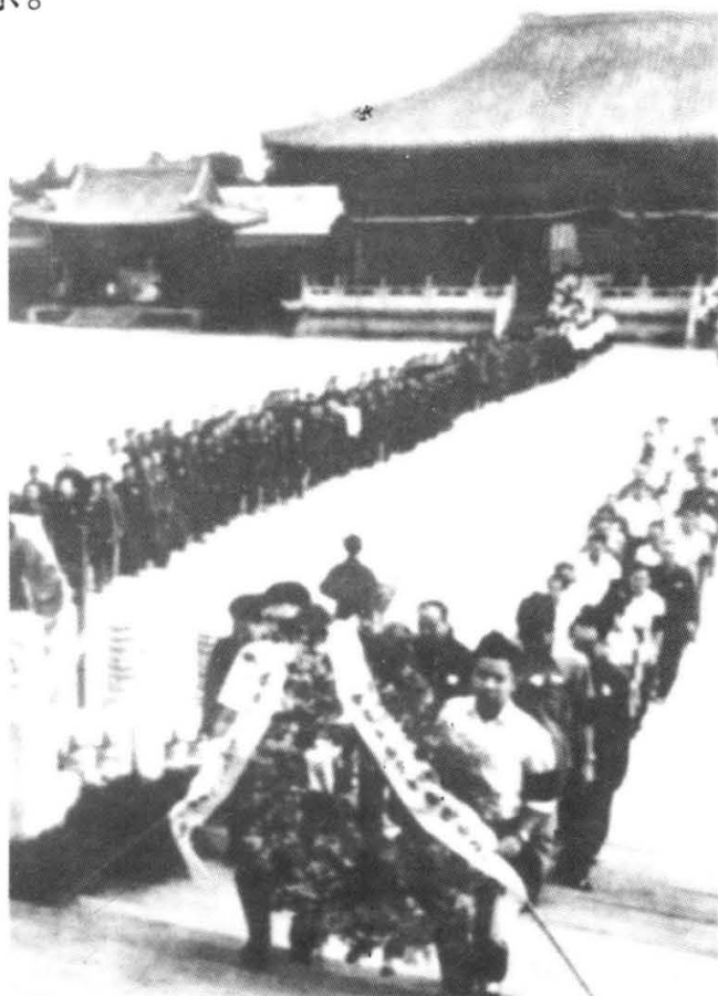
1976年7月，朱德逝世。各界群众前往首都劳动人民文化宫悼念。