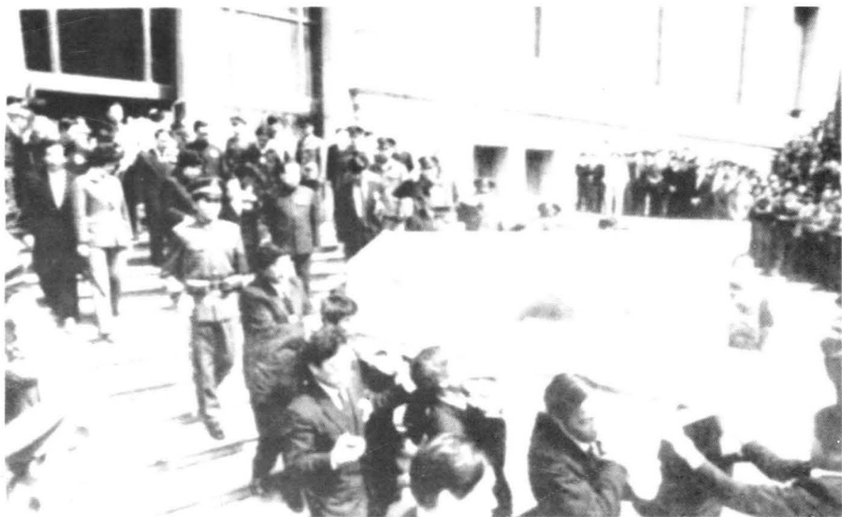
1989年4月22日，胡耀邦逝世。追悼会后，乔石等护送胡耀邦遗体步出人大会议堂西南门，送往八宝山火化。