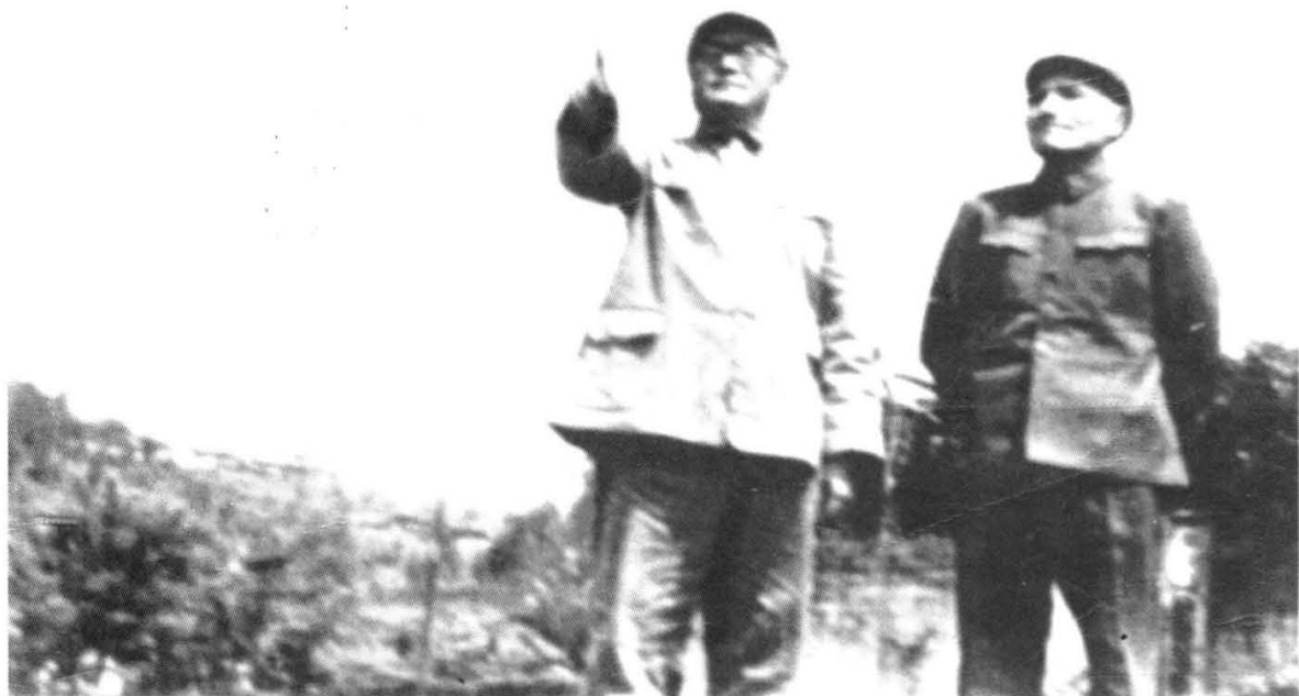
1949年4月，人民解放军第二、三野战军发起渡江战役前，刘伯承与邓小平亲临前沿部署作战。