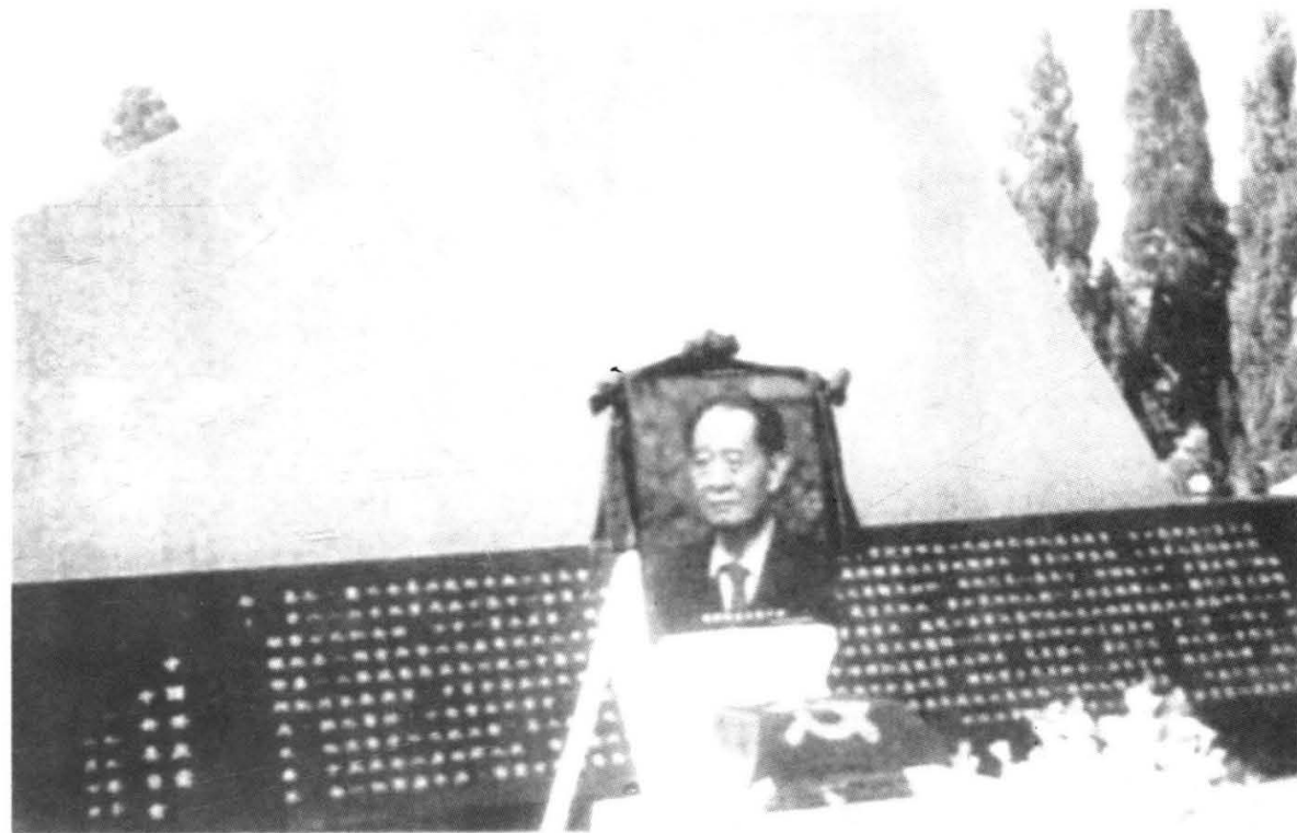
胡耀邦长眠在红土地上。图为座落于江西共青城的胡耀邦墓。