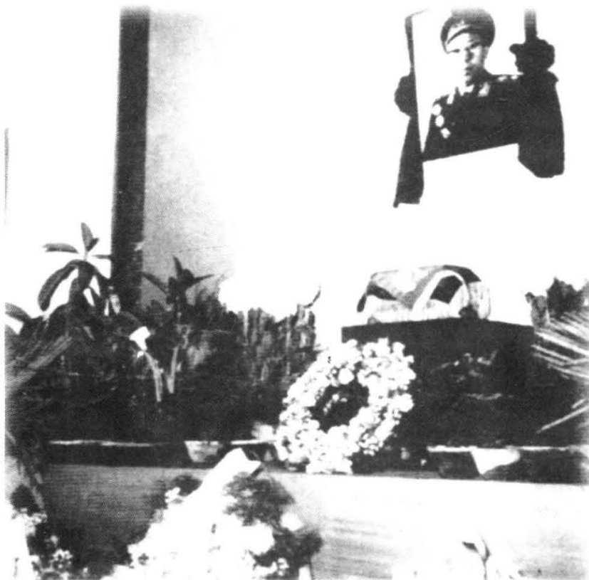
在八宝山革命公墓 为罗荣桓元帅设 立的灵堂。