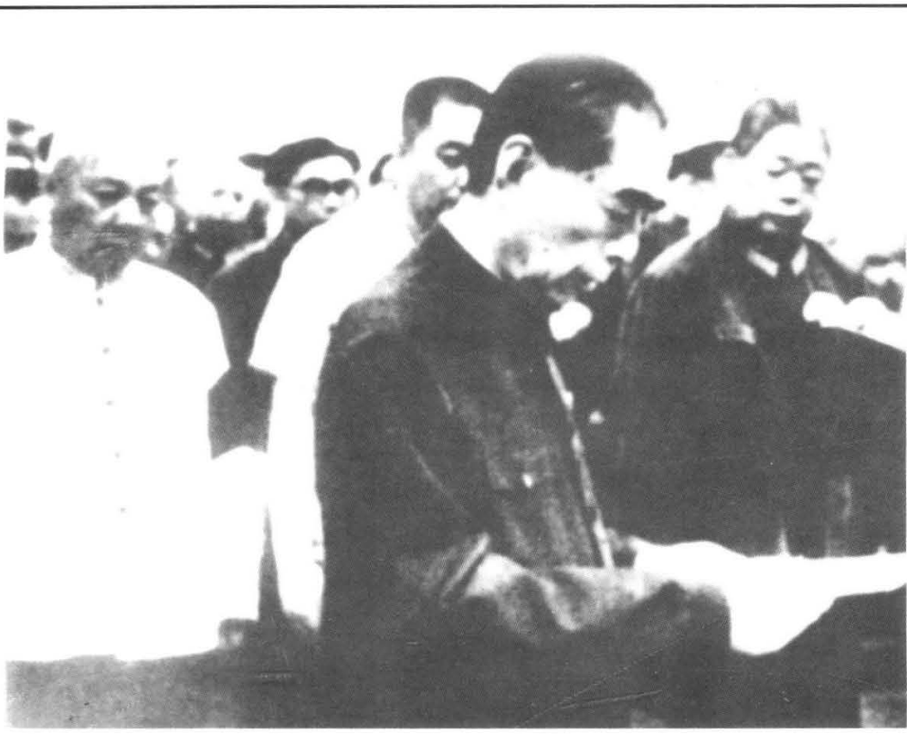
中共中央举行贺龙骨灰安放仪式，周恩来致悼词。 (1969年6月，贺龙被迫害致死)