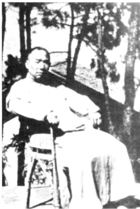
1942年，马寅初被蒋介石软禁在重庆歌乐山家中时的留影。