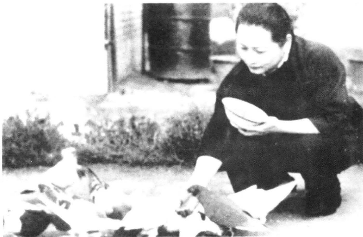
宋庆龄十分喜爱她的鸽子 (1981年5月,宋庆龄逝世)