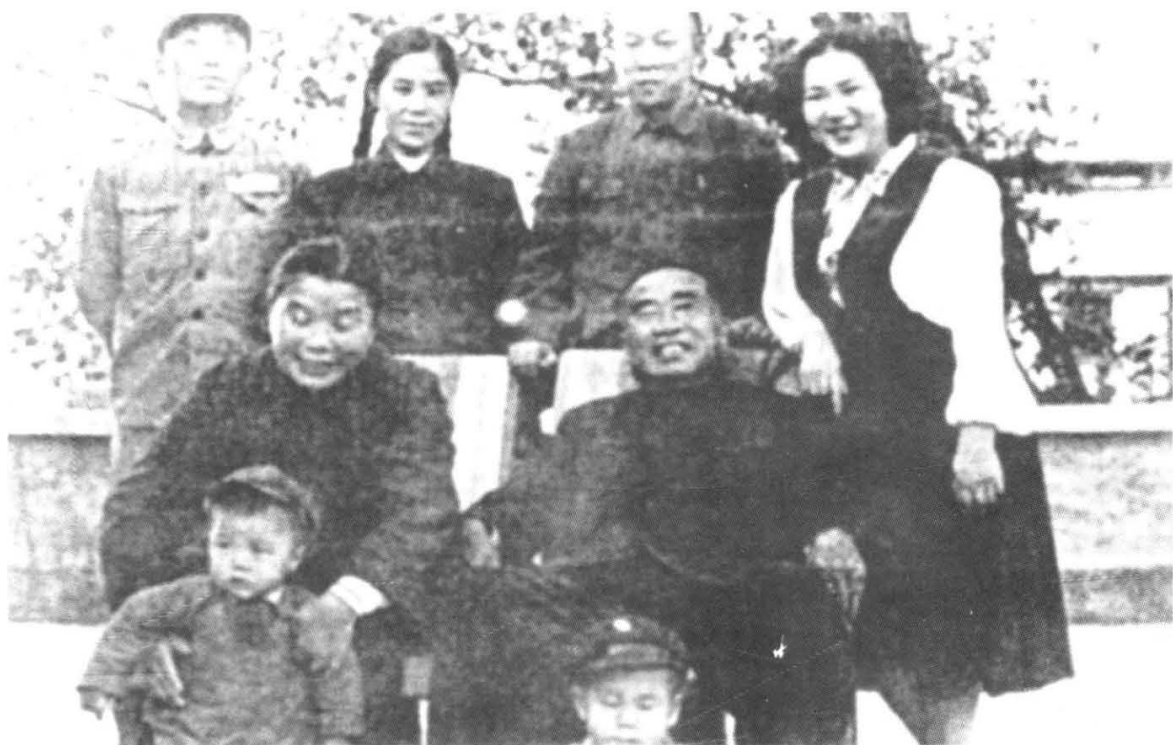
1953年朱德全家在北京。