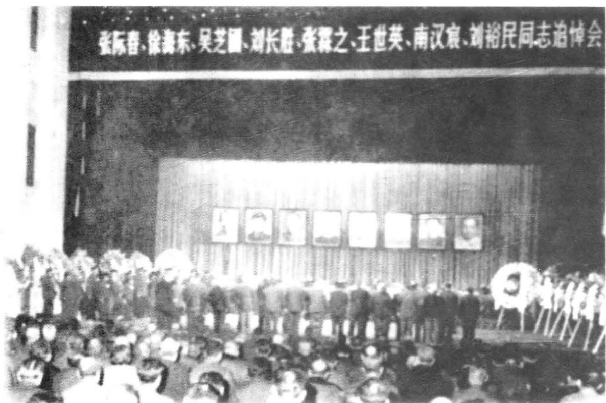
“四人帮”被粉碎后，冤案纷纷平反昭雪。八宝山一天安排多场追悼活动仍显紧张。