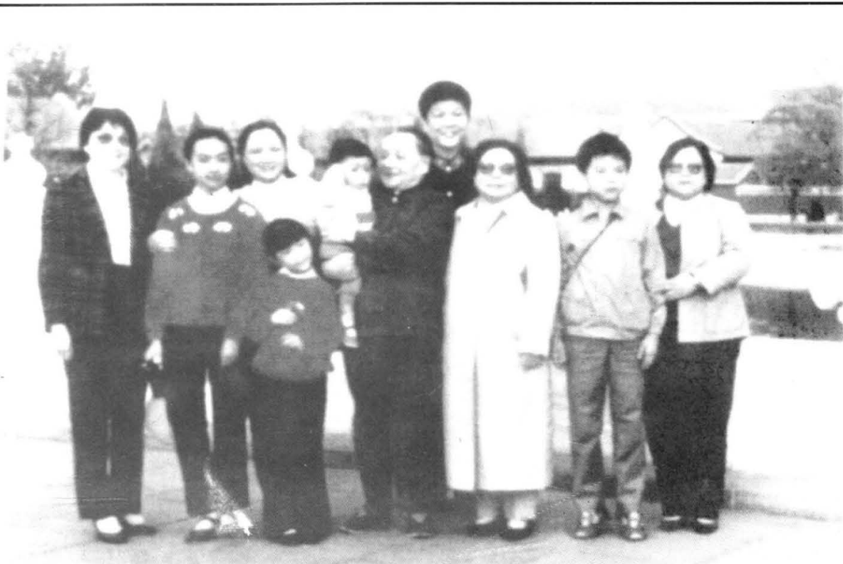
邓小平、卓琳夫妇与女儿们和孙辈在北京中南海留景