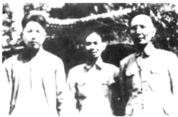
1949年郭沫若与茅盾、周扬合影