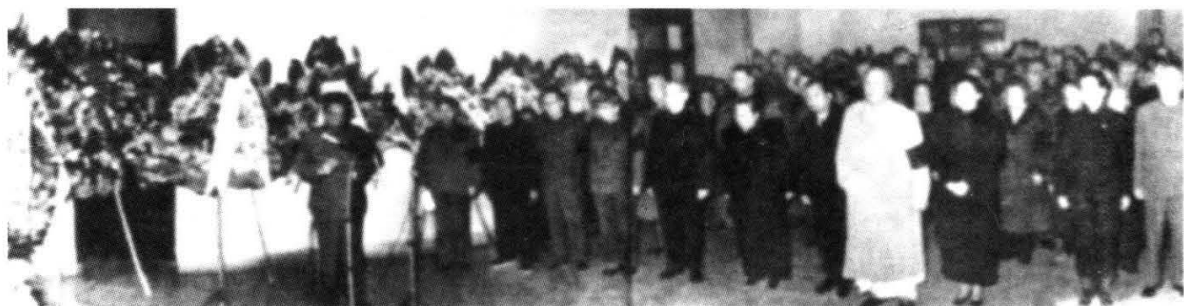
毛泽东穿睡衣参加陈毅追悼会。 (1972年1月,陈毅逝世)