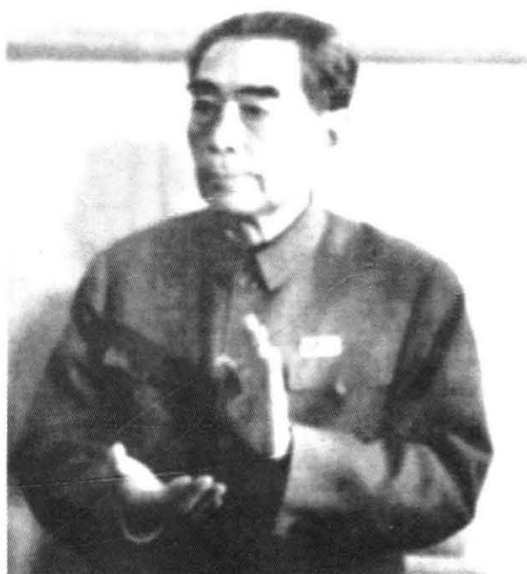
“文化大革命”中的周恩来。