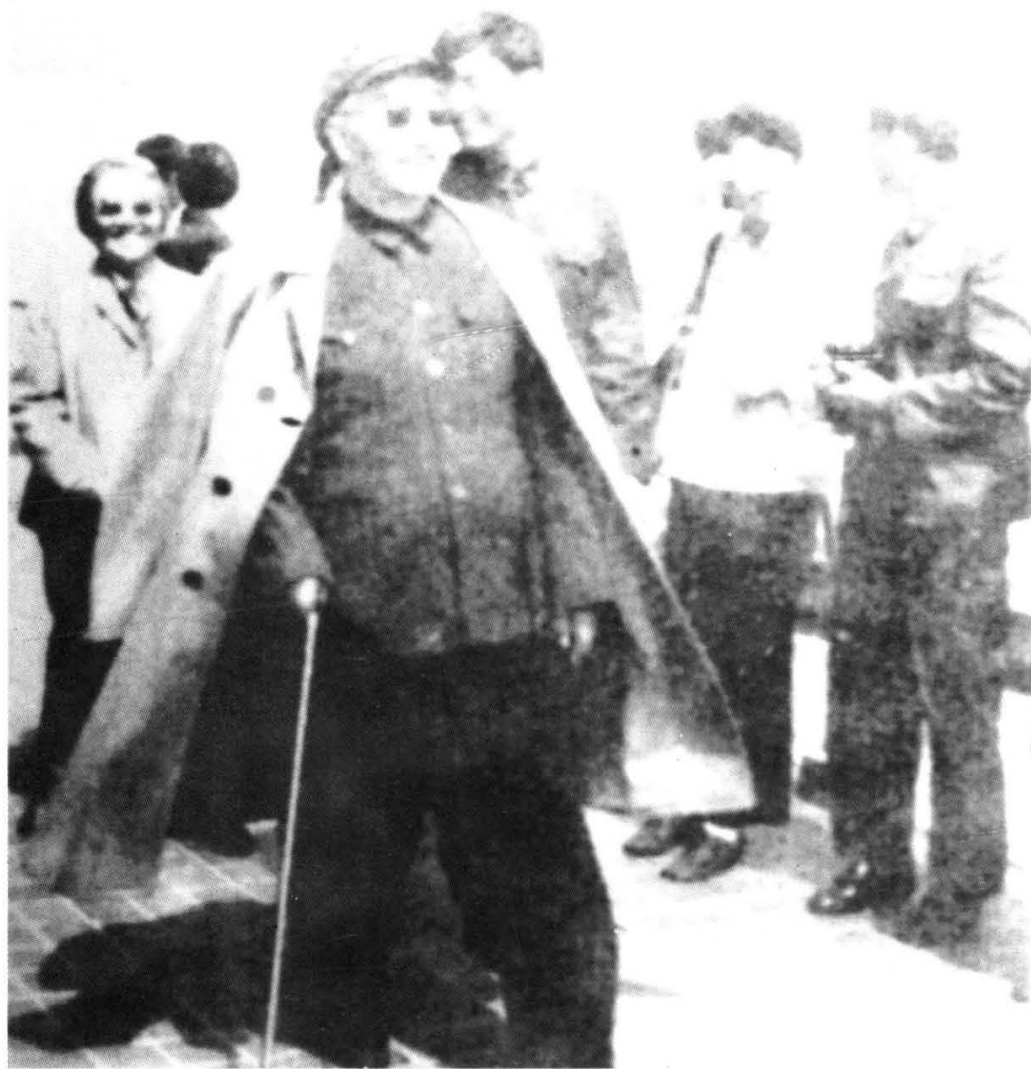
徐向前视察南京长江大桥。 (1990年11月，徐向前逝世)