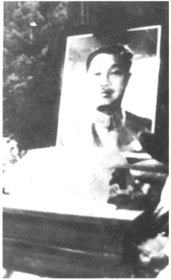
贺龙元帅遗像和骨灰盒。