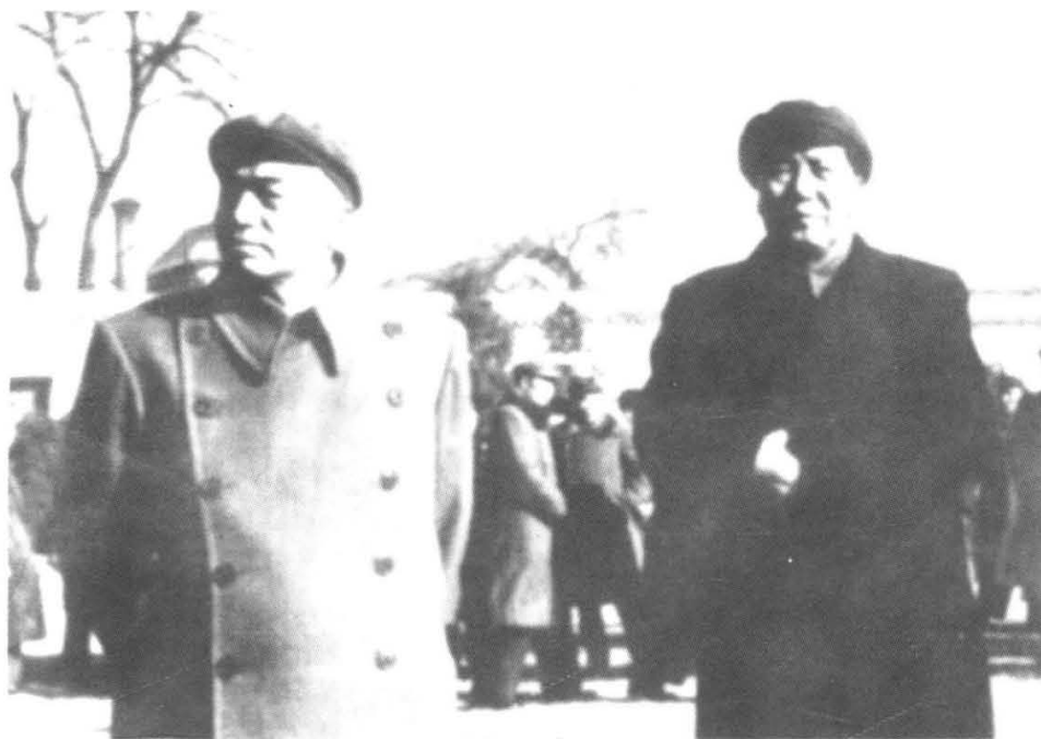
毛泽东与 彭德怀在 中南海。 (1974年 11月,彭 德怀被迫 害致死)