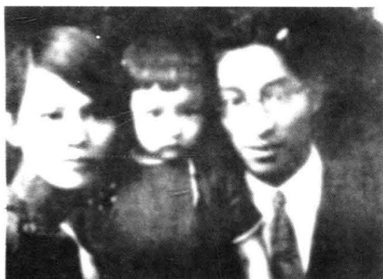
1931年夏任燕京大学中文系主任时期的郑振铎与夫人、女儿合影。 (1958年10月,郑振铎因飞机失事遇难)