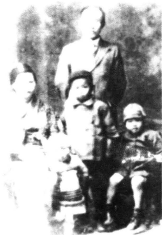
郭沫若20年代在日本与安娜和 孩子们合影。 (1978年6月,郭沫若逝世)