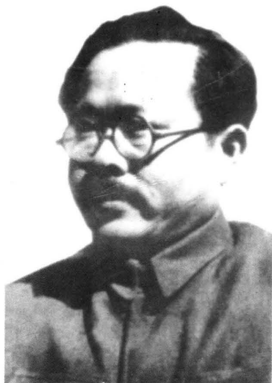
中共中央五大书记之一任弼时。