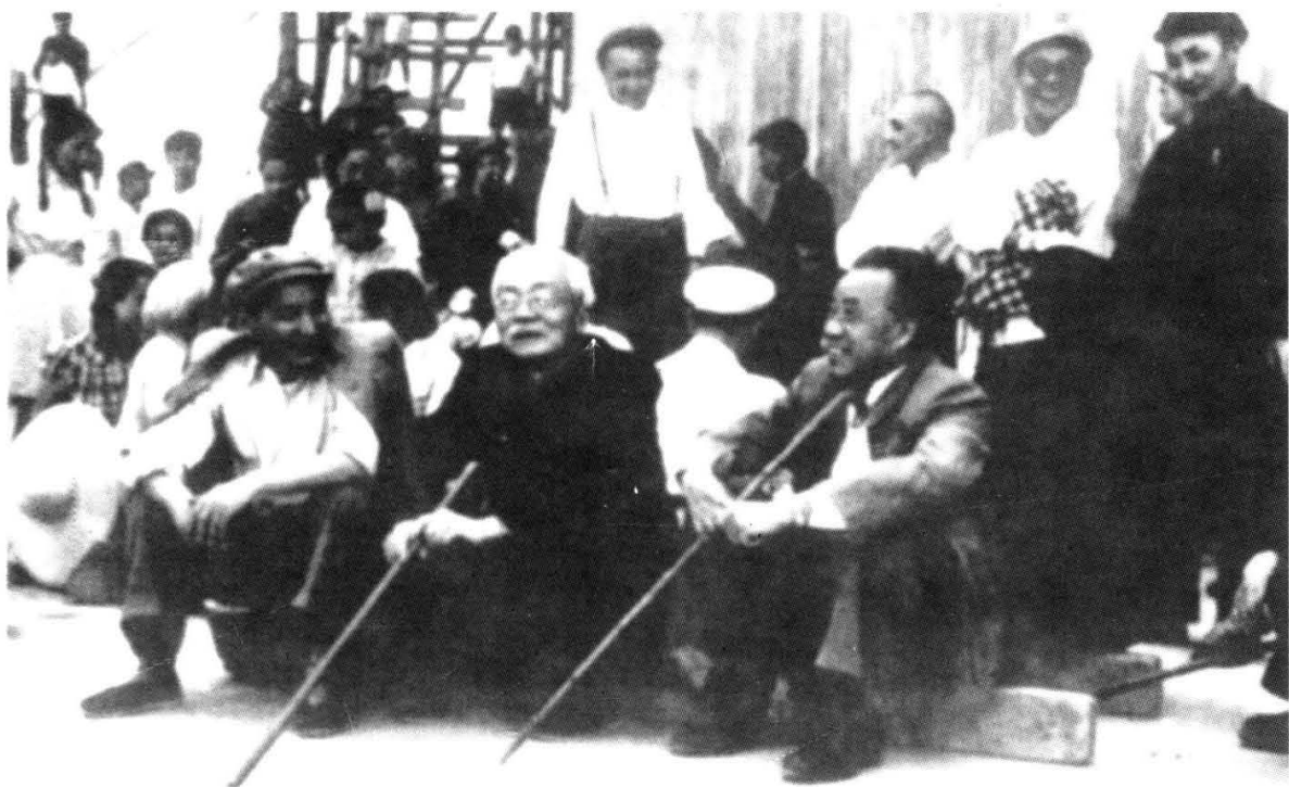
陈云(前左)、林伯渠(前中)、朱德(前右)、邓小平(后右三)等视察官厅水库。 (1960年5月林伯渠逝世)