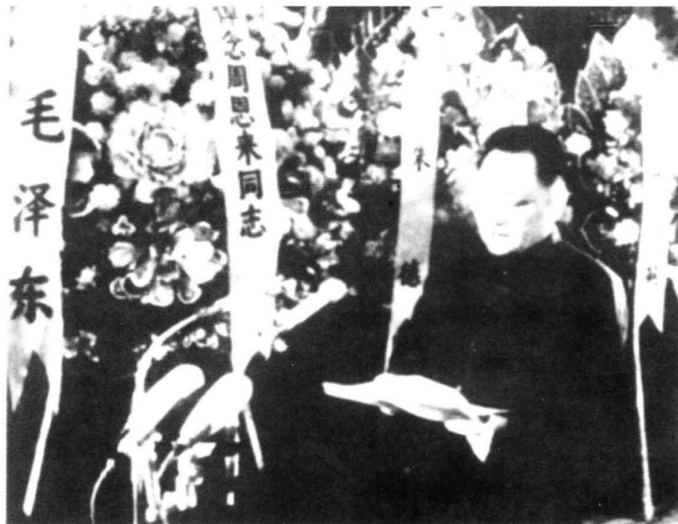
1976年1月15日，周恩来追悼会在北京人民大会堂举行。中共中央副主席、国务院副总理邓小平致悼词。（1976年1月，周恩来逝世。）