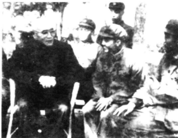
1961年刘伯承到部队视察。 (1986年10月，刘伯承逝世)