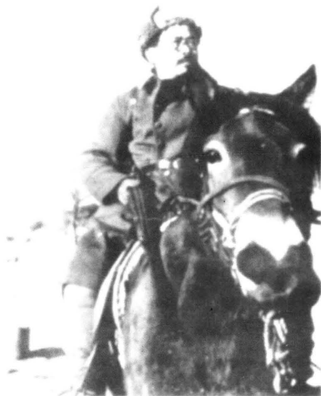
七大前后的任弼时。 (1950年10月,任弼时逝世)