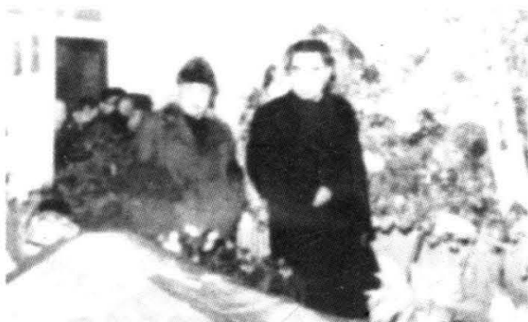
周恩来、陈毅等悼念李克农去世。 (1962年2月,李克农逝世)