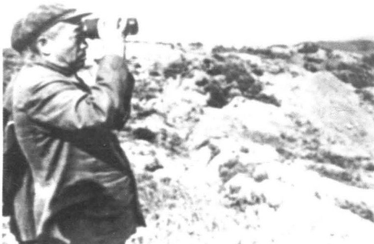
抗美援朝时期,中国 人民志愿军司令员兼 政委彭德怀在朝鲜前 线视察阵地