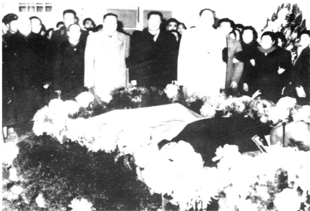
1963年12月， 罗荣桓逝世 毛泽东率党、 政、军领导人 亲往悼念罗荣 桓元帅。