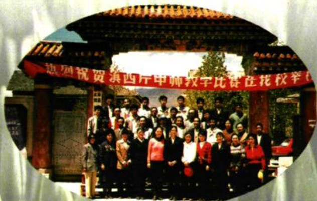
云南滇西片中师教学比赛在迪庆师范举行。图为参赛有关人员合影留念。