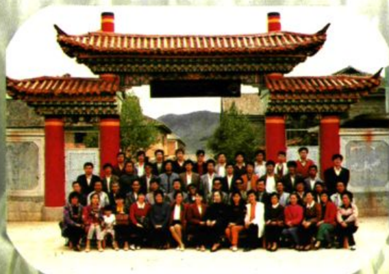
1993年11月23日，云南省中师数学学校际教研会在迪庆师范召开。图为与会人员合影留念。