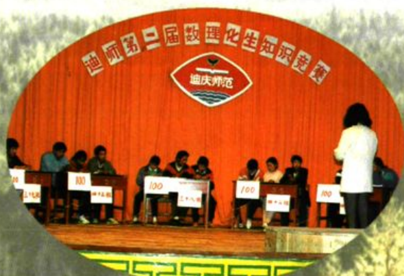
迪庆师范第二届数理化知识竞赛。