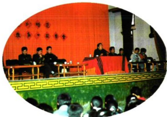
1997年3月28日，迪庆师范举办“法制教育报告会”。