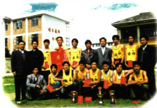
2000年5月，迪庆师范男子篮球队在“第九届校园杯”上夺得冠军。