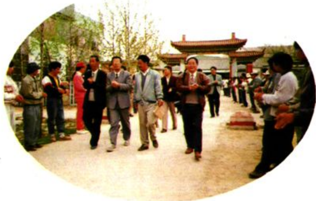
1995年5月，省教委主任杨崇龙到迪庆师范视察工作。