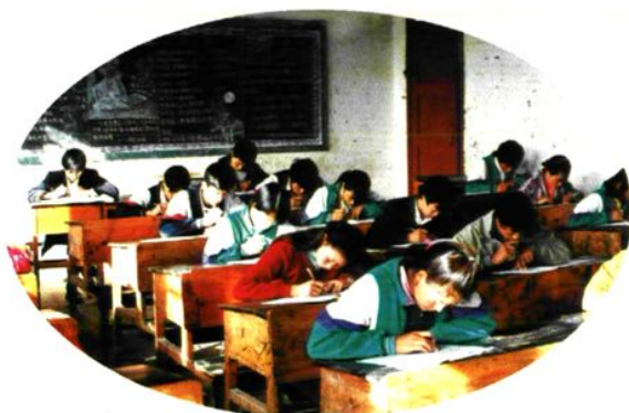
学生参加期末考试场面。