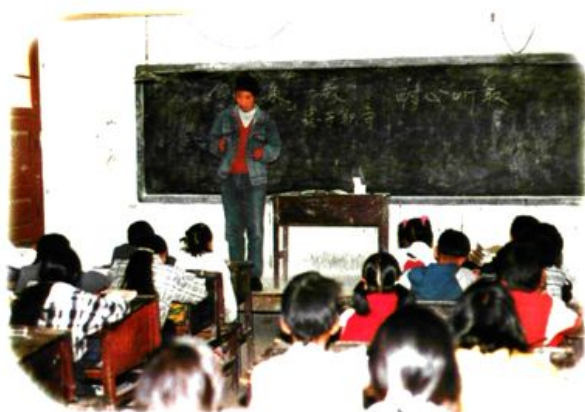
实习学生在实习学校认真讲课。