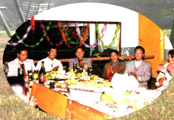
学校领导在中秋节到各班级看望学生， 并同学生一起共度中秋佳节场面。