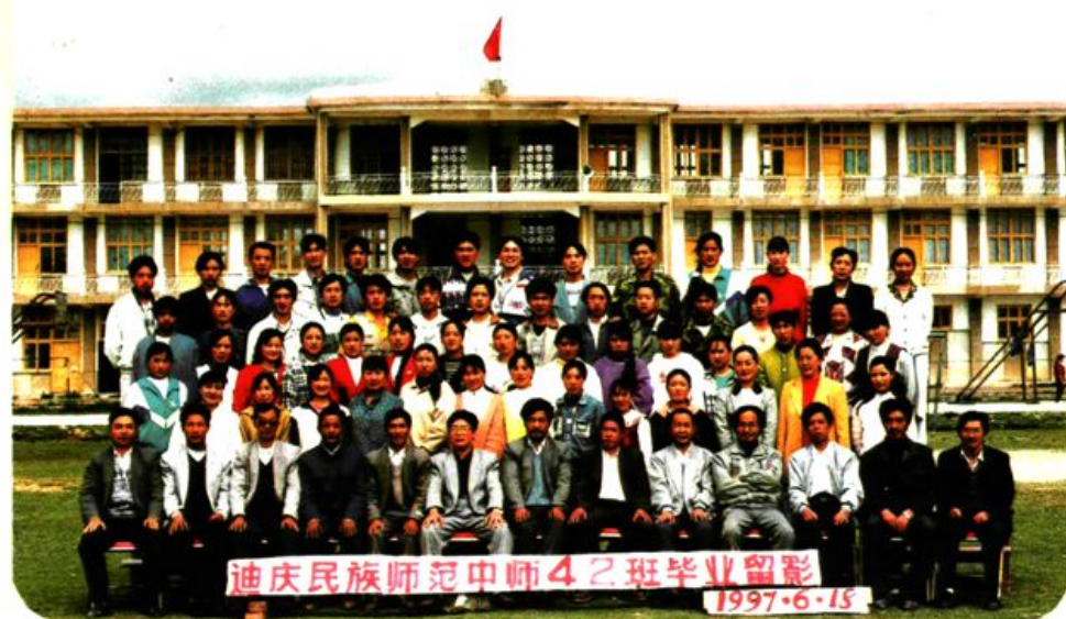
获得省级先进班集体的中师42班同学合影。