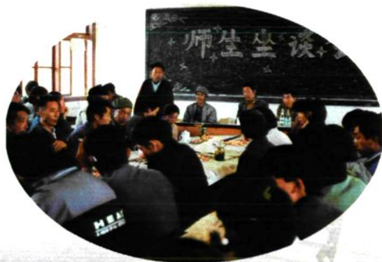
学校领导在实习学校听取意见场面。