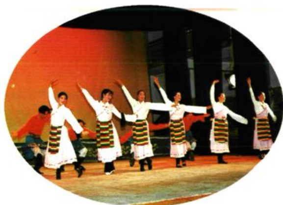
1996年10月4日，迪庆师范学生参加迪庆州第二届中小学生文艺汇演。