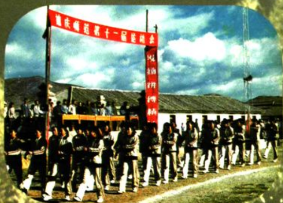
召开学校体育运动会。