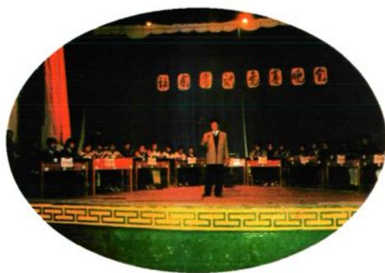
学校举行“社会常识竞赛晚会”。