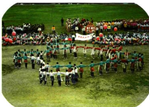
建校二十周年广场文艺表演。