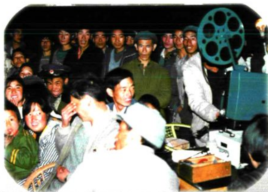
学校电影队到实习点慰问实习生， 并组织电影晚会的场面。