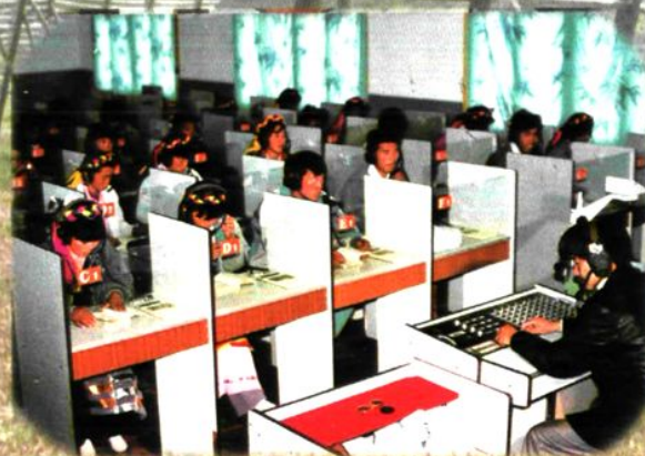
学生在语音教室学习场面。