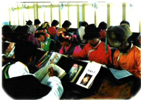
学生在阅览室认真看书场面。