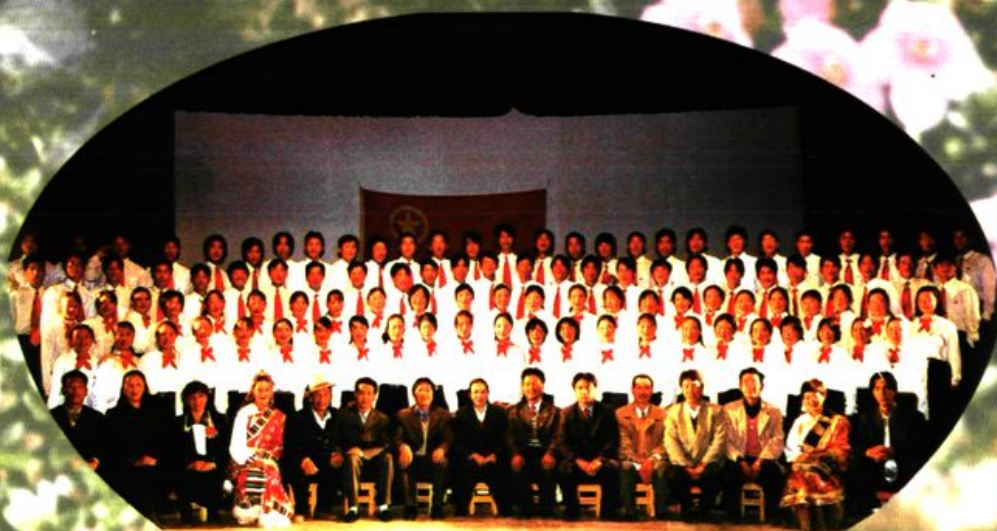
迪庆民族师范学校“校园之声合唱团”全家福。