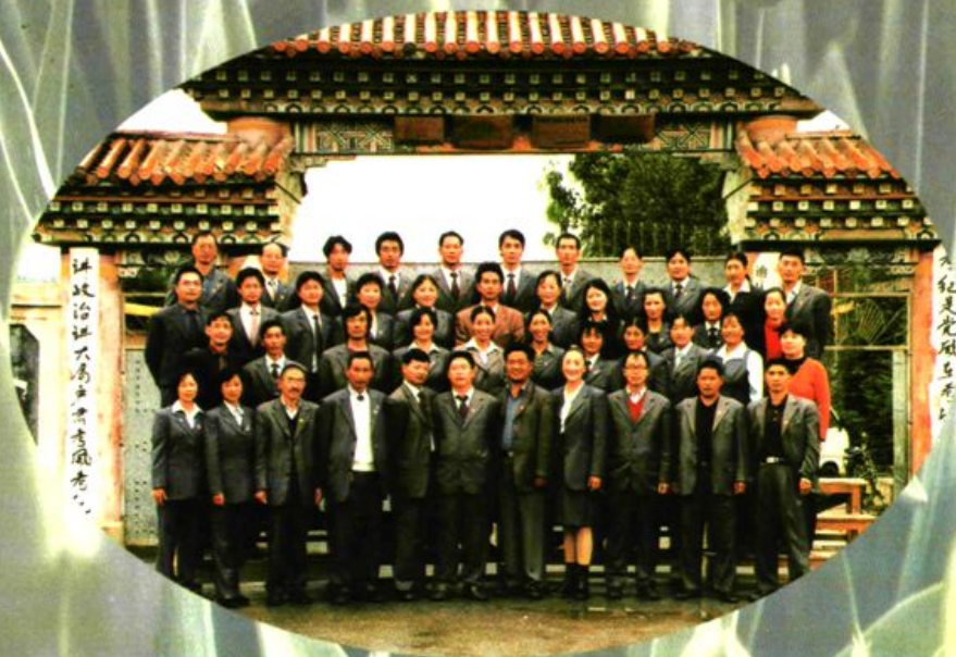
2003年7月迪庆师范撤并前教职工全家福。