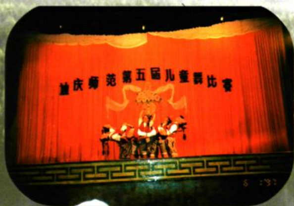
迪庆师范第五届儿童舞比赛。