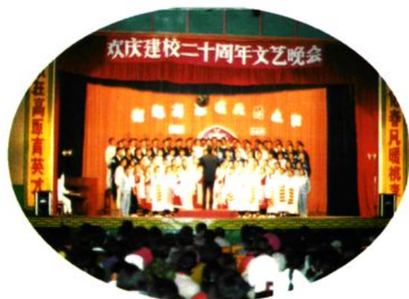
建校二十周年文艺晚会。