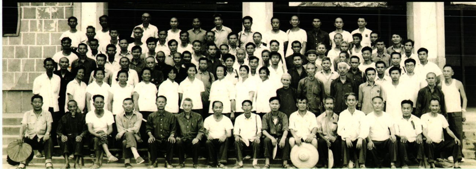
▲ 中国人民政治协商会议榕江县第四届一次会议与会全体委员合影。