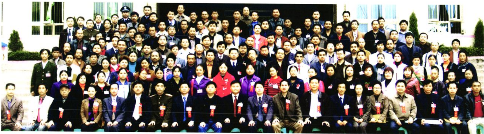
政协榕江县第十一届委员会第一次会议全体委员合影。