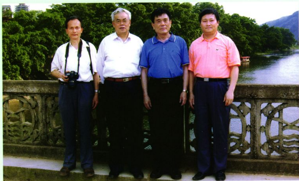
省政协副主席伍席源（左二）、州政协主席邓锦州（左三）赴榕江指导工作。