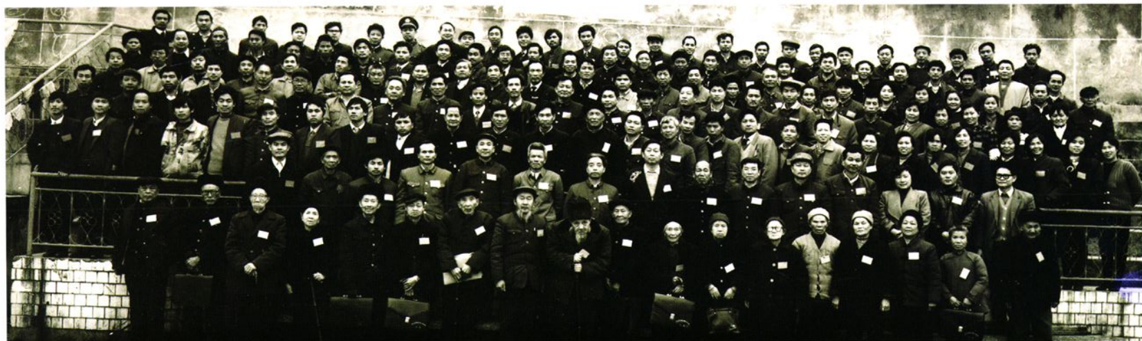
▲ 政协榕江县第八届委员会第一次会议全体委员合影。