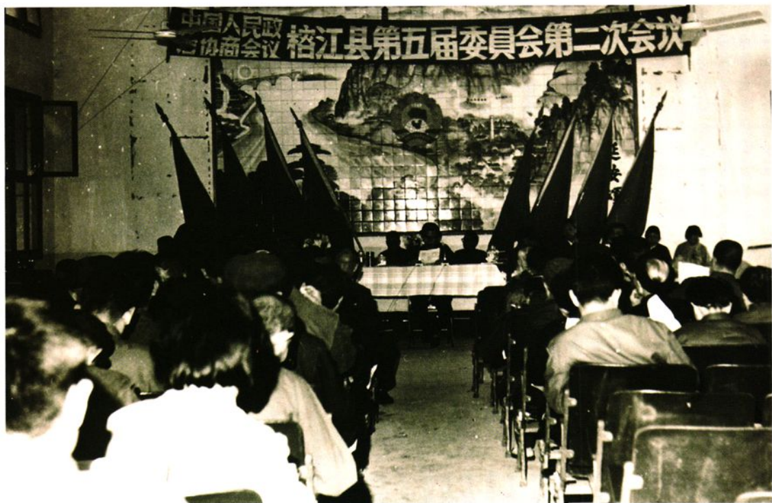
政协榕江县第五届委员会第二次会议会场