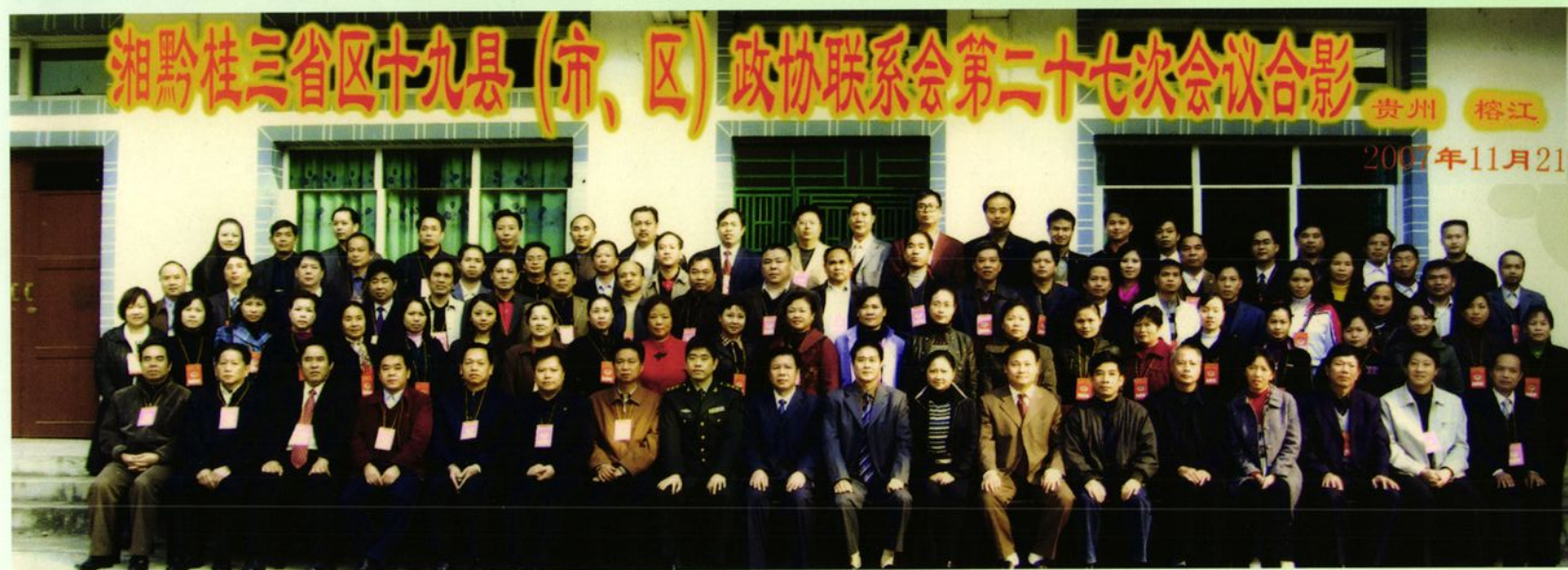
▼ 湘黔桂三省（区）十九县（市）政协工作联系会第二十七次会议全体成员合影。