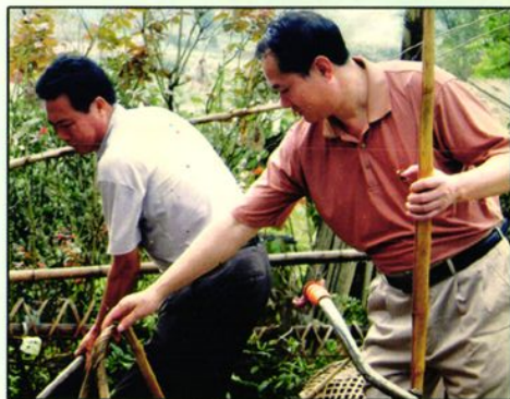
政协干部抢险救灾。