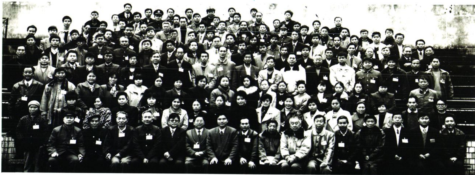
政协榕江县第九届委员会第一次会议全体委员合影。