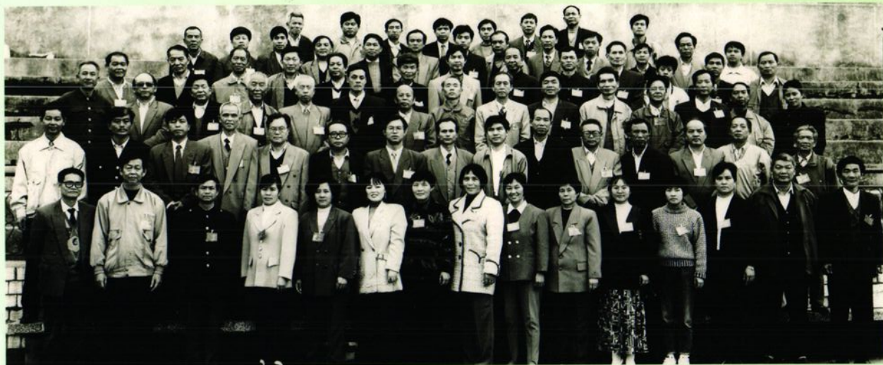
◀ 湘黔桂三省（区）十八县第十五次政协工作联系会全体成员合影。