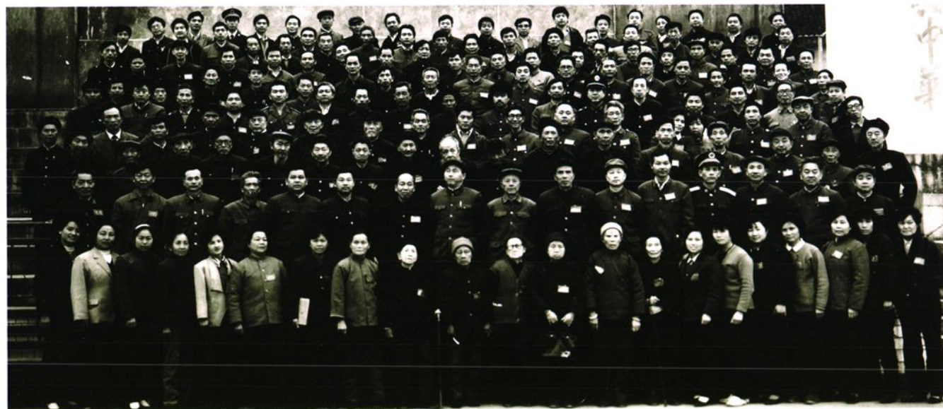
▶ 政协榕江县第七届委员会第二次会议全体委员合影。