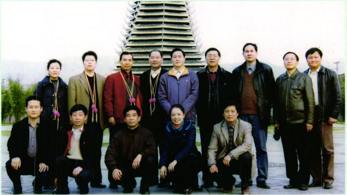
▲ 州政协副主席黄明光（后排左五）等赴榕江指导工作。