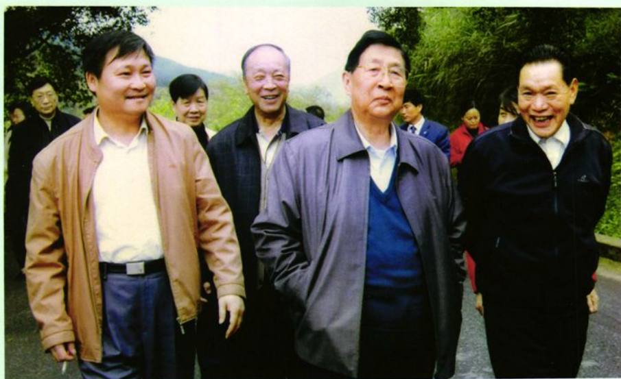
省政协主席龙志毅（前中）在榕江指导工作