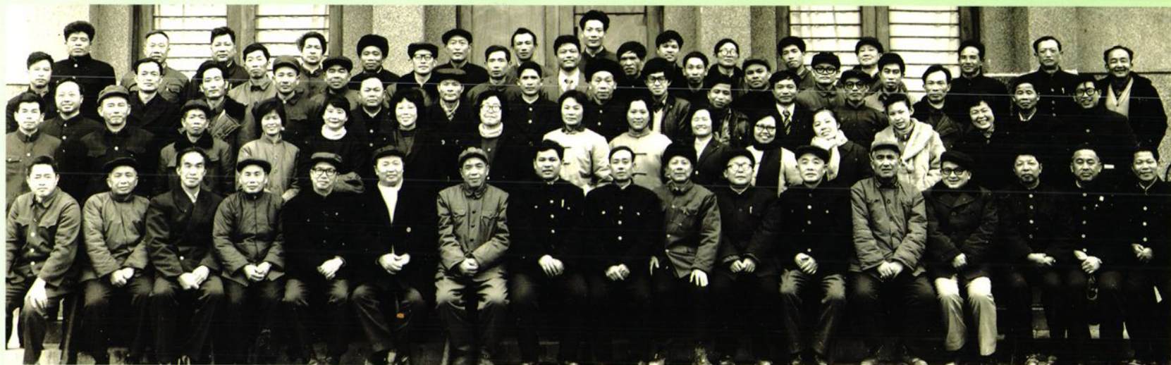
1985年2月27日，榕江县乡友支乡座谈会全体成员合影。