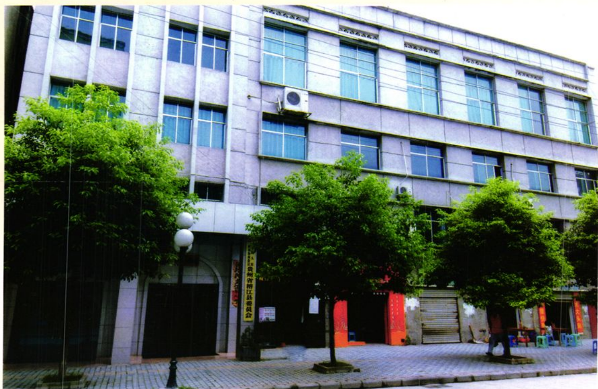
政协榕江县委员会办公楼