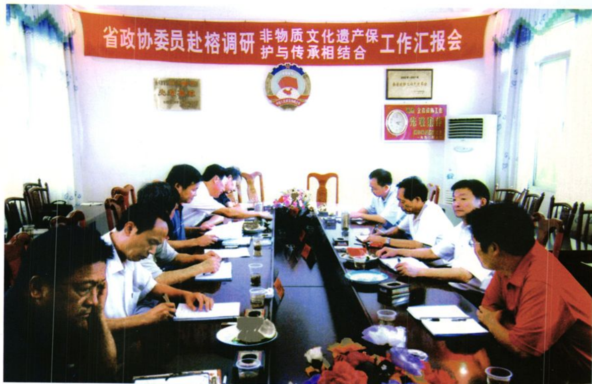
2008 年省政协委员赴榕江调研