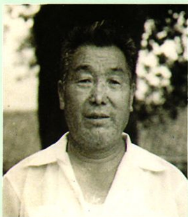
榕江县各族各界人民代表会议 常务委员会主任 李玉怀