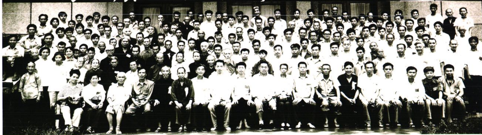
▲ 政协榕江县第六届委员会第一次会议全体委员合影。