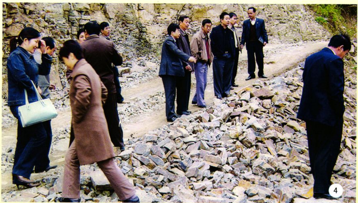
4、驻榕第九届州政协委员考察三军岩水电站。