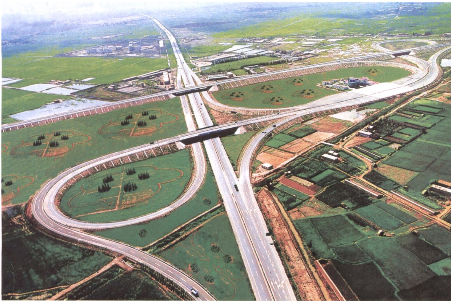
宁夏第一条高速公路——姚叶高速公路于1997年4月28日开工,1999年11月6日银川段55公里通车,2000年6月30日全线通车。图为姚叶高速公路银川立交桥。