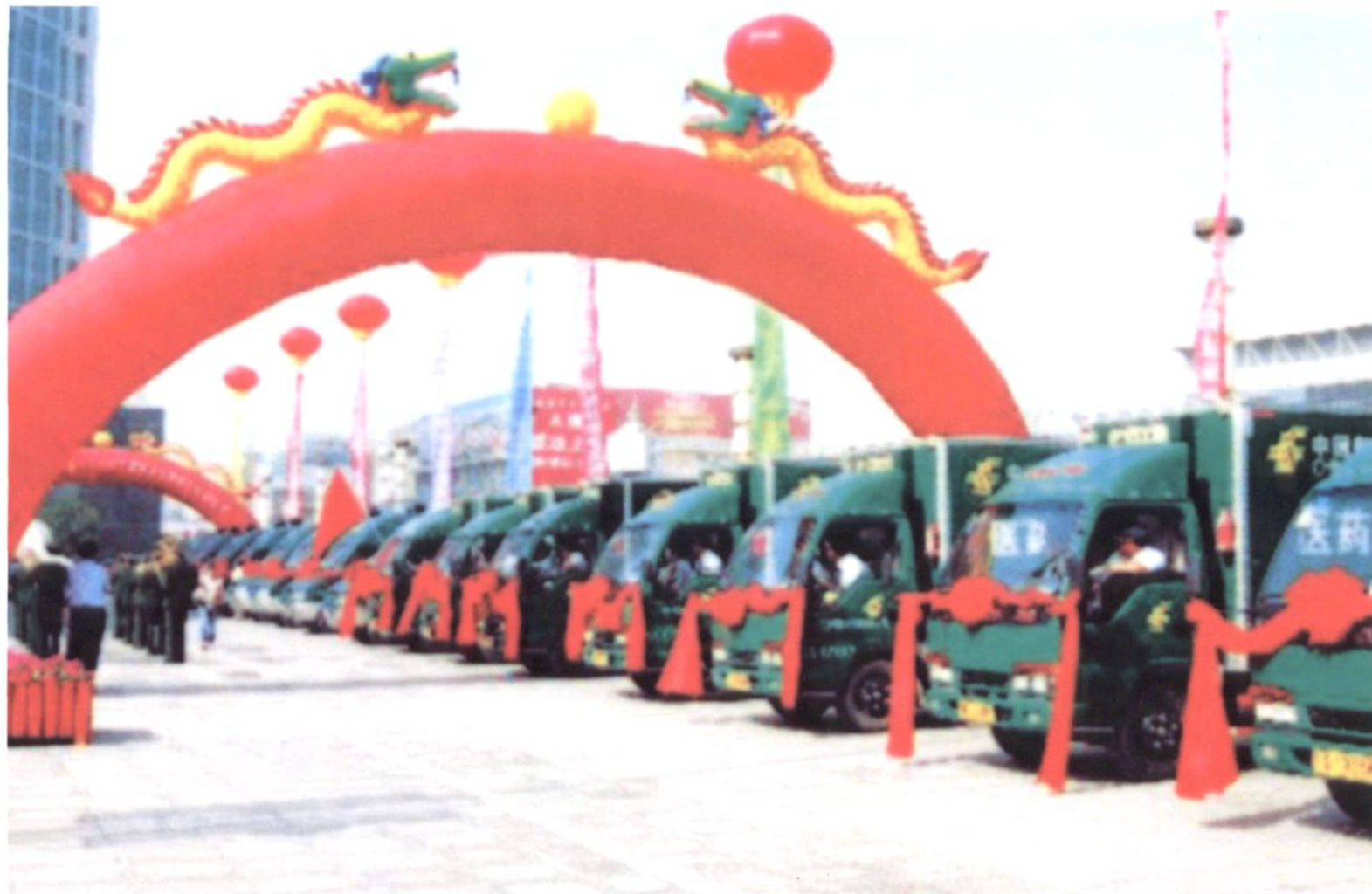
宁夏邮政局服务“三农”的流动车队。