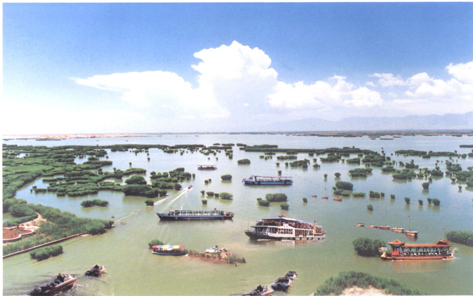
20世纪90年代起,宁夏水路交通以水上旅游运输为主。图为沙湖旅游区的旅游船艇。