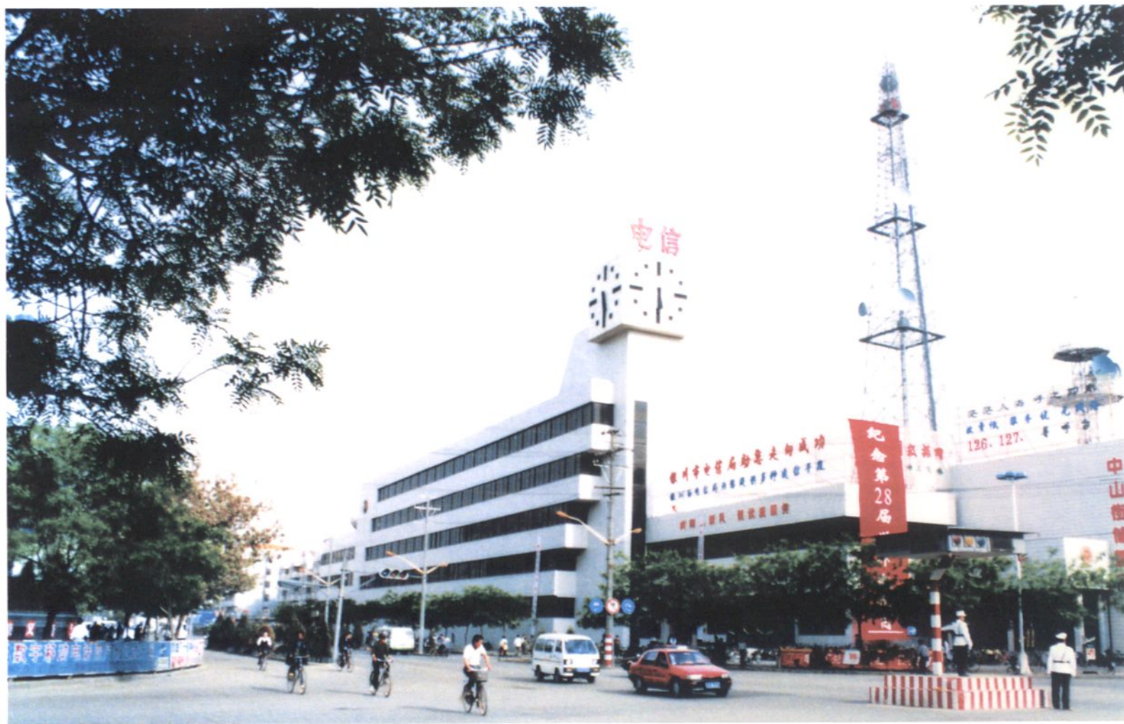
1997年建成的银川长途通信枢纽大楼。