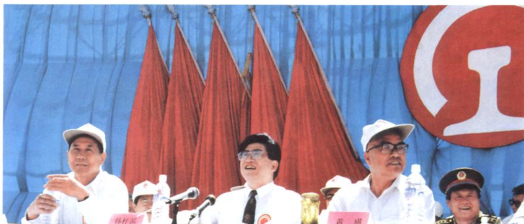
1995年6月8日,铁道部部长韩杼滨(中)、宁夏回族自治区党委书记黄璜(右)、原铁道部部长李森茂(左)在宝中铁路通车庆祝大会上。