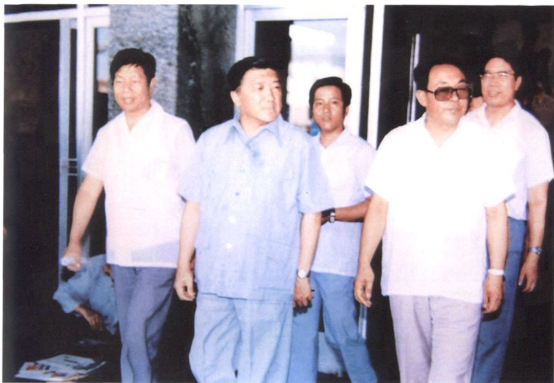
1990年7月23日,交通部部长钱永昌(左二)在宁夏回族自治区副主席任启兴(右二)和交通厅厅长陈敏求(左一)陪同下,视察公路建设。