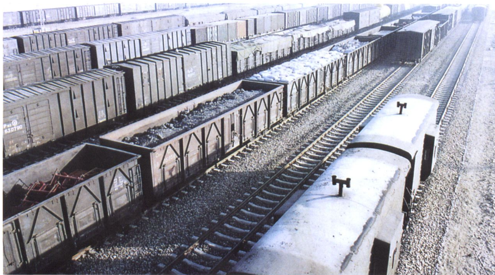
中卫迎水桥铁路编组场的列车编组作业。