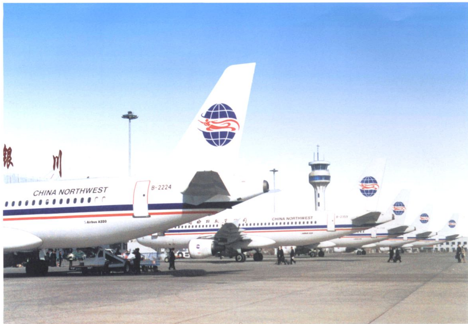
繁忙的银川河东机场。