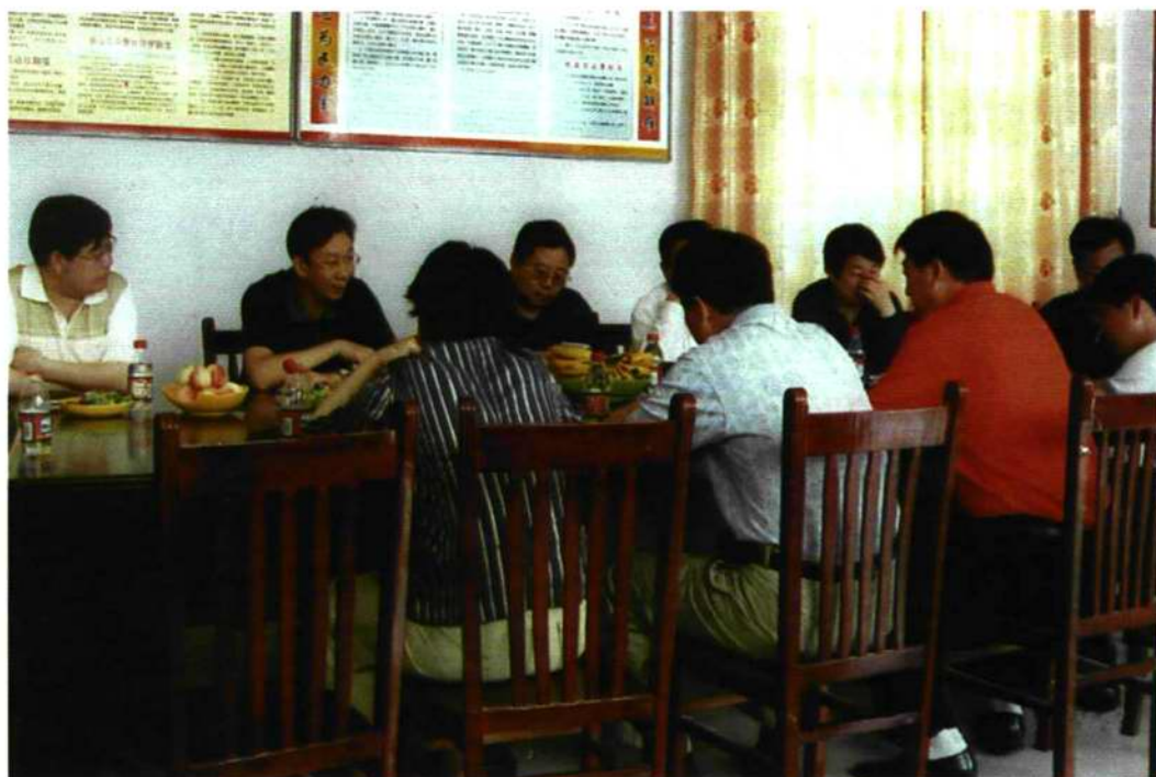
灵宝市市长乔长青（左二）在村部听取汇报