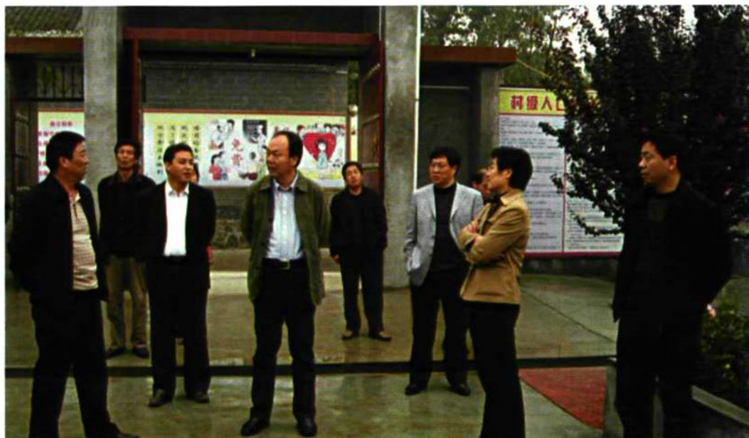
灵宝市市委书记吕均平（前排中）在西水头村视察