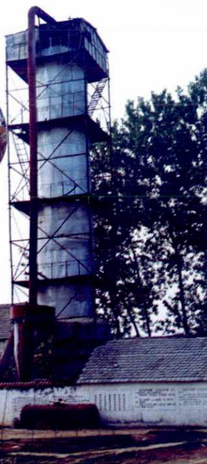
▲ 江苏洁汇洗涤剂厂生产合成塔