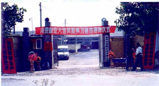
▲ 南林大实验基地——徐州恒阳木业有限公司