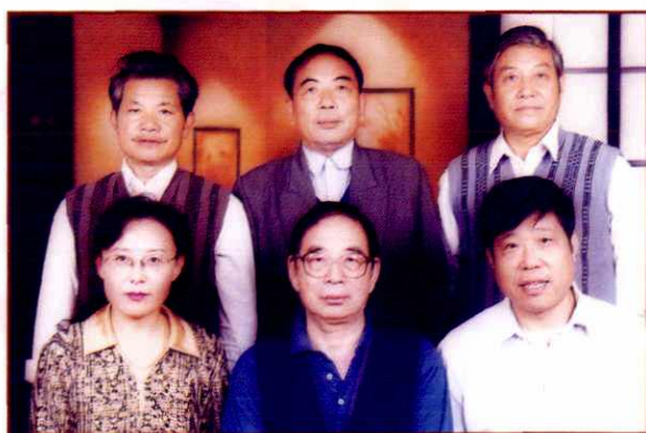
市、县评审镇志人员合影