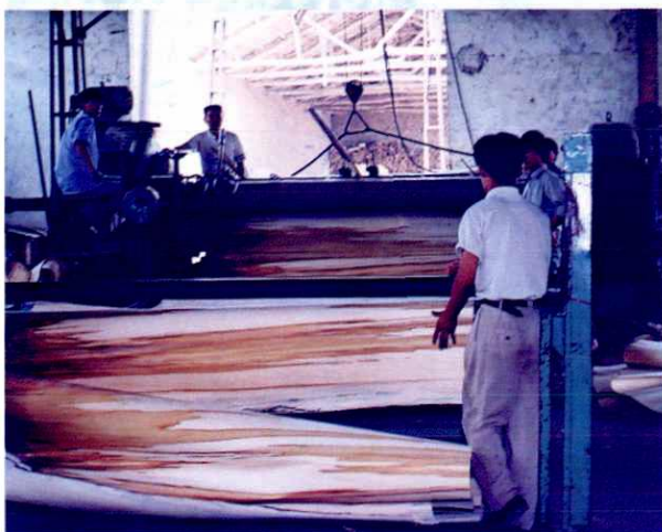
▲ 徐州华阳木业有限公司旋切车间一角