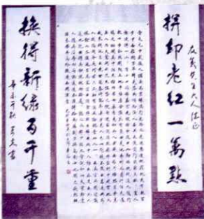
▲ 陈计福 书法