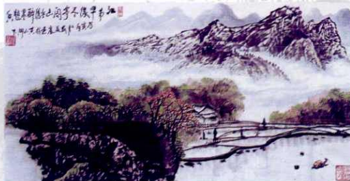
▲ 刘益富 画