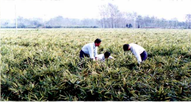
▲ 桃园镇农业示范园——生姜