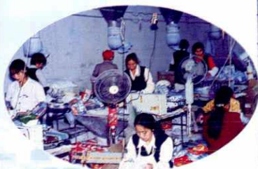
▲ 江苏洁汇洗涤剂生产车间一角