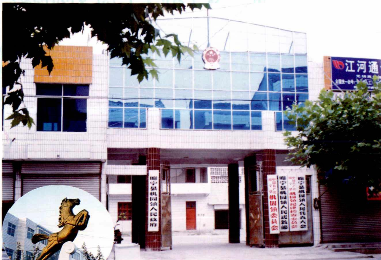
▲ 桃园镇党委、政府、人大驻地