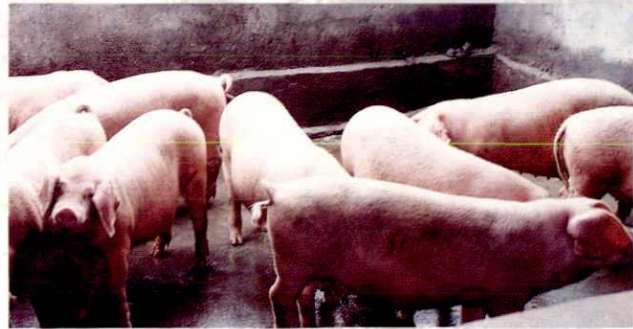
小规模、大群体的养殖业