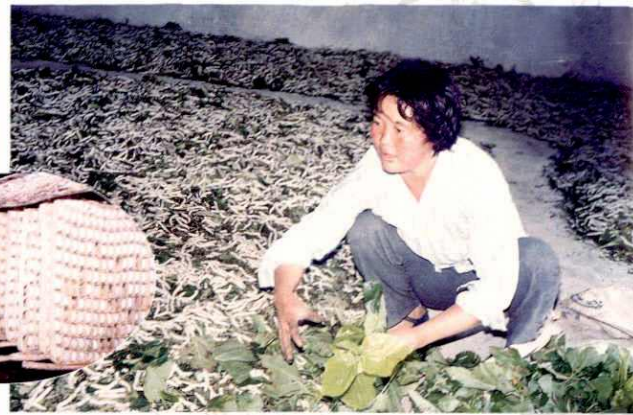
▲ 养 蚕