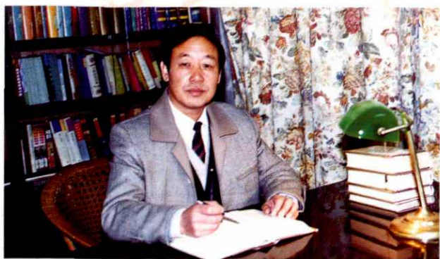
睢宁县人民政府副县长 朱振迎