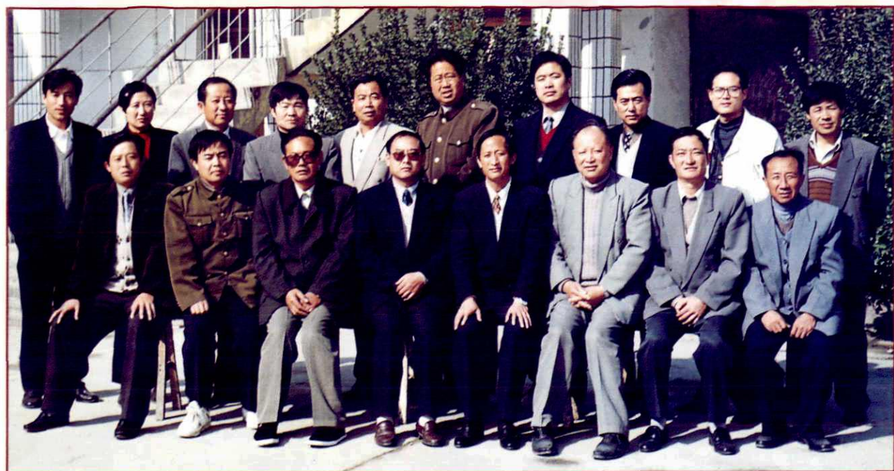
桃园镇三套班子全体成员合影留念(1998. 11)