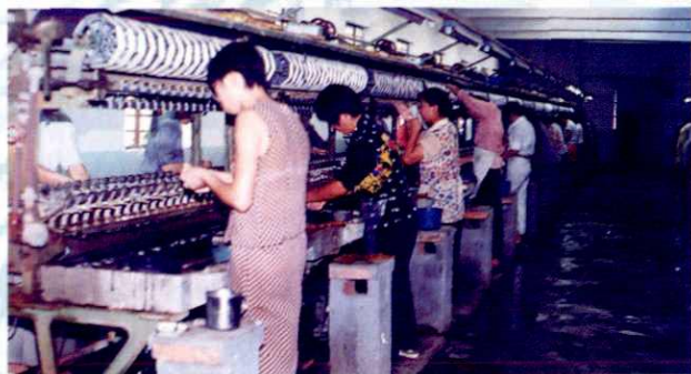
▲ 桃园缫丝厂立缫车间一角