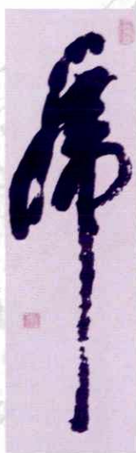
▲ 一笔虎 李言俊 书