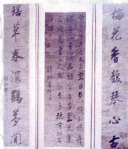
▲ 清·卓振清手迹（张清亚收藏）