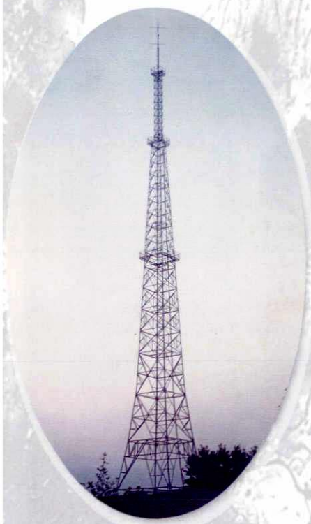
▲ 桃园镇电视接收塔