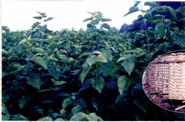
▲ 桃园镇万亩桑园一角