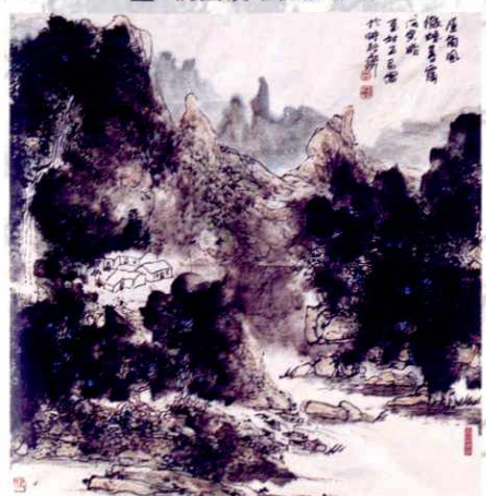
▲ 屋角风微烟暮霭（杜正民 画）