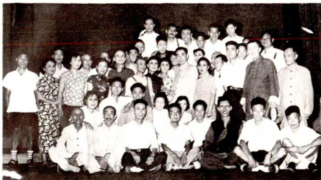
1957年8月24日《三毛学生意》在北京演出后，周总理接见全体演职员。