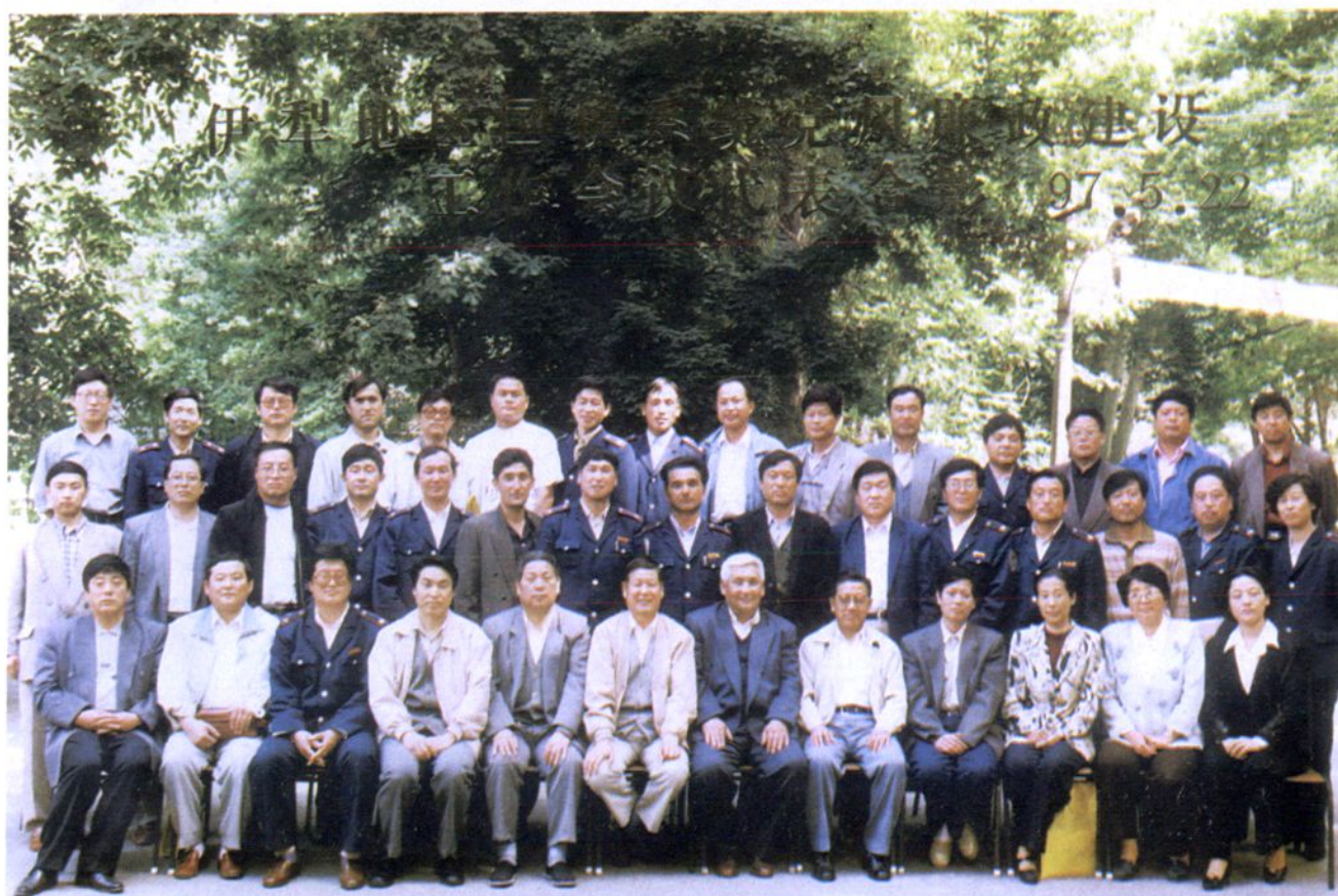
伊犁地区税务工作活动部分照片