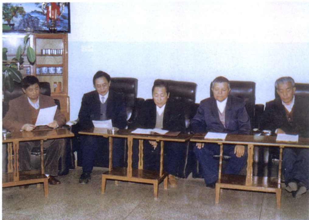
伊犁地区工商税务志审稿会进行情况之三