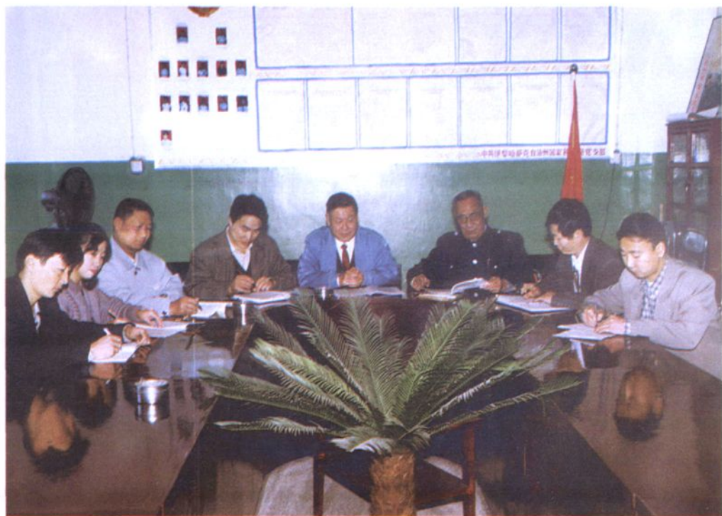
伊犁地区工商税务志审稿会进行情况之一