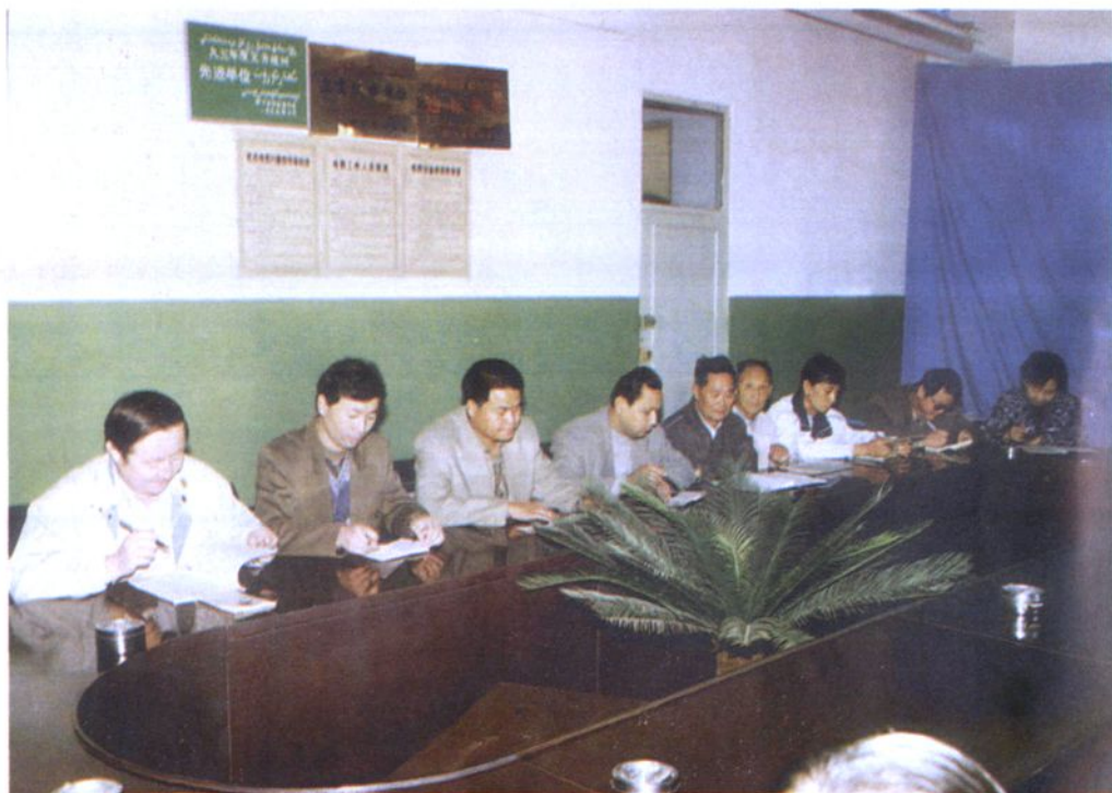
伊犁地区工商税务志审稿会进行情况之二