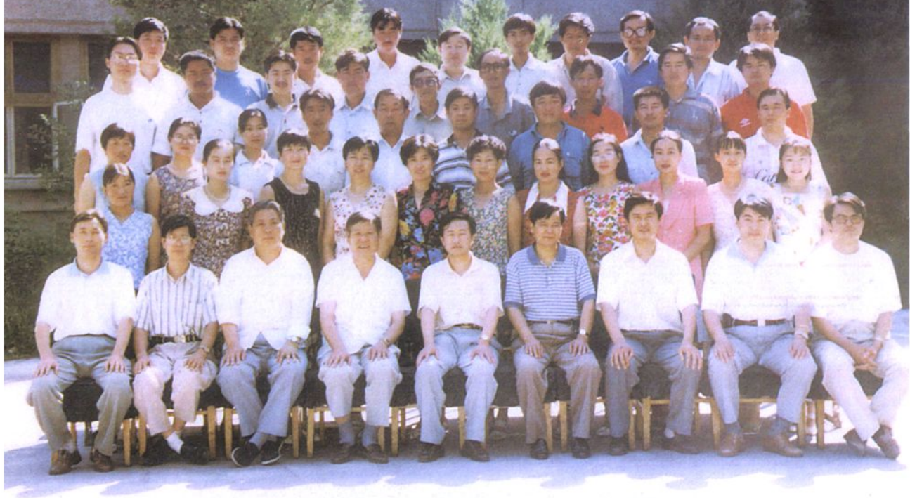
伊犁地区税务局、国家税务总局领导干部