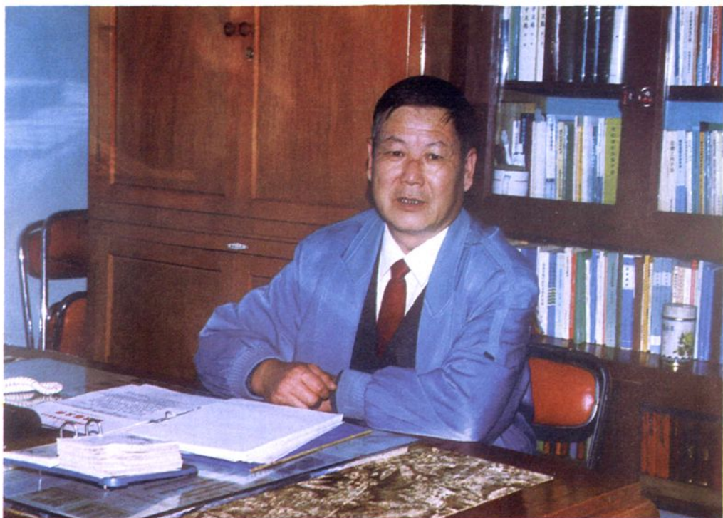
车土辰局长1994年11月至1997年8月任职(1985年11月起任副局长)