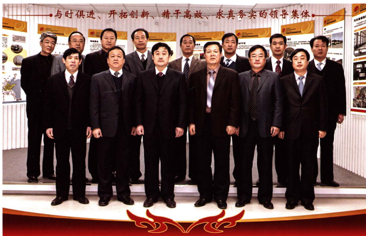
2010年集团公司领导班子全体成员合影