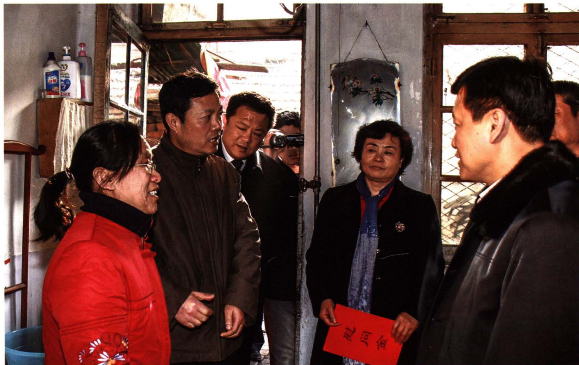
2009年1月7日，滨州市市长张光峰（右一）到集团公司慰问困难职工