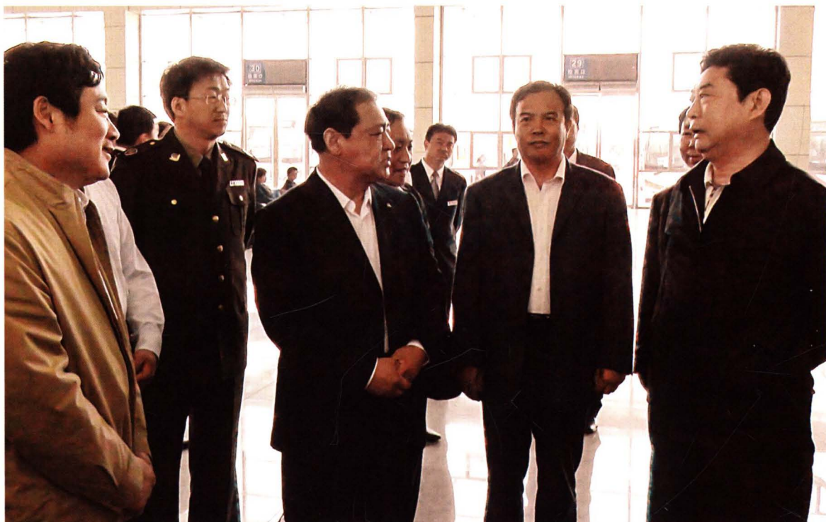
2010年5月3日，中共滨州市委书记、市人大常委会主任邓向阳在市交通运输局局长王立勇的陪同下视察滨州汽车总站