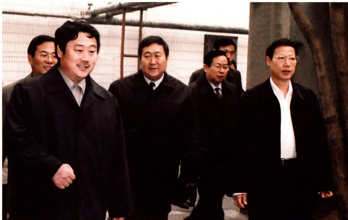
2001年1月1日，中共山东省委书记、省人大常委会主任张高丽（右一）到交运集团视察工作