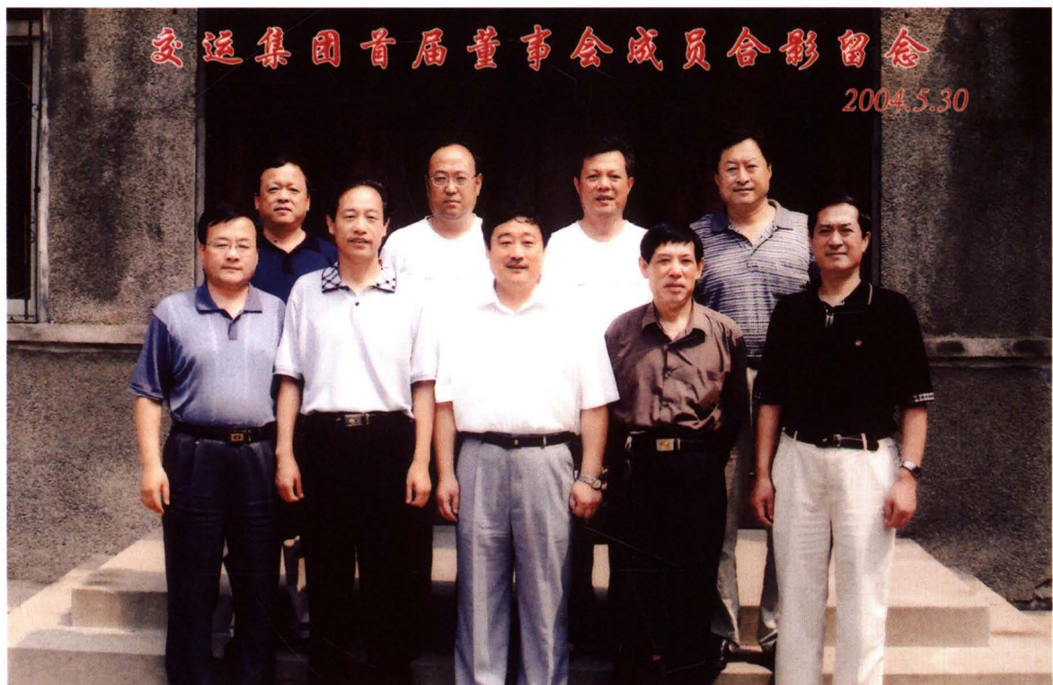
2004年5月，集团公司完成投资主体多元化企业改造。首届董事会成员合影