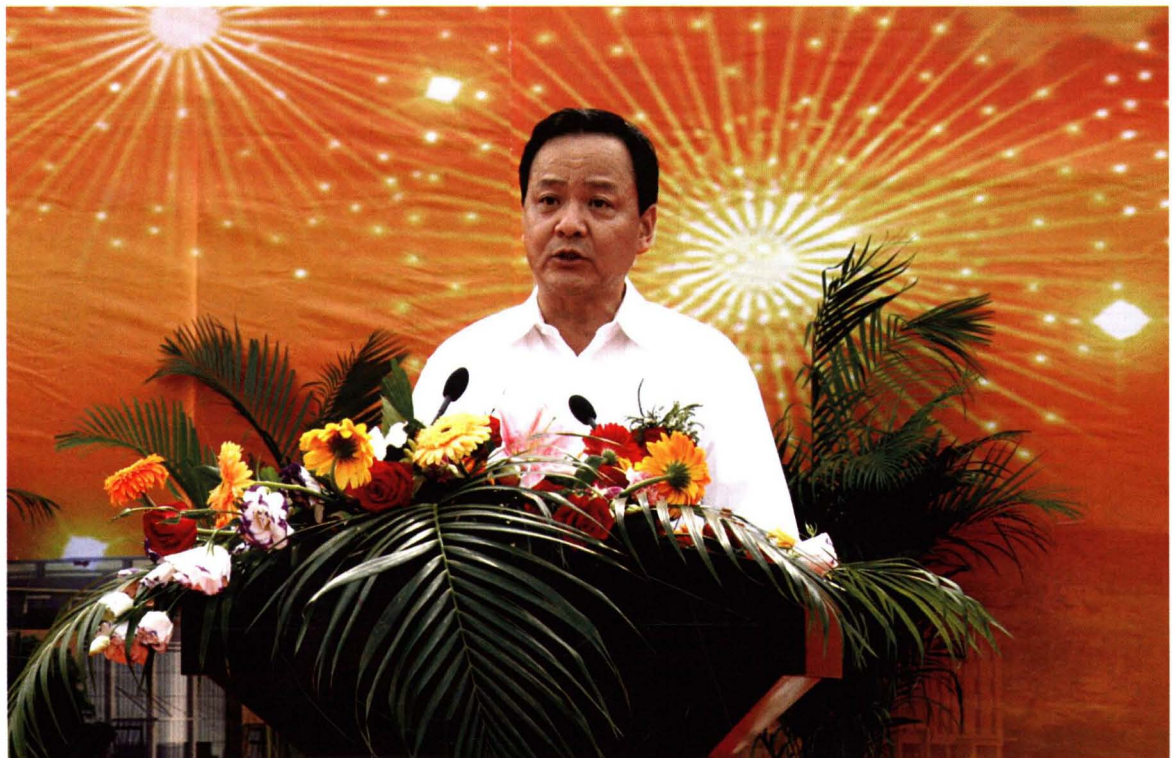
2009年9月28日，山东省交通厅副厅长高洪涛在滨州汽车总站开业典礼上讲话