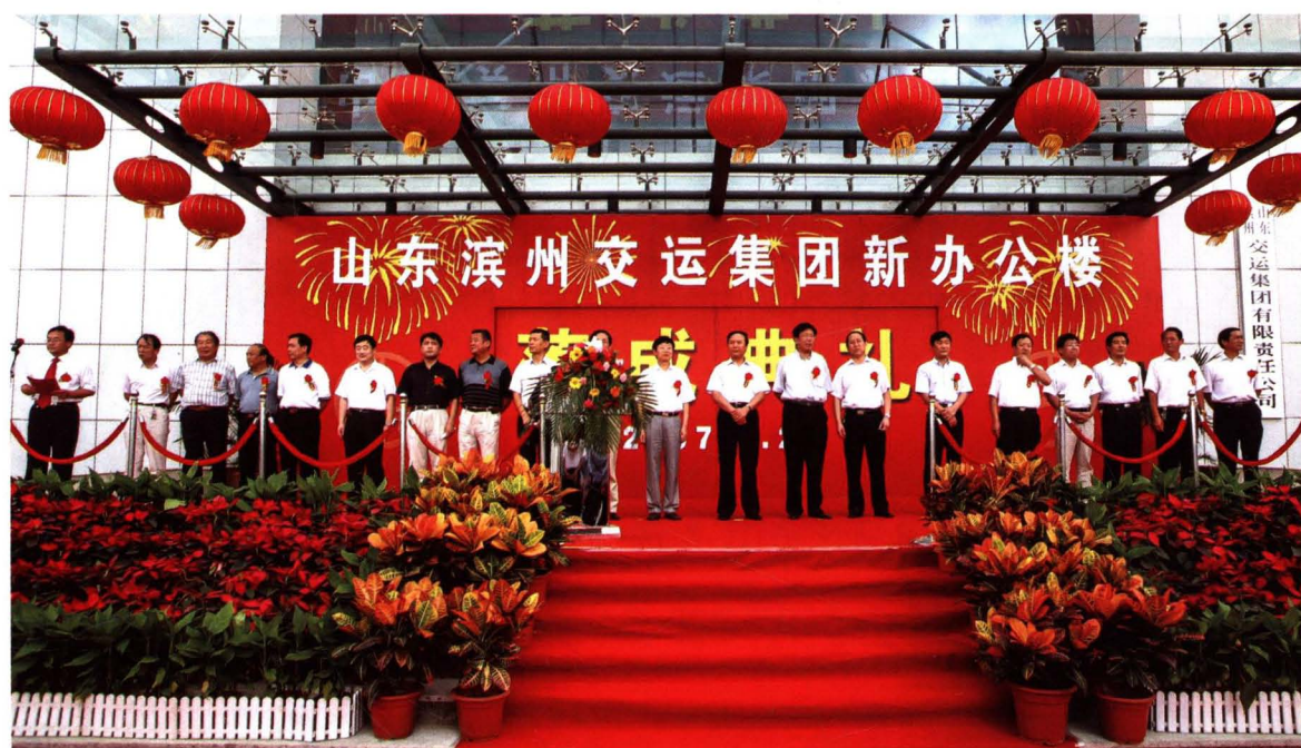
2007年9月23日，集团公司总部办公大楼正式启用