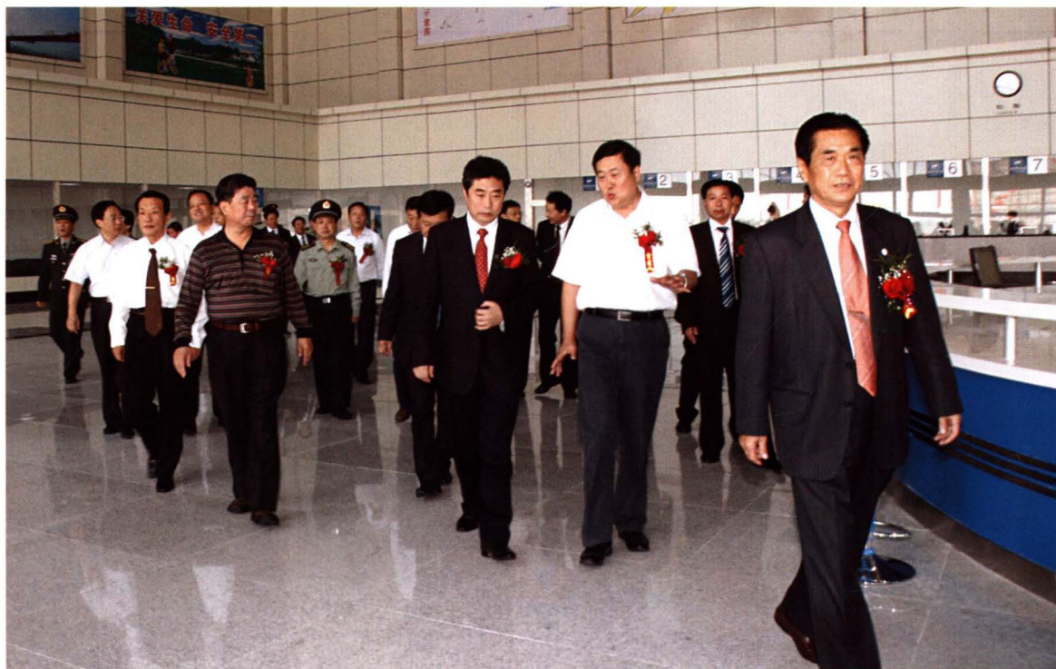
2009年9月28日，原交通部副部长李居昌（右一）参加滨州汽车总站开业庆典