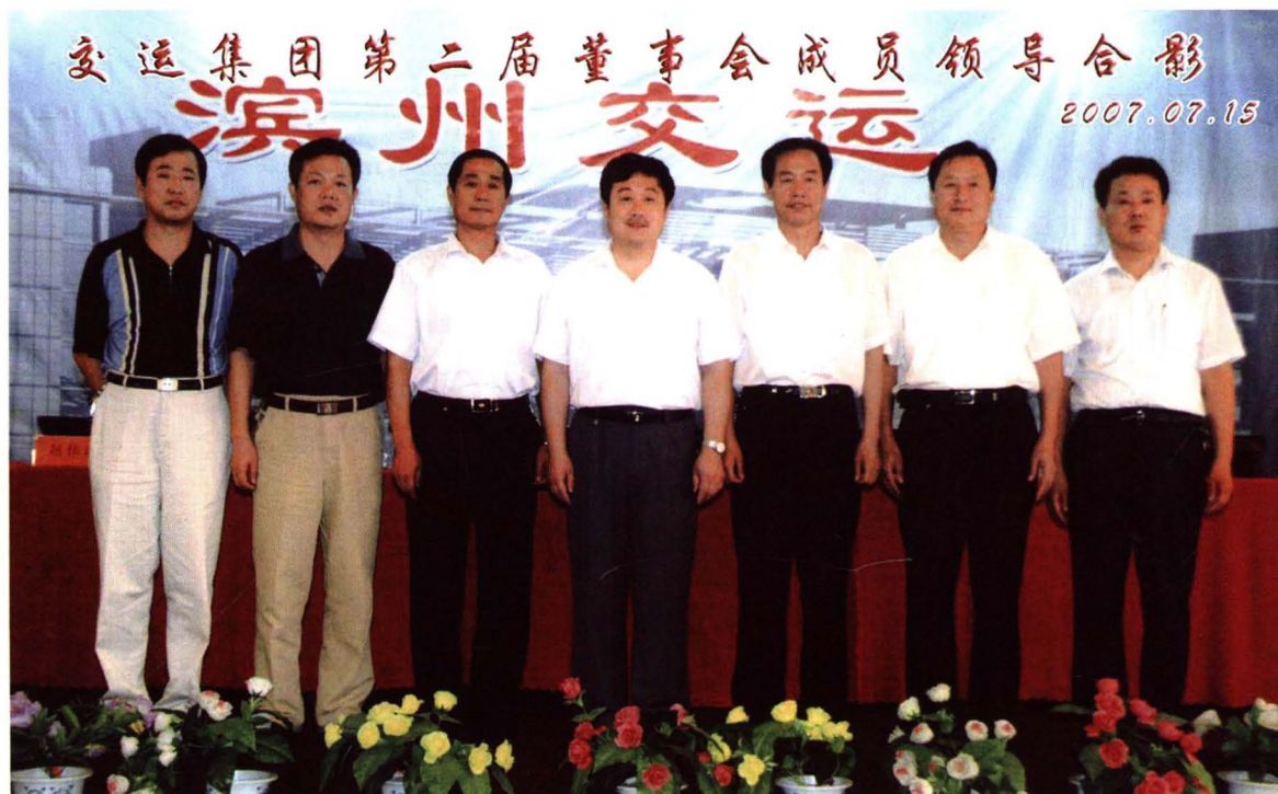
2007年7月，第二届董事会成员合影