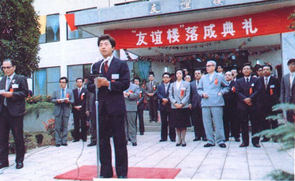
日本首相(前日本国熊本县知事)细川护熙先生在「友谊楼」落成典礼上讲话