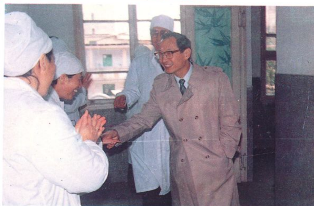
卫生部长陈敏章视察医院