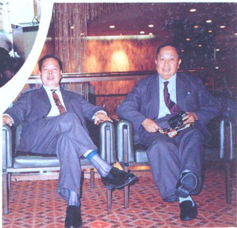
老院长莫福庸(右)与副市长梁继光在日本合影