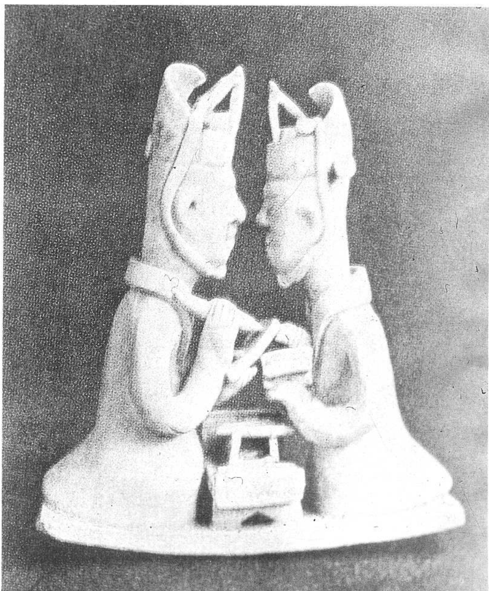
校 雛 桶