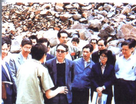
宋健视察二滩水电站建设工地