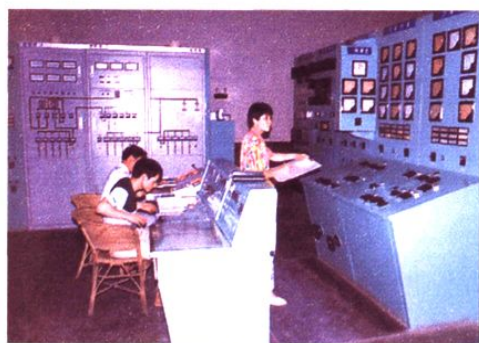
龙溪河梯级之二——上碛水电站控制室