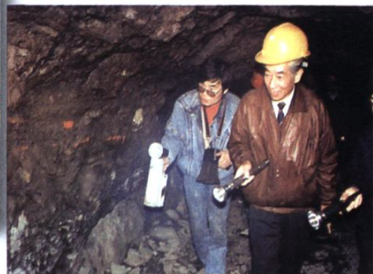
汪恕诚考察溪洛渡水电站勘探工程(1995.4)