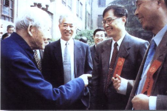
张光斗院士会见成都院领导