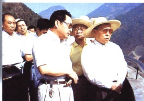
杨汝岱视察二滩水电站建设工地