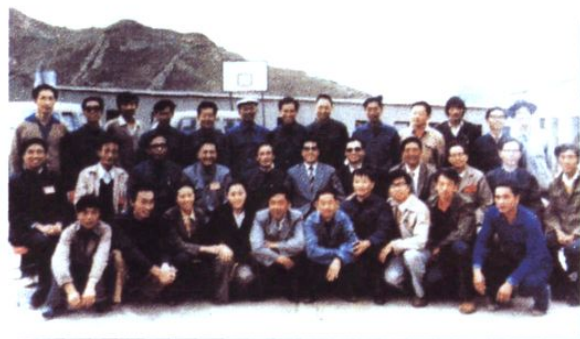
王兆国、吴邦国、罗干、帕巴拉格列朗杰等看望成都院在羊湖工地勘测人员(1985.9)