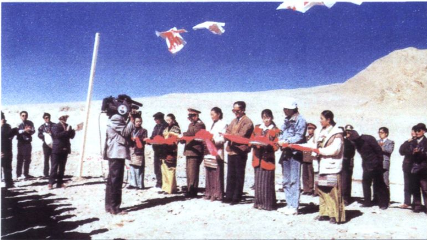
阿里地委书记孔繁森（中剪彩者）为成都院狮泉河电站现场勘测开工剪彩(1994.5)