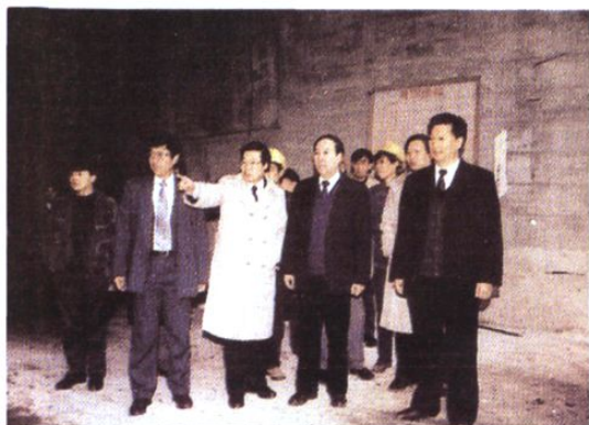
司马义·艾买提视察太平驿水电站