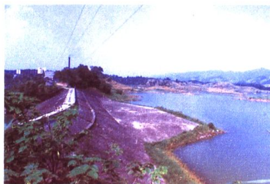
大洪河(跳鱼坑)水电站，左：土石坝，右：发电厂房