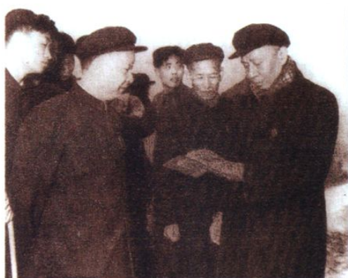
刘少奇视察四川水利资源(1958.3)