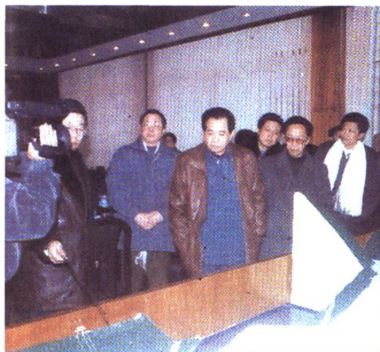
谢世杰视察太平驿水电站