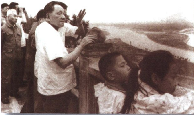
邓小平视察四川江河治理(1980.7.8)