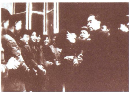
周恩来视察狮子滩水电站(1958.3.5)