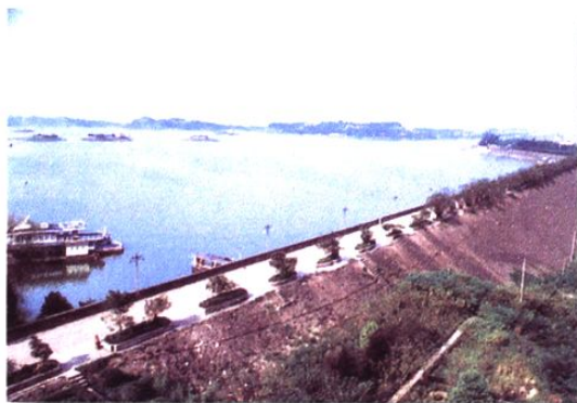
龙溪河梯级之龙头——狮子滩水电站，左：发电厂房，右：堆石坝与水库