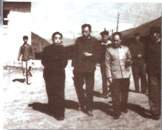
刘澜波(时任水电部部长)视察攀枝花(1965.9)