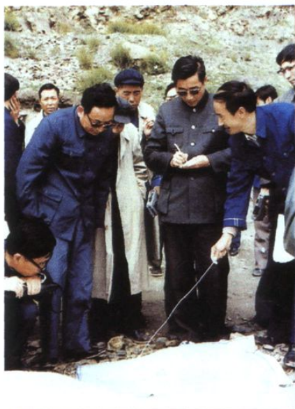
胡启立、田纪云视察西藏羊湖电站工地(1984.8)