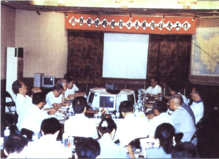
中国科学院、中国工程院两院院士 来成都院检查指导工作(1995.9.8)