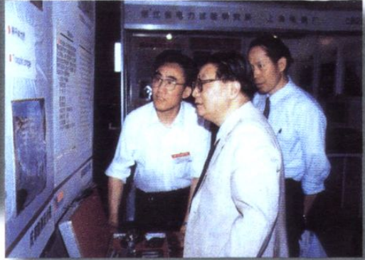
潘家铮院士参观成都院科技成果(1993.5)