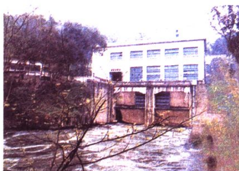
龙溪河梯级之三——回龙寨水电站发电厂房