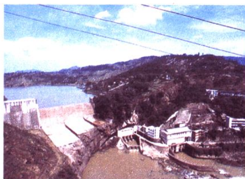
龙溪河梯级之四——下碛水电站拦河坝及发电厂房