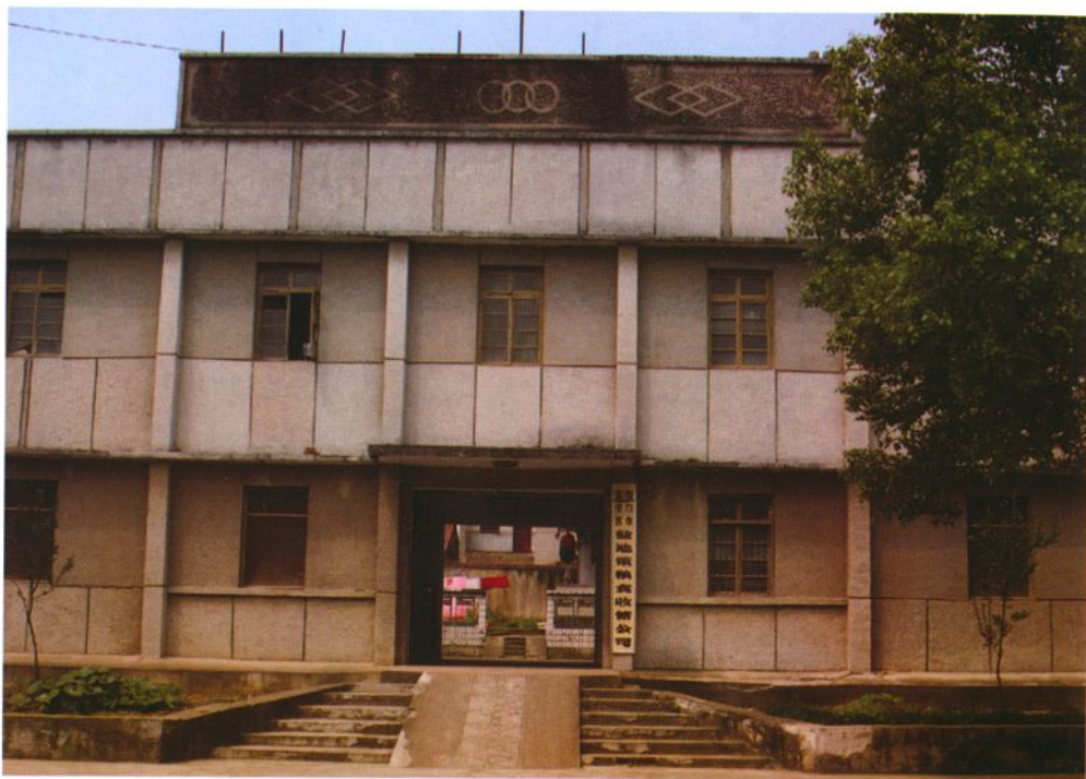
东宝区盐池粮食收储公司办公楼