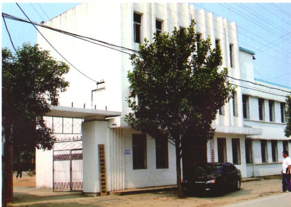
东宝区仙居粮食收储公司办公楼