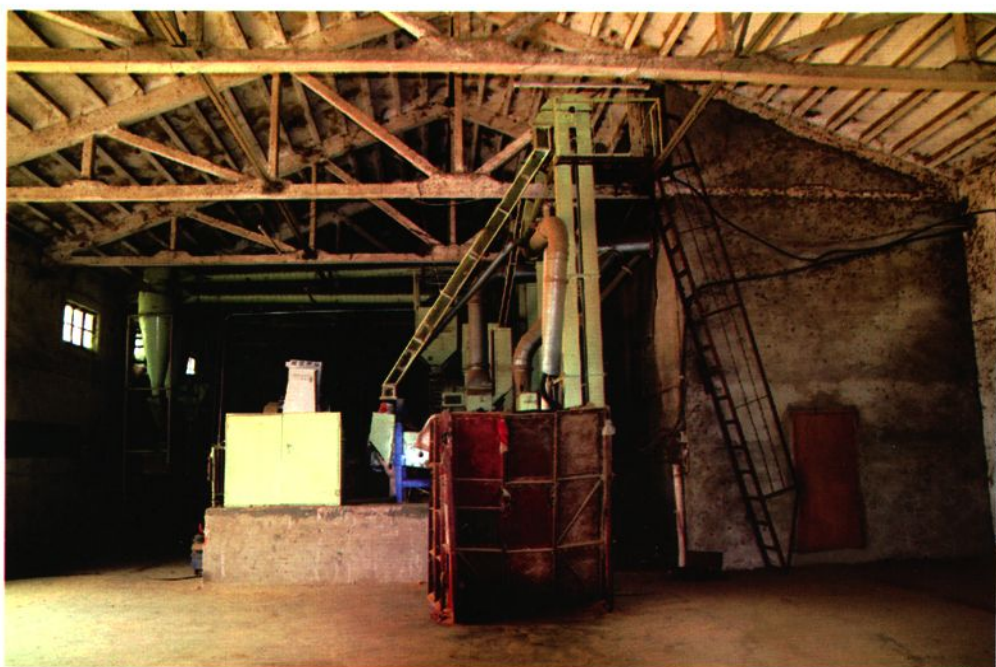
荆门市金奕米业有限责任公司厂区一角