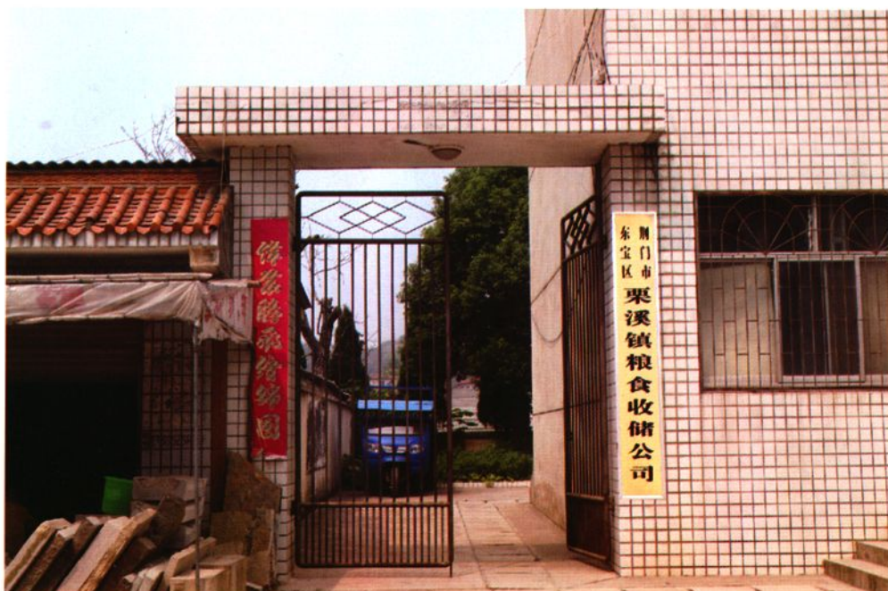
东宝区栗溪镇粮食收储公司办公楼