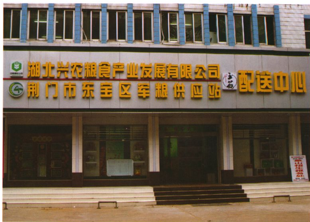
荆门市东宝区军粮供应站