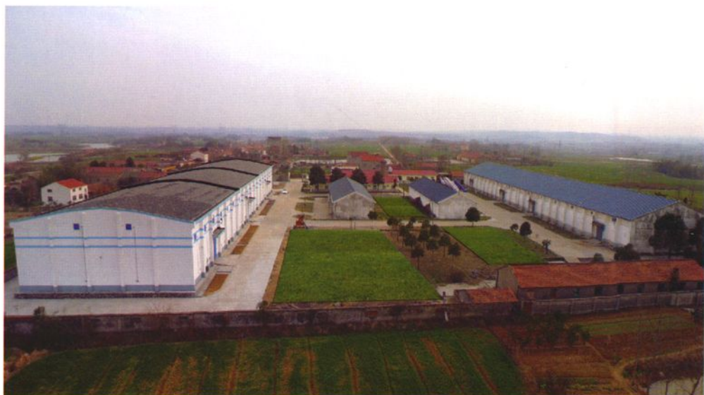
荆门市东宝区革集粮食储备库鸟瞰图