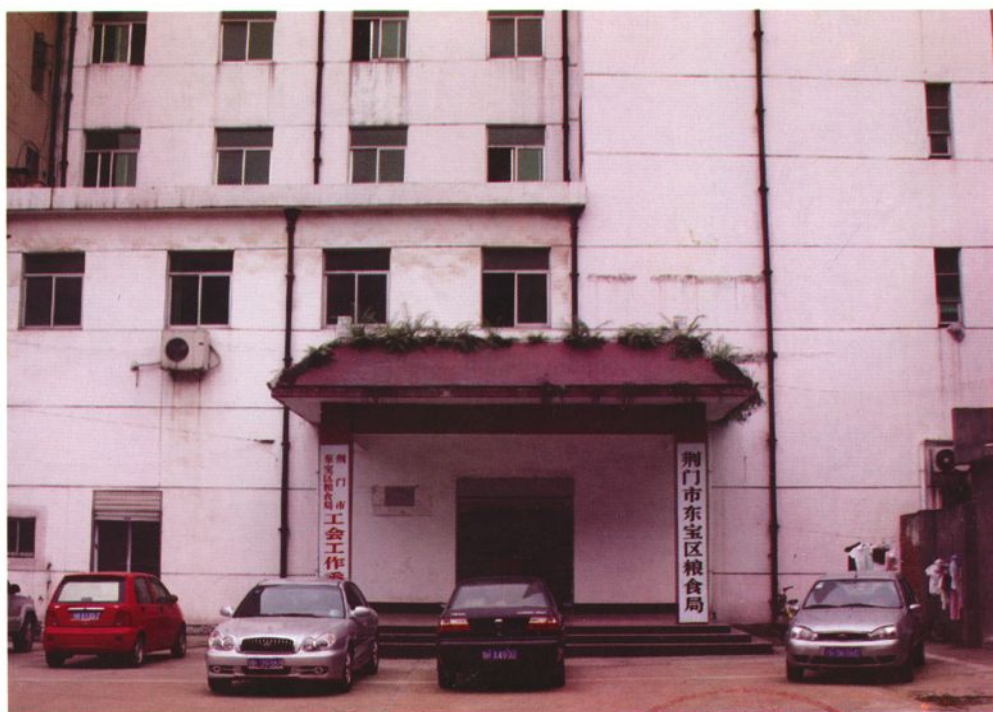
东宝区粮食局办公楼