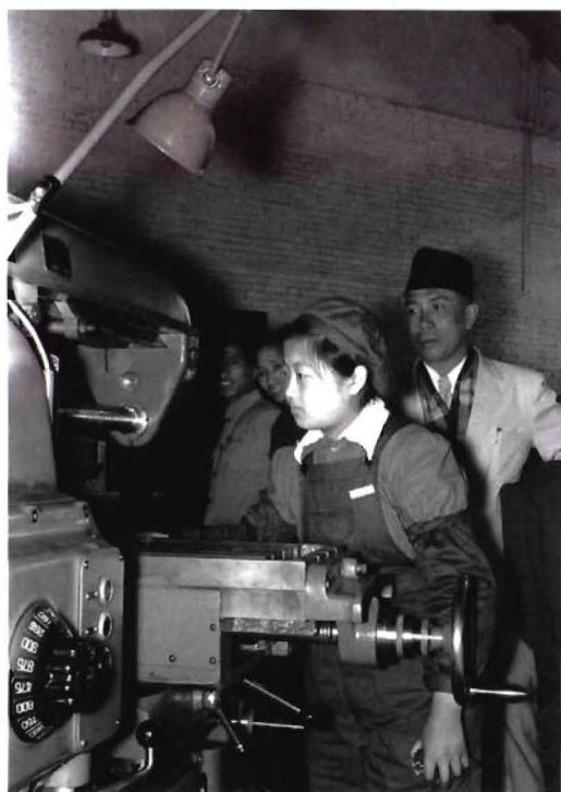
苏联专家到实习工厂指导学员实习