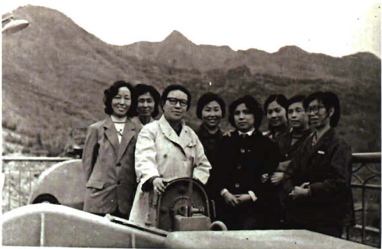
财贸系教师在平谷考察