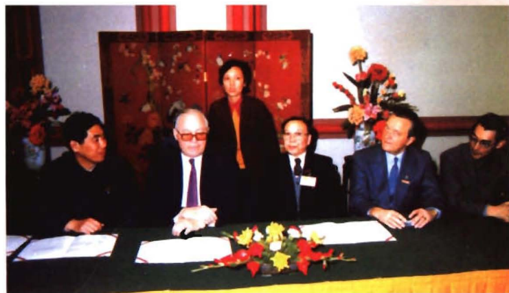
学院同法国友好院校签订校际交流 协议