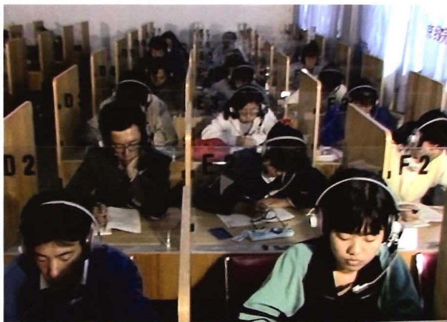
1993年，学生在上英语听力课