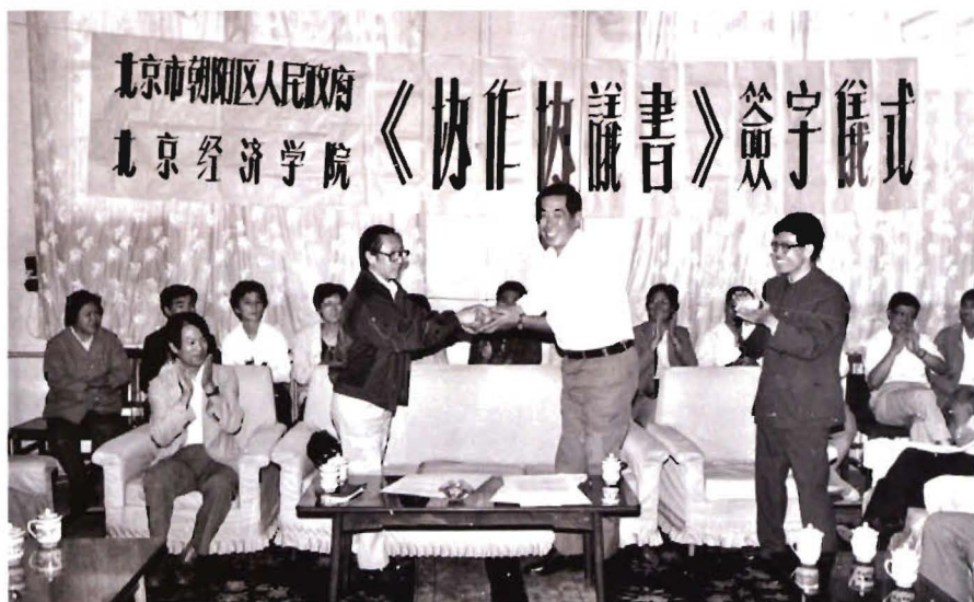
1988年9月，北京市朝阳区人民政府与北京经济学院签订《协作协议书》