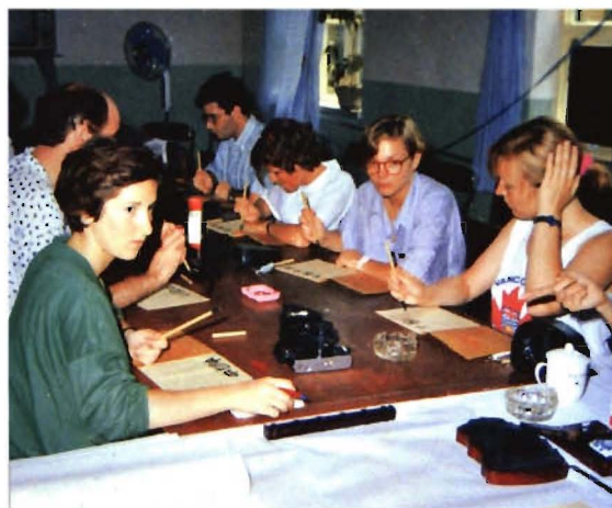
留学生在上书法课