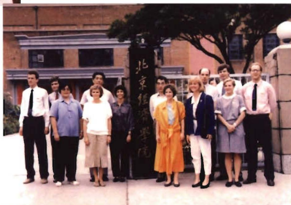
美国教育访华协会代表团 与校领导合影