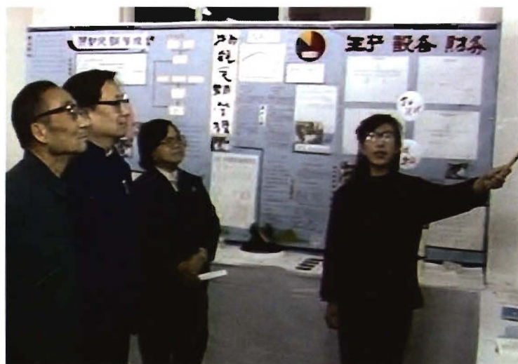
国家教委副主任彭珏云等上级领导来院参观工业经济系社会实践展览