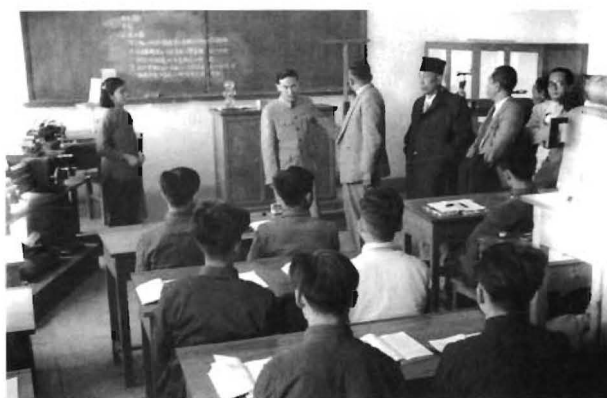
苏联专家到教室检查教学情况