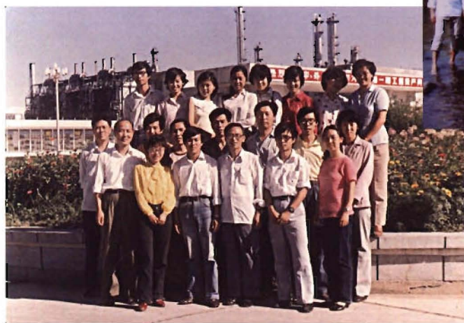
1986年，经济数学系承接大庆项目。 图为项目组成员合影