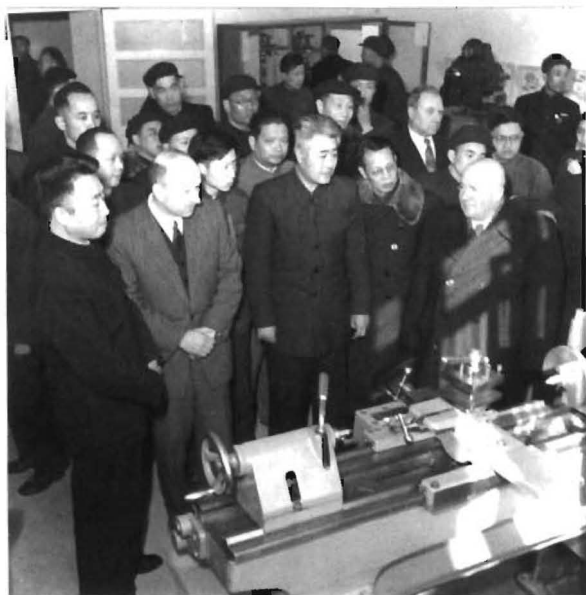
1958年，劳动部部长马文瑞（中）陪同苏联专家考察技校工作