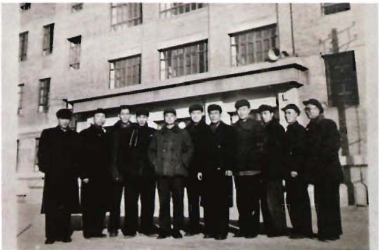
1956年，学校首批劳动保护教研室教师合影