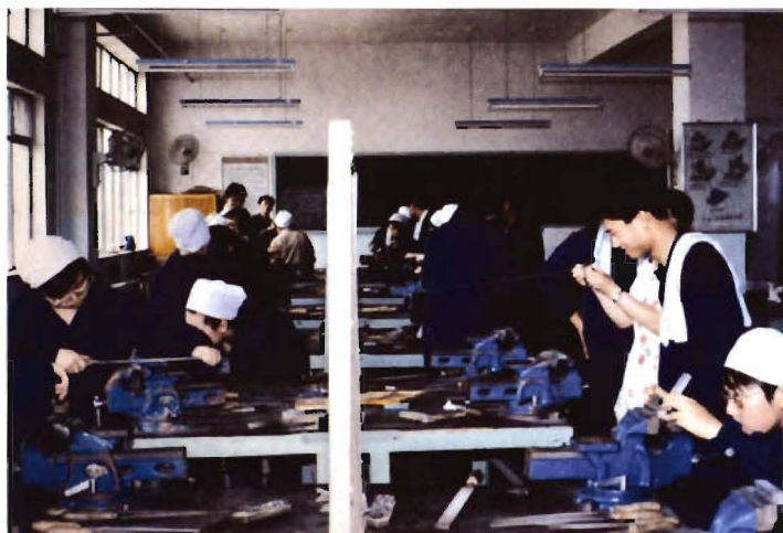
安全工程系学生在工厂劳动