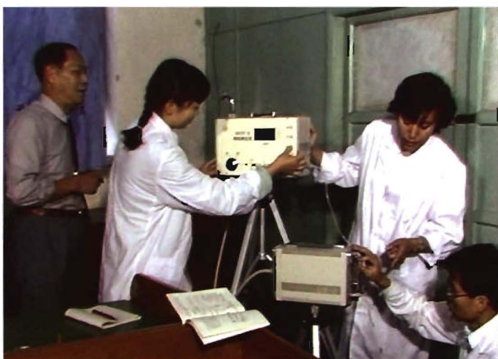
安全工程系教师指导学生上实验课