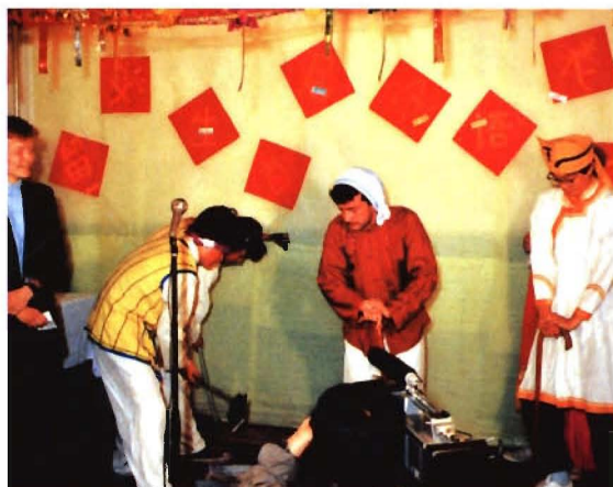
留学生在首届汉语表演赛上表演