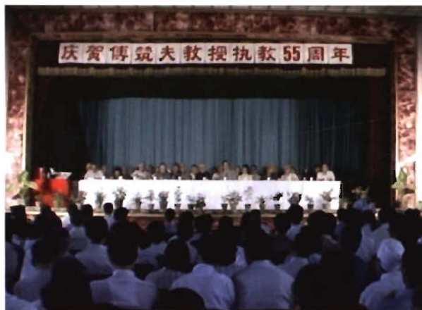
1984年6月，学院举行庆贺我国著名经济史学家傅筑夫教授执教55周年大会