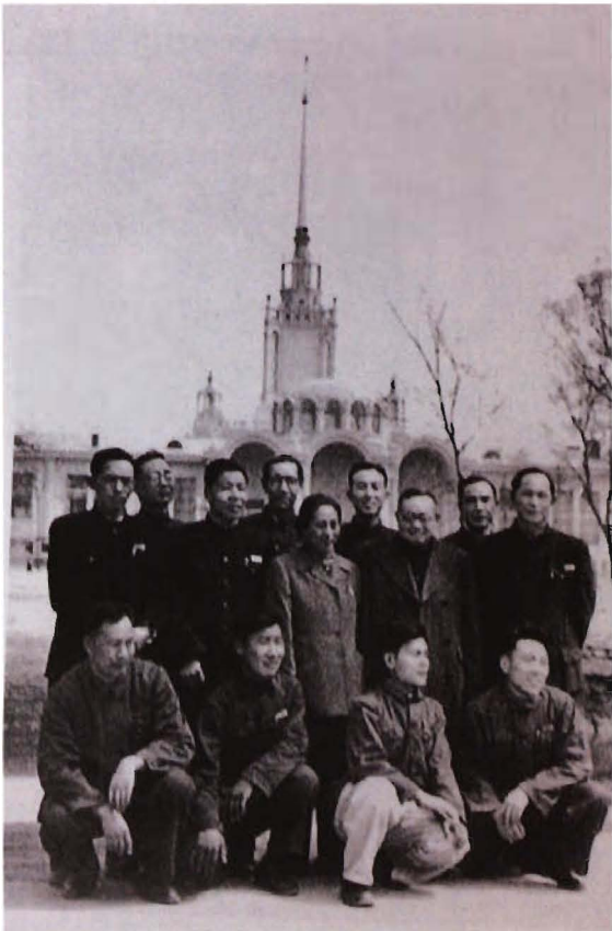
1955年，学校部分教师合影