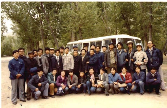
经济系1981级学生在西藏 制定“七五”计划课题组